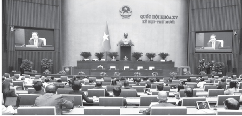
Toàn cảnh phiên họp.

Vì vậy, quyết định của Quốc hội tại Kỳ họp cuối cùng khóa XV là hết sức quan trọng. Theo đó, căn cứ ý kiến của cấp có thẩm quyền, đề nghị của Chính phủ, Ủy ban Kinh tế và Tài chính, Ủy ban Pháp luật và Tư pháp của Quốc hội và tình hình chuẩn bị thực tế; quyết định quy định khoản 5 Điều 6 của Nội quy kỳ họp Quốc hội, Ủy ban Thường vụ Quốc hội đề nghị Quốc hội cho phép sửa đổi, bổ sung Chương trình Kỳ họp thứ 10,