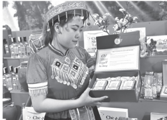
Sản phẩm chè Shan tuyết Na Hang.

Tuyên Quang sau sáp nhập trở thành một tỉnh miền núi có quy mô rộng lớn, địa hình phân tầng rõ rệt và tỷ lệ người dân sống bằng nông nghiệp chiếm đa số. Việc hoạch định và tổ chức thực hiện các chính sách phát triển nông nghiệp hàng hóa mang ý nghĩa chiến lược đối với tăng trưởng, giảm nghèo bền vững và nâng cao thu nhập cho Nhân dân.