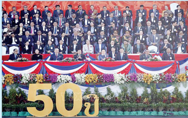
Tổng Bí thư Tô Lâm và Phu nhân cùng các đại biểu dự Lễ kỷ niệm.

Trong suốt 50 năm bảo vệ và phát triển, nước Cộng hòa Dân chủ Nhân dân Lào đã khẳng định vững chắc bản chất, truyền thống cách mạng là bài học