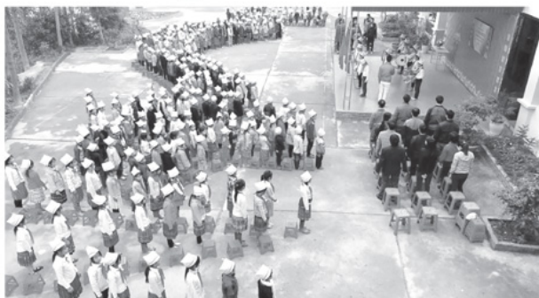
Học sinh Trường PTDTBT Tiểu học Sùng Thái thực hiện nghi lễ chào cờ đầu tuần.

Ông Mua Thiên Sinh, nguyên Hiệu trưởng Trường Tiểu học Sùng Thái nhớ lại, những năm 1986, toàn trường chỉ có 3 gian nhà mái lá tạm bợ; thiếu phòng học, thiếu giáo viên nên phải dạy luân phiên 2 ca mỗi ngày. Trong khi đó, xã có 100% đồng bào dân tộc thiểu số, sống rải rác ở các sườn núi, địa hình chia cắt khiến nhiều học sinh bỏ học theo cha mẹ lên nương. Trước nguy cơ “trắng lớp”, cấp ủy, chính quyền và ngành Giáo dục đã tìm giải pháp thu hút học sinh trở lại lớp. Sau nhiều trăn trở, ý tưởng xây dựng trường nội trú dân nuôi được hình thành bằng cách vận động người dân góp gỗ, ngày công dựng nhà lưu trú, các gia đình cùng chia sẻ củi, ngô, rau xanh và