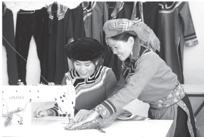
Nhóm cộng đồng bảo tồn nghề thêu thổ cẩm và may trang phục truyền thống dân tộc Cờ Lao thôn Tả Chải, xã Tân Tiến được hỗ trợ máy may phục vụ công việc tốt hơn.

Nhờ triển khai hiệu quả Chương trình mục tiêu Quốc gia phát triển kinh tế - xã hội vùng đồng bào dân tộc thiểu số và miền núi (Chương trình 1719), cuộc sống của bà con dân tộc Cờ Lao ở Tân Tiến đang ngày một tốt lên. Những dự án hỗ trợ sản xuất không chỉ giúp bà con có sinh kế bền vững mà còn mở ra hướng phát triển kinh tế mới, nâng cao đời sống cho đồng bào nơi đây.