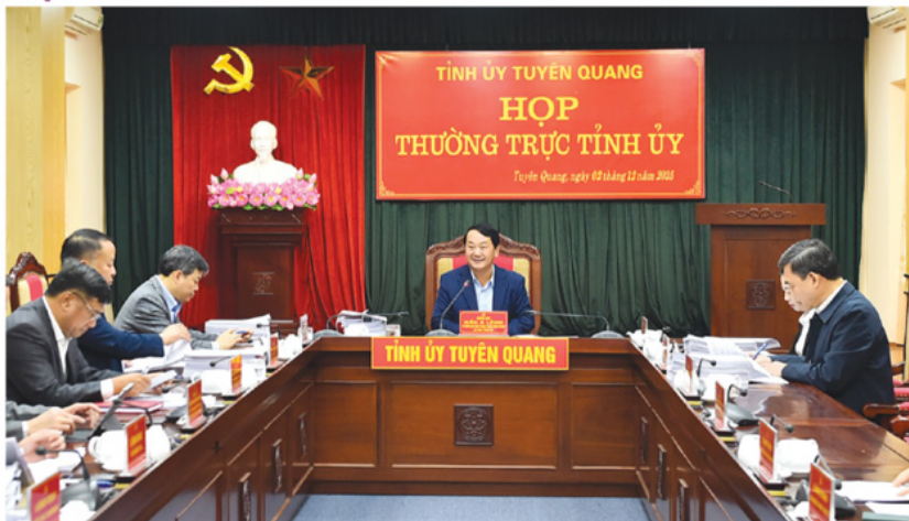
Phiên họp tuần 49 của Thường trực Tỉnh ủy.