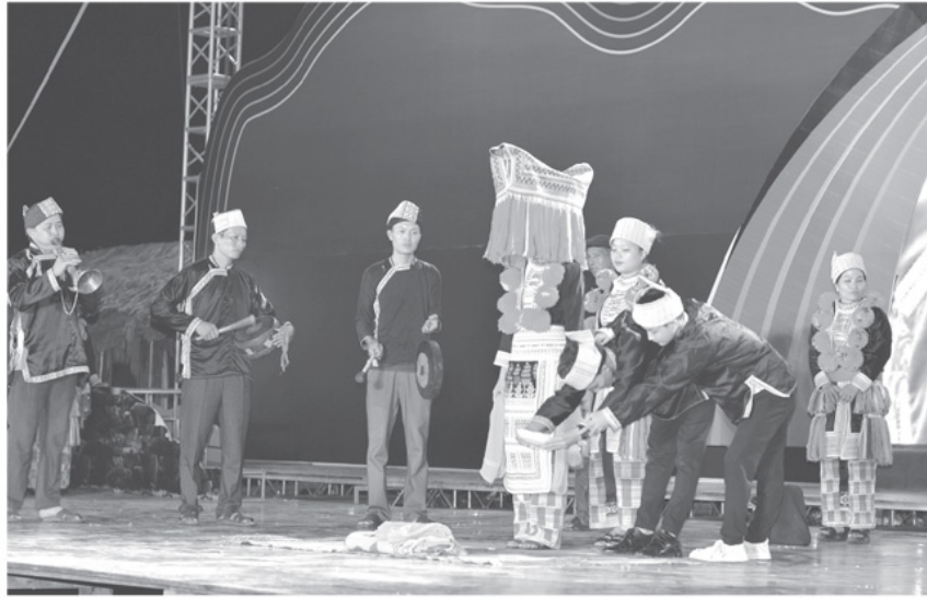
Trình diễn đám cưới người Dao Đỏ tại Ngày hội Văn hóa các dân tộc thiểu số năm 2024.