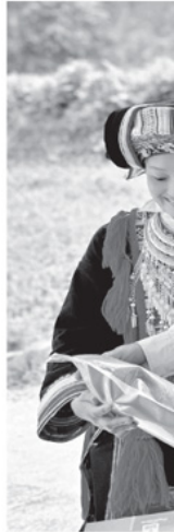
Sản phẩm OCOP

xã đạt 10 - 14 tiêu chí, dưới 10 tiêu chí, công việc phải làm để cách phát triển Chương trình "Mỗi xã một sản phẩm" (OCOP) được đánh giá của tỉnh, toàn tỉnh OCOP đạt từ 3 sao, 2 sản phẩm 5 sao, 2 sản phẩm 4 sao và hàng loạt sản phẩm 3 sao. Trên 97/120 xã có sản phẩm OCOP.