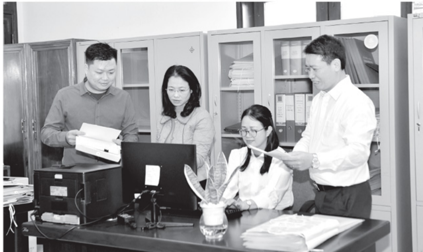
Ban Tổ chức Tỉnh ủy chủ động rà soát, tham mưu cấp ủy tỉnh xem xét điều động, bố trí, luân chuyển bố trí cán bộ chủ chốt không là người địa phương.

Tính xác định rõ quan điểm xuyên suốt: công tác cán bộ là then chốt của nhiệm vụ then chốt; phải đặt dưới sự lãnh đạo tập trung, thống nhất của cấp ủy; việc bố trí cán bộ không phải là người địa phương là chủ trương đúng đắn nhằm tạo môi trường công tác khách