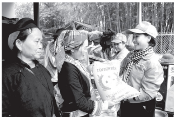
Lãnh đạo Hội Liên hiệp Phụ nữ tỉnh trao quà, thăm hỏi các hội viên bị ảnh hưởng sau đợt ngập lụt.

H ƯỜNG ứng ngày "Chủ nhật sạch" gắn với Cuộc vận động xây dựng gia đình "5 không, 3 sạch", tuyến đường hoa dài 250 m của Chi hội Phụ nữ thôn 1A Thống Nhất, xã Yên Phú luôn được chăm sóc tỉ mỉ, gọn gàng. Vào các buổi ra quân, hội viên đồng loạt quét dọn, thu gom rác thải, tĩa cành, trồng bổ sung hoa hàng rào và xóa các "điểm đen" rác, xây dựng cảnh quan sáng - xanh - sạch - đẹp.