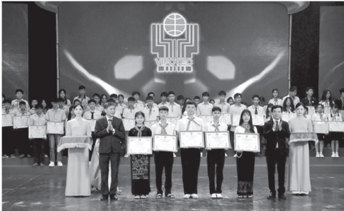
Nhóm học sinh Trường THCS Lăng Can, xã Lâm Bình nhận giải Khuyến khích Cuộc thi Sáng tạo Thanh thiếu niên, nhi đồng toàn quốc năm 2025.

tự nhiên: dòng nước chảy, gió và mặt trời” của nhóm học sinh Trường THPT Sơn Dương; “Hệ thống làm nóng nước thông minh bằng năng lượng mặt trời” của nhóm học sinh Trường THCS An Tường; “Giải pháp thông minh để bảo vệ môi trường và phát triển kinh tế” của nhóm học sinh Trường THPT Đông Thọ, Sơn Dương; “Máy làm phân hữu cơ vi sinh điều khiển trên công nghệ