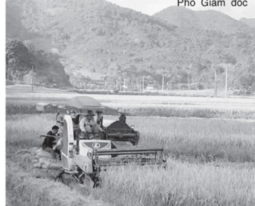
Với điều kiện tự nhiên thuận lợi, xã Côn Lôn được coi là

Theo báo cáo của Sở Nông nghiệp và Môi trường tỉnh Tuyên Quang, đến tháng 10 - 2025, toàn tỉnh có 35 xã đạt chuẩn NTM (tỉnh Tuyên Quang cũ 24 xã, tỉnh Hà Giang cũ 11 xã), 1 xã đạt chuẩn NTM nâng cao (xã Thái Hòa). Bình quân toàn tỉnh Tuyên Quang hiện đạt 11,9 tiêu chí/xã. Trong số 35 xã đã đạt chuẩn, có 18 xã duy trì 19 tiêu chí, 15 xã đạt 15 - 18 tiêu chí, 46