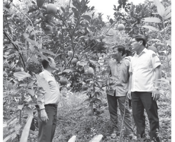
Lãnh đạo xã Hùng Lợi thăm mô hình phát triển kinh tế của người dân thôn Đồng Trang.

Các xã, phường sau sáp nhập đã tạo nên những vùng phát triển có quy mô lớn, tiềm lực mạnh và khả năng thu hút đầu tư hiệu quả. Trong bối cảnh mới, đội ngũ cán bộ xã không chỉ là người thực thi chính sách mà với tinh thần gắn bó với Nhân dân, họ ngày đêm bám cơ sở, trực tiếp tháo gỡ khó khăn, giúp người dân phát triển kinh tế, vươn lên thoát nghèo.