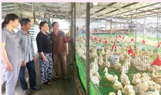
Các chủ trang trại chú trọng phòng chống dịch bệnh.

ngay các nguồn kinh phí, nhân lực để tổ chức xử lý dứt điểm các ổ dịch, không để phát sinh các ổ dịch mới, không để lây lan, lây đưa kéo dài; triển khai thực hiện kịp thời các chính sách hỗ trợ cho người chăn nuôi.