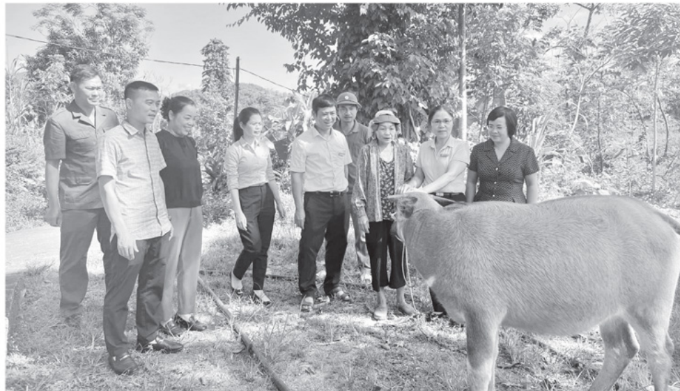
Xã Việt Lâm trao trâu sinh sản cho hộ nghèo để nâng cao tiêu chí thu nhập.

Sau nhiều năm triển khai, Chương trình xây dựng nông thôn mới (NTM) đã góp phần thay đổi diện mạo nông thôn, nâng cao đời sống người dân. Tuy nhiên, việc thực hiện mô hình chính quyền địa phương hai cấp cùng chính sách sáp nhập các xã, phường, thị trấn từ ngày 1/7/2025 đã đặt ra thách thức lớn. Việc rà soát, đánh giá lại các tiêu chí khiến nhiều xã từng đạt chuẩn NTM, NTM nâng cao nay bị mất chuẩn. Thuận lợi có mà khó cũng nhiều. Bài toán làm sao để hài hòa, duy trì và phát triển các tiêu chí đang được đặt ra, đòi hỏi sự quyết tâm và những giải pháp linh hoạt từ cơ sở đến cấp tỉnh.