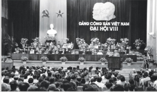
Đại hội đại biểu toàn quốc lần thứ VIII của Đảng.