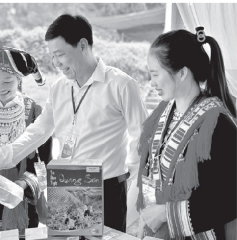
OP tại xã Tiên Nguyên.

u chỉ và 38 xã đạt ho thấy còn nhiều thu hẹp khoảng giữa các vùng. xã một sản phẩm" h giá là điểm sáng có 454 sản phẩm o trở lên, trong đó o quốc gia, 24 sản ng trăm sản phẩm 24 xã, phường đã OP.