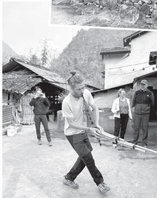
◀ Du khách nước ngoài học múa khèn rất nhanh.