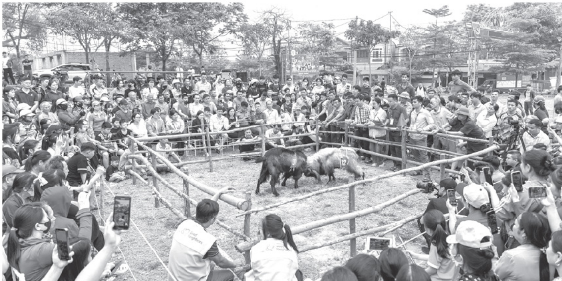
Hội thi chọi dê xã Phú Lương thu hút đông đảo người dân địa phương và du khách tới xem và cổ vũ.

nuôi, ít bệnh tật lại ăn tạp, tôi tham gia mô hình lớn. Tính ra, nuôi dê cho thu nhập cao gấp 3 - 4 lần trồng ngô mà lại nhàn hơn. Mỗi năm tôi thu về hơn 150 triệu đồng đấy!”.