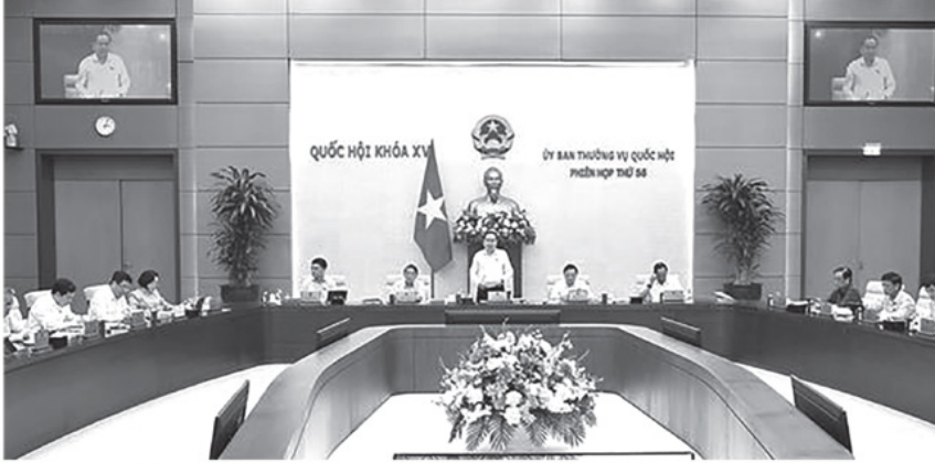
Quang cảnh phiên họp.

SÁNG 2/4, tiếp tục Phiên họp thứ 56, Ủy ban Thường vụ Quốc hội cho ý kiến về việc chuẩn bị Kỳ họp thứ nhất, Quốc hội khóa XVI.