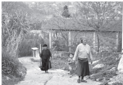
Trẻ em theo người lớn lên nương.