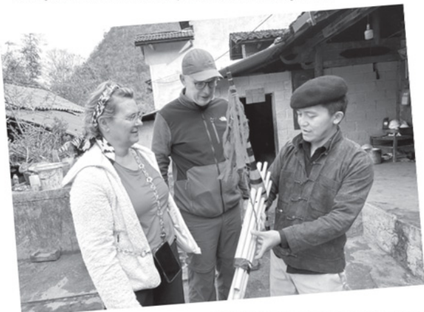
▲ Du khách nước ngoài tìm hiểu về khèn Mông.