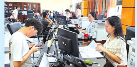
Thanh Hóa thí điểm Kiosk thông minh và hệ thống xác thực số.

Ủy ban nhân dân tỉnh Thanh Hóa vừa phối hợp Ngân hàng Nông nghiệp và Phát triển nông thôn Việt Nam (Agribank) tổ chức Lễ ra mắt mô hình thí điểm Kiosk thông minh và hệ thống xác thực cấp bản sao số tài liệu điện tử trên địa bàn tỉnh.