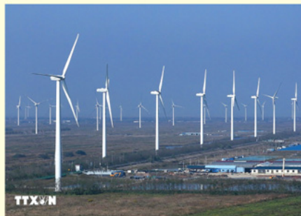
Hiện tại, hơn 50% điện năng của Trung Quốc đến từ các nguồn năng lượng tái tạo như năng lượng mặt trời, gió, hydro và hạt nhân.

So sánh hiệu quả thương mại của Trung Quốc với các đối tác lớn khác, vai trò ổn định của Trung