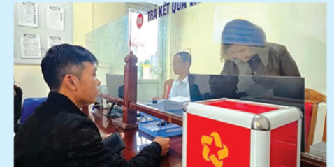
Người dân nhận kết quả giải quyết thủ tục hành chính ở Trung tâm Phục vụ hành chính công phường Quảng Phú.

Điểm đột phá của mô hình là khả năng thực hiện các dịch vụ công liên thông với Bộ Công an. Người dân có thể thực hiện đồng thời thủ tục đăng ký khai sinh, đăng ký thường trú và cấp thẻ bảo hiểm y tế cho trẻ dưới 6 tuổi chỉ trên một giao diện duy nhất. Các thủ tục cấp phiếu lý lịch tư pháp, cấp đổi giấy phép lái xe cũng được đơn giản hóa tối đa. Hệ thống cho phép người dân gửi ảnh thẻ trực tiếp từ điện thoại cá nhân lên Kiosk và kết nối với Cổng dịch vụ quốc gia, cho phép người dân nộp hồ sơ dịch vụ công trực tuyến ngay tại Kiosk.