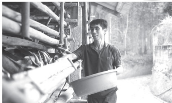
Người dân xã Phú Lương chăm sóc đàn dê của gia đình.