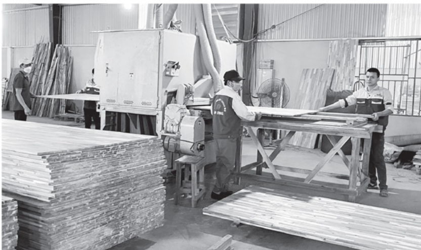
Sản xuất gỗ xuất khẩu sang thị trường Đài Loan tại Công ty Cổ phần Cơ khí Tuyên Quang.

Biến động địa chính trị, chi phí logistics tăng cao và nguy cơ đứt gãy chuỗi cung ứng đang trở thành những "nút thắt" lớn đối với hoạt động xuất khẩu. Trong bối cảnh đó, doanh nghiệp trên địa bàn tỉnh buộc phải "gồng mình" duy trì sản xuất, đồng thời linh hoạt xoay trục thị trường, tối ưu chi phí và tìm kiếm hướng đi mới. Từ áp lực thực tiễn, cùng với định hướng của tỉnh, ngành Công thương, xuất khẩu không chỉ là bài toán tăng trưởng mà còn là hành trình thích ứng để phát triển bền vững.