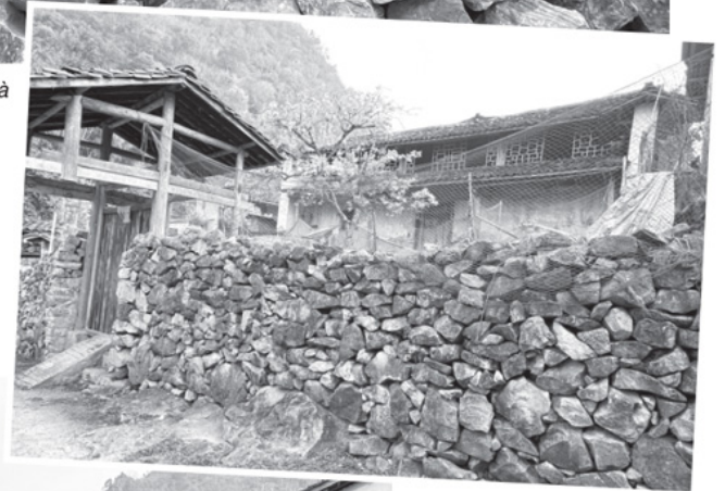
Những bờ rào đá vững chắc bao quanh những ngôi nhà của người Mông.