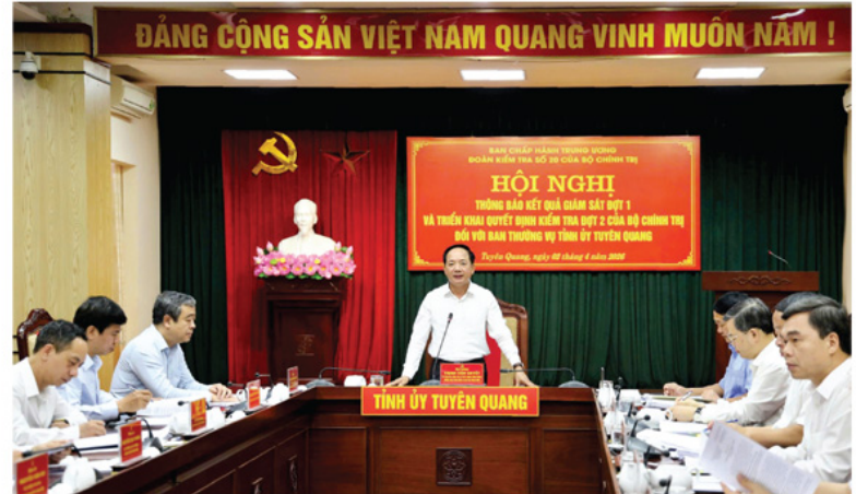
Đồng chí Trịnh Văn Quyết, Ủy viên Bộ Chính trị, Bí thư Trung ương Đảng, Trưởng Ban Tuyên giáo và Dân vận Trung ương phát biểu tại Hội nghị thông báo kết quả giám sát đợt I và triển khai quyết định kiểm tra đợt II của Bộ Chính trị đối với Ban Thường vụ Tỉnh ủy Tuyên Quang.