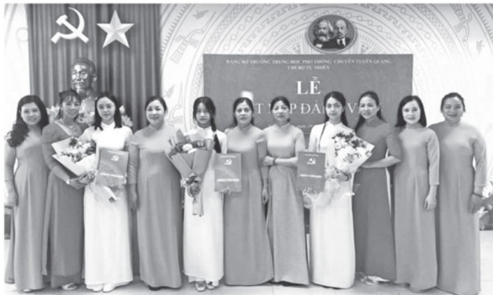
Chi bộ Tự nhiên, Đảng bộ Trường THPT Chuyên Tuyên Quang tổ chức kết nạp những đảng viên mới.

Những năm qua, công tác phát triển Đảng trong các trường Trung học phổ thông trên địa bàn tỉnh Tuyên Quang đã có những bước chuyển biến mạnh mẽ, đi vào chiều sâu. Việc chú trọng bồi dưỡng, kết nạp những “hạt giống đỏ” không chỉ trẻ hóa đội ngũ đảng viên mà còn tạo môi trường thi đua sôi nổi, giúp học sinh xác định lý tưởng sống cao đẹp, nỗ lực rèn đức, luyện tài để trở thành những tấm gương sáng trong phong trào tuổi trẻ lập thân, lập nghiệp, đóng góp nguồn nhân lực chất lượng cao cho quê hương.