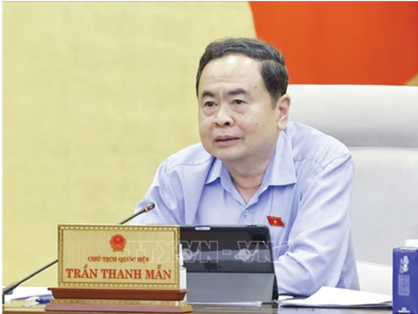
Chủ tịch Quốc hội Trần Thanh Mẫn phát biểu tại Phiên họp thứ 56 của Ủy ban Thường vụ Quốc hội.