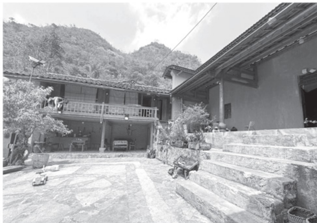
Trong bản đã có Homestay đón khách trải nghiệm.