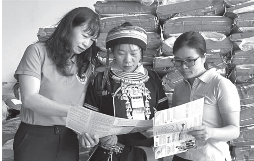
Cán bộ Bảo hiểm xã hội cơ sở Quận Bạ tuyên truyền cho người dân về chính sách bảo hiểm y tế.

Thực hiện chỉ đạo này, ngành BHXH tỉnh Tuyên Quang đã chủ động phối hợp với các sở, ngành, đoàn thể triển khai đồng bộ nhiều giải pháp. Công tác tuyên truyền được đổi mới theo hướng linh hoạt, đa dạng, phù hợp với từng nhóm đối tượng. Từ các hội nghị tuyên truyền tập trung đến hình thức “đi từng ngõ, gõ