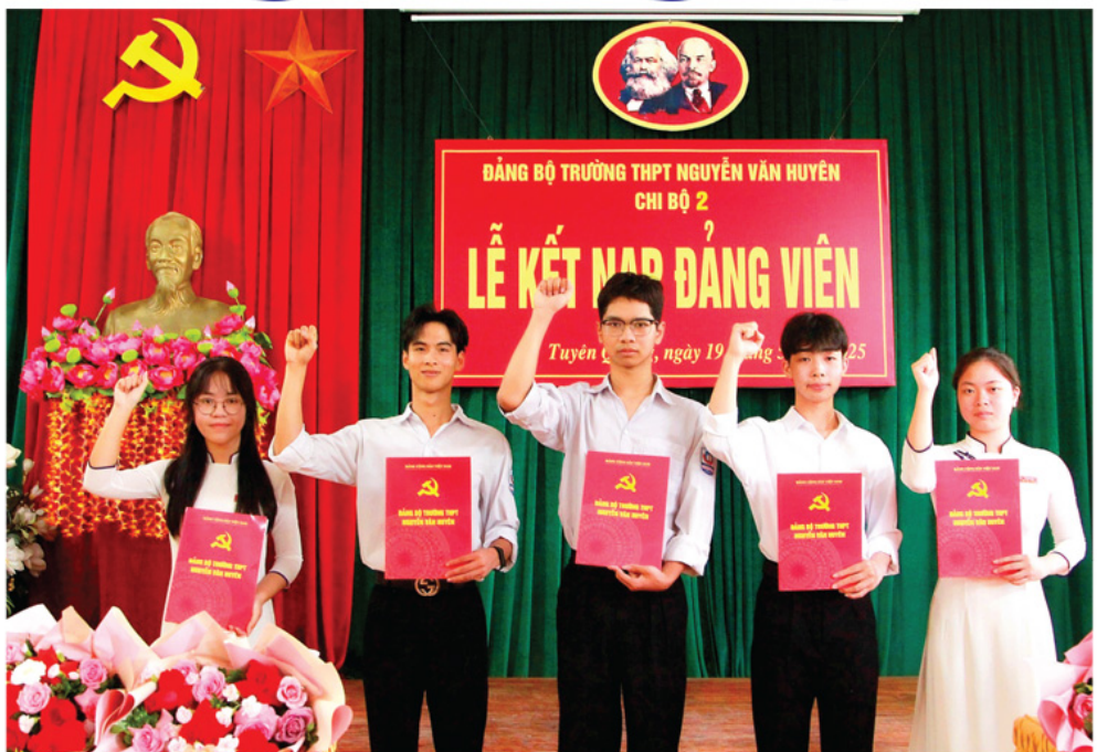
Những đảng viên trẻ của Đảng bộ Trường THPT Nguyễn Văn Huyền thể hiện quyết tâm rèn luyện, cống hiến khi được đứng trong hàng ngũ của Đảng.