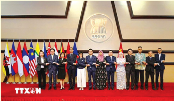
Các đại biểu tại cuộc họp Ủy ban chung ASEAN - Trung Quốc lần thứ 27.

Quốc và ASEAN càng trở nên nổi bật. Năm 2025, thương mại của Trung Quốc với Liên minh châu Âu (EU) đạt 5.930 tỷ NDT (khoảng 863 tỷ USD), tăng 6%; thương mại của Trung Quốc với Mỹ đạt 4.010 tỷ NDT (khoảng 583 tỷ USD), chiếm 8,8% tổng kim ngạch xuất nhập khẩu của Trung Quốc; trong khi tổng giá trị thương mại giữa Trung Quốc và ASEAN đạt 7.550 NDT (khoảng 1.098 tỷ USD), tăng 8%, chiếm 16,6% tổng kim ngạch xuất nhập khẩu của Trung Quốc.