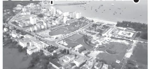
Đặc khu Cô Tô nhìn từ trên cao.

Về định hướng sản phẩm, đặc khu Cô Tô sẽ xây dựng hệ sinh thái du lịch bốn mùa để giảm bớt sự phụ thuộc vào thời tiết như mùa Xuân và mùa Hè tập trung du lịch sinh thái rừng - biển; mùa Thu phát