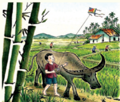
Minh họa: ĐỨC TRẦN

Miền man mái lá gió lùa Suan suê quả cũng đã vừa ngọt thơm Sấm rền nắng sớm mưa hôm Tiếng chim cuộc điếm gió nồm mơn man.