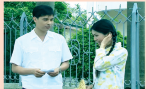
Cảnh trong phim Cây trầu không.