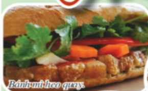
Bánh mì heo quay