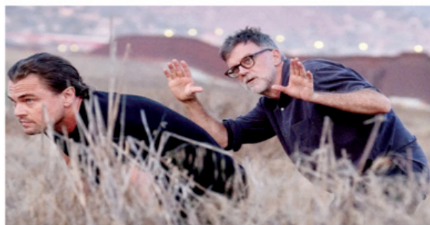
Đạo diễn Paul Thomas Anderson (bên phải) chỉ đạo trên phim trường One Battle After Another.

Thành tích của bộ phim trên đấu trường quốc tế là minh chứng rõ nét nhất cho chất lượng vượt trội. Tác phẩm đã đại thắng tại Oscar 2026 với 6 tượng vàng ở các hạng mục quan trọng nhất: Phim hay nhất, Đạo diễn xuất sắc nhất, Nam diễn viên phụ xuất sắc nhất, Dàn diễn viên xuất sắc nhất và Kịch