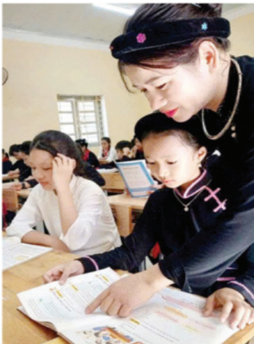
Cô giáo hướng dẫn học sinh học tại trường PTDT nội trú THCS và THPT Na Hang.