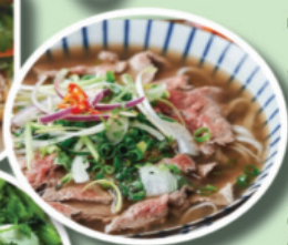
Phở bò đồng vị trí thứ 3 trong danh sách 100 món ngon.