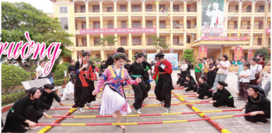
Hoạt động thể thao được triển khai thường xuyên tại các trường nội trú trong tỉnh.

VỚI đặc thù một tỉnh miền núi, có nhiều đồng bào dân tộc thiểu số sinh sống, việc xây dựng và phát triển hệ thống Trường Phổ thông Dân tộc nội trú và bán trú là nhiệm vụ quan trọng được tỉnh Tuyên Quang triển khai thực hiện. Theo thống kê của Sở Giáo dục và Đào tạo, tổng số học sinh nội trú và bán trú trên địa bàn tỉnh hiện chiếm tới 36,3% tổng số học sinh phổ thông toàn tỉnh, một tỷ lệ cao cho thấy vai trò thiết yếu của mô hình này trong việc nâng cao dân trí và tạo điều kiện học tập thuận lợi nhất cho con em các dân tộc.