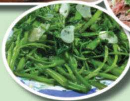
Món rau muống xào tỏi bình dân cũng góp một trong danh sách này.

THEO bảng xếp hạng "Top 100 món ăn Việt Nam" do chuyên trang ẩm thực quốc tế Taste Atlas công bố mỗi đây, bánh mì heo quay vượt qua nhiều món ăn quen thuộc khác, đứng vị trí đầu tiên.