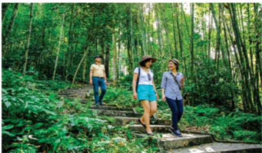
Du khách xuyên qua những tán rừng nguyên sinh để khám phá Di tích danh thắng Quốc gia thác Tiên - đèo Gió

“Chưa vượt đèo Gió, chưa ngắm thác Tiên thì chưa khám phá hết nét đẹp hoang sơ, kỳ vĩ và văn hóa nguyên bản của mảnh đất phía Tây Tuyên Quang”. Câu nói truyền tai của giới du khách mê khám phá không phải là ngẫu nhiên, mà bắt nguồn từ nhịp thở hoang sơ của đại ngàn, từ khúc tình ca dịu dàng được dệt nên từ sương mờ và thác trắng, Thác Tiên - đèo Gió, xã Nám Dẩn ẩn hiện giữa rừng già mờ ảo như xứ sở thần tiên.