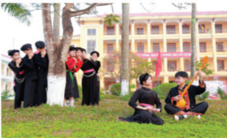
Học sinh các trường nội trú tại tỉnh Tuyên Quang đều có đời sống văn hóa phong phú song hành cùng học tập (ảnh trái). Học sinh trường PTDT nội trú ATK Sơn Dương học làm quả cùn (ảnh phải).