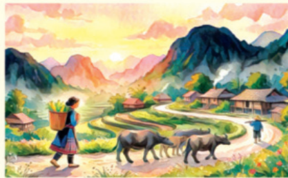
Minh họa: NGỌC AN

Thế là lại đến tháng Ba Bản thân hoa gạo... để ta nhớ người Sông kia nước chảy bèo trôi Ta với mình đã xa xôi mấy mùa? Gió xuân vô ý trên đầu Để cây lúa trẻ hẹn chờ cơn mưa Vô tình gặp lại rào thưa Áo ai hong gọi ngày xưa... trở về? Ai còn đan dứ câu thơ Để đa đoan lối đi về... vẫn vương Tóc dài còn sững vạt sương Làn môi còn thắm nét son nồng nàn Thôi thì thuyền đã sang ngang Xin mình chớ có đa đoan làm gì? Hãy để cho gió cuốn đi Chôn kim xe chỉ làm gì... người ơi? Cây chi duyên thắm bờ môi? Cây chi mắt biếc, dòng đời lăm sâu Gió xuân vấn vít qua cầu Tháng Ba còn giữ giùm câu ân tình.