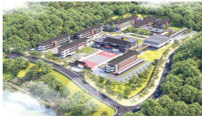
Phôi cảnh Trường Phổ thông Nội trú liên cấp Tiểu học và Trung học cơ sở Thanh Thủy mở ra diện mạo mới cho giáo dục vùng biên.