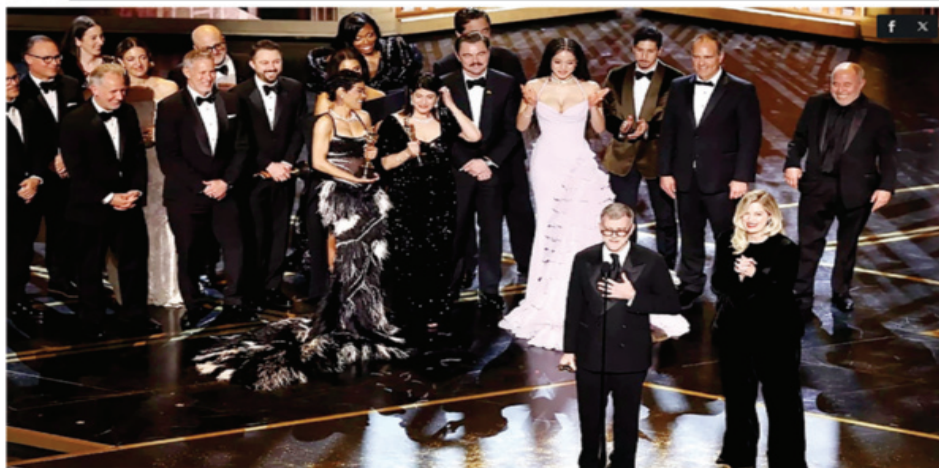
Đạo diễn Paul Thomas Anderson cùng dàn diễn viên, ê-kíp làm phim One Battle After Another trên sân khấu nhận giải Phim hay nhất tại Lễ trao giải Oscar 2026.

Lễ trao giải Oscar lần thứ 98 năm 2026 đã chính thức khép lại với sự lên ngôi rực rỡ của “One Battle After Another” (Trận chiến sau trận chiến). Không chỉ cán quét 6 tượng vàng danh giá nhất, kiệt tác của đạo diễn Paul Thomas Anderson với màn trình diễn để đời từ Leonardo DiCaprio còn đang tạo ra một hiện tượng văn hóa mạnh mẽ. Tại Việt Nam, tác phẩm không chỉ chinh phục giới chuyên môn mà còn khiến đông đảo khán giả đại chúng phải thốt thốt, khẳng định sức sống mãnh liệt của nghệ thuật điện ảnh đích thực.