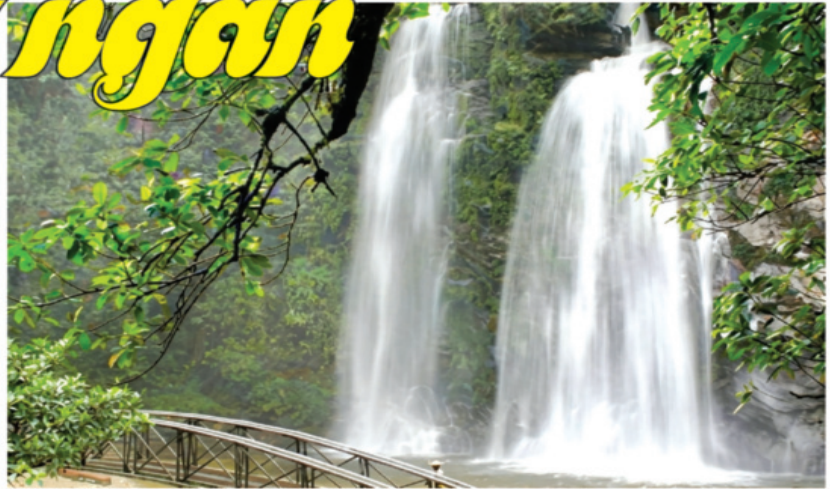
Thác Tiên mềm mại đổ xuống từ độ cao 70 m tạo nên khung cảnh trữ tình giữa đại ngàn hùng vĩ.