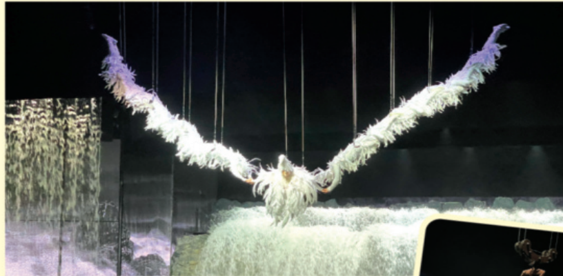
Một cảnh về truyền thuyết chim thần trong show Lệ Giang thiên cổ tình.