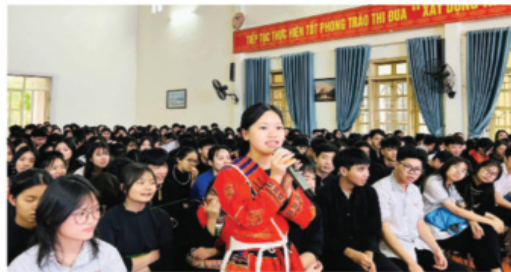
Học sinh nội trú được bày tỏ quan điểm cá nhân tại các cuộc sinh hoạt toàn khối (ảnh trái). Giờ tự học tại trường PTDT nội trú THCS và THPT Na Hang (ảnh phải).