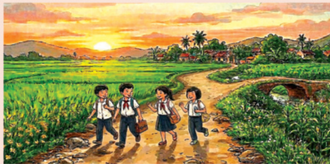
Minh họa: XUÂN ĐỨC

KHI những tia nắng cuối ngày dần tắt, bước chân ta lặng lẽ chạm nhẹ trên con đường về thăm lại... ngày xưa. Đâu rồi, cánh đồng thơm hương lúa, những nương ngô xanh mướt lồi ta đi? Đâu rồi, cây cầu đất với miềm man lối cỏ may ta đi học mỗi sáng, đi thả trâu mỗi chiều? Đâu rồi, con đường lộng chông đá, lổn nhổn những ổ gà, lấy bụi những ngày mưa, đã đưa đón những bàn chân trần vào sớm khuya? Con đường như lạ, như quen, đã lưu riu bước chân ta thưở nào.