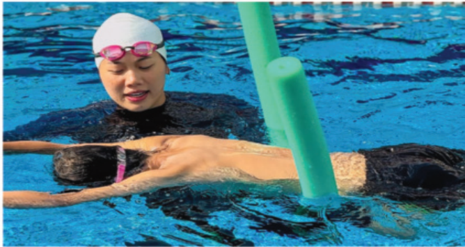
Rời đường đua xanh, Nguyễn Thị Ánh Viên vẫn bên bi lan tỏa đam mê bơi lội, truyền lửa cho thế hệ kế cận.

ể thao không phải mà là “đường ray” a tài năng. Nó buộc ường, làm điều cần t mỗi bữa vầy và ý ng. i bóng rổ Nhà nghề n James là minh mạnh của kỹ luật. gữ kỷ lục ghi điểm à thi đấu đỉnh cao James - biểu tượng của một sự nghiệp hập kỷ. Thành công hàng đơn thuần, mà Mỗi năm, anh đầu USD để tối ưu cơ hệ từ phục hồi, dinh nhằm kéo dài đỉnh