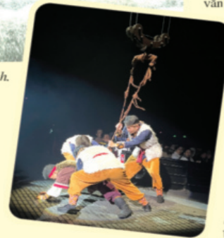
Sân khấu bất ngờ và diễn viên xuất hiện bất ngờ khu vực khán giả.

Đây chính là những khía cạnh cốt lõi để tham khảo và khai thác hiệu quả hơn kho tàng di sản, biến văn hóa thành nguồn lực phát triển bền vững trong kỷ nguyên mới, nhất là khi Đảng ta vừa ban hành riêng một Nghị quyết mới về văn hóa ■