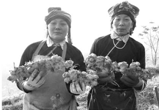
Gừng trâu ruột vàng mang lại thu nhập cao cho người dân vùng liên kết.

Sáng sớm ở xã Vị Xuyên, những luống rau má xanh mướt trải dài trên triển đất, là non còn đọng sương sớm. Ít ai nghĩ, loại cây mọc quen thuộc nơi vườn nhà lại mở hướng đi mới cho dược liệu bản địa đã được chị Liễu xây dựng hơn 7 năm nay. Để phát triển vùng nguyên liệu, chị liên kết với nhiều hộ ở xã Vị Xuyên, Phú Linh, vùng trồng được chăm sóc theo quy trình thống nhất. Người dân yên tâm vì không phải lo đầu ra cho sản phẩm. Nhờ làm bài bản, cây