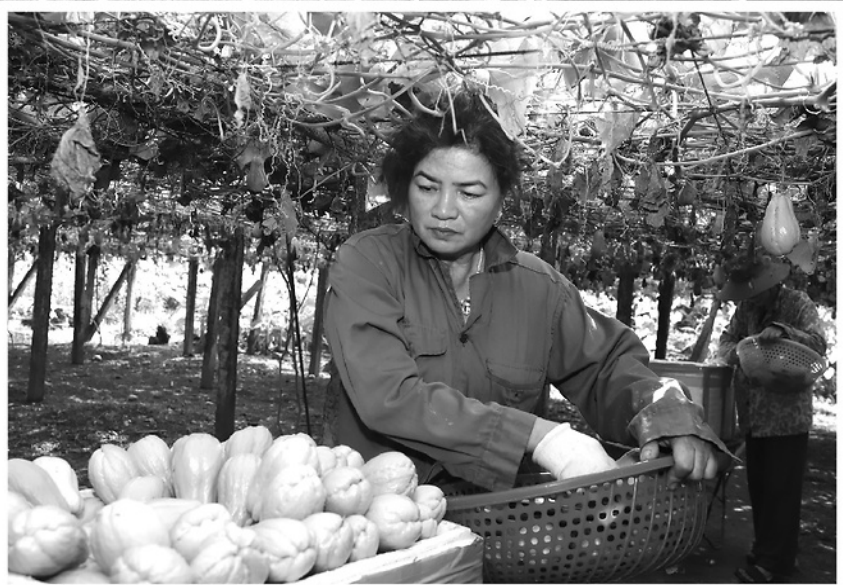
Hiện đang vào vụ su su, mỗi ngày người dân thôn 29 thu hoạch từ 2 - 3 tấn quả.

TRỜI VUA SẮM TỐI CŨNG LÀ LÚC HÀNG CHỤC CHUYẾN XE MÁY NỐI ĐUÔI NHAU CHỖ ĐỦ CÁC LOẠI SU SU, MƯỚP ĐẮNG, ĐẬU ĐỔ, BẦU, BÍ TỪ THÔN 29, XÃ VỊ XUYỀN ĐẾN ĐIỂM TẬP KẾT CHO THƯƠNG LÁI VẬN CHUYỂN ĐI CÁC TỈNH MIỀN XUÔI HOẶC NGƯỢC LÊN CÁC XÃ VÙNG CAO. NGÀY ÍT THÌ VÀI TẤN, NHỮNG NGÀY CUỐI TUẦN LÊN ĐẾN CẢ CHỤC TẤN. TRỒNG RAU, QUẢ LEO GIÀN Ở NƠI ĐÂY ĐEM VỀ THU NHẬP TỪ 150 - 200 TRĂM TRIỆU ĐỒNG/HA/NĂM CHO CÁC GIA ĐÌNH.