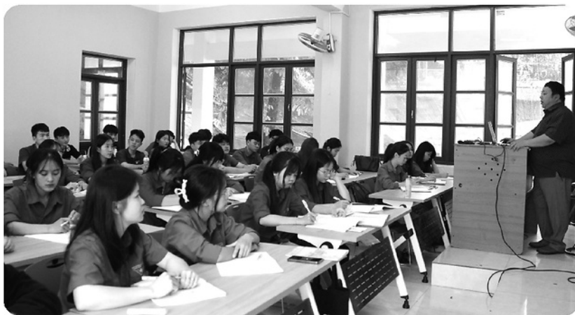
Sinh viên Sư phạm tiếng Mông trong một tiết học.

Lần đầu tiên trong lịch sử giáo dục Việt Nam, một mã ngành đào tạo Sư phạm tiếng Mông bậc Đại học được Bộ Giáo dục và Đào tạo chính thức cấp phép cho Phân hiệu Đại học Thái Nguyên sinh. Sự kiện này mở ra một trang mới, thấp lên hy vọng về một đội ngũ giáo viên am hiểu ngôn ngữ, tường tận văn hóa của đồng bào dân tộc Mông và sẵn sàng trở thành cầu nối tri thức cho bản làng vùng cao.