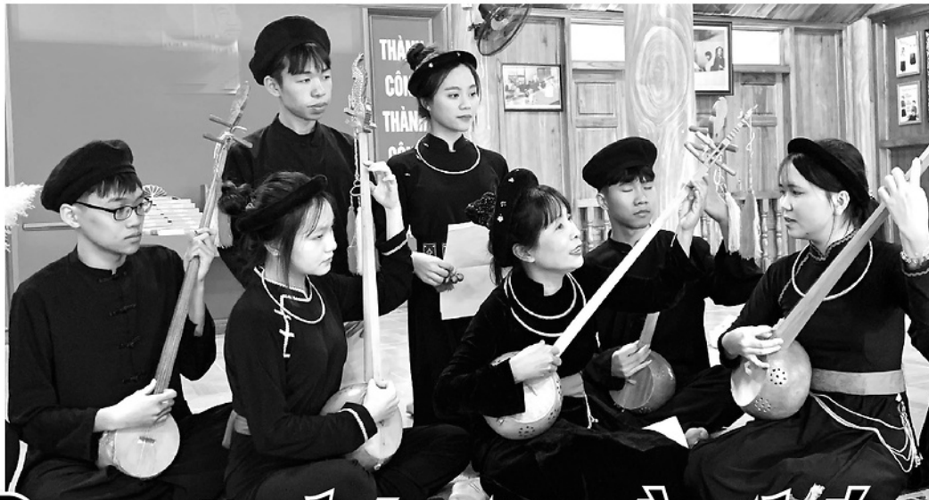
Các thành viên CLB hát Then - đàn Tranh, Trường PTDT Nội trú THPT tỉnh trong buổi sinh hoạt.