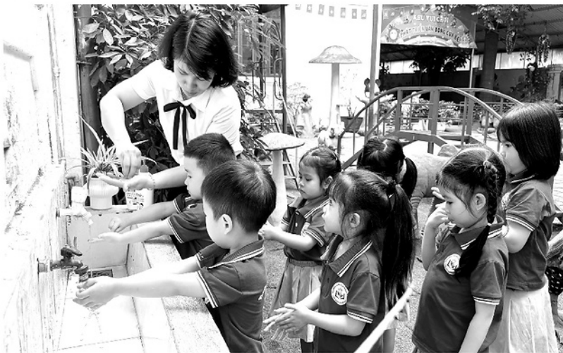
Giáo viên Trường Mầm non Phan Thiết, phường Minh Xuân hướng dẫn trẻ rửa tay phòng dịch bệnh.

THỜI GIAN GẦN ĐÂY, DỊCH BỆNH TAY CHÂN MIỆNG CÓ XU HƯỚNG GIA TĂNG TẠI NHIỀU ĐỊA PHƯƠNG TRÊN CẢ NƯỚC. THEO HỆ THỐNG GIÁM SÁT BỆNH TRUYỀN NHIỄM, NHỮNG THÁNG ĐẦU NĂM 2026, CẢ NƯỚC GHI NHẬN GẦN 25.094 TRƯỜNG HỢP MẮC BỆNH TAY CHÂN MIỆNG, CAO HƠN 5 LẦN SO VỚI CÙNG KỶ NĂM 2025. TẠI TỈNH TUYÊN QUANG, BỆNH TAY CHÂN MIỆNG XẢY RA RẢI RÁC Ở MỘT SỐ ĐỊA PHƯƠNG. PHẦN LỚN CÁC TRƯỜNG HỢP MẮC BỆNH LÀ TRẺ EM DƯỚI 10 TUỔI, TRONG ĐÓ TẬP TRUNG CHỦ YẾU Ở NHÓM TRẺ TỪ 1 ĐẾN 5 TUỔI LÀ LỨA TUỔI ĐANG HỌC TẠI CÁC CƠ SỞ MẦM NON, MẪU GIÁO.