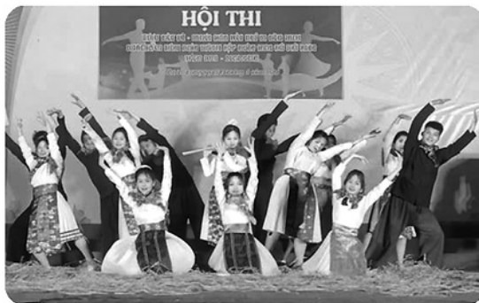
Sinh viên Sư phạm tiếng Mông tham gia hoạt động ngoại khóa.

Chương trình đào tạo Sư phạm tiếng Mông bao gồm: Lý luận giáo dục, Tâm lý học giáo dục, Phương pháp giảng dạy, đọc và viết tiếng Mông, Văn hóa và Lịch sử dân tộc Mông, và các môn học chuyên ngành khác như Ngữ âm, Ngữ pháp, Từ vựng, Văn học và Tình hình phát triển của ngôn ngữ Mông.