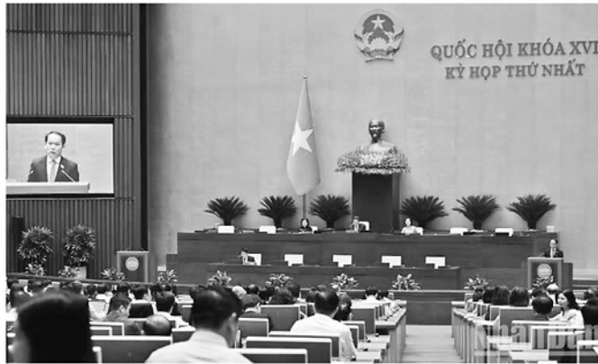
Quốc hội họp phiên chiều 8/4.

Biểu quyết thông qua Nghị quyết phê chuẩn đề nghị của Thủ tướng Chính phủ về việc bổ nhiệm Bộ trưởng và thành viên khác của Chính phủ nhiệm kỳ 2026 - 2031. Kết quả: có 481 đại biểu tham gia biểu quyết, trong đó có 481 đại biểu tán thành (bằng 100% đại biểu Quốc hội có mặt và bằng 96,20% tổng số đại biểu Quốc hội). Theo đó, danh sách Bộ trưởng và thành viên khác của Chính phủ nhiệm kỳ 2026 - 2031 gồm các ông, bà có tên sau: Ông Phan Văn Giang, Phó Thủ tướng Chính phủ kiêm Bộ trưởng Quốc phòng; Ông Lương Tam Quang, Bộ trưởng Công an; Ông Lê Hoài Trung, Bộ trưởng Ngoại giao; Ông Đỗ Thanh Bình, Bộ trưởng Nội vụ; Ông Hoàng Thanh Tùng, Bộ trưởng Tư pháp; Ông Ngô Văn Tuấn, Bộ trưởng Tài chính; Ông Lê Mạnh Hùng, Bộ trưởng Công thương; Ông Trịnh Việt Hùng, Bộ