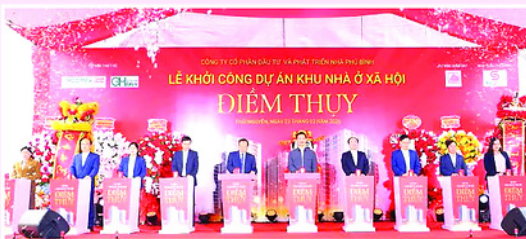
Nhấn nút khởi công dự án xây dựng 567 căn nhà ở xã hội Điểm Thủy, xã Điểm Thủy.

Riêng năm 2026, tỉnh sẽ triển khai các dự án đã được