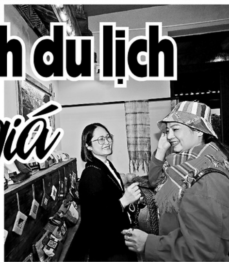
Du khách mua đồ lưu niệm tại phố cổ Đồng Văn.

Trong bối cảnh giá xăng dầu tăng phi mã, lạm phát toàn cầu và chi phí sinh hoạt leo thang, ngành du lịch đang đối mặt với một nghịch lý: Người dân vẫn mong muốn được đi du lịch, nhưng túi tiền của họ lại thắt chặt hơn bao giờ hết.