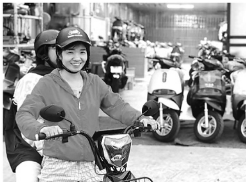
Nhiều người dân chuyển sang sử dụng xe điện phục vụ đời sống hàng ngày.

Dưới tác động của giá xăng dầu liên tục biến động, nhu cầu của người dân đối với các dòng xe máy điện, xe đạp điện, xe ô tô tăng rõ rệt, đặc biệt ở khu vực đô thị và trong nhóm học sinh, sinh viên, người lao động. Theo ghi nhận thực tế, nhiều cửa hàng kinh doanh xe điện cho biết lượng khách tìm hiểu và mua xe tăng đáng kể so với cùng kỳ năm trước, có thời điểm tăng từ 20 - 30%.