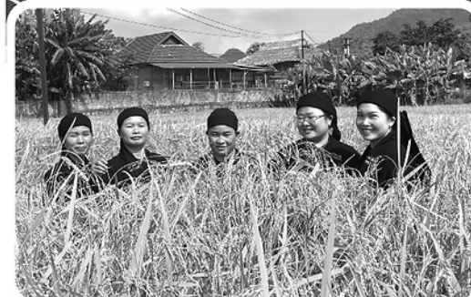
Người dân thôn Hạ thu hoạch lúa nếp Lào Mu.

ha; mở rộng 300 ha gieo cấy lúa nếp Lào Mu; phát triển trên 200 ha cây ăn quả; duy trì 56 ha cam sành đạt tiêu chuẩn VietGAP, hữu cơ và xây dựng ít nhất 2 hợp tác xã hoạt động hiệu quả.