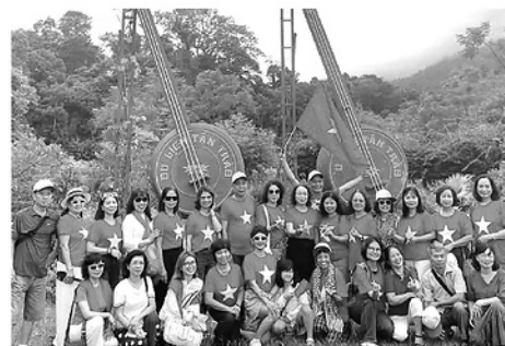
Du khách tham quan Khu di tích Quốc gia đặc biệt Tân Trào, xã Sơn Dương.

Kết quả trên có được nhờ việc tỉnh chú trọng phát triển đa dạng các loại hình du lịch như du lịch lịch sử, văn hóa, sinh thái và du lịch cộng đồng. Các điểm đến trọng điểm như Khu di tích Quốc gia đặc biệt Tân Trào, Khu di tích Na Hang - Lâm Bình hay các làng văn hóa du lịch cộng đồng tiếp tục thu hút đông đảo du khách. Bên cạnh đó, hàng loạt hoạt động lễ hội