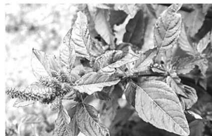
Rau dền gai là vị thuốc tự nhiên, có nhiều công dụng với sức khỏe.

Cách làm: Rửa sạch nguyên liệu với nước muối loãng, giã nát cùng một chút muối hạt, đắp trực tiếp lên vùng da bị mụn nhọt hoặc sưng tấy, dùng gạc cố định lại, mỗi ngày thay 2 lần.