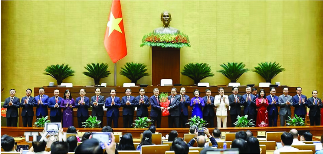
Thay mặt lãnh đạo Đảng và Nhà nước và các vị đại biểu Quốc hội khóa XVI, Chủ tịch Quốc hội Trần Thanh Mẫn tặng hoa chúc mừng các thành viên Chính phủ nhiệm kỳ 2026 - 2031.

N NGÀY 8/4/2026, Kỳ họp thứ nhất, Quốc hội khóa XVI bước sang ngày làm việc thứ ba tại Nhà Quốc hội, Thủ đô Hà Nội, dưới sự chủ trì của Chủ tịch Quốc hội Trần Thanh Mẫn.