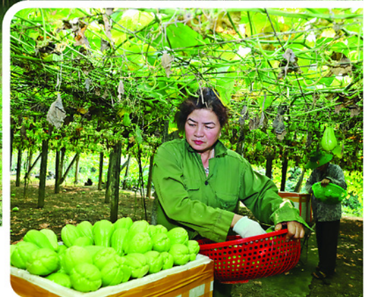
Những giàn rau trăm triệu ở thôn 29, xã Vỹ Xuyên hiện đang vào vụ su su, mỗi ngày người dân thu hoạch từ 2 - 3 tấn quả.