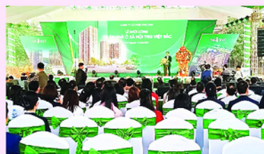
Đây là dự án nhà ở xã hội thứ 3 mà Công ty cổ phần TNG Land đầu tư tại Thái Nguyên.

Thái Nguyên đặt việc phát triển nhà ở xã hội là trọng tâm trong phát triển nhà ở với 73 dự án trên diện tích gần 259 ha.