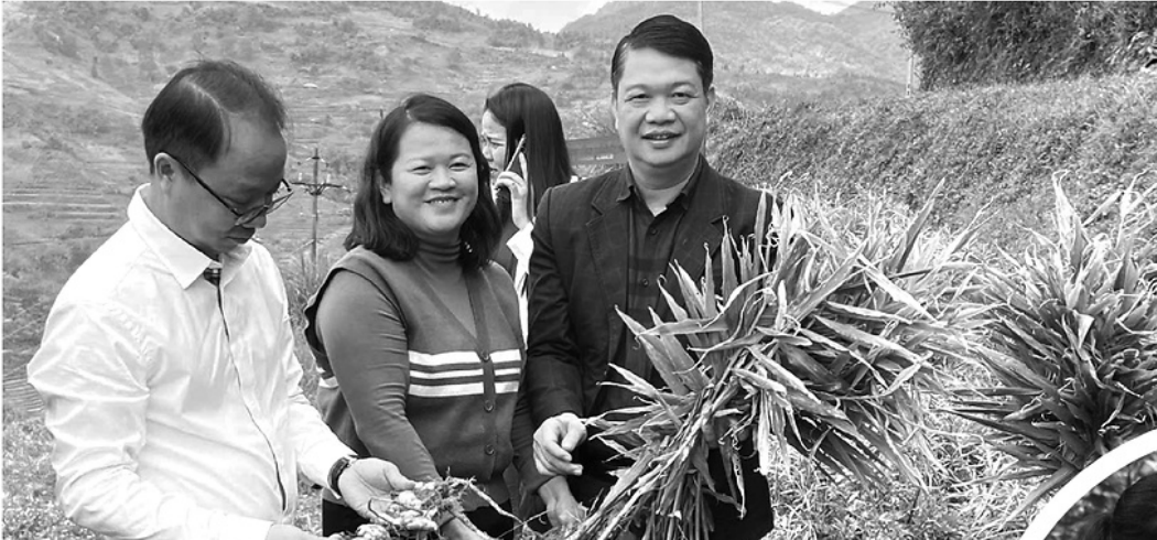
◀ Lãnh đạo Sở Nông nghiệp và Môi trường thăm vùng nguyên liệu gừng của Hợp tác xã Dược liệu Sơn Ý.