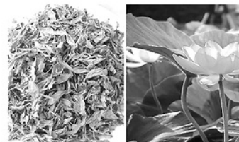
Lá sen, dược liệu phòng ngừa và chữa trị các chứng bệnh do nắng nóng.

Thang bổ tỳ, tiêu ury, giảm mệt mỏi: Lá sen tươi 1 tào, gạo tẻ 60g; gạo