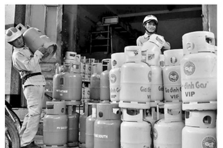
Giá bán lẻ gas tăng mạnh, gây áp lực chi tiêu đối với nhiều hộ gia đình.

Hiện nguồn cung gas trong nước vẫn phụ thuộc lớn vào nhập khẩu. Dù các doanh nghiệp đã chủ động phương án dự trữ, tăng cường nhập khẩu, song áp lực cung - cầu trong ngắn hạn vẫn hiện