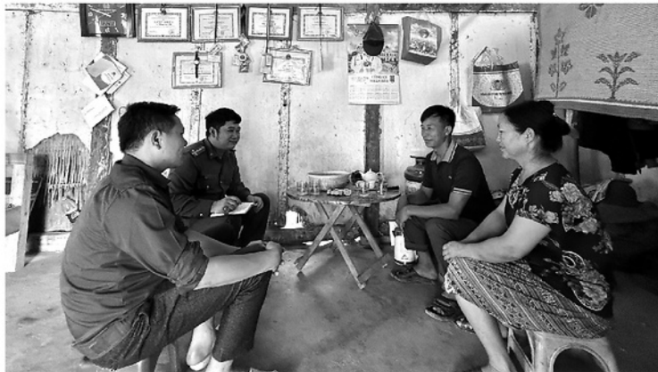
Công an xã Hùng Lợi tuyên truyền, nâng cao ý thức chấp hành pháp luật cho người dân thôn Đồng Trang.

GIỮA ĐẠI NGÀN XÃ HÙNG LỢI, TRONG CÁI NẮNG HÈ TRẢI DÀI TRÊN NHỮNG TRIỂN NÚI, CÓ MỘT "KHO LƯƠNG" ĐẶC BIỆT VẮN LẶNG LẼ TỒN TẠI SUỐT GẦN HAI THẬP KỶ. KHÔNG KHÓA CỬA, KHÔNG NGƯỜI TRÔNG COI, NHƯNG CHƯA BAO GIỜ VƠI CẠN. ĐÓ LÀ QUỸ GẠO CỨU ĐÓI CỦA THÔN ĐỒNG TRANG, NƠI TỪNG HẠT THÓC ĐƯỢC GÓP LẠI BẰNG CẢ TẤM LÒNG, ÂM THẨM VUN Đắp NHỮNG MÙA NO ẤM VÀ GÌN GIỮ NGHĨA TÌNH NƠI VÙNG SÂU, VÙNG XA.