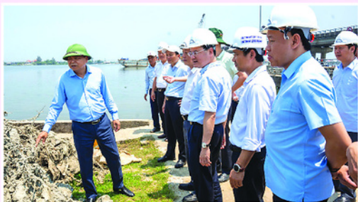
Đoàn kiểm tra Bộ NN&MT làm việc với TP. Huế về dự án hồ chứa nước Ô Lâu Thượng.

THEO dự báo của Đài Khí tượng thủy văn TP. Huế, mùa khô năm 2026 mực nước trên các lưu vực sông tại Huế biến đổi nhỏ, mực nước trung bình xấp xỉ và cao hơn mức trung bình nhiều năm và cao hơn so với cùng kỳ năm 2025.