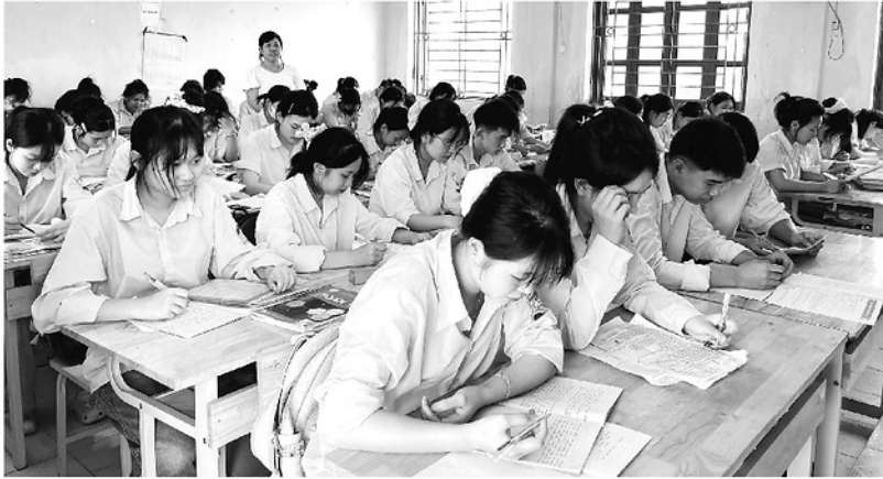
Trường THPT Sơn Nam tổ chức ôn tập cho học sinh lớp 12.

Chỉ còn chưa đầy 2 tháng nữa, Kỳ thi tốt nghiệp THPT năm 2026 sẽ diễn ra. Thời điểm này được xem là "nước rút" trong công tác ôn tập cho học sinh lớp 12. Các trường THPT trên địa bàn tỉnh đang đẩy mạnh các giải pháp nâng cao chất lượng ôn tập, tăng cường dạy phụ đạo miễn phí cho những học sinh có học lực yếu đồng thời chuẩn bị các điều kiện cho kỳ thi sắp tới.