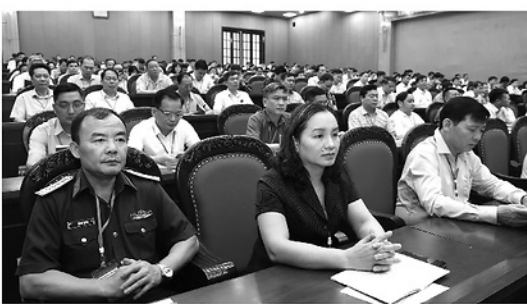
Đoàn đại biểu tỉnh Tuyên Quang tham dự hội nghị.

Phát biểu chỉ đạo tại hội nghị, đồng chí Phó Trưởng Ban Tuyên giáo và Dân vận Trung ương Triệu Tài Vinh