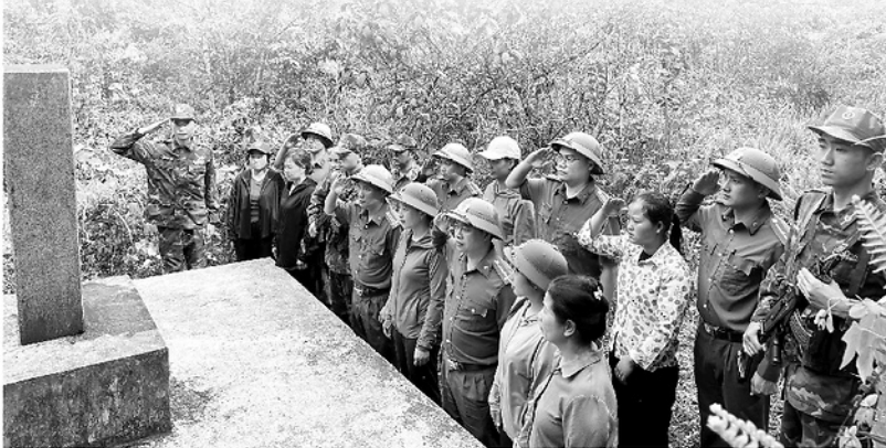
Cán bộ Biên phòng và Nhân dân xã Nghĩa Thuận trước cột mốc biên giới.

Giữa trùng điệp đá xám nơi vùng cao biên giới với hơn 277 km đường biên uốn lượn qua những triền núi dựng đứng, nơi 442 cột mốc quốc giới lặng lẽ giữa mây mù, nơi đây, không có những công trình đồ sộ nhưng lại có một "pháo đài" bền bỉ và kiên cố được dựng nên từ niềm tin trong lòng Nhân dân với Đảng. "Pháo đài" ấy hiện hữu trong từng mái nhà, từng nương ngô, từng bước chân tuần tra lặng lẽ giữa mưa rừng gió núi. Ở đây, mỗi đảng viên chính là một "cột mốc sống" lặng thầm mà kiên trung, bình dị mà bền bỉ, giữ đất, giữ dân, giữ cả hồn cốt biên cương.