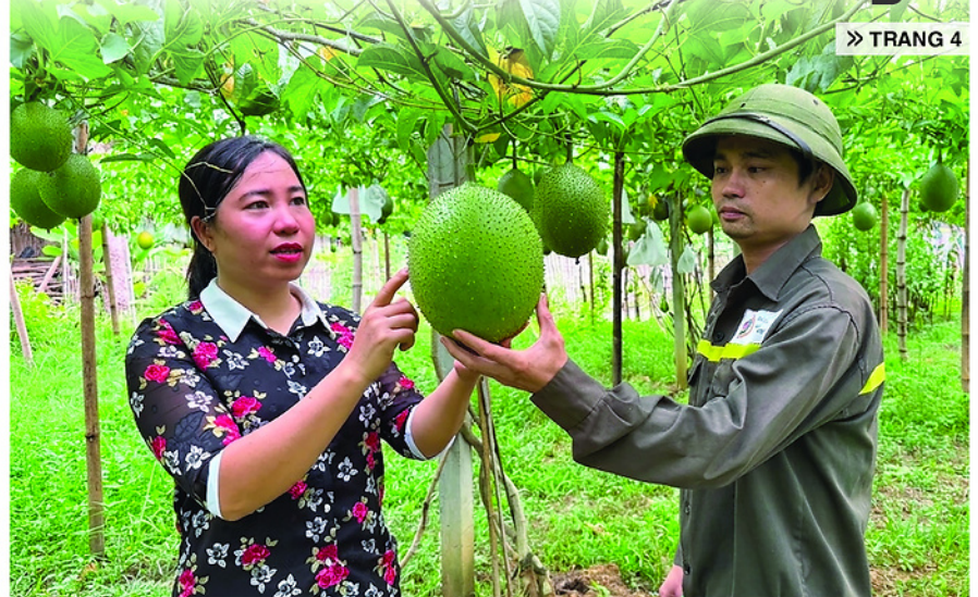
Người dân xã Tân Mỹ chuyển đổi diện tích đất kém hiệu quả sang trồng đặc sản xuất khẩu.

Bài, ảnh: NGUYỄN ĐẠT - ĐOÀN THỨ - DUY TUẤN