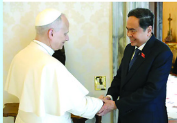
Bài đăng trên ACI Stampa về chuyến thăm Italia của Chủ tịch Quốc hội Trần Thanh Mẫn.

hoạt động và phát triển theo quy định của Hiến pháp và pháp luật.