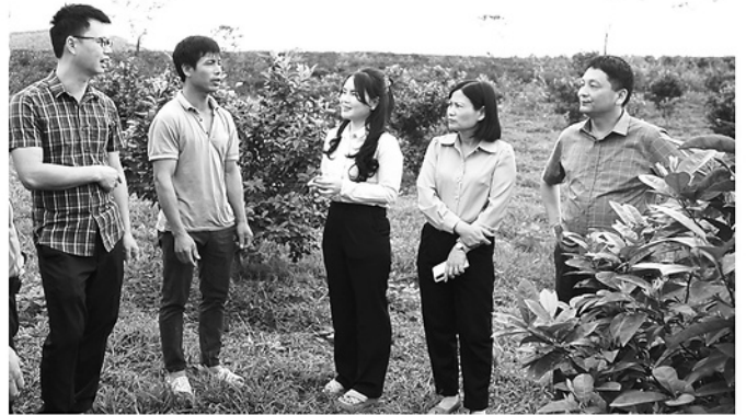
Lãnh đạo xã Sơn Dương kiểm tra mô hình trồng chanh trên địa bàn.

Năm 2026, Tuyên Quang đặt mục tiêu tăng trưởng 2 con số một cách thực chất và bền vững. Đóng góp vào mục tiêu này, kết quả từ sản xuất nông nghiệp được tính đánh giá là một trong những đóng góp quan trọng, khi lĩnh vực này vẫn được xem là trụ đỡ của nền kinh tế. Tuy nhiên, câu chuyện tăng trưởng ngành Nông nghiệp và chuyển đổi cơ cấu cây trồng vật nuôi không phải là câu chuyện “thấy người ta ăn khoai cũng vác mai đi đào”. Để bền vững, cần một chiến lược bài bản từ phía chính quyền và sự thay đổi cốt lõi từ người nông dân.