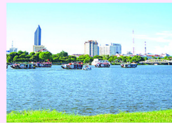
Với lượng nước như hiện tại của 3 hồ chứa lớn Tả Trạch, Bình Điền, Hương Điền, có thể bảo đảm duy trì dòng chảy liên tục về sông Hương khoảng 70m 3 /s cho đến cuối tháng 8.

Cùng với đó là các dự án xây dựng, nâng cấp hồ chứa như Thủy Cam, Khe Triết, hay cải tạo các công trình hiện hữu như đập Cửa Lác, đập Tháo Long... nhằm nâng cao năng lực tích trữ và điều tiết nước.