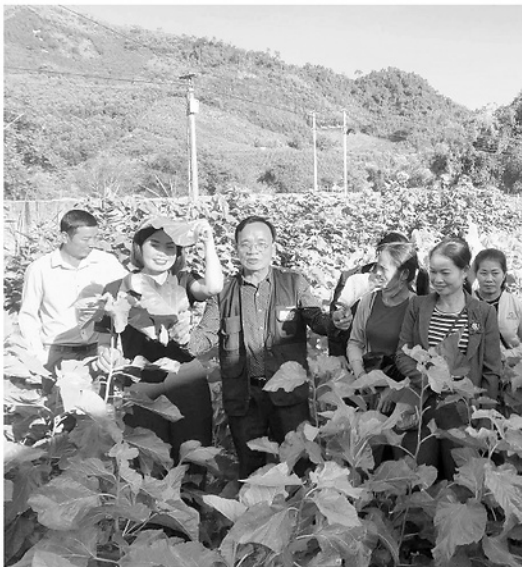
Mô hình liên kết trồng dâu tại xã Yên Nguyên.