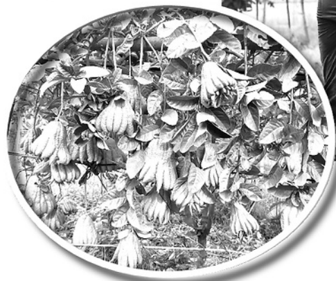
Cây Phật thủ là hướng đi mới trong phát triển kinh tế của xã Yên Sơn.