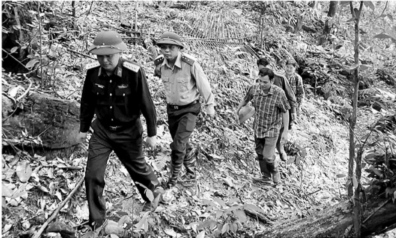
Ban CHQS xã Hùng Lợi phối hợp với các lực lượng tuần tra, bảo vệ rừng nghiêm.

Đầu tháng 1-2026, Tuyên Quang đã tổ chức lại 124 Ban Chỉ huy Quân sự cấp xã, phường trực thuộc Bộ Chỉ huy Quân sự tỉnh. Trong đó có 68 xã trọng điểm về quốc phòng được bố trí 10 biên chế và 56 xã còn lại được bố trí 8 biên chế. Cùng với lực lượng công an, lực lượng quân đội chính quy được đưa về xã đã thể hiện tầm nhìn chiến lược của Đảng, khi đây là nơi gần Dân nhất, lắng nghe Dân, giải quyết nhanh nhất, hiệu quả nhất những vấn đề phát sinh từ Nhân dân.