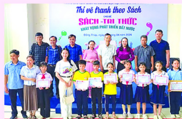
Ban tổ chức Hội thi tỉnh Đồng Tháp trao giải cho thí sinh thi vẽ tranh theo sách với chủ đề "Sách - Tri thức - Khát vọng phát triển đất nước".

Mỗi tác phẩm thể hiện ước mơ, hoài bão, góp phần xây dựng quê hương, đất nước. Nhiều tác phẩm mang thông điệp sâu sắc, khuyến khích văn hóa đọc, lan tỏa giá trị của tri thức trong cuộc sống. Tại hội thi, Ban tổ chức đã trao 90 giải cho các thí sinh có tác phẩm tiêu biểu về nội dung, bố cục, màu sắc, gồm: 3 giải Nhất, 15 giải Nhì, 27 giải Ba và 45 giải Khuyến khích.