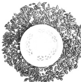
Trà móng rồng.