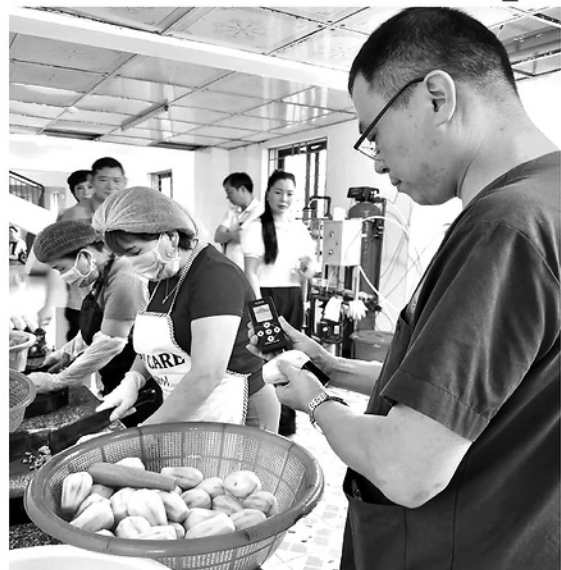
Đoàn kiểm tra HĐND xã Nhữ Khê kiểm tra công tác đảm bảo an toàn thực phẩm tại bếp ăn Trường Mầm non Đội Bình.