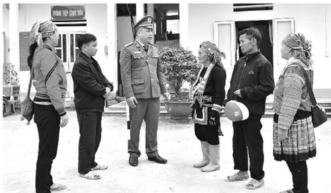
Công an xã Liên Hiệp tuyên truyền, vận động Nhân dân tích cực tham gia đấu tranh, tố giác tội phạm ma túy.