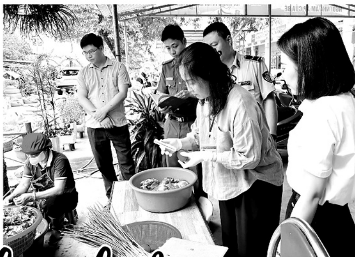
Đoàn kiểm tra liên ngành của UBND phường An Tường kiểm tra thực phẩm tại Trường Mầm non Hoàng Khai.

Bữa ăn bán trú tại các trường học không chỉ góp phần đảm bảo dinh dưỡng, giúp học sinh phát triển toàn diện mà còn liên quan trực tiếp đến sức khỏe, sự an toàn của học sinh. Tuy nhiên, thực tế hiện nay cho thấy, công tác đảm bảo an toàn thực phẩm trong bữa ăn bán trú còn không ít bất cập, tiềm ẩn nhiều nguy cơ đáng lo ngại.