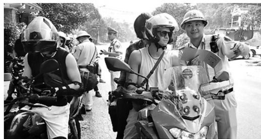
Đội Cảnh sát giao thông đường bộ số 3, Phòng Cảnh sát giao thông, Công an tỉnh Tuyên Quang tuyên truyền người thuê ngoài thuê xe tự lái đảm bảo TTATGT.

tục, nhiều khúc cua tay áo, tầm nhìn hạn chế, một bên là vách núi, một bên là vực sâu với những người chưa có kinh nghiệm lái xe đường đèo, đặc biệt là du khách nước ngoài, việc xử lý tình huống bất ngờ là rất khó khăn, chỉ một sai sót nhỏ cũng có thể dẫn đến hậu quả nghiêm trọng. Nhiều du khách thuê xe mô tô dung tích lớn nhưng chưa quen điều khiển, chưa nắm rõ kỹ thuật ôm cua, đổ đèo hay kiểm soát tốc độ trên đường trơn trượt; không ít trường hợp sử dụng giấy phép lái xe không hợp lệ hoặc không