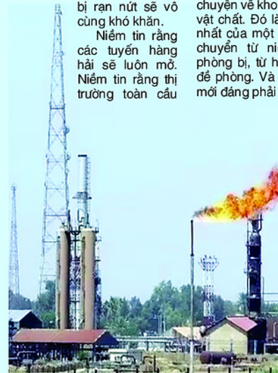
Cơ sở khai thác dầu Al-Sharara ở Libya.

Vì thế, "kỷ nguyên tích trữ" không đơn thuần là câu chuyện về kho bãi hay dự trữ vật chất. Đó là biểu hiện rõ nhất của một thế giới đang chuyển từ niềm tin sang phòng bị, từ hội nhập sang đề phòng. Và đó là tín hiệu mới đáng phải suy ngẫm.