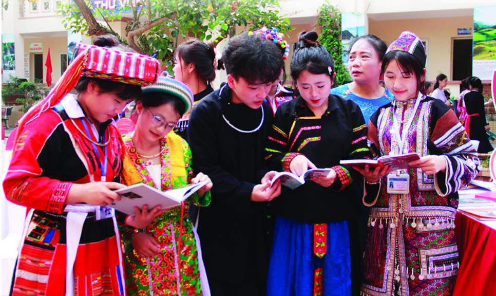
Học sinh các trường trên địa bàn tỉnh tham gia Ngày Sách và Văn hóa đọc.