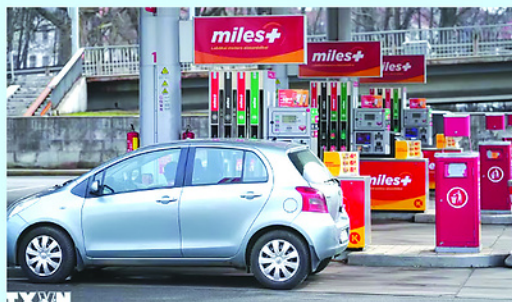
Một trạm xăng ở Riga, Latvia.

TRONG nhiều thập niên, kinh tế thế giới vận hành trên một giả định giản đơn là hàng hóa sẽ luôn lưu thông, năng lượng sẽ luôn được vận chuyển, nguyên liệu thiết yếu sẽ luôn có thể mua được nếu chấp nhận mức giá phù hợp. Chính niềm tin ấy đã tạo nên các chuỗi cung ứng xuyên biên giới, cùng tư duy "không cần giữ nhiều trong kho vì thị trường sẽ đáp ứng đúng lúc". Nhưng giờ đây, giả định đó đang tan vỡ. Thế giới đang trượt sâu hơn vào kỷ nguyên địa kinh tế, nơi chính sách kinh tế trở thành công cụ của cạnh tranh chính trị. Khi các tuyến hàng hải có thể bị phong tỏa, xuất khẩu có thể bị hạn chế, nguyên liệu chiến lược có thể bị dùng như đòn bẩy gây sức ép, thì thị trường không còn thuần túy là nơi trao đổi, mà trở thành một mặt trận mới của quyền lực.