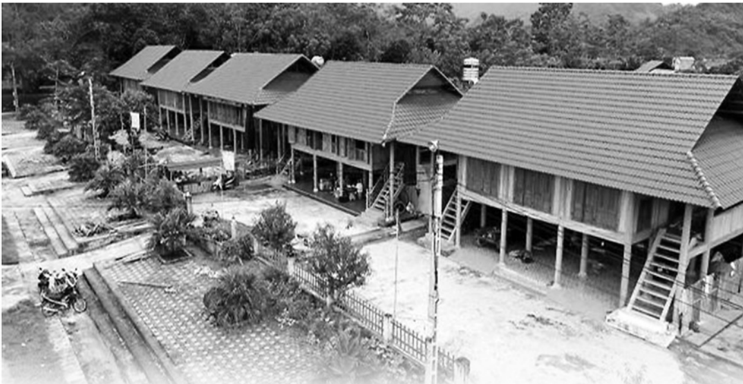
Thực hiện quy hoạch chung, xã Kim Bình vẫn giữ nguyên đặc trưng văn hóa nhà sàn.