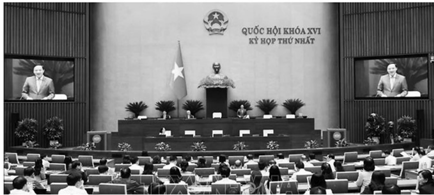
Phó Chủ tịch Quốc hội Nguyễn Khắc Định điều hành phiên họp.

Dự thảo Nghị quyết của Quốc hội về việc thành lập thành phố Đồng Nai trực thuộc Trung ương; Dự thảo Nghị quyết của Quốc hội về cơ chế, chính sách đặc thù để xử lý vi phạm pháp luật về đất đai của tổ chức, cá nhân xảy ra trước khi Luật Đất đai năm 2024 có hiệu lực và giải pháp tiếp tục tháo gỡ khó khăn, vướng mắc cho các dự án tồn đọng, kéo dài.