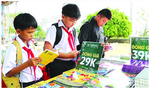
Học sinh trải nghiệm không gian Ngày hội Sách Đà Nẵng 2026 tại xã Phú Ninh.

NHÂN Ngày Sách và Văn hóa đọc Việt Nam 21/4/2026, Ban Quản lý Phố Sách Hà Nội kết hợp với các đơn vị xuất bản, phát hành tổ chức chuỗi chương trình giao lưu tác giả - tác phẩm, giới thiệu sách mới cùng nhiều chương trình khuyến mãi hấp dẫn dành cho bạn đọc. Chuỗi hoạt động được tổ chức từ ngày 21 - 27/4, từ 8 giờ đến 22 giờ hằng ngày, tại Phố Sách Hà Nội (phố 19/12, phường Cửa Nam, thành phố Hà Nội), với sự tham gia của 14 đơn vị xuất bản, phát hành sách,