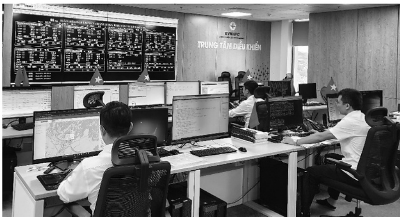
Cán bộ Công ty Điện lực Tuyên Quang vận hành hệ thống lưới điện, đảm bảo cung cấp điện ổn định cho người dân và doanh nghiệp trên địa bàn.

Sự ra đời của Nghị quyết số 79-NQ/TW của Bộ Chính trị đã khẳng định mạnh mẽ vai trò dẫn dắt của kinh tế Nhà nước trong giai đoạn phát triển mới. Trước yêu cầu tái cơ cấu và hội nhập sâu rộng, khu vực này cần tiếp tục đổi mới toàn diện để nâng cao hiệu quả, tạo động lực phát triển.