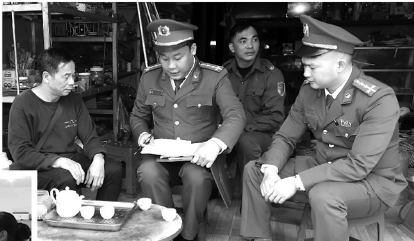
▲ Tổ Công nghệ số cộng đồng xã Khuôn Lũng tuyên truyền, hướng dẫn người dân ứng dụng công nghệ số trong thực hiện các TTHC và đời sống sinh hoạt hàng ngày.

VỚI CÁCH LÀM BÀI BẢN, LINH HOẠT, LẤY NGƯỜI DÂN LÀM TRUNG TÂM, TUYÊN QUANG ĐÃ TỪNG BƯỚC PHỔ CẬP TRI THỨC, KỸ NĂNG SỐ VÀ ĐƯA CÔNG NGHỆ ĐẾN GẦN HƠN VỚI NGƯỜI DÂN MỘT CÁCH THIẾT THỰC TRONG ĐỜI SỐNG HÀNG NGÀY.