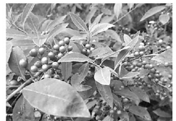
Cây màng tang.

4 lần, chiêu với nước nóng pha thêm ít giấm. - Rối loạn tiêu hóa do thức ăn sống, lạnh: Quả màng tang 8g, lá chè 4g, mơ lông 12g. Sắc uống ngày 1 thang, chia làm 3 - 4 lần. - Tỳ vị kém, ăn kém, tiêu hóa kém, đầy bụng: Quả màng tang 10g, gừng 5g, trần bì 5g, gừng nướng bỏ 5g, sắc uống ngày 1 lần. Dùng 3 - 5 ngày. - Viêm xoang mũi dị ứng: Người bệnh dễ hắt hơi, sổ mũi, nghẹt mũi, nhức đầu, đau môi gây khi thời tiết thay đổi: Lá màng tang 60g, toàn cây viễn chí 100g, lá ngải cứu 60g, đều dùng tươi, nấu với nước pha ấm, tắm toàn thân và gội đầu mỗi sáng 1 lần, làm 7 ngày liên tiếp.