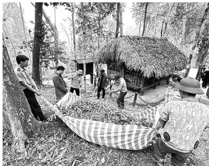
Hạt Kiểm lâm rừng đặc dụng Tân Trào và người dân thu dọn thực bì dưới tán rừng ngăn ngừa nguy cơ cháy rừng.