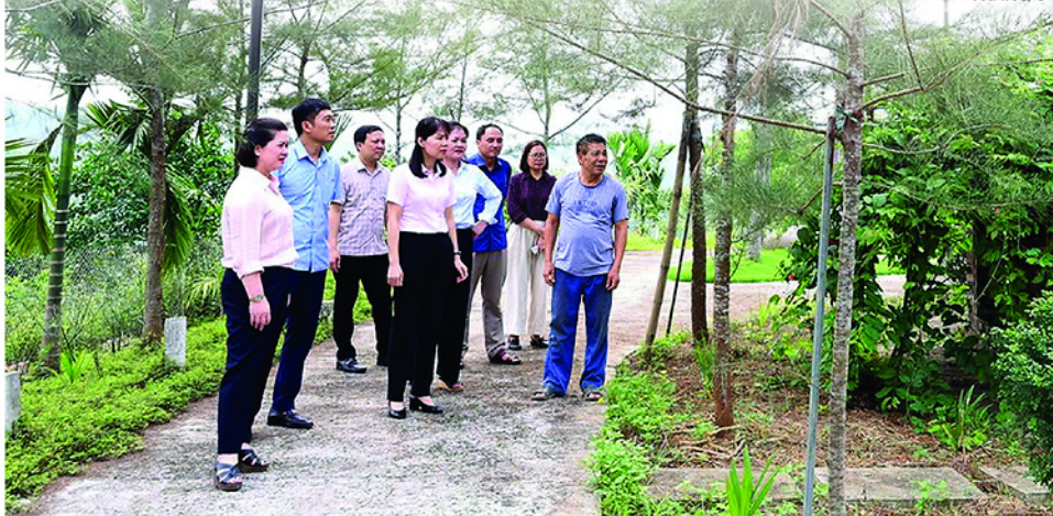
Thường trực Đảng ủy xã Yên Sơn khảo sát mô hình du lịch sinh thái trên địa bàn.