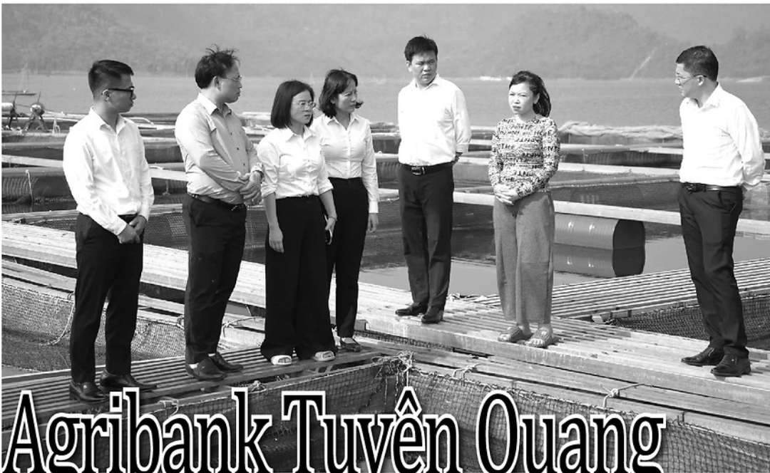
Ban lãnh đạo Agribank Chi nhánh Tuyên Quang khảo sát mô hình vay vốn phát triển kinh tế của HTX Thủy sản Làng Chài tại vùng lòng hồ thủy điện Tuyên Quang.