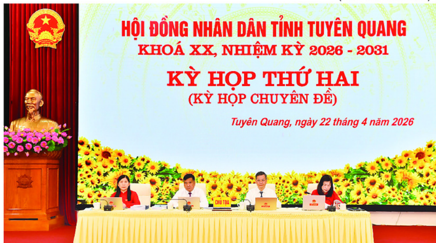
Các đồng chí Thường trực HĐND tỉnh chủ trì Kỳ họp thứ hai HĐND tỉnh khóa XX.