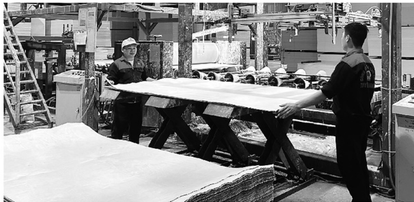
Công ty TNHH Sao Việt Tuyên Quang sử dụng nguồn nhân lực chất lượng cao vận hành dây chuyền sản xuất ván ép tự động hóa, góp phần nâng cao năng suất và chất lượng sản phẩm.

TRIỂN KHAI NGHỊ QUYẾT SỐ 68-NQ/TW CỦA BỘ CHÍNH TRỊ, KINH TẾ TƯ NHÂN ĐƯỢC XÁC ĐỊNH LÀ MỘT TRONG NHỮNG ĐỘNG LỰC QUAN TRỌNG CỦA NỀN KINH TẾ. TRONG BỐI CẢNH YÊU CẦU VỀ NĂNG LỰC CẠNH TRANH, CHUYỂN ĐỔI SỐ VÀ HỘI NHẬP NGÀY CÀNG CAO, VIỆC NÂNG CAO CHẤT LƯỢNG NGUỒN NHÂN LỰC TRỞ THÀNH YÊU CẦU TẤT YẾU, CÓ Ý NGHĨA QUYẾT ĐỊNH ĐỐI VỚI SỰ PHÁT TRIỂN BỀN VỮNG CỦA KHU VỰC KINH TẾ TƯ NHÂN.