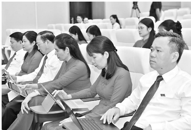
Các đại biểu dự kỳ họp.

Kỳ họp cũng quyết định một số cơ chế, chính sách thực hiện cụ thể hóa