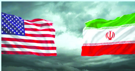
Quốc kỳ Mỹ và Quốc kỳ Iran.