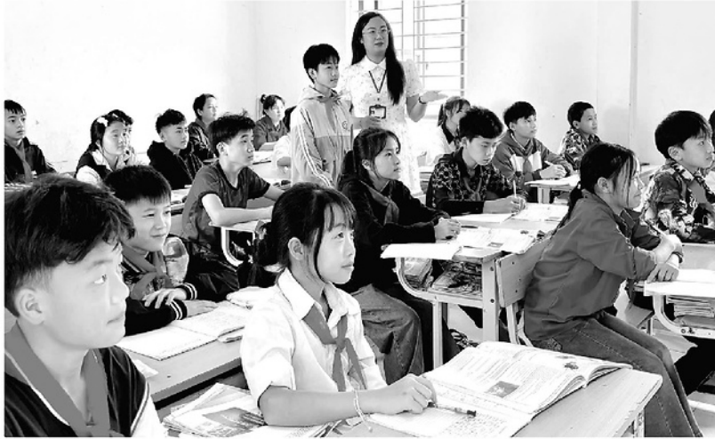
Trường Phổ thông Dân tộc Bán trú THCS Lũng Chinh, xã Sùng Máng cần bổ sung thêm giáo viên, nhằm tiếp tục nâng cao chất lượng giảng dạy và học tập cho học sinh.

Thực hiện Nghị quyết số 71-NQ/TW của Bộ Chính trị về đột phá phát triển giáo dục và đào tạo, một trong những nhiệm vụ then chốt là xây dựng đội ngũ nhà giáo đủ về số lượng, đồng bộ về cơ cấu, đáp ứng yêu cầu đổi mới căn bản, toàn diện. Tuy nhiên, thực tiễn tại các địa bàn vùng sâu, vùng xa cho thấy, việc thu hút và giữ chân giáo viên vẫn là "nút thắt" lớn, cần sớm được tháo gỡ bằng các giải pháp đồng bộ, mang tính đặc thù.