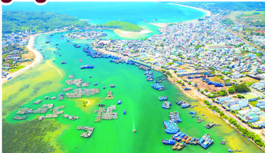
Quảng Ngãi coi phát triển đô thị gắn với biển là xu thế tất yếu.

VỚI đường bờ biển dài hơn 130 km, Quảng Ngãi từ lâu đã được xem là địa phương có nhiều tiềm năng phát triển kinh tế biển. Dọc theo dải ven biển của tỉnh là hàng loạt bãi biển đẹp như Mỹ Khê, Sa Huỳnh, Châu Thuận Biển... cùng hệ thống đảo ven bờ và đặc biệt là đảo Lý Sơn - điểm đến du lịch nổi tiếng của miền Trung.