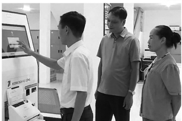
◀ Chuyên viên tại điểm tiếp nhận số 2, Trung tâm Phục vụ hành chính công tỉnh hướng dẫn người dân nộp hồ sơ trực tuyến.