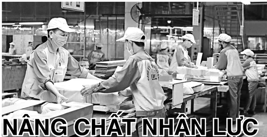
Công nhân Công ty cổ phần Woodland Tuyên Quang đóng gói sản phẩm gỗ xuất khẩu trên dây chuyền sản xuất hiện đại.