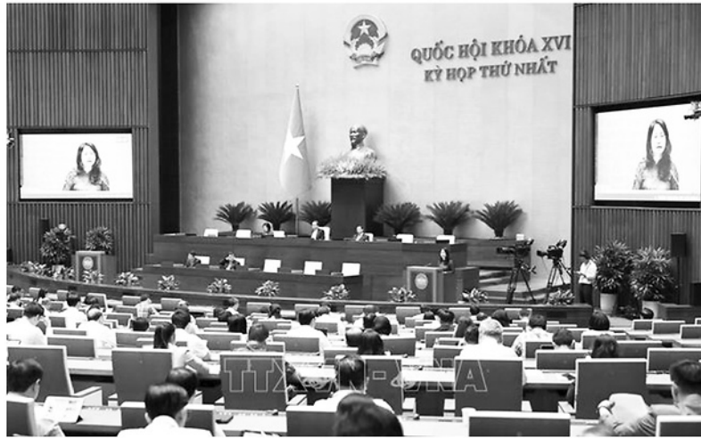
Bộ trưởng Bộ Văn hóa, Thể thao và Du lịch Lâm Thị Phương Thanh phát biểu giải trình, làm rõ một số vấn đề đại biểu Quốc hội nêu.

Dự thảo Nghị quyết đã xác định rõ nguồn lực phát triển văn hóa gồm nguồn ngân