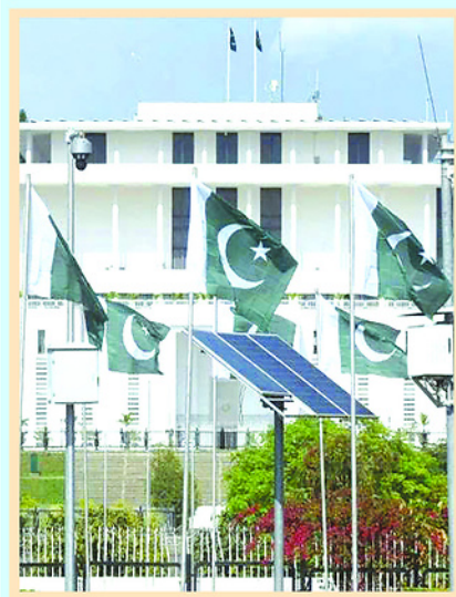
Thủ đô Islamabad, Pakistan là nơi đóng vai trò trung gian trong thỏa thuận ngừng bắn tạm thời mới đây giữa Mỹ và Iran.