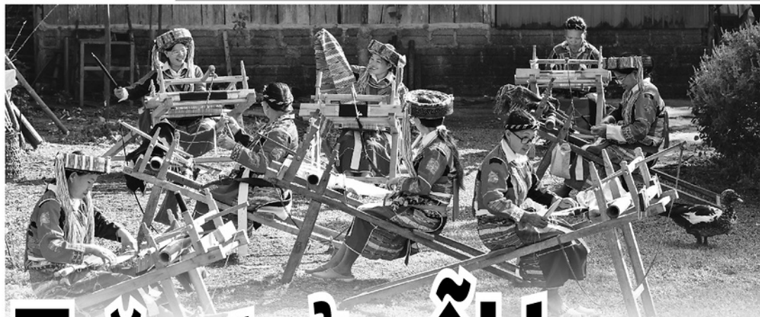
◀ Tổ hợp tác thêu dệt thổ cẩm thôn Thượng Minh, xã Tân Quang.