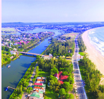
Quảng Ngãi đẩy mạnh phát triển du lịch, dịch vụ gắn liền với biển.

Dự án có quy mô gần 94 ha, được định hướng phát triển thành khu đô thị sinh thái ven biển phục vụ khoảng 4.000 cư dân trong tương lai. Điểm đáng chú ý của dự án là sự tham gia quy hoạch của Sweco, Tập đoàn tư vấn kiến trúc và kỹ thuật đô thị đến từ châu Âu với hơn 130 năm kinh nghiệm.