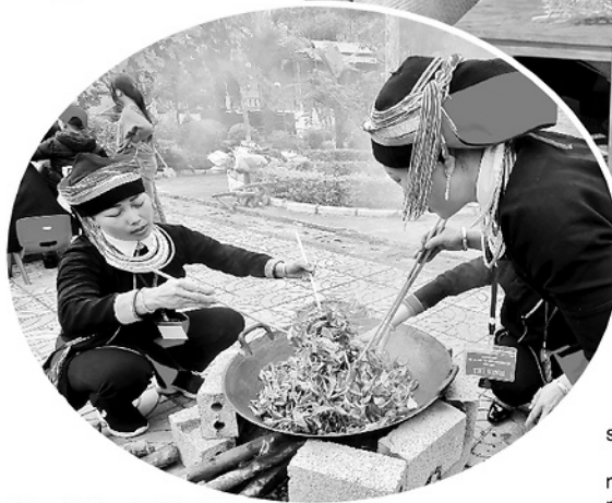
Phụ nữ dân tộc Sán Chỉ, giữ nghề sao chèo Shan tuyệt truyền thống.

Không chỉ làng dệt thổ cẩm của xã Tân Quang, nhiều làng nghề trong tỉnh hiện cũng dần vắng bóng do nhiều yếu tố như: Thiếu hụt thế hệ kế cận do người trẻ có xu hướng rời làng đi tìm kiếm công việc tại các thành phố lớn. Thị trường thu hẹp do các sản phẩm thủ công tinh xảo phải cạnh tranh với hàng công nghiệp giá rẻ. Ngoài ra còn có những khó khăn về nguyên liệu... Vì vậy, để những làng nghề không chỉ