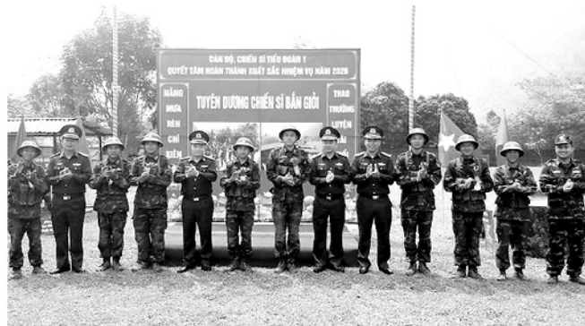
Tuyên dương những chiến sỹ mới bắn giỏi tại Tiểu đoàn 1, Trung đoàn 877.

TRONG THÁNG ĐẦU HUẤN LUYỆN NĂM 2026, TRUNG ĐOÀN 877, THUỘC BỘ CHQS TỈNH TUYÊN QUANG ĐÃ TRIỂN KHAI ĐỒNG THỜI NHIỀU NHIỆM VỤ HUẤN LUYỆN CHIẾN SỸ MỚI TRONG ĐIỀU KIỆN THỜI TIẾT BIẾN PHỨC TẠP, LỰC LƯỢNG PHẢN TÁN. TUY NHIÊN, VỚI SỰ CHỈ ĐẠO SÁT SAO CỦA BỘ CHQS TỈNH VÀ TINH THẦN CHỦ ĐỘNG KHẮC PHỤC KHÓ KHĂN, ĐƠN VỊ ĐÃ HOÀN THÀNH TỐT NHIỆM VỤ, TẠO DẤU ẤN RÕ NÉT TRONG HUẤN LUYỆN CHIẾN SỸ MỚI.