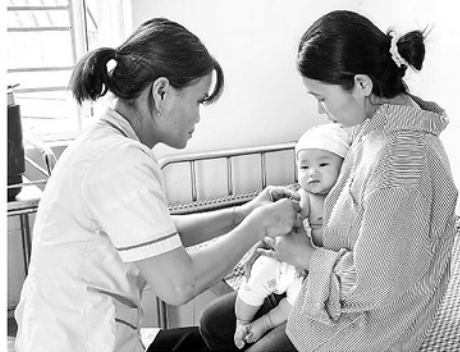
Tiêm phòng vắc-xin định kỳ cho trẻ được triển khai trên địa bàn xã Bạch Đích.

HƯỜNG ỨNG TUẦN LỄ TIÊM CHỦNG THẾ GIỚI (24/4 - 30/4), TỈNH TUYÊN QUANG TIẾP TỤC KHẲNG ĐỊNH VAI TRÒ THEN CHỐT CỦA Y TẾ DỰ PHÒNG TRONG VIỆC ĐẨY LÙI CÁC BỆNH TRUYỀN NHIỄM NGUY HIỂM. VIỆC DUY TRÌ VÀ NÂNG CAO TỶ LỆ TIÊM CHỦNG KHÔNG CHỈ LÀ NHIỆM VỤ NGÀNH Y TẾ MÀ CÒN LÀ CHÌA KHÓA CHIẾN LƯỢC ĐỂ XÂY DỰNG MỘT CỘNG ĐỒNG MIỄN DỊCH VỮNG CHẮC, BẢO VỆ TƯƠNG LAI BỀN VỮNG CHO THẾ HỆ TRẺ.