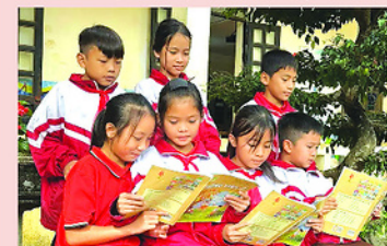
Học sinh là con em đồng bào các dân tộc thiểu số ở xã Tủa Thành truy bài trước giờ vào học.

Thứ ba là Sở Giáo dục và Đào tạo chủ động phối hợp Sở Y tế và các cơ quan liên quan tăng cường kiểm tra, giám sát định kỳ và đột xuất kịp thời phát hiện, chấn chỉnh, xử lý hoặc đề xuất xử lý các vi phạm theo quy định.