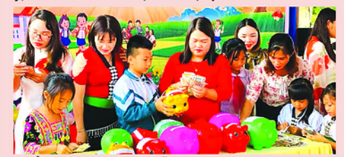
Để có thêm nguồn lực hỗ trợ học sinh nghèo, hoàn cảnh khó khăn, hai năm trước, học sinh và giáo viên ở xã Si Pa Phin tỉnh Điện Biên đã quyên góp để ủng hộ trong phong trào.

Đặc biệt coi trọng công tác bảo đảm an toàn thực phẩm trong trường học, những ngày qua, Ủy ban nhân dân tỉnh Điện Biên đã ban hành nhiều văn bản chỉ đạo, yêu cầu phải thực hiện nghiêm quy định quản lý, bảo đảm an toàn vệ sinh thực phẩm.