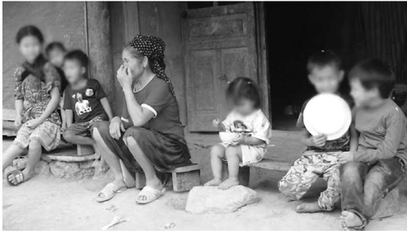
Đồng con, nhiều cháu khiến áp lực mưu sinh đè nặng lên nhiều gia đình ở thôn 6 Minh Tiến, xã Bình Xa.

CÓ NHỮNG NGƯỜI PHỤ NỮ Ở TUỔI BA MƯƠI NHƯNG GƯƠNG MẶT ĐÃ HẸN LÊN VẾT CHÂN CHIM TUỔI XẾ CHIỀU. SUỐT 15 - 20 NĂM RÒNG RÃ, THẾ GIỚI CỦA HỌ CHỈ QUANH QUẢN TỪ CHIẾC GIƯỜNG RA ĐẾN XÓ BẾP VỚI NHỮNG LẮN Ở CỬ NỒI DÀI. KHÔNG PHẢI DO THIẾU THUỐC TRÁNH THAI HAY SỰ QUAN TÂM CỦA CÁN BỘ Y TẾ, MÀ CHÍNH “LUẬT TỤC” VỀ CÁI ĐINH NỔI ĐỜI VÀ TƯ DUY CẢN SỨC NGƯỜI LÀM RẪY ĐÃ BIẾN NGƯỜI PHỤ NỮ THÀNH NHỮNG CHIẾC BÓNG LẶNG LẼ.