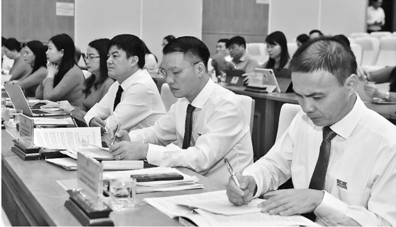
Các đại biểu tham gia Kỳ họp thứ hai Hội đồng nhân dân (HĐND) tỉnh Tuyên Quang khóa XX, nhiệm kỳ 2026 - 2031.

Kỳ họp thứ hai Hội đồng nhân dân (HĐND) tỉnh Tuyên Quang khóa XX, nhiệm kỳ 2026 - 2031 (kỳ họp chuyên đề) diễn ra vào thời điểm có ý nghĩa quan trọng. Đây không chỉ là kỳ họp nhằm xem xét, quyết nghị các nội dung, mà còn là diễn đàn thể hiện rõ bản lĩnh, trí tuệ và trách nhiệm của cơ quan dân cử trước những yêu cầu phát triển mới đặt ra trong giai đoạn hiện nay.