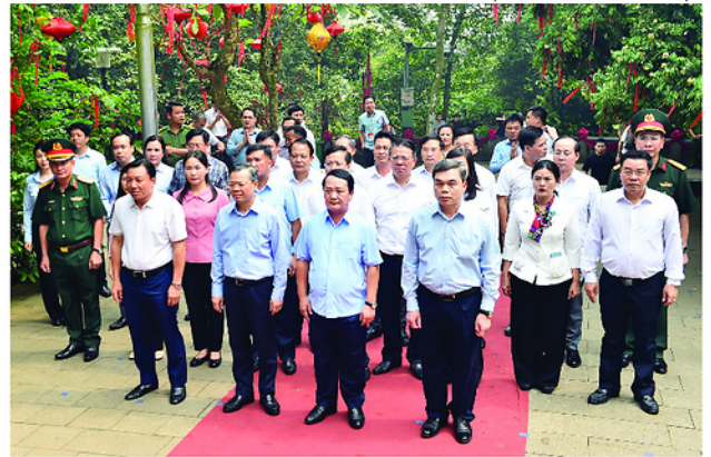
Các đồng chí Thường trực Tỉnh ủy và đại biểu dâng hương các Vua Hùng tại Đền Thượng.