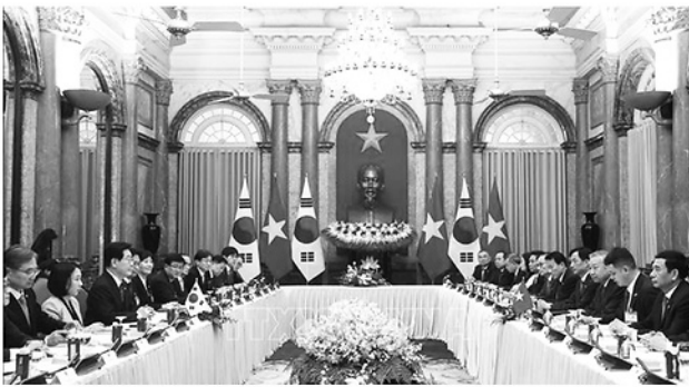
Tổng Bí thư, Chủ tịch nước Tô Lâm hội đàm với Tổng thống Hàn Quốc Lee Jae Myung.

NHẬN lời mời của Tổng Bí thư Ban Chấp hành Trung ương Đảng Cộng sản Việt Nam, Chủ tịch nước Cộng hòa xã hội chủ nghĩa Việt Nam Tô Lâm và Phu nhân, Tổng thống Đại Hàn Dân Quốc Lee Jae Myung và Phu nhân đã thăm cấp Nhà nước tới Việt Nam từ ngày 21 - 24/4/2026.