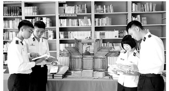
Cán bộ, chiến sỹ trao đổi, đọc sách tại Khu trưng bày mô hình nhà sách của Học viện Hải Quân.

Văn hóa đọc trong Quân chủng Hải quân đã và đang phát triển chiều sâu thông qua