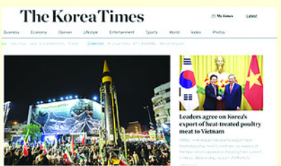
The Korea Times đưa tin về thỏa thuận đạt được giữa Việt Nam và Hàn Quốc trong nhiều lĩnh vực.

The Korea Times đưa tin về thỏa thuận đạt được giữa Việt Nam và Hàn Quốc trong nhiều lĩnh vực khác nhau bao gồm thiết bị y tế, đường sắt, trí tuệ nhân tạo (AI), pin sạc, sở hữu trí tuệ và nội dung