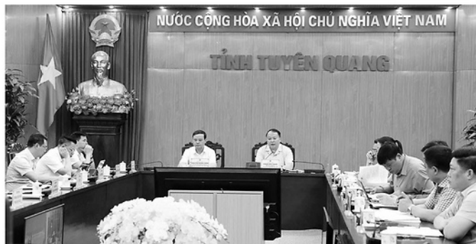
Các đại biểu dự cuộc họp.

SÁNG 23-4, đồng chí Phan Huy Ngọc, Phó Bí thư Tỉnh ủy, Chủ tịch UBND tỉnh chủ trì cuộc họp nghe báo cáo về tiến độ giải quyết các dự án sử dụng vốn ngân sách Nhà nước (NSNN) tồn đọng, kéo dài từ ngày 31-12-2025 trở về trước trên địa bàn tỉnh.