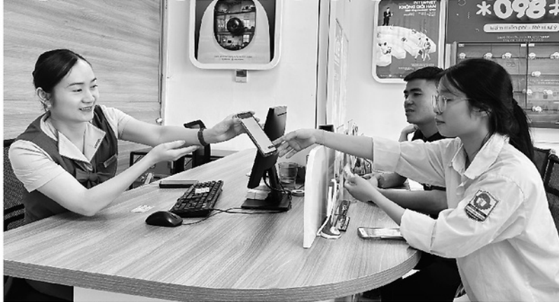
Nhân viên Viettel Tuyên Quang hỗ trợ khách hàng thực hiện thủ tục xác minh thông tin thuê bao.

Thực hiện quy định về chuẩn hóa thông tin thuê bao gắn với cơ sở dữ liệu quốc gia về dân cư, các doanh nghiệp viễn thông trên địa bàn tỉnh đang tập trung nguồn lực, tăng cường công nghệ và nhân lực nhằm hỗ trợ người dân xác thực nhanh chóng, thuận tiện. Qua đó, không chỉ góp phần làm sạch dữ liệu thuê bao mà còn nâng cao an toàn, minh bạch trong môi trường số.