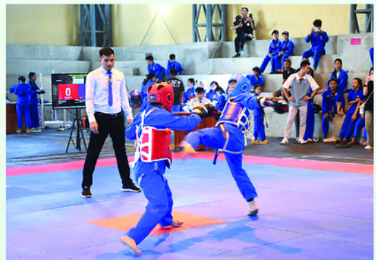
Một trận đấu tại Giải Vovinam mở rộng huyện Hàm Yên năm 2025.

Để phong trào có tính chiều sâu, chuyên nghiệp, những người làm chuyên môn đã chủ động