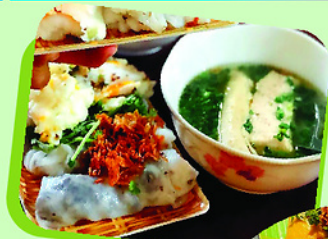
Bánh cuốn hấp dẫn thực khách.

Khi thưởng thức, thực khách không chấm mà thả trọn miếng bánh vào bát nước canh đang tỏa khói, để từng thớ bánh ngấm trọn vị ngọt của xương. Một chút tiêu rừng tẻ nhẹ cùng vài lát măng ớt, rắc chén cay nồng sẽ là nốt nhạc cuối cùng hoàn thiện bản hương vị độc bản này. Cảm giác lớp vỏ bánh mềm mượt tan ngay đầu lưỡi, hòa cùng vị béo của trứng và sự ấm nóng lan tỏa của nước dùng giữa không gian trong lành của vùng cao tạo nên một sự vỗ về ngọt ngào cho tâm hồn. Bánh cuốn phố cổ Đồng Văn vì thế không chỉ là thức quà lót dạ, mà là một lời chào nồng hậu, một mảnh ký ức ấm thực sống động mà bất cứ ai đã một lần nếm thử đều sẽ mang theo nỗi nhớ da diết về dải đất địa đầu Tổ quốc ■