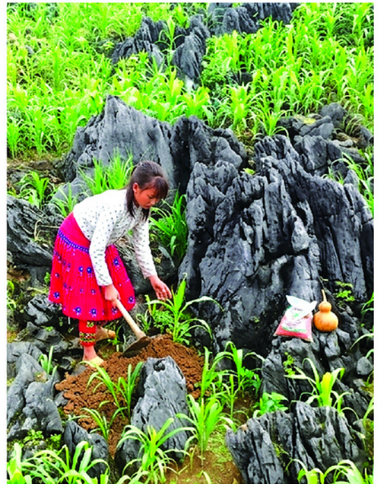
Những nương ngô vươn lên xanh tốt từ lòng đá.

Với phương thức canh tác độc đáo, năm 2014, tri thức thổ canh hốc đá chính thức được công nhận Di sản văn hóa phi vật thể Quốc gia. Sự ghi nhận này không chỉ mang ý nghĩa tôn vinh một kỹ thuật canh tác, mà còn khẳng