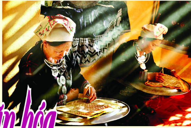
Nghề thủ sếp ong truyền thống đặc sắc.

Không chỉ sở hữu cảnh sắc thiên nhiên bình yên, thôn Khuổi Xoan (xã Minh Quang) còn là nơi lưu giữ trọn vẹn những mạch ngầm văn hóa độc đáo của người Dao Tiền. Đến đây, du khách sẽ được hòa mình vào nhịp sống của người dân bản địa qua những nghi lễ mời rượu nồng hậu, thi tài thổi thùa và những lễ hội truyền thống đậm bản sắc của người Dao Tiền.