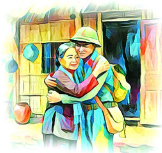
Minh họa: NGỌC AN