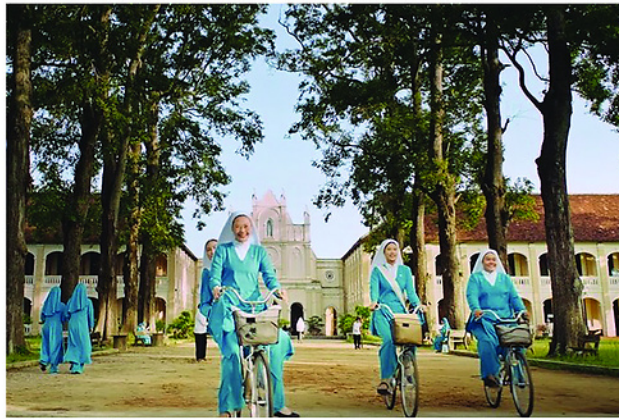
Tiểu Chúng viện Làng Sông (Quy Nhơn) - bối cảnh tu viện giàu chất điện ảnh phim.

Nhưng cũng chính từ đây, khác biệt tôn giáo hiện lên như một ranh giới vô hình, không bùng nổ thành xung đột, nhưng âm thầm bào mòn tình yêu qua định kiến, kỳ vọng gia đình và những lựa chọn tương chừng đúng đắn. Câu chuyện vì thế không tìm đến kịch tính, mà lắng sâu vào những xung đột nội