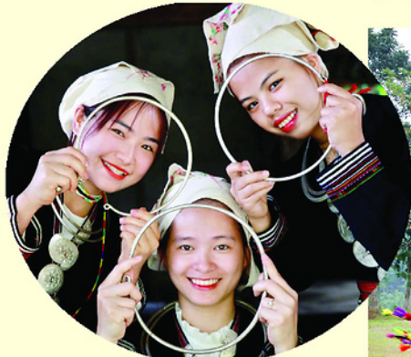
Phụ nữ Dao Tiền rạng rỡ với trang sức bạc.