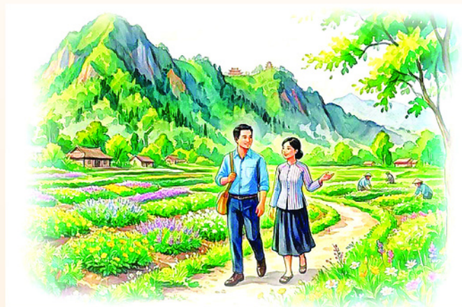
Minh họa: BÍCH NGỌC

chỉ chắc ăn một vụ về cải tạo thả cá kết hợp cấy lúa nhưng giá nông sản thấp lại bấp bênh nên kinh tế vẫn eo hẹp.