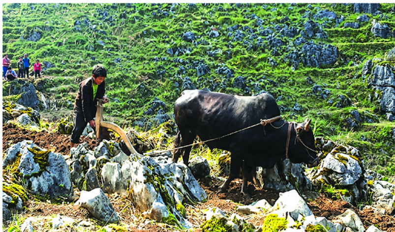
Người Mông xã Đồng Văn canh tác trên nương đá.

KHÍ HẬU KHÔ HẠN, ĐỊA HÌNH HIỂM TRỞ, ĐẤT ĐẠI KHAN HIẾM VÀ DỄ BỊ RỬA TRỜI... LÀ NHỮNG KHẮC TÍNH CỦA SẢN XUẤT NÔNG NGHIỆP. NHƯNG CỘNG ĐỒNG CÁC DÂN TỘC TRÊN CAO NGUYÊN ĐÁ ĐỒNG VĂN KHÔNG BỎ CUỘC, HỌ MIỆT MÀI TÌM CÁCH CHINH PHỤC THIÊN NHIÊN ĐỂ MƯU SINH, ĐÚC KẾT KINH NGHIỆM LÂU ĐỜI VÀ TRI THỨC BẢN ĐỊA, SÁNG TẠO NÊN PHƯƠNG THỨC CANH TÁC ĐỘC ĐÁO, GỌI LÀ THỔ CANH HỐC ĐÁ.