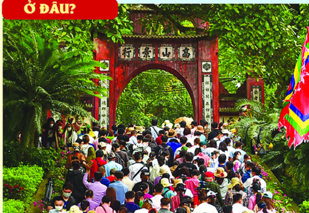
Đông đảo người dân về dự Đại lễ Giỗ Tổ Hùng Vương.

HAI ngày cuối tuần 25 và 26/4, khán giả có thể hòa mình vào không khí tâm linh của Đại lễ Giỗ Tổ Hùng Vương. Trên sóng TTV và tại Lotte Cinema Tuyên Quang cũng tiếp tục có nhiều bộ phim hấp dẫn, đáp ứng nhu cầu thưởng thức, giải trí của khán giả trong dịp cuối tuần.