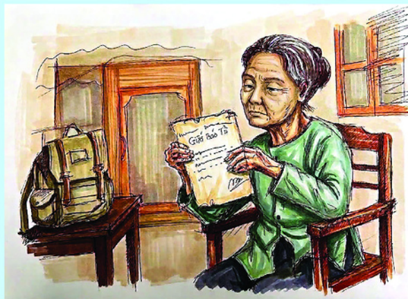
Minh họa: XUÂN ĐỨC

Hơn nửa thế kỷ sau ngày đất nước giải phóng, tôi vẫn thường tự hỏi, có bao nhiêu lá thư chưa kịp gửi về cho người thương đã mãi nằm lại trong túi áo những người lính trẻ? Có bao