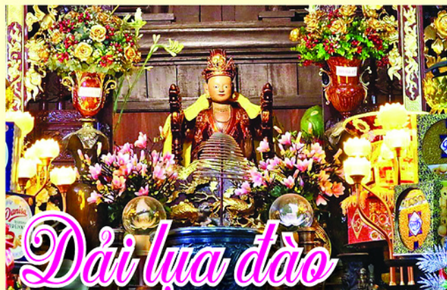
Độc bản tượng Mẫu Âu Cơ thờ tại Cung Cấm (Thượng cung) của ngôi đền.