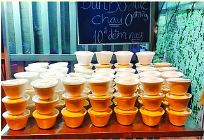
Những phần ăn được đóng gói cẩn thận, thuận tiện cho người nhận mang đi trong đêm.

TỐI đến, khi nhiều hàng quán đã đóng cửa, tại một góc nhỏ ở địa chỉ 372/19 tỉnh lộ 10, phường Bình Trị Đông, TP.HCM vẫn sáng đèn. Nơi đó, những phần ăn nóng hổi được chuẩn bị đều đặn mỗi đêm, không phải để bán, mà để trao đi.