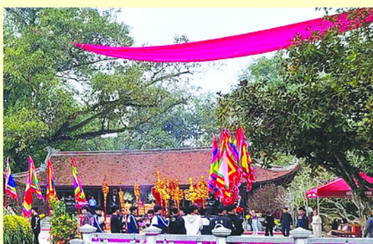
Dải lụa đào tại Đền Mẫu Âu Cơ vẫn rực rỡ, thắm tươi như tình Mẹ tự muôn đời, kết nối con cháu Lạc Hồng.

Truyền thuyết kể rằng, khi thấy các con đã trưởng thành, trang ấp đã trù phú đẹp tươi; ngày 25 tháng Chạp năm Nhâm Thìn, Mẹ Âu Cơ thay xiêm áo, giũ lại dải khăn lụa đào và theo các Tiên nữ bay về trời. Mẹ cố bay thật thấp để nhìn thấy con cháu và nơi ở lần cuối, rồi thả dải khăn lụa đào vương trên cây đa cổ thụ.