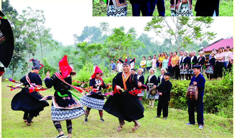
Một điệu múa truyền thống của người Dao Tiền.