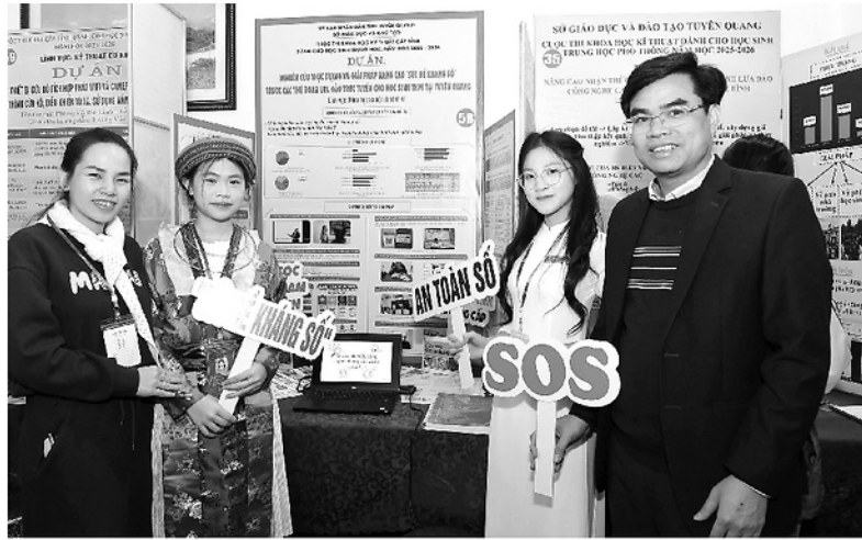
Học sinh Trường Phổ thông Dân tộc nội trú THPT tỉnh tham gia Cuộc thi Khoa học kỹ thuật cấp tỉnh với dự án về nâng cao sức đề kháng số trước các thủ đoạn lừa đảo trực tuyến cho học sinh.

Trong thời gian qua, qua công tác nắm tình hình trên không gian mạng Công an tỉnh đã kịp thời phát hiện và xử lý một số trường hợp có hành vi chia sẻ, đăng thông