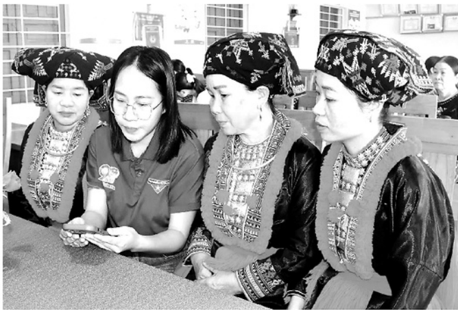
Cán bộ ở cơ sở hướng dẫn người dân thôn Xít Xa, xã Bạch Xa tiếp cận nền tảng “Mặt trận số”.