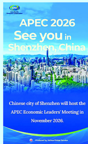
Trung Quốc là nước chủ nhà của Năm APEC 2026.

Việc thúc đẩy kết nối số thông qua chuỗi sự kiện này không chỉ đơn thuần là sự liên kết về hạ tầng, mà là nỗ lực tạo ra một khu vực vực châu Á - Thái Bình Dương gắn kết hơn, nơi mọi cá nhân và