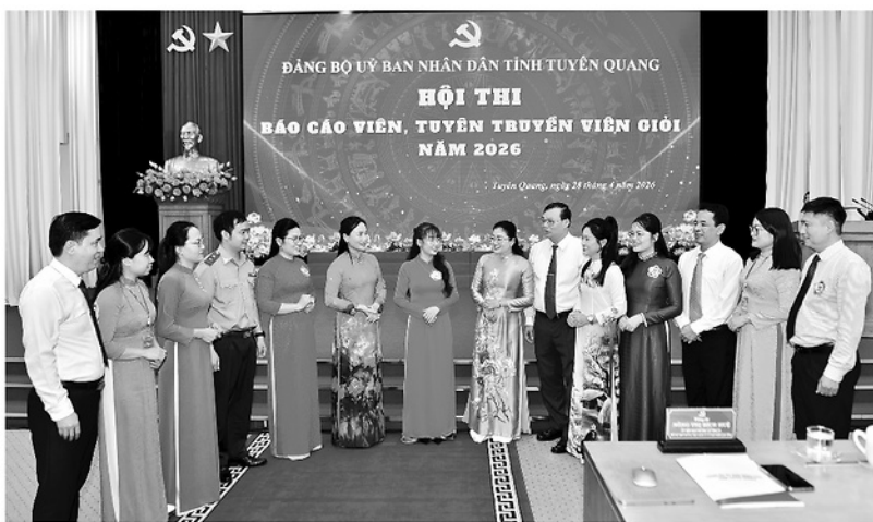
Các thành viên Ban Tổ chức, Ban Giám khảo trao đổi cùng các thí sinh tham gia hội thi.

Ngày 28-4, Đảng bộ UBND tỉnh tổ chức thành công Hội thi Báo cáo viên, Tuyên truyền viên giỏi năm 2026. Hội thi không chỉ là dịp đánh giá chất lượng đội ngũ báo cáo viên, tuyên truyền viên mà còn góp phần lan tỏa sâu rộng các nghị quyết của Đảng, tạo chuyển biến mạnh mẽ từ nhận thức đến hành động trong cán bộ, đảng viên và Nhân dân; đồng thời khẳng định vai trò “cầu nối” của đội ngũ báo cáo viên, tuyên truyền viên trong đưa nghị quyết của Đảng vào thực tiễn cuộc sống.