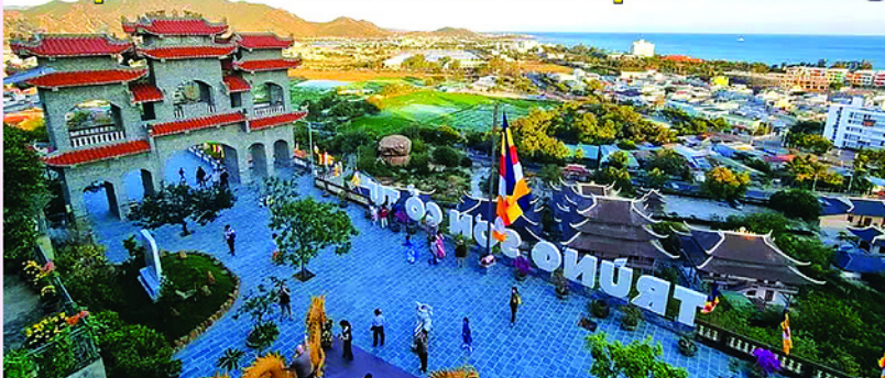
Du khách tham quan Trùng Sơn Cổ Tự (phường Ninh Chữ, Khánh Hòa).

hình thành, đưa du khách đến với không gian di sản để tìm hiểu kiến trúc, lịch sử, tín ngưỡng, đồng thời trực tiếp tham gia các hoạt động truyền thống.