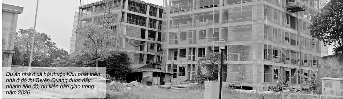
Dự án nhà ở xã hội thuộc Khu phát triển... ... nhà ở đô thị Tuyên Quang được đẩy... ... nhanh tiến độ, dự kiến bàn giao trong... ... năm 2026.

Kỳ vọng về nhà ở xã hội của người... ... dân ngày càng cụ thể, gắn với nhu cầu... ... về những căn hộ vừa túi tiền, thủ tục... ... minh bạch và môi trường sống đầy đủ... ... tiện ích thiết yếu. Tuy nhiên, để hiện... ... thực hóa những kỳ vọng ấy là hành... ... trình nhiều thách thức, đòi hỏi sự kiên... ... định trong điều hành, linh hoạt về cơ... ... chế và quyết tâm cao của các cấp,