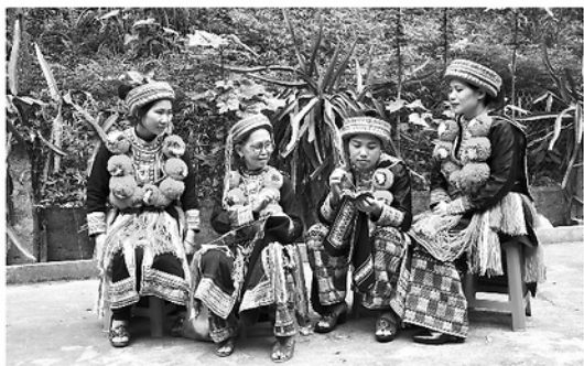
Người Dao Đỏ thôn Phú Lâm, xã Yên Lập hoài niệm về tên thôn cũ Khau Hán.

Văn hóa Việt Nam hạt nhân cơ bản là văn hóa làng xã. Làng được gắn kết với nhau bằng huyết thống dòng họ, những hương ước, tín ngưỡng riêng biệt bền vững. Trong chiều dài phát triển của dân tộc, rất nhiều lần làng bị sáp nhập theo sự điều chỉnh hành chính. Sáp nhập là để tinh gọn, song phía sau ấy chính là những xáo trộn thâm lắng trong tâm thức người dân.