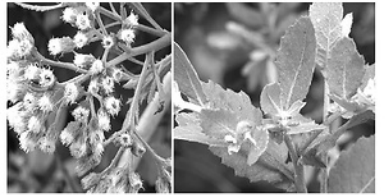
Cúc tằm có tác dụng thông kinh lạc giúp giảm đau nhức xương khớp.

- Dùng với muối (tăng tác dụng): Cho 1 nắm lá cúc tằm vào chảo rang lửa nhỏ cùng 1/2 bát muối hạt đến khi nóng đều. Sau đó tắt bếp, rưới ít rượu trắng, đảo nhanh rồi bọc vào khăn và chườm lên