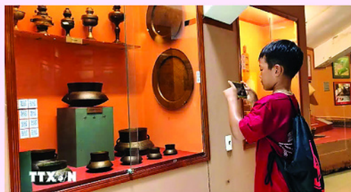
Học sinh tham gia buổi ngoại khóa tìm hiểu lịch sử, văn hóa tại Bảo tàng tỉnh Khánh Hòa (cơ sở 2, phường Phan Rang).

Việc phát huy di sản gắn với du lịch trải nghiệm đang mở ra hướng đi mới cho Khánh Hòa, không chỉ nâng cao sức hấp dẫn của điểm đến mà còn góp phần bảo tồn, lan tỏa các giá trị văn hóa truyền thống, hướng tới phát triển kinh tế - xã hội bền vững.