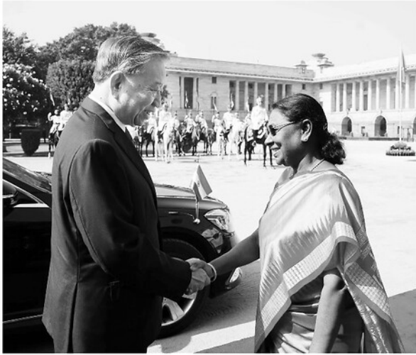
Tổng thống Ấn Độ Droupadi Murmu đón Tổng Bí thư, Chủ tịch nước Tô Lâm.

Hiện nay, hai nước có hơn 20 cơ chế hợp tác song phương trên các lĩnh vực và đã ký kết nhiều văn kiện hợp tác quan trọng định hướng cho quan hệ. Hợp tác kinh tế - thương mại tăng trưởng rất tích cực, với kim ngạch thương mại song phương đạt khoảng 15-16 tỷ USD/năm trong giai đoạn gần đây. Ấn Độ hiện nằm trong nhóm 10 đối tác thương mại lớn nhất của Việt Nam. Đầu tư hai