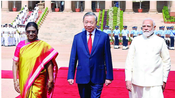
Tổng thống Droupadi Murmu và Thủ tướng Narendra Modi đồng chủ trì Lễ đón trọng thể Tổng Bí thư, Chủ tịch nước Tô Lâm thăm cấp Nhà nước tới Cộng hòa Ấn Độ.