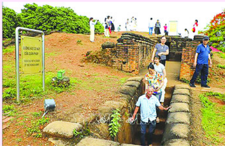
Du khách tham quan Di tích Đồi A1.

Tỉnh Điện Biên đã tổ chức nhiều hoạt động triển lãm tranh, ảnh, giới thiệu tư liệu hiện vật, sách báo về Điện