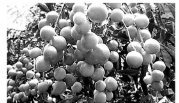
Quả quất hồng bì.

Trị ho gà: Lấy mỗi loại 50g gồm: Quất hồng bì đã bỏ hạt và phơi khô, vỏ rễ dâu (tang bạch bì), củ sả, hạnh nhân, kinh giới, ô mai, cát cánh, cam thảo, bạc hà củ bách bộ. Cho tất cả các nguyên liệu vào ấm sắc đặc có lại và cho thêm đường uống tùy theo lứa tuổi và tình trạng bệnh nặng hay nhẹ