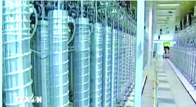
Bên trong cơ sở hạt nhân Natanz của Iran.

Về phía các bên, Tổng thống Volodymyr Zelensky xác nhận Kiev sẽ thực hiện ngừng bắn, trong khi Tổng thống Vladimir Putin đã chỉ thị