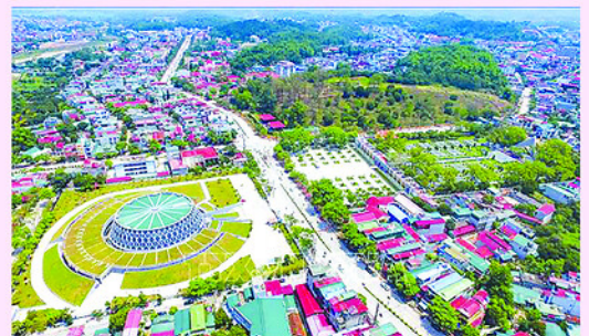
Điện Biên hôm nay đang từng bước thay đổi diện mạo, hiện hữu rõ nét qua nhịp sống sôi động và sự phát triển đồng bộ từ đô thị đến nông thôn.

Công tác giảm nghèo bền vững đạt nhiều kết quả rõ nét, tỷ lệ hộ nghèo đa chiều giảm còn khoảng 17,66%, bình quân mỗi năm giảm gần 4%. Hàng chục nghìn hộ dân được hỗ trợ về nhà ở, sinh kế,