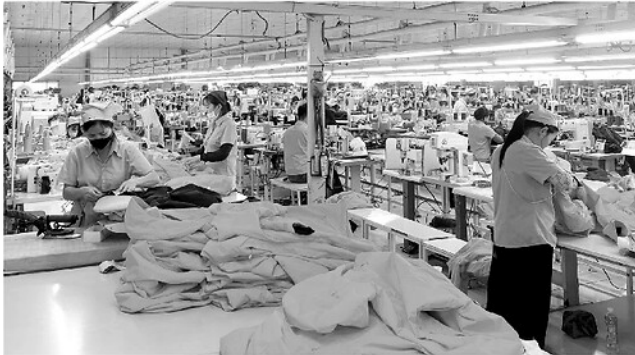
Lao động làm việc tại Công ty TNHH MSA-YB, Khu Công nghiệp Long Bình An, phường Bình Thuận.

“Bão giá” là nỗi lo nặng trĩu và thường trực của đại đa số người dân, từ lao động phổ thông đến công nhân trong các khu chế xuất, khu công nghiệp. Từ những khu “chợ công nhân”, bữa cơm còn canh cánh nỗi lo, cho đến bài toán chi tiêu lại thêm nhiều phép trừ, cho thấy đời sống của họ còn nhiều khó khăn giữa cơn “bão giá”.