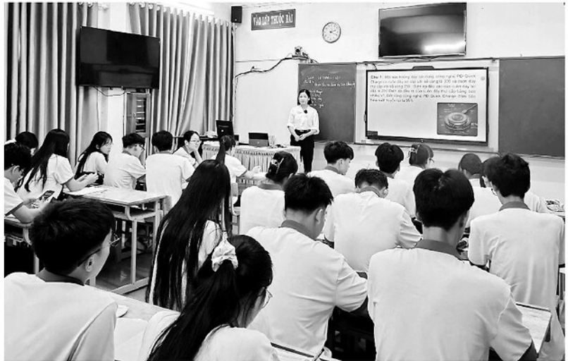
Giáo viên Trường Phổ thông Dân tộc nội trú THPT tỉnh thông minh trong giờ ôn tập cho học sinh lớp 12.

Kỳ thi tốt nghiệp THPT năm 2026 sẽ diễn ra vào ngày 11 và 12-6-2026, sớm hơn gần nửa tháng so với kỳ thi năm trước. Hiện nay, các trường THPT đang đẩy mạnh công tác ôn tập cho học sinh lớp 12. Đặc biệt việc tăng cường ứng dụng công nghệ thông tin, chuyển đổi số để nâng cao chất lượng dạy học và ôn tập được ngành Giáo dục đặc biệt quan tâm, học sinh được học tập trong không gian mở có sự định hướng từ nhà trường và giáo viên.