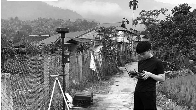
Đơn vị tư vấn thực hiện đo đạc trắc đạc, trắc ngang, bình đồ, thủy văn toàn bộ hướng tuyến cao tốc giai đoạn 2.

chuẩn bị tốt nhất các điều kiện thực hiện công tác bồi thường GPMB dự án.