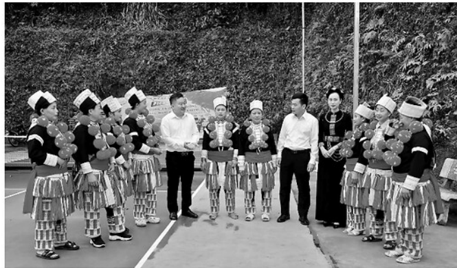
Lãnh đạo xã Thượng Nông trò chuyện, lắng nghe tâm tư, nguyện vọng của Nhân dân.

Trong hành trình sáp nhập địa giới hành chính, nếu "thế trận lòng Dân" là thành trì thì đội ngũ cán bộ cơ sở chính là "gốc" của thành trì ấy. Chính sự tận tụy, bản lĩnh và tư duy đổi mới của những người "gắn Dân nhất" đã trở thành hạt nhân quy tụ sức mạnh đại đoàn kết toàn dân. Giữ vững cái "gốc" cán bộ chính là chìa khóa để xây dựng thế trận lòng Dân vững chắc trong kỷ nguyên mới.