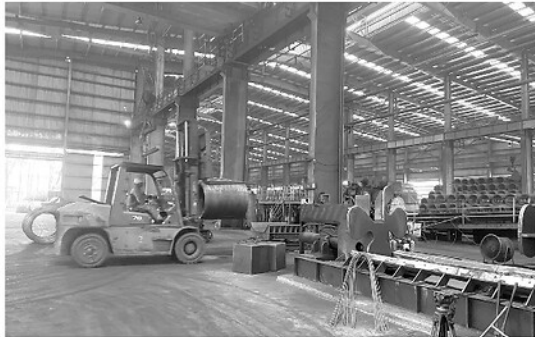
Sản xuất thép tại Công ty Gang thép Tuyên Quang.