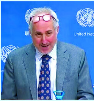
Ông Stéphane Dujarric, người phát ngôn của Tổng Thư ký Liên hợp quốc.

Liên hợp quốc hoan nghênh các tuyên bố ngừng bắn đơn phương từ cả phía Nga và Ukraine , đồng thời bày tỏ kỳ vọng đây có thể là "bước đệm" hướng tới một lệnh ngừng bắn toàn diện và giải pháp hòa bình lâu dài.