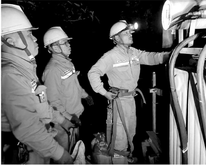
Công nhân Công ty Điện lực Tuyên Quang kiểm tra lưới điện, đảm bảo phục vụ điện cho sản xuất, sinh hoạt.

Việc điều chỉnh khung giờ tính giá điện cao điểm theo Quyết định số 963/QĐ-BCT ngày 22-4-2026 của Bộ Công Thương sẽ tạo ra những tác động trực tiếp đến hoạt động sản xuất, kinh doanh. Trong bối cảnh giá điện giờ cao điểm cao gấp khoảng 2 - 3 lần so với giờ thấp điểm, ngành Điện, doanh nghiệp, hộ kinh doanh, mỗi gia đình trên địa bàn tỉnh đã chủ động triển khai các giải pháp thích ứng nhằm giảm chi phí, duy trì ổn định hoạt động.