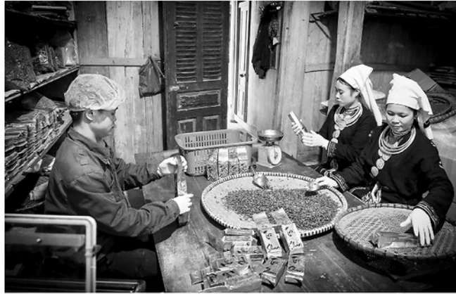
Sản phẩm chè Shan tuyết của HTX Sơn Trà, xã Hồng Thái đạt tiêu chuẩn OCOP 5 sao, đã từng bước khẳng định được vị thế trên thị trường.

ăn quả sạch nổi bật của xã Hùng An. Năm 2018, HTX Trồng rau, hoa quả sạch thôn Hùng Tâm được thành lập, đẩy mạnh hỗ trợ và hướng dẫn người dân áp dụng kỹ thuật trồng, chăm sóc cây ăn quả theo hướng hữu cơ. Nhiều hộ mạnh dạn chuyển đổi diện tích vườn, đổi kém hiệu quả sang trồng các loại quả như bưởi, ổi, táo, nhãn, hồng xiêm... Nhờ thực hiện đúng quy trình kỹ thuật, sản phẩm của bà con luôn được đánh giá cao về chất lượng, giá bán ổn định.