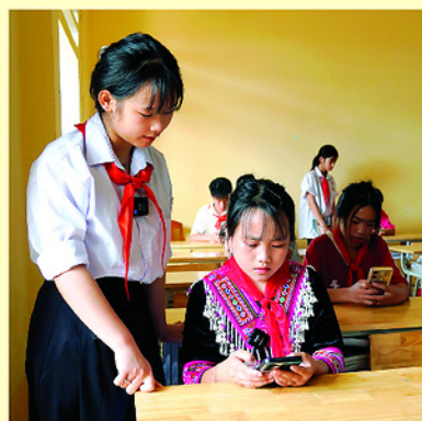
Thành viên Hội đồng Trẻ em xã Pà Vây Sủ khảo sát, ghi nhận tiếng nói học sinh tại Trường PTDTBT THCS Pà Vây Sủ.