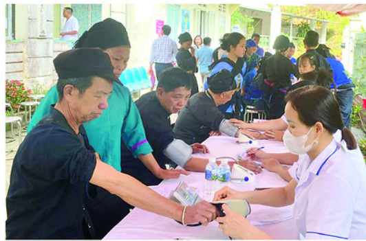
Cán bộ y tế khám bệnh cho người dân.

TRẠM Y tế xã Thành Tín vừa tổ chức chương trình khám sức khỏe định kỳ cho Nhân dân trên địa bàn. Chương trình được tổ chức trong 3 ngày, từ ngày 5 đến 7-5, với trên 7.600 lượt người dân được khám, tư vấn và quản lý sức khỏe. Chương trình khám sức khỏe định kỳ được tổ chức nhằm phát hiện sớm, sàng lọc các bệnh lý cấp tính và mạn tính; tư vấn chăm sóc sức