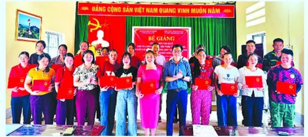
Sau khóa đào tạo nghề, các học viên có thể áp dụng kiến thức vào thực tiễn sản xuất, kinh doanh.

UBND xã Thuận Hòa phối hợp với Công ty TNHH Nghiên cứu, Đào tạo và Chuyển giao công nghệ Hà Nội tổ chức các lớp đào tạo nghề cho lao động nông thôn trên địa bàn.