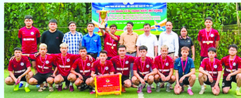
Đội FC Mobile giành chức vô địch.

ĐOÀN Thanh niên xã Yên Hoa vừa tổ chức giải bóng đá đoàn viên thanh niên năm 2026 (mở rộng). Giải đấu thu hút sự tham gia của 8 đội bóng đến từ các chi đoàn trong và ngoài địa bàn xã cùng các doanh nghiệp. Sau 4 ngày tranh tài với nhiều pha bóng đẹp mắt, hấp dẫn, Ban Tổ chức đã trao giải Nhất cho đội