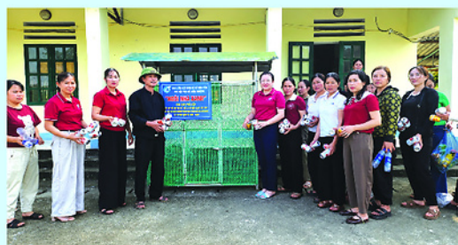
Mô hình "Ngôi nhà xanh" gây quỹ hỗ trợ phụ nữ, trẻ em có hoàn cảnh khó khăn.

HỘI Liên hiệp phụ nữ xã Tiên Yên vừa ra mắt hai mô hình bảo vệ môi trường tại thôn Thượng.