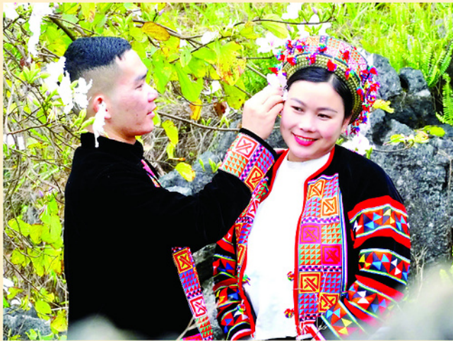
Khâu Vai - nơi những chàng trai, cô gái tìm về mối tình xưa.