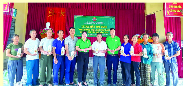
Đại diện thành viên mô hình "Đồng ruộng sạch, sản xuất sạch" ra mắt.