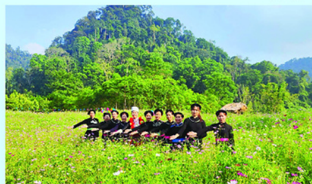
Thôn Bản Bung, thiên đường các loài hoa.