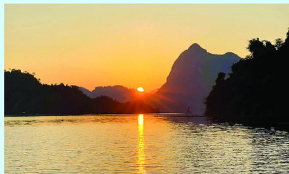
Hồ thủy điện Tuyên Quang là điểm du lịch độc đáo miền sơn cước.