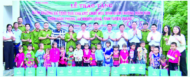
Đại diện Cục Cảnh sát phòng, chống tội phạm về môi trường trao tặng điểm Trường Mầm non Nậm Phang cho xã Khuôn Lùng.

CỤC Cảnh sát phòng, chống tội phạm về môi trường (Bộ Công an) phối hợp với UBND xã Khuôn Lùng tổ chức lễ trao tặng điểm Trường Mầm non thôn Nậm Phang.