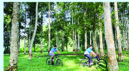
Đạp xe địa hình tại lâm viên Phiêng Bung là trải nghiệm vô cùng thú vị.