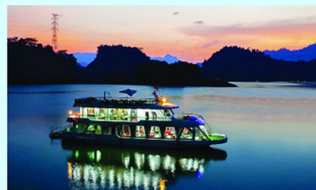
Du thuyền Phượng Hoàng đưa vào hoạt động nâng tầm du lịch xã Nà Hang.