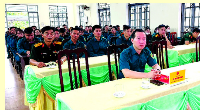
Các học viên tham dự lớp học.

BAN Chỉ huy Quân sự xã Sơn Thủy vừa tổ chức khai mạc huấn luyện dân quân năm 2026. Đợt huấn luyện năm nay, các lực lượng dân quân cơ động xã Sơn Thủy được học tập các nội dung cơ bản về chính trị, pháp luật như Luật Nghĩa vụ quân sự, Luật Phòng thủ dân sự, Luật Lực lượng dự bị động viên; đồng thời nghiên cứu các chủ trương, đường lối của Đảng về nhiệm vụ quốc phòng, quân sự địa phương. Bên