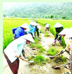
Các hội viên tham gia chỉnh trang đường làng, ngõ xóm tại xã Lâm Bình.

Hoạt động thu hút đông đảo hội viên phụ nữ tham gia với tinh thần trách nhiệm cao, không chỉ làm sạch môi trường sống mà còn nâng cao ý thức giữ gìn vệ sinh, bảo vệ cảnh quan chung trong cộng đồng dân cư.