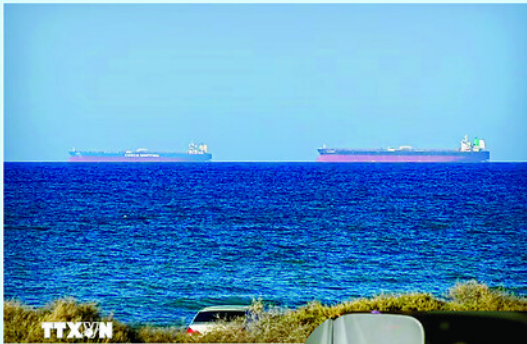
Eo biển Hormuz được ví như yết hầu năng lượng của thế giới.

Tổng thống Donald Trump cho biết ông đã bác bỏ phân hồi của Iran đối với đề xuất của Mỹ nhằm chấm