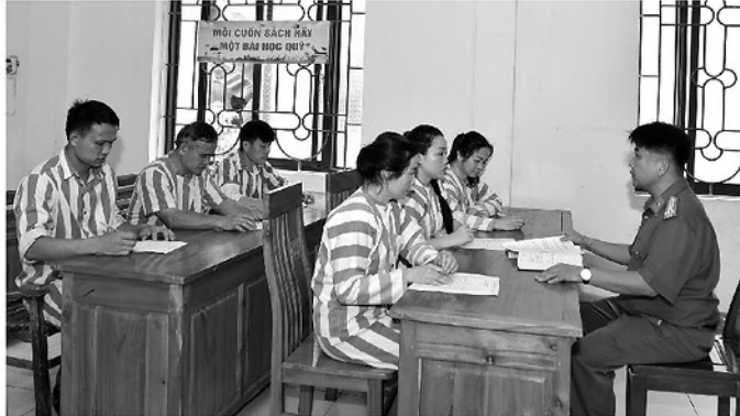
Chỉ huy Phân trại quản lý phạm nhân, thuộc Trại tạm giam số 1, Công an tỉnh hướng dẫn phạm nhân viết đơn xin đặc xá.

Tại Trại tạm giam số 1 và số 2, Quyết định của Chủ tịch nước cùng các hướng dẫn liên quan đã được niêm yết, phổ biến tới 100% phạm nhân đang chấp hành án bằng nhiều hình thức như phát thanh nội bộ, gặp gỡ giáo dục trực tiếp. Việc công khai, minh bạch các tiêu chí xét đặc xá giúp phạm nhân hiểu rõ quyền lợi, nghĩa vụ,