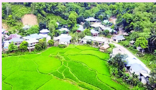
Thiên Phú bình yên giữa màu xanh của núi rừng.

nuôi khát vọng đưa Thiên Phú đến với mọi người, đưa mọi người đến với Thiên Phú.