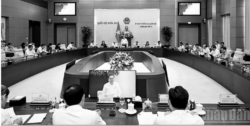
Quang cảnh phiên họp.

Tại phiên họp, Ủy ban Thường vụ Quốc hội xem xét, thông qua Pháp lệnh sửa đổi, bổ sung một số điều của Pháp lệnh Hợp nhất văn bản quy phạm pháp luật. Chủ tịch Quốc hội nêu rõ, đây là nhiệm vụ quan trọng nhằm kịp thời