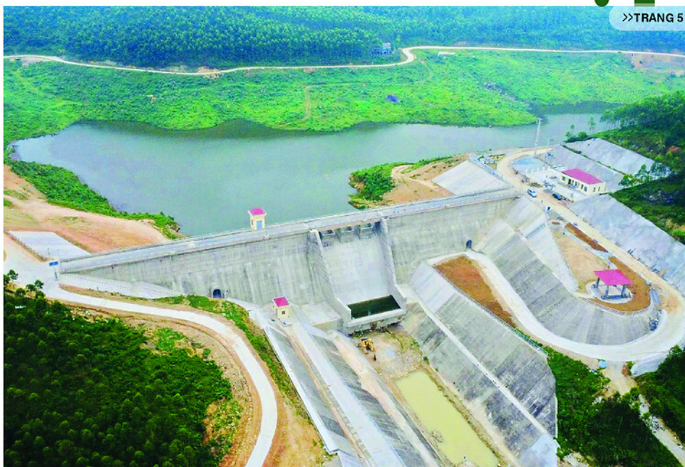
Công trình hồ chứa Cao Ngổ, xã Trường Sinh dung tích 2,18 triệu m 3 đang hoàn thiện, dự kiến đưa vào sử dụng trong tháng 5-2026.