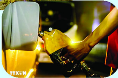
Giá dầu thế giới tăng vọt sau những phát biểu cứng rắn của Mỹ và Iran.

đó, Washington sẵn sàng tấn công bất cứ ai tiếp cận lượng urani này.