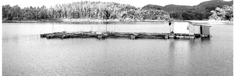
Đập thủy lợi Ngòi Là, phường Minh Xuân được đầu tư, nâng cấp cung cấp nước tưới và tạo điều kiện để người dân phát triển thủy sản, nâng cao thu nhập.

Hồ thủy lợi Ngòi Là nằm trên địa bàn phường Minh Xuân với diện tích rộng 80 ha, dung tích hữu ích trên