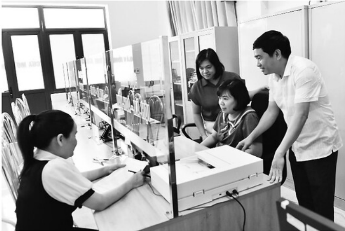
Lãnh đạo phường Nông Tiến kiểm tra việc giải quyết TTHC cho người dân.

Từ việc lượng hóa tiêu chí, đánh giá theo quý, phân cấp mạnh cho cơ sở đến gắn trách nhiệm người đứng đầu, Tuyên Quang đang từng bước tạo đột phá trong đánh giá cán bộ nhằm hướng tới mục tiêu: tìm đúng người, giao đúng việc, phát huy tối đa năng lực đội ngũ cán bộ.