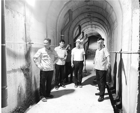
Ban Quản lý đầu tư xây dựng công trình số 1 của tỉnh kiểm tra chống thấm thân đập hồ Cao Ngồi, xã Trường Sinh.

Trước mùa mưa bão năm 2026, Tuyên Quang đang khẩn trương triển khai đồng bộ các giải pháp duy tu, gia cố và nâng cấp hệ thống thủy lợi sau thiệt hại nặng nề do bão lũ năm 2025.