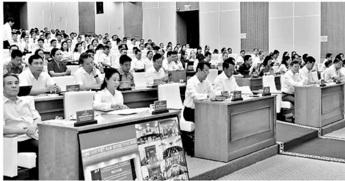
Các đại biểu dự Hội nghị đánh giá 1 năm thực hiện sắp xếp đơn vị hành chính các cấp và hoạt động của chính quyền địa phương 2 cấp.

Nổi bật là công tác lãnh đạo, chỉ đạo được triển khai quyết liệt, đồng bộ; bộ máy chính quyền địa phương 2 cấp cơ bản được kiện toàn tinh gọn, hoạt