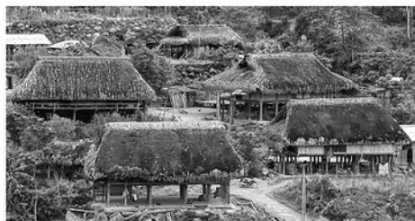
Những mái nhà phủ rêu xanh cổ kính là đặc trưng riêng có ở Xà Phìn.

Xà Phìn có hơn 50 hộ người Dao sinh sống, kiến trúc chủ yếu là nhà sàn mái cọ, nhà được cất trên những sườn núi cao, bao quanh là những thửa ruộng bậc thang quanh năm mây phủ. Do độ ẩm cao, mát mẻ quanh năm, mỗi tháng có trên dưới 20 ngày mưa nên tạo điều kiện rất thuận lợi để rêu tồn tại và sinh sôi. Khoảng 5 năm thì mái nhà sẽ có rêu, thông thường rêu mọc nhiều từ tháng 10 năm này đến tháng 4 năm sau, cứ sau 15 ngày thì lại rơi lại mọc lớp mới xanh tốt. Qua thời gian, những ngôi nhà sàn của người Dao lại mang vẻ đẹp cũ kỹ, mái phủ rêu phong tạo cảm giác yên bình, thư thái của một bản làng miền núi. Những