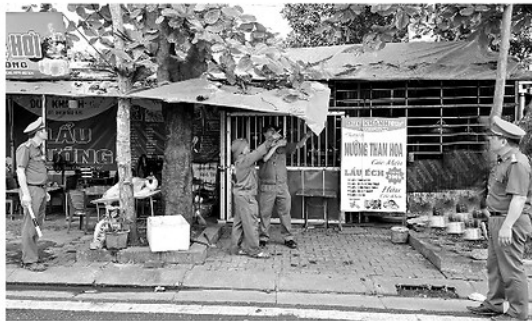
Lực lượng chức năng phường Minh Xuân xử lý các trường hợp vi phạm hành lang, vỉa hè trên trục đường Đinh Tiên Hoàng.

N HỮNG năm qua, với sự phát triển nhanh chóng về hạ tầng giao thông, công nghiệp, dịch vụ, diện mạo của các địa phương trong tỉnh đã có nhiều đổi thay, nhiều tuyến phố được đầu tư, cải tạo khang trang, nhiều tuyến đường kết nối vùng rộng lớn được xây dựng... Tuy nhiên, tình trạng lấn chiếm lòng đường, vỉa hè, dựng lều quán bán hàng, hạp chợ tự phát... vẫn diễn ra khá phổ biến.