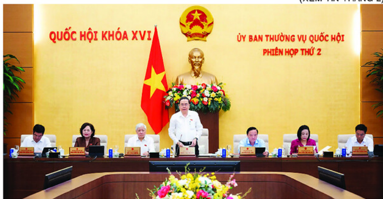
Chủ tịch Quốc hội Trần Thanh Mẫn phát biểu khai mạc phiên họp.