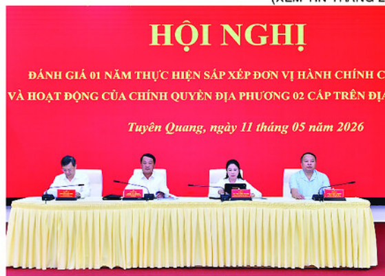
Các đồng chí Thường trực Tỉnh ủy chủ trì thảo luận tại hội nghị.