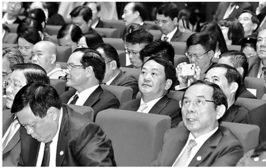
Đồng chí Hầu A Lênh, Ủy viên BCH Trung ương Đảng, Bí thư Tỉnh ủy và các đại biểu dự Đại hội.

Với tinh thần “Đoàn kết - Dân chủ - Đổi mới - Sáng tạo - Phát triển”, Đại hội sẽ thảo luận, đánh giá khách quan, toàn diện tình hình các tầng lớp Nhân dân và khối đại đoàn kết toàn dân tộc; kết quả thực hiện Nghị quyết, Chương trình hành động của Mặt trận Tổ quốc Việt Nam khóa X, giai đoạn 2024 - 2026, thống nhất phương hướng, mục tiêu, Chương trình hành động nhiệm kỳ 2026 - 2031; sửa đổi, bổ sung Điều lệ Mặt trận Tổ quốc Việt Nam; hiệp thương thống nhất cử Ủy ban Trung ương Mặt trận Tổ quốc Việt Nam, Đoàn Chủ tịch, Ban Thường trực, các chức danh lãnh đạo của Ủy ban Trung ương Mặt trận Tổ quốc Việt Nam nhiệm kỳ 2026 - 2031. Trình bày Báo cáo chính trị trước Đại hội, Phó Chủ tịch, Tổng Thư ký Ủy ban Trung ương Mặt trận Tổ quốc Hà Thị Nga đã điểm lại những điểm sáng trong thực hiện Chương trình hành động của Mặt trận giai đoạn 2024 - 2026. Từ thực tiễn tổ chức và hoạt động trong giai đoạn