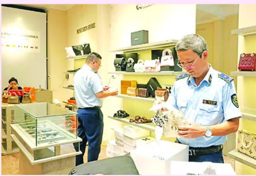
Đội QLTT số 2 kiểm tra một cửa hàng kinh doanh trên phố Hàng Đào.

T HỰC hiện chỉ đạo của Bộ Công Thương, Ủy ban Nhân dân Thành phố và Sở Công Thương Hà Nội về việc tăng cường kiểm tra, xử lý nghiêm các vụ việc xâm phạm quyền sở hữu trí tuệ theo Công điện số 38/CĐ-TTg ngày 5/5/2026 của Thủ tướng Chính phủ, lực lượng quản lý thị trường thành phố đang đồng loạt triển khai nhiều biện pháp đấu tranh, ngăn chặn.