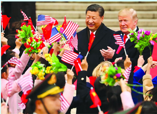
Chủ tịch Trung Quốc Tập Cận Bình (trái) và Tổng thống Mỹ Donald Trump tại Bắc Kinh hồi tháng 11/2017.

Cuộc gặp giữa Tổng thống Mỹ Donald Trump và Chủ tịch Trung Quốc Tập Cận Bình được kỳ vọng sẽ định hình lại cạnh