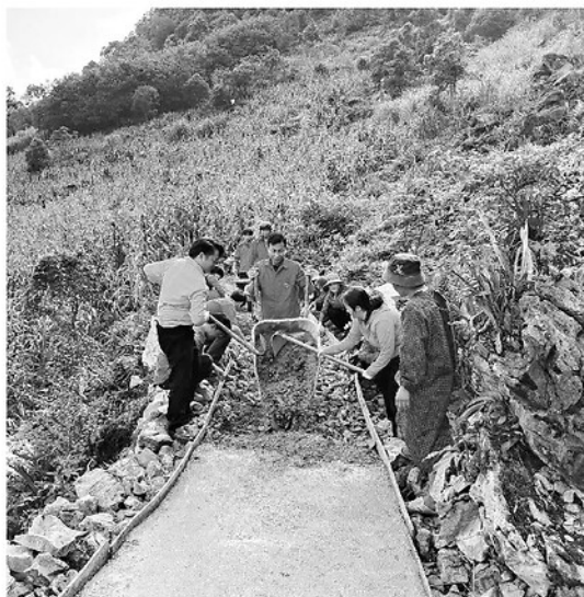
Người dân vùng cao xã Mèo Vạc chung tay làm đường bê tông nông thôn.

Cùng với chăm lo đời sống cho người dân, các phong trào thi đua, cuộc vận động do Mặt trận phát động tiếp tục lan tỏa sâu rộng, thu hút đông đảo Nhân dân tham gia. Cuộc vận động "Toàn dân đoàn kết xây dựng nông thôn mới, đô thị văn minh" đã thực sự đi vào cuộc sống bằng những hành động cụ thể. Nhân dân trong tỉnh đã tự nguyện hiến trên 50 nghìn m 2 đất, đóng góp hơn 30 tỷ đồng, tham gia trên 3 nghìn ngày công lao động làm hơn 250 km đường thôn, 500 km đường nội đồng, xây dựng trên 400 km đường hoa và 200 km đường điện "Thấp sáng đường quê". Như tại xã Bằng Lang, chỉ tính riêng trong tháng 4 đến nay, hơn 20 hộ dân thôn Trung đã tự nguyện hiến trên 2.000 m 2