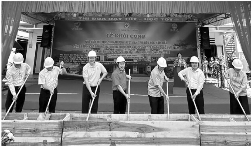
Lãnh đạo Hội Chữ thập đỏ tỉnh, đại diện các tổ chức khởi công xây dựng Nhà lưu trú học sinh Trường Phổ thông Dân tộc bán trú Tiểu học Năm Dẩn.

Theo đó, từ ngày 1 đến 31-5, các cấp Hội trên địa bàn tỉnh phân đấu vận động nguồn lực đạt trên 8 tỷ đồng để triển khai các hoạt động Tháng Nhân đạo và chủ động đáp ứng yêu cầu trợ giúp nhân đạo trong năm 2026. Mỗi xã, phường phấn đấu hỗ trợ sinh kế cho hộ nghèo, hộ có hoàn cảnh khó khăn; tổ chức ít nhất một "Ngày hội nhân ái"; khởi công tối thiểu một công trình, phần việc nhân đạo. Toàn tỉnh phấn đấu vận động, tiếp nhận từ 1.000 đến 1.500 đơn vị máu phục vụ cấp cứu, điều trị người bệnh. Hướng ứng Lễ phát động