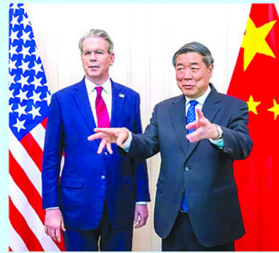
Phó Thủ tướng Trung Quốc Hà Lập Phong và Bộ trưởng Tài chính Mỹ Scott Bessent.

Các lãnh đạo doanh nghiệp sẽ tham gia cùng Tổng