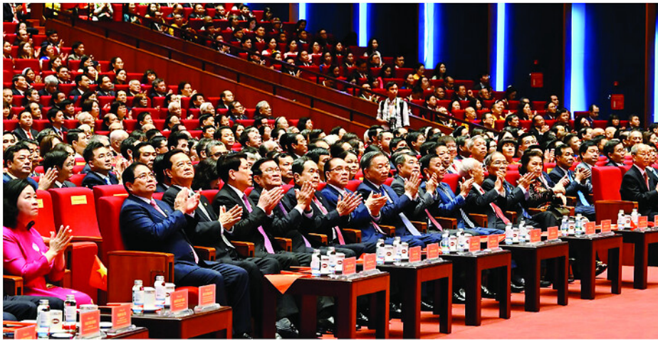
Tổng Bí thư, Chủ tịch nước Tô Lâm cùng các đồng chí lãnh đạo, nguyên lãnh đạo Đảng, Nhà nước tham dự Đại hội đại biểu toàn quốc Mặt trận Tổ quốc Việt Nam lần thứ XI.

SÁNG 12/5, tại Hà Nội, Ủy ban Trung ương Mặt trận Tổ quốc Việt Nam long trọng tổ chức Đại hội đại biểu toàn quốc Mặt trận Tổ quốc Việt Nam lần thứ XI, nhiệm kỳ 2026 - 2031. Tổng Bí thư, Chủ tịch nước Tô Lâm đến dự Đại hội.