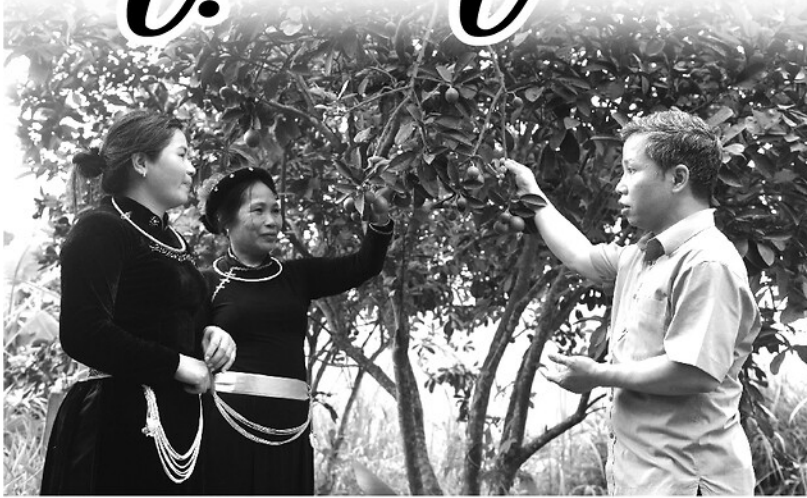
Cán bộ Phòng Kinh tế, xã Lục Hành tuyên truyền cho người dân thôn Đoàn Kết các biện pháp kỹ thuật chăm sóc cây bưởi.

Dân vận khéo theo phương châm "đi từng ngõ, gõ từng nhà", suốt nhiều tháng qua, kể từ khi thực hiện mô hình chính