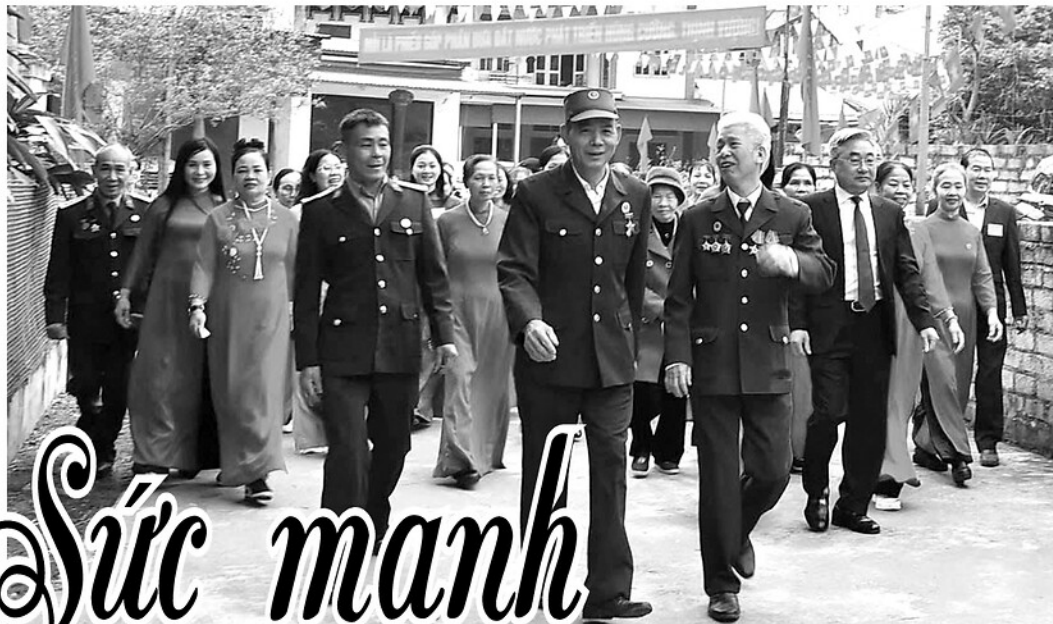
Khởi đại đoàn kết toàn dân tiếp tục được củng cố từ những hoạt động thiết thực ở cơ sở. Trong ảnh: Cử tri thôn Tân Biên 1, xã Thái Bình phấn khởi tham gia bầu cử đại biểu Quốc hội khóa XVI và đại biểu HĐND các cấp, nhiệm kỳ 2026 - 2031.