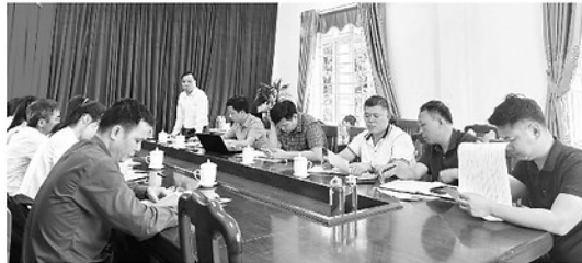
UBND xã Xuân Vân làm việc với cán bộ các thời kỳ để truy thu hồ sơ hoàn thành quyết toán.

Không chỉ dừng lại ở câu chuyện mặt bằng, sự chậm trễ còn đến từ phía doanh nghiệp. Không ít nhà thầu khi tham gia đấu thầu đã xây dựng bộ hồ sơ năng lực rất tốt, nhưng khi triển khai thực tế lại bộc lộ sự hạn chế về cả tài chính lẫn công nghệ. Điển hình như dự án đường giao thông thúc đẩy sản xuất gắn với phát triển du lịch xã Hồng Thái, với xã Cổ Linh, tỉnh Bắc Kan (nay là tỉnh Thái Nguyên). Dự án thi công được 80% giá trị hợp đồng phải dừng do nhà thầu không đủ năng lực. Sự thiếu hụt này khiến công trình rơi vào cảnh thi công dở dang. Đáng ngại hơn, trước biến động giá vật liệu, một số đơn vị chọn cách tạm dừng thi công hoặc chưa phối hợp trong quyết toán. Thái độ thiếu tích cực này không chỉ gây lãng phí ngân sách mà còn đẩy cơ quan quản lý vào thế khó khăn: