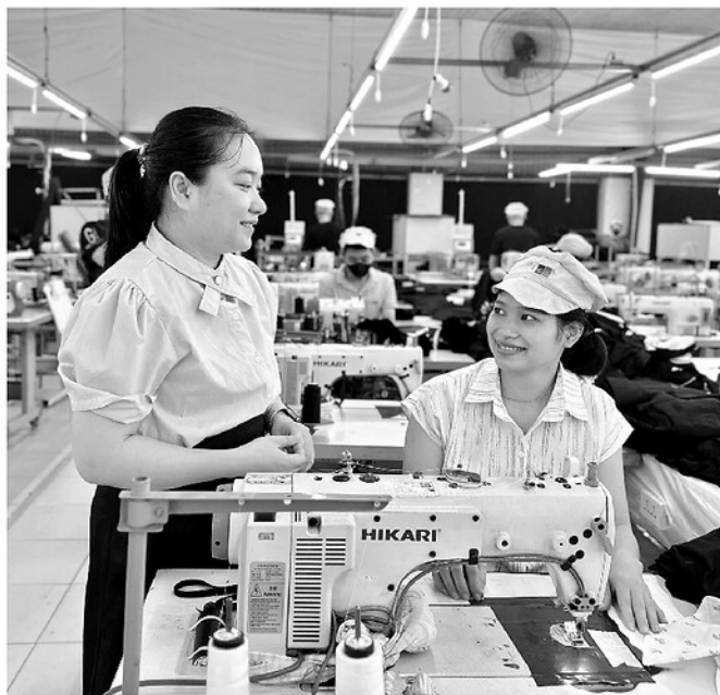
Đại diện tổ chức Công đoàn LGG Tuyên Quang động viên đoàn viên trong giờ tăng ca.

vận động thành lập Công đoàn cũng được thực hiện linh hoạt. Không áp đặt mệnh lệnh, cán bộ công đoàn lựa chọn cách thuyết phục doanh nghiệp bằng lợi ích thực tế: Công đoàn giúp nhận diện và hóa giải mâu thuẫn từ sớm, ngăn ngừa đình công tự phát hay những biến động nhân sự bất thường. Khi rào cản được tháo gỡ, niềm tin sẽ khóa lấp khoảng cách giữa chủ và thợ, tạo nền tảng để doanh nghiệp ổn định và phát triển bền vững.