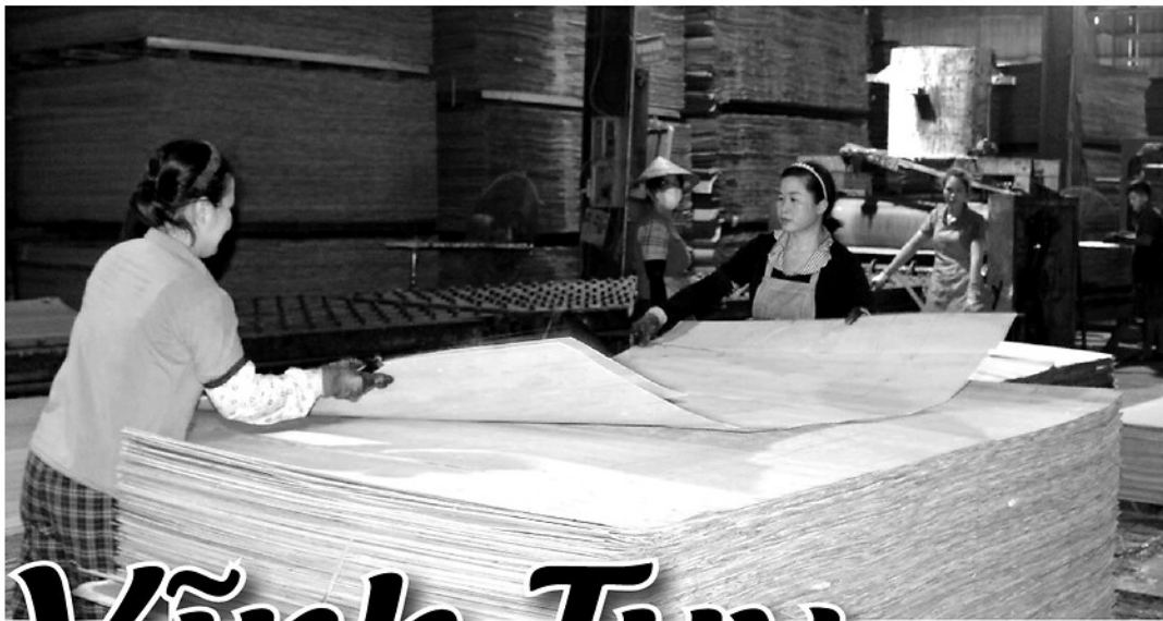
Hệ thống nhà xưởng tại Cụm Công nghiệp Nam Quang tạo việc làm cho nhiều lao động địa phương.