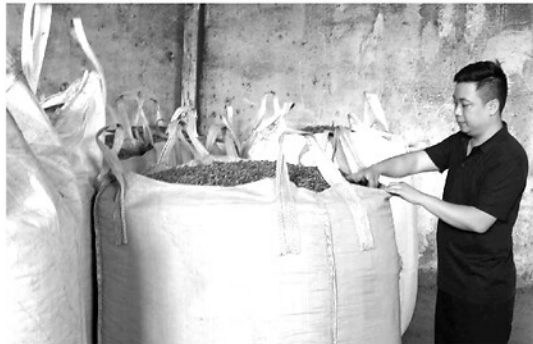
Công nhân Công ty TNHH Năng lượng HTC Vina sản xuất gỗ viên nén xuất khẩu sang thị trường Nhật Bản.