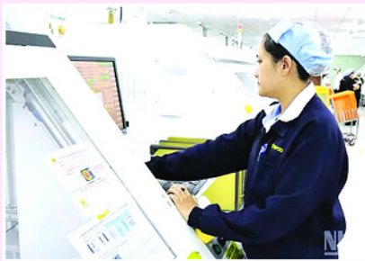
Công nghiệp chế biến, chế tạo là động lực tăng trưởng chủ yếu của kinh tế Đồng Nai.

Tập trung đẩy nhanh tiến độ thực hiện và giải ngân vốn đầu tư công, coi đây là một trong những động lực quan trọng thúc đẩy tăng trưởng. Các chủ đầu tư, các sở, ban, ngành và địa phương cần rà soát từng dự án, tháo gỡ kịp thời các vướng mắc về thủ tục đầu tư, đất đai, bồi thường, giải phóng mặt bằng; nâng cao trách nhiệm người đứng đầu trong việc tổ chức thực hiện; kiên quyết điều chuyển vốn đối với các dự án chậm triển khai, bảo đảm tỷ lệ giải