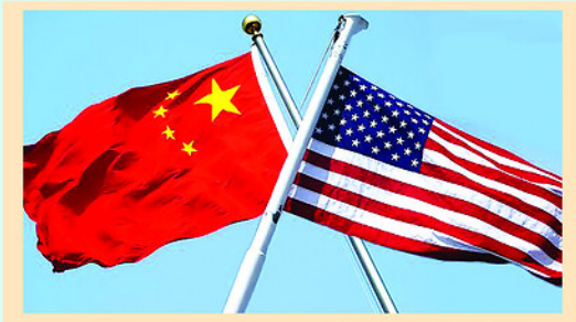
Quan hệ Hoa Kỳ và Trung Quốc là một trong những mối quan hệ song phương quan trọng và phức tạp nhất thế giới.

Trước thêm chuyến thăm Trung Quốc của Tổng thống Mỹ Donald Trump theo lời mời của Tổng Bí thư, Chủ tịch Trung Quốc Tập Cận Bình, truyền thông và học giả Trung Quốc có những nhận định về vai trò của ngoại giao nguyên thủ trong việc thúc đẩy quan hệ hợp tác Trung - Mỹ.