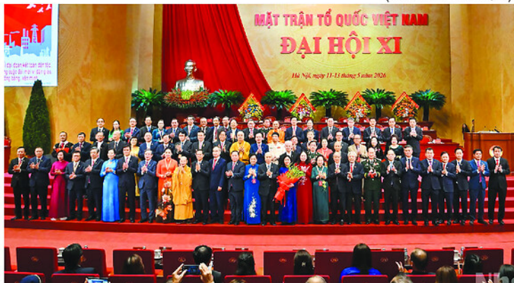
Các đồng chí lãnh đạo, nguyên lãnh đạo Đảng, Nhà nước chúc mừng Đoàn Chủ tịch Ủy ban Trung ương Mặt trận Tổ quốc Việt Nam khóa XI.

Công bố Quyết định điều động, bổ nhiệm Chánh án Tòa án nhân dân tỉnh Tuyên Quang