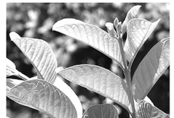
Lá ổi giúp điều trị bệnh tiểu đường.