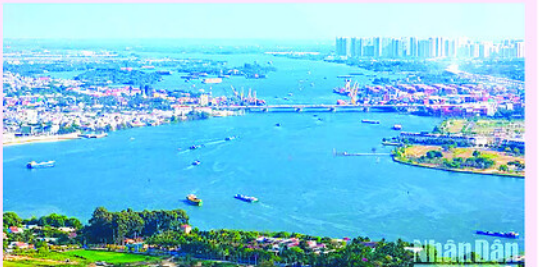
Đồng Nai nỗ lực thực hiện các giải pháp bảo đảm đạt mục tiêu tăng trưởng 10% trong năm 2026.

Quý I/2026, GRDP thành phố Đồng Nai đạt tăng trưởng 9,76% so với cùng kỳ, thuộc nhóm địa phương có tốc độ tăng trưởng cao của cả nước và cao nhất ở khu vực phía Nam. Tính trong 4 tháng đầu năm, thu ngân sách của thành phố Đồng Nai đạt gần 38,6 nghìn tỷ đồng, bằng 38% dự toán năm. Thu hút đầu tư nước ngoài đạt 1,26 tỷ USD và gần 17.800 tỷ đồng vốn đầu tư trong nước.