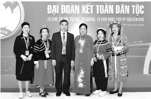
Đồng chí Hà Thị Kiệt, nguyên Bí thư Trung ương Đảng, nguyên Trưởng Ban Dân vận Trung ương, Phó Chủ tịch không chuyên trách Ủy ban Trung ương MTTQ Việt Nam chụp ảnh lưu niệm cùng 5 cá nhân Đoàn đại biểu tỉnh Tuyên Quang tham gia Ủy ban Trung ương MTTQ Việt Nam khóa XI.

Nhà nước, sự phối hợp của các ban, bộ, ngành, đoàn thể Trung ương, địa phương và đặc biệt là sự ủng hộ, đồng hành của các cụ, các vị, các đồng chí, chuyên gia, nhà khoa học, nhân sĩ, trí thức, cá nhân tiêu biểu trong các giai cấp, tầng lớp xã hội, đồng bào ta ở nước ngoài, các tổ chức