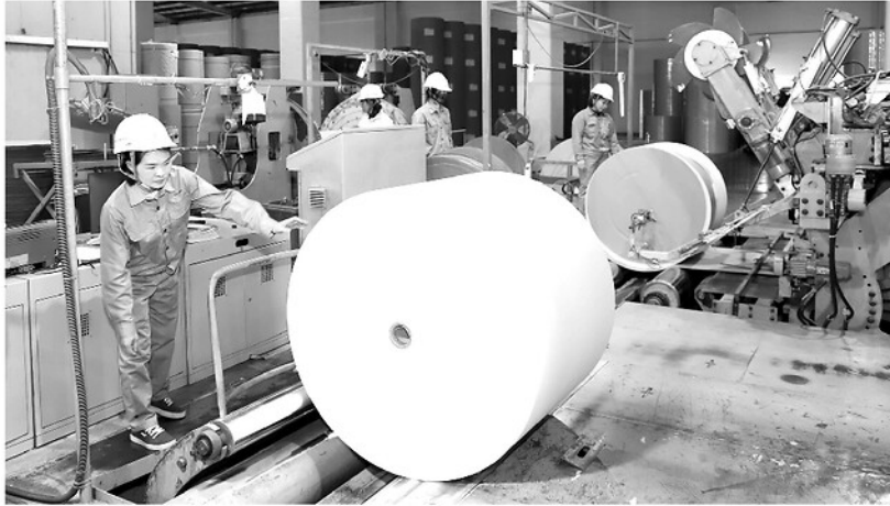
Sản xuất giấy tại Công ty Cổ phần Giấy An Hòa.

nhỏ và vừa tỉnh cho biết: Thời gian qua, tỉnh đã thể hiện quyết tâm đồng hành cùng doanh nghiệp thông qua nhiều giải pháp cải cách hành chính, duy trì đối thoại định kỳ và kịp thời chỉ đạo tháo gỡ khó khăn cho các dự án. Nhiều chủ trương, chính sách được ban hành theo hướng cởi mở, góp phần cải thiện môi trường đầu tư, kinh doanh. Tuy nhiên, ông cũng thẳng thắn chỉ ra những tồn tại: một số thủ tục liên quan đến đất đai, giải phóng mặt bằng vẫn còn kéo dài, ảnh hưởng trực tiếp đến tiến độ đầu tư; sự phối hợp giữa một số sở, ngành trong giải quyết hồ sơ chưa thật sự đồng bộ, thậm chí còn chồng chéo, thiếu thống nhất. Điều này khiến doanh nghiệp phải đi lại nhiều lần, phát sinh chi phí và mất thời gian.