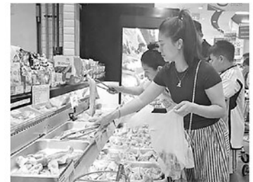
Người tiêu dùng lựa chọn thực phẩm tại siêu thị.

Thịt lợn và bò cũng giữ mặt bằng giá ổn định trong nhiều tuần gần đây. Hiện giá lợn hơi trên địa bàn dao động từ 64.000 - 69.000 đồng/kg đối với lợn trắng, trong khi lợn đen bán địa có giá từ 75.000 - 80.000 đồng/kg. Thịt lợn ba chỉ, nạc vai, mỡ sẵn được bán phổ biến ở mức 110.000 - 150.000 đồng/kg tùy loại; thịt