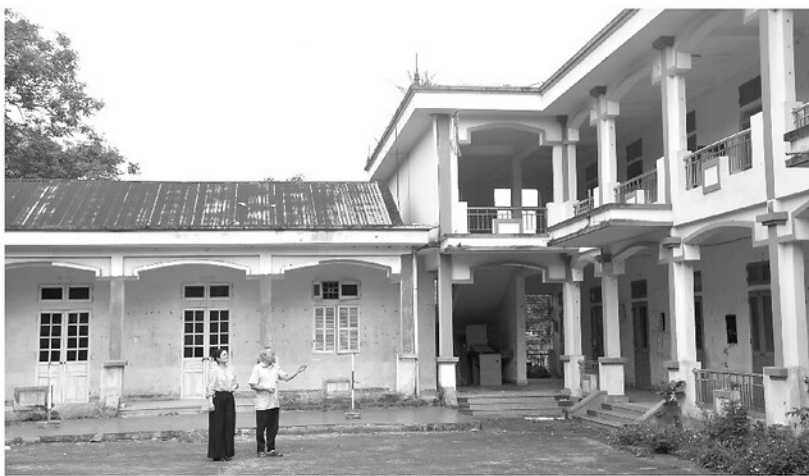
Công trình nhà lớp học Trường Mầm non Hoa Phượng do UBND thành phố Tuyên Quang (cũ) là chủ đầu tư xây dựng từ năm 2013, nay do Ban Quản lý Dự án đầu tư xây dựng công trình số 1 tỉnh tiếp nhận chưa được quyết toán.

KHÔNG ĐỂ NGUỒN VỐN ĐẦU TƯ CÔNG TIẾP TỤC BỊ ÁCH TẮC TRONG CÁC CÔNG TRÌNH TỒN ĐỌNG, TUYÊN QUANG ĐANG TRIỂN KHAI TỔNG RÀ SOÁT, XỬ LÝ QUYẾT LIỆT CHƯA TỪNG CÓ ĐỐI VỚI CÁC DỰ ÁN KÉO DÀI NHIỀU NĂM. QUYẾT TÂM NÀY LÀ BƯỚC TÁI THIẾT KỸ CƯƠNG ĐẦU TƯ CÔNG, LÀM SẠCH DỮ LIỆU, KHƠI THÔNG DÒNG VỐN, MỞ ĐƯỜNG CHO TĂNG TRƯỞNG VÀ TẠO DỰ ĐỊA CHO MỘT GIAI ĐOẠN PHÁT TRIỂN MỚI CỦA TỈNH.