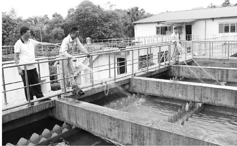
Cán bộ, công nhân Công ty Cổ phần Cấp thoát nước Hà Giang đổi mới tư duy dám làm, thực hiện vượt chỉ tiêu chống hao hụt nước, nâng cao doanh thu.

Trong dòng chảy đổi mới và hội nhập, doanh nghiệp Nhà nước (DNNN) được xác định là lực lượng “đầu tàu”, giữ vai trò chủ đạo trong nền kinh tế. Song song với đó, yêu cầu đặt ra ngày càng cao không chỉ vận hành hiệu quả mà còn phải tiên phong đổi mới, sáng tạo, dám nghĩ, dám làm. Trong bối cảnh ấy, Nghị quyết số 79-NQ/TW ngày 6-1-2026 của Bộ Chính trị đã nhấn mạnh một điểm đột phá xây dựng cơ chế bảo vệ cán bộ dám nghĩ, dám làm vì lợi ích chung.