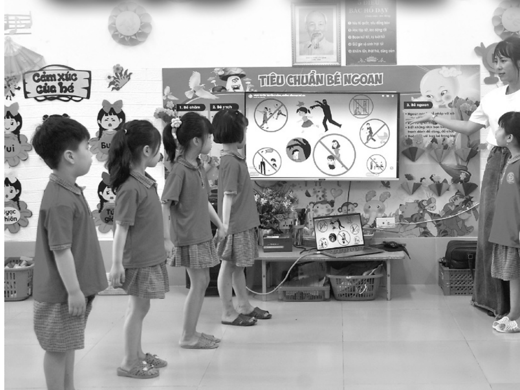
Trường Mầm non Hoa Phượng, phường An Tường giáo dục trẻ nhỏ cách nhận biết các vấn đề bạo lực, xâm hại trẻ em.

Đau lòng hơn, đây không phải là vụ việc cá biệt. Chỉ trong thời gian ngắn, liên tiếp những vụ bạo hành, xâm hại trẻ em xảy ra trên cả nước với tính chất nghiêm trọng, tàn nhẫn và mất nhân tính để lại những tổn thương nặng nề, không thể chữa lành về cả thể chất lẫn tinh thần cho trẻ em. Điều đó tạo nên nỗi ám