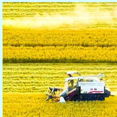
Trung Quốc vẫn đang tự nuôi sống mình với hệ thống sản xuất ngũ cốc và thịt lớn nhất thế giới.

Theo các tổ chức nghiên cứu và doanh nghiệp phân tích thị trường quốc tế, khoảng 1/3 hoạt động thương mại phân bón toàn cầu đi qua eo biển Hormuz. Điều đó khiến thị trường phân bón đặc biệt nhạy cảm trước bất kỳ nguy cơ gián đoạn nào. Giá ure và nhiều loại phân bón quan trọng đã tăng trở lại trong những tuần gần đây do lo ngại rủi ro nguồn cung, làm đẩy lên lo ngại về chi phí canh tác tại nhiều nền kinh tế nhập khẩu lương thực.