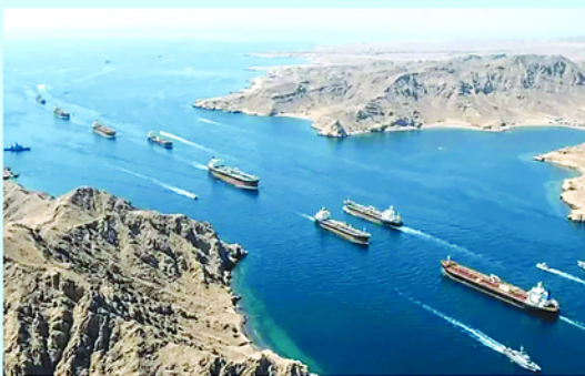
Eo biển Hormuz có khoảng một phần ba hoạt động thương mại phân bón toàn cầu đi qua.

Tuy nhiên, giới phân tích cho rằng mục tiêu này chủ yếu nhằm tăng khả năng chống chịu của chuỗi cung ứng, thay vì thay thế hoàn toàn nhập khẩu. Quốc gia