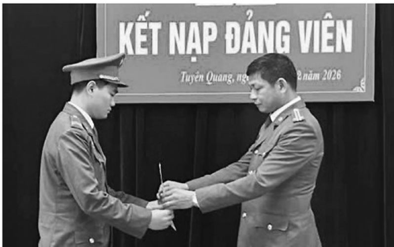
Lễ kết nạp đảng viên mới tại Chi bộ Đội cảnh sát bảo vệ mục tiêu, Đảng bộ Phòng CSCĐ Công an tỉnh.

Không chỉ hoàn thành tốt nhiệm vụ bảo đảm an ninh trật tự, Đảng bộ Phòng Cảnh sát cơ động, Công an tỉnh còn chú trọng công tác phát triển Đảng khi nhiều quần chúng ưu tú được rèn luyện, trưởng thành từ chính thao trường huấn luyện, thực tiễn chiến đấu và những nhiệm vụ gian khổ vì Nhân dân.