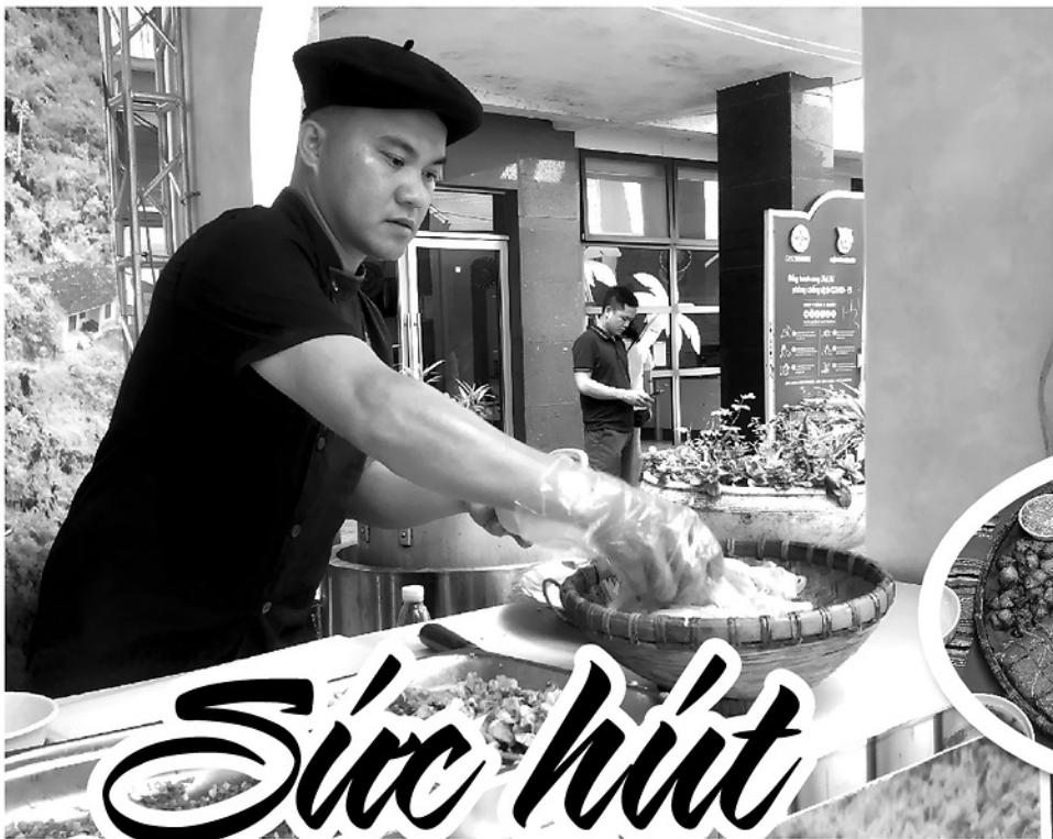
◀ Chế biến đồ ăn phục vụ du khách tại Khu nghỉ dưỡng H'Mong Village xã Lũng Tám.