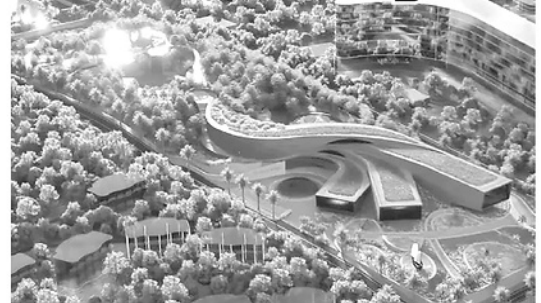
Hình ảnh mô phỏng Bảo tàng Trường Sa nhìn từ trên cao.

Sự ra đời của Bảo tàng Trường Sa nhằm hiện thực hóa Nghị quyết số 09-NQ/TW của Bộ Chính trị về xây dựng và phát triển tỉnh Khánh Hòa đến năm 2030. Trong đó, mục tiêu then chốt là xây dựng Trường Sa trở thành trung tâm kinh tế, văn hóa, xã hội trên biển của cả nước, đồng thời là pháo đài vững chắc bảo vệ chủ quyền biển đảo của Tổ quốc. Tỉnh Khánh Hòa