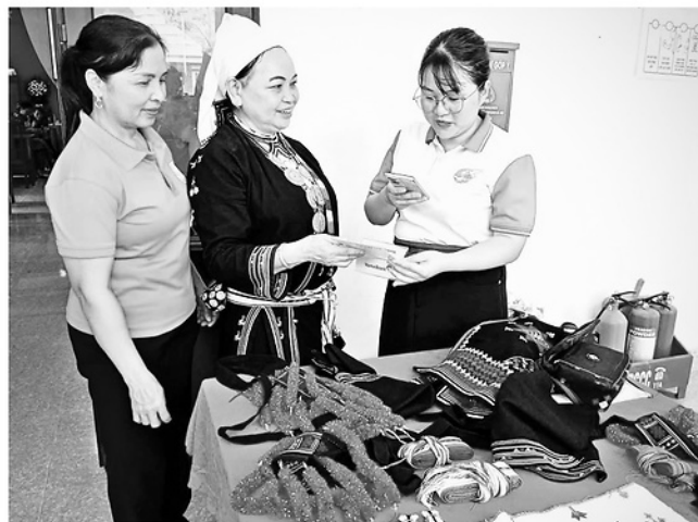
Hội viên phụ nữ xã Tân An sử dụng mã QR trong thanh toán không dùng tiền mặt.

Từ những nhóm Zalo của Chi hội Phụ nữ đến các phiên livestream bán nông sản, chuyển đổi số đang dần hiện diện trong hoạt động của các cấp Hội Liên hiệp Phụ nữ ở cơ sở. Việc ứng dụng công nghệ số không chỉ góp phần đổi mới phương thức hoạt động Hội mà còn giúp hội viên nâng cao thu nhập, tiếp cận thuận lợi hơn với các dịch vụ số thiết yếu.