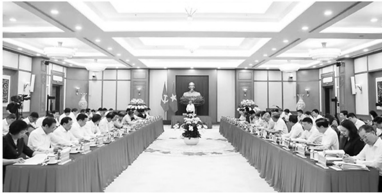
Vẻ phương pháp tổng kết, Tổng Bí thư, Chủ tịch nước yêu cầu, phải kết hợp nhuần nhuyễn giữa lý luận và thực tiễn.

SÁNG 14/5, tại Hà Nội, Ban Chỉ đạo tổng kết 100 năm Đảng lãnh đạo cách mạng Việt Nam, định hướng lãnh đạo phát triển đất nước trong 100 năm tiếp theo và tổng kết 40 năm thực hiện Cương lĩnh xây dựng đất nước trong thời kỳ quá độ lên chủ nghĩa xã hội (Ban Chỉ đạo) tổ chức Phiên họp lần thứ nhất. Tổng Bí thư, Chủ tịch nước Tô Lâm, Trưởng Ban Chỉ đạo chủ trì Phiên họp. Tại Phiên họp, các đại biểu đã nghe báo cáo tóm tắt về Đề án và các ý kiến phát biểu nghiêm túc, trách nhiệm, dân chủ, thẳng thắn, thể hiện sự thống nhất cao.