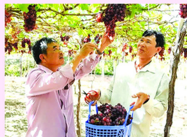
Cây nho trên vùng đất khu vực phía Nam tỉnh Khánh Hòa tiếp tục cho sản lượng cao so với các loại cây trồng truyền thống khác.

Những con số ấy không chỉ phản ánh hiệu quả sản xuất mà còn cho thấy hành trình chuyển đổi tư duy đang diễn ra mạnh mẽ trên những cánh đồng Khánh Hòa. Từ vùng đất nắng gió khắc nghiệt, một nền nông nghiệp hiện đại, xanh và bền vững đang từng ngày hình thành, mở ra kỷ nguyên mới cho người nông dân và cho cả sự phát triển lâu dài của địa phương.