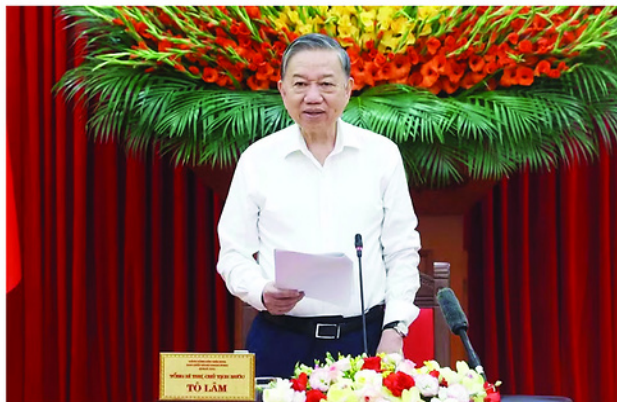
Tổng Bí thư, Chủ tịch nước Tô Lâm, Trưởng Ban Chỉ đạo phát biểu tại Phiên họp thứ nhất.

Xem xét đề xuất dự án chặn nuôi, trồng chè và dự án kết nối cao tốc với Na Hang