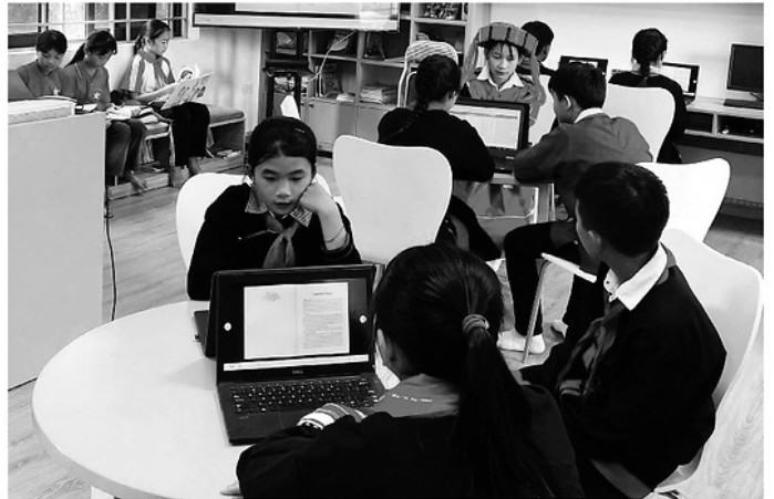
Học sinh Trường THCS Bằng Lang, xã Bằng Lang tìm hiểu các vấn đề bình đẳng giới, bảo vệ trẻ em trên môi trường mạng.

Điều đáng lo ngại là phần lớn các vụ việc xảy ra không phải ở nơi xa lạ. Có tới 16 vụ xâm hại diễn ra ngay tại gia đình, tại nhà của đối tượng hoặc bị hại. Đối tượng gây ra hành vi xâm hại chủ yếu là người quen biết, thậm chí có cả bố ruột, người thân trong gia đình hoặc người có