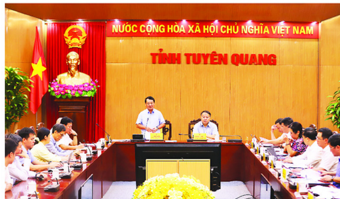
Bí thư Tỉnh ủy Hầu A Lênh phát biểu chỉ đạo tại buổi làm việc.

1.160 đảng viên được trao tặng, truy tặng Huy hiệu Đảng dịp 19-5