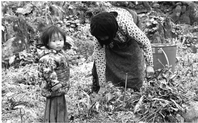
Do điều kiện kinh tế còn khó khăn, nhiều em nhỏ ở vùng cao lớn lên trong thiếu thốn, thiệt thòi cả về sự chăm sóc lẫn cơ hội học tập đầy đủ.