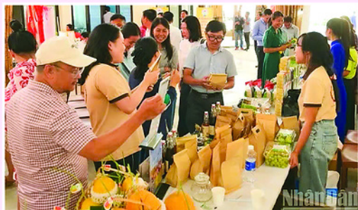
Sản phẩm nông nghiệp chất lượng cao của nông dân tỉnh Khánh Hòa đang thu hút nhiều người tiêu dùng.

Giữa cái nắng gay gắt của vùng bán sơn địa phía Nam tỉnh Khánh Hòa, những luống dưa lưới xanh mướt trong nhà màng ở thôn Ma Ty, xã Bắc Ái Tây vẫn sinh trưởng tốt. Không còn cảnh canh tác phụ thuộc hoàn toàn vào thời tiết, giờ đây từng giọt nước, từng dưỡng chất đều được điều tiết tự động bằng hệ thống công nghệ hiện đại.