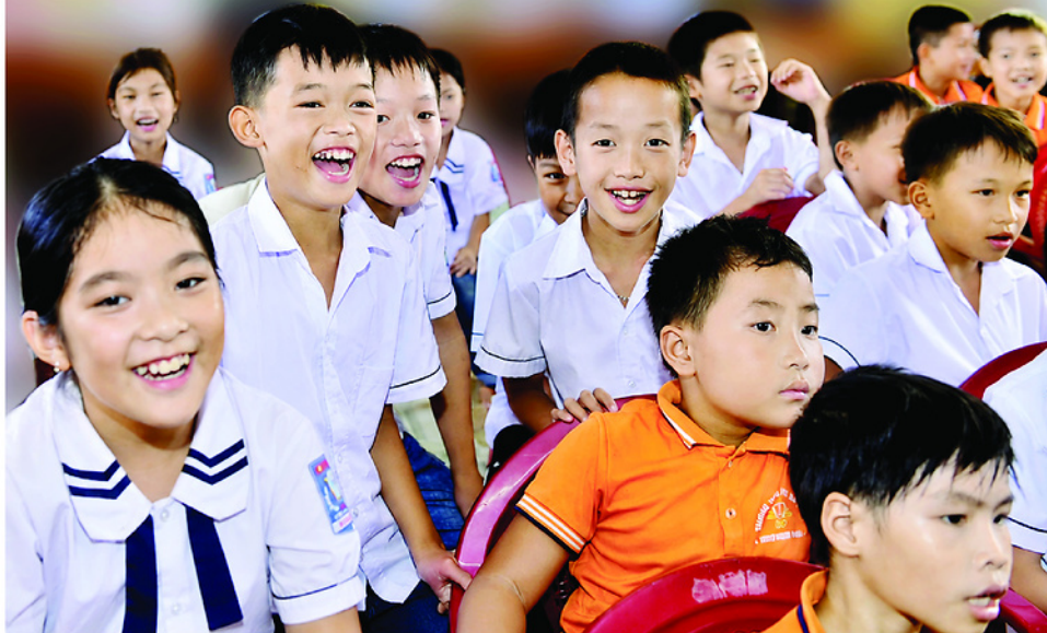
Bảo vệ trẻ em không chỉ là trách nhiệm của mỗi gia đình, nhà trường mà là của cả cộng đồng.