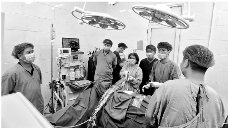
Một ca mổ nội soi viêm ruột thừa tại Bệnh viện Đa khoa khu vực Hoàng Su Phì.

VỚI ĐỘI NGŨ Y BÁC SĨ VỮNG CHUYÊN MÔN VÀ TÂM HUYẾT VỚI NGHỀ, KHÔNG NGỪNG HỌC HỎI VÀ TRAU ĐỔI CHUYÊN MÔN, TRONG NHỮNG NĂM QUA, BỆNH VIỆN ĐA KHOA KHU VỰC HOÀNG SU PHÌ ĐÃ CÓ NHỮNG BƯỚC CHUYỂN MÌNH, NÂNG CAO HIỆU QUẢ ĐIỀU TRỊ VÀ CHĂM SÓC SỨC KHỎE CHO NHÂN DÂN NGAY TẠI TUYẾN CƠ SỞ.