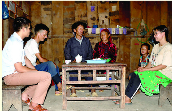
Đảng viên Chi bộ thôn Pó Pi A, xã Niêm Sơn tuyên truyền người dân thực hiện tốt pháp luật của Nhà nước và quy định của địa phương.

CHI bộ thôn Pó Pi A, xã Niêm Sơn đã duy trì nền nếp sinh hoạt, phát huy tinh thần đoàn kết, dân chủ, tập trung lãnh đạo thực hiện hiệu quả các nhiệm vụ phát triển kinh tế - xã hội ở địa phương. Đảng viên trong chi bộ luôn nêu cao tinh thần trách nhiệm, gương mẫu đi đầu trong các phong trào của thôn.