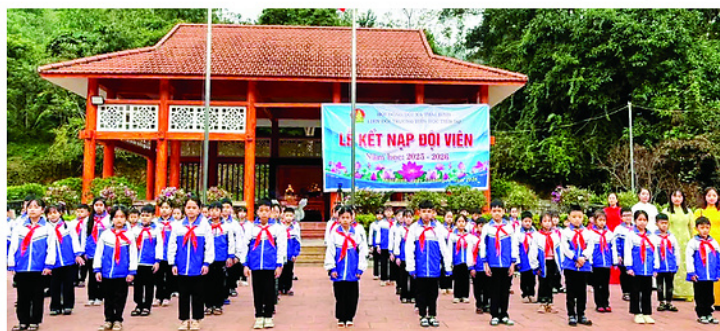
Liên đội Trường Tiểu học Tiến Bộ tổ chức Lễ kết nạp đội viên tại Khu di tích Bộ Canh nông, xã Thái Bình.