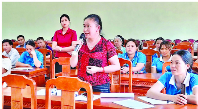
Một buổi hoạt động của mô hình nhóm cha mẹ U18 của xã Năm Dẫn.