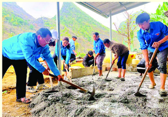
Tuổi trẻ xã Ngọc Long xung kích hỗ trợ Nhân dân sửa nền nhà.

CÙNG với thế hệ trẻ trong toàn tỉnh, Đoàn Thanh niên xã Ngọc Long luôn tích cực học tập và làm theo tư tưởng, đạo đức, phong cách Hồ Chí Minh bằng những việc làm thiết thực, ý nghĩa. Phát huy tinh thần xung kích, tình nguyện của bộ Đoàn đã tham gia nhiều hoạt động vì cộng đồng như: Tổ chức các hoạt động tình nguyện, thăm hỏi, tặng quà; hỗ trợ trên 80 ngày công lao động, giúp đỡ các hộ gia đình khó khăn, neo đơn; phối hợp với nhà trường tuyên truyền, vận động học sinh đến lớp, hạn chế tình trạng bỏ học; xã hội hóa gói trên 200 chiếc bánh chưng hỗ trợ cho thanh thiếu nhi có hoàn cảnh khó khăn. Ngoài ra, Đoàn xã cũng thường xuyên tổ chức các hoạt động vệ sinh môi trường, thu gom rác thải, phát quang đường làng ngõ xóm, góp phần xây dựng nông thôn mới "Xanh - sạch - đẹp". Các phong trào "Ngày thứ bảy tình nguyện", "Chủ nhật xanh" cũng được duy trì thường xuyên, thu hút đông đảo đoàn viên tham gia.