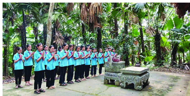
Trường THCS Kim Bình tổ chức dâng hương kết hợp sinh hoạt chuyên môn và hoạt động trải nghiệm tại Khu di tích lịch sử Quốc gia đặc biệt Kim Bình.