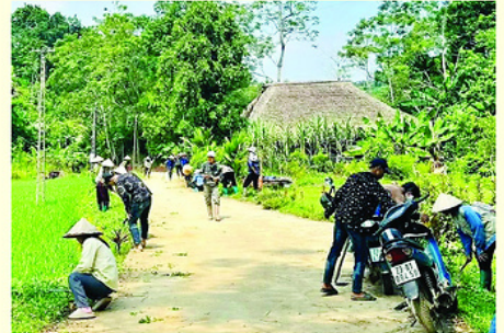
Người dân thôn Bản Tha, xã Phú Linh tích cực tham gia vệ sinh, chỉnh trang tuyến đường sau khi hoàn thành.

Tuyến đường hoàn thành tạo điều kiện thuận lợi cho việc đi lại, vận chuyển hàng hóa, thúc đẩy giao thương, phát triển sản xuất, từng bước nâng cao đời sống người