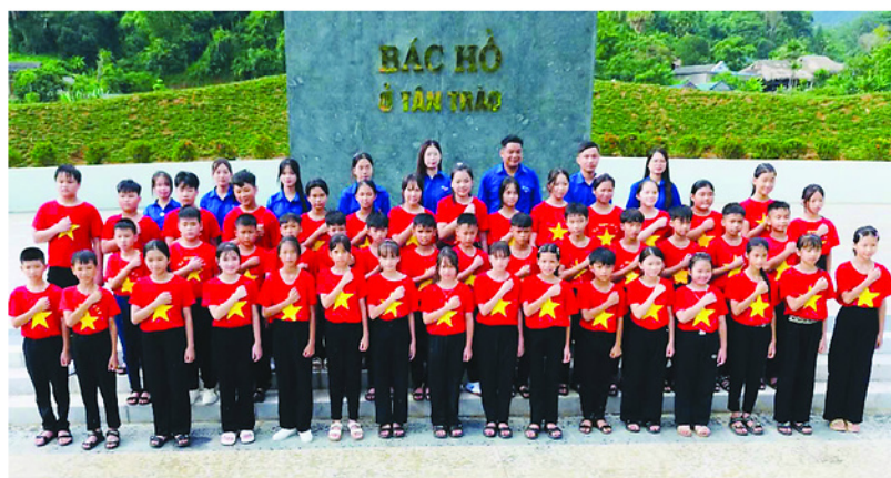
Đoàn viên thanh niên và thiếu nhi xã Tân Trào tổ chức các hoạt động chào cờ, kết nạp đội viên tại Khu di tích Quốc gia đặc biệt Tân Trào.