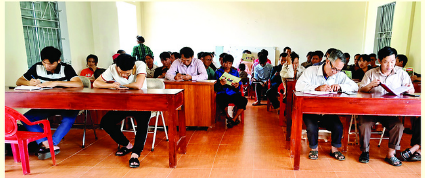
Chi bộ thôn Trung Thành, Đảng bộ xã Quảng Nguyên tổ chức sinh hoạt chi bộ thường kỳ.

Cùng với phát triển kinh tế, Chi bộ tích cực vận động Nhân dân xây dựng đời sống văn hóa, giữ gìn bản sắc dân tộc, chung tay xây dựng nông thôn mới. Với những kết quả đạt được, Chi bộ thôn Trung Thành là đơn vị tiêu biểu được Đảng bộ xã đề nghị UBND tỉnh khen thưởng vì có thành tích xuất sắc trong học tập và làm theo tư tưởng, đạo đức, phong cách Hồ Chí Minh năm 2026.