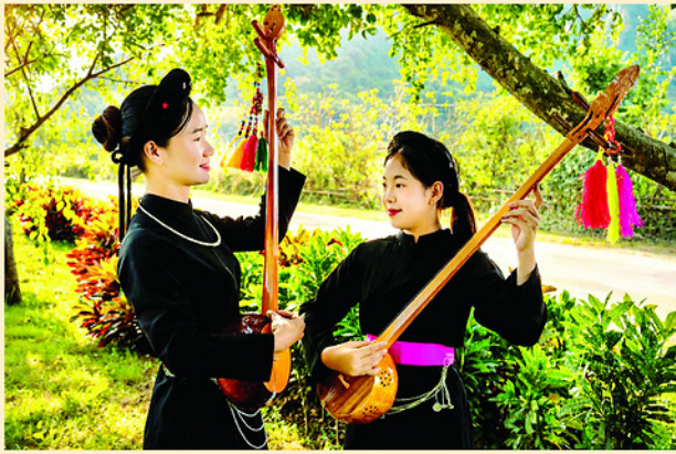
Nét duyên thiếu nữ dân tộc Tày ở Tân Trào.