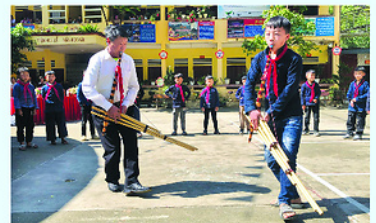
Nghệ nhân trực tiếp truyền dạy kỹ năng thổi, múa khèn, thực hành khèn đơn, khèn đôi và biểu diễn tập thể cho học viên.

Thông qua lớp tập huấn, học viên được tìm hiểu giá