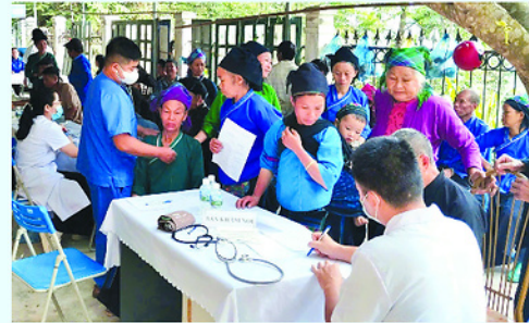
Các y, bác sĩ của Trung tâm Y tế khu vực Lâm Bình khám và cấp thuốc miễn phí cho người dân trên địa bàn xã Thành Tín.

VỪA qua, các đơn vị y tế trên địa bàn tỉnh đã phối hợp tổ chức chương trình khám, chữa bệnh, tư vấn sức khỏe và cấp phát thuốc miễn phí cho người dân trên địa bàn xã Bản Máy và Thành Tín.