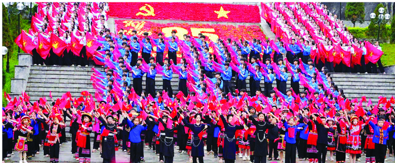
Đoàn giáo viên làm Tổng Phụ trách Đội và thiếu nhi Tuyên Quang tham gia Hành trình về nguồn tại Khu di tích Quốc gia đặc biệt Pác Bó, tỉnh Cao Bằng.