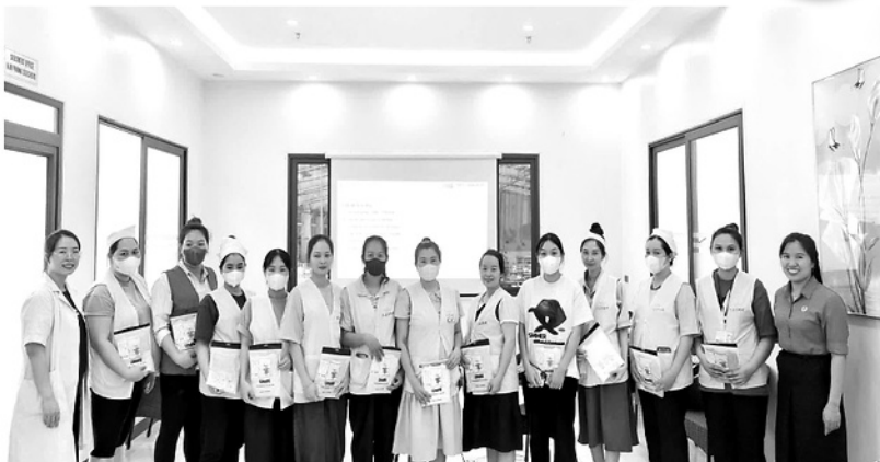
Công đoàn Công ty TNHH Tai Shing phối hợp với Bệnh viện Đa khoa Hùng Vương tổ chức khám sức khỏe cho lao động nữ.

Tháng Công nhân năm 2026 với chủ đề: “Đổi mới quản lý và nâng cao hiệu quả công tác an toàn, vệ sinh lao động trong kỷ nguyên số”; “Công nhân Việt Nam: Đổi mới sáng tạo, nâng cao năng suất lao động” đang được các cấp công đoàn trên địa bàn tỉnh Tuyên Quang triển khai với nhiều hoạt động thiết thực, hướng về đoàn viên, công nhân lao động.