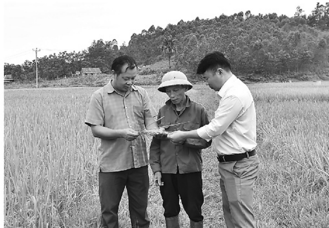
Cán bộ xã Hồng Sơn và thôn Ninh Phú kiểm tra năng suất giống lúa ST25 vừa được đưa vào vụ mới (ảnh phải).