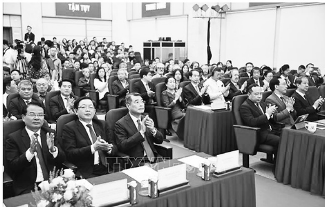
Thủ tướng Lê Minh Hưng và các đại biểu dự Lễ chào mừng Ngày Khoa học, Công nghệ và Đổi mới sáng tạo Việt Nam và Hội nghị triển khai công nghệ chiến lược.

Thủ tướng Lê Minh Hưng nhấn mạnh, Ngày Khoa học, Công nghệ và Đổi mới sáng tạo Việt Nam không chỉ là dịp để tôn vinh các nhà khoa học, trí thức, doanh nhân với những thành