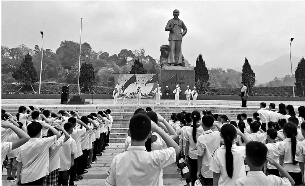
Các em thiếu nhi nghiêm trang chào cờ dưới Tượng đài Bác Hồ ở Tân Trào, Khu Di tích Quốc gia đặc biệt Tân Trào.

Một trong những chuyển biến rõ nét trong việc học và làm theo Bác thời gian qua là nhiều địa phương đã biết lựa chọn những việc cụ thể, sát thực tiễn để triển khai thực hiện, thay vì làm theo cách dàn trải, chung chung.