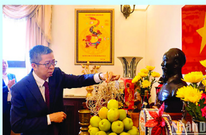
Đại sứ quán Việt Nam tại Trung Quốc dâng hương tưởng niệm Chủ tịch Hồ Chí Minh.

Ở Trung Quốc: Đại sứ quán Việt Nam tại Bắc Kinh đã long trọng tổ chức lễ dâng hoa kỷ niệm 136 năm Ngày sinh Chủ tịch Hồ Chí Minh (19/5/1890 -