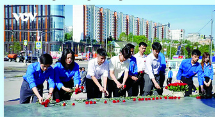
Tuổi trẻ Việt Nam tại Nga thành kính dâng lên Bác những bông hoa tươi thắm.

Tại Liên bang Nga: Đại sứ quán Việt Nam tại Nga, Đảng bộ, Ban Cán sự Đoàn và Hội Sinh viên Việt Nam đã tổ chức lễ dâng hoa, dành phút mặc niệm tưởng nhớ Chủ tịch Hồ Chí Minh trước tượng đài của Người ở Thủ đô Moscow. Bên cạnh hoạt động tưởng niệm, Ban Cán sự Đoàn tại Nga cũng phối hợp tổ chức sinh hoạt chuyên đề trực tuyến với chủ đề "Tư tưởng ngoại giao Hồ Chí Minh với bạn bè quốc tế". Chương trình là dịp để du học sinh, nghiên cứu sinh Việt Nam và các học giả Nga cùng trao đổi về giá trị thời đại trong tư tưởng của Người.