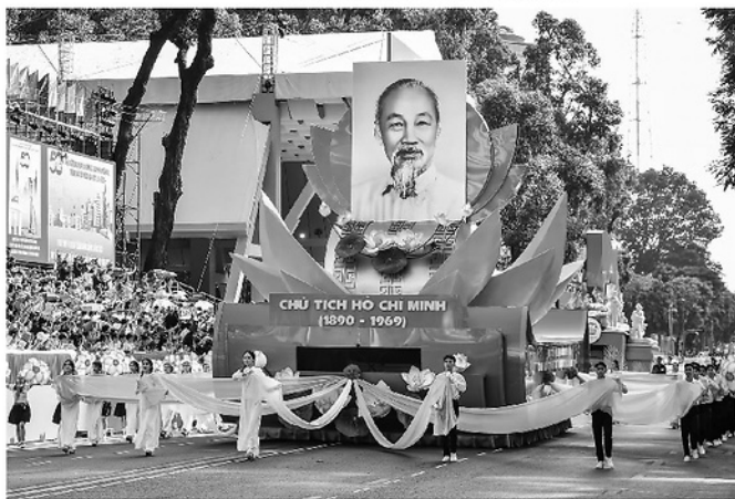
Xe rước chân dung Chủ tịch Hồ Chí Minh tại tổng duyệt diễu binh, diễu hành kỷ niệm 50 năm Ngày Giải phóng miền Nam, thống nhất đất nước, ngày 27/4/2025.

Đại hội XIV của Đảng là dấu mốc rất quan trọng trong tiến trình phát triển của đất nước. Đại hội không chỉ tổng kết chặng đường phát triển, nhìn lại những thành tựu to lớn, có ý nghĩa lịch sử sau 40 năm đổi mới, mà còn xác lập phương pháp luận, tầm nhìn và những quyết sách chiến lược cho giai đoạn phát triển trong tương lai. Đó là con đường phát triển nhanh và bền vững; xây dựng Đảng và hệ thống chính trị trong sạch, vững mạnh, hoạt động hiệu năng, hiệu lực, hiệu quả; xây dựng Nhà nước pháp quyền xã hội chủ nghĩa của Nhân dân,