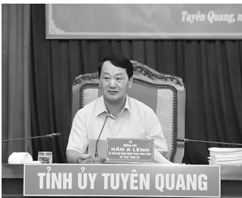
Bí thư Tỉnh ủy Hầu A Lênh phát biểu kết luận phiên họp.

Tại phiên họp, Thường trực Tỉnh ủy đã nghe, thảo luận và cho ý kiến vào báo cáo công tác lãnh đạo, chỉ đạo giải quyết công việc của Thường trực Tỉnh ủy tuần 20 năm 2026; Tờ trình số 141 về việc xin chủ trương ban hành Kế hoạch triển khai thực hiện chương trình của Đảng trên môi trường điện tử trên địa bàn tỉnh Tuyên Quang; Tờ trình số 142 về xin chủ trương về dự kiến nội dung, chương trình họp Ban Thường vụ Tỉnh ủy chuyên đề; Tờ trình 163 xin chủ trương tổ chức Hội thi Báo cáo viên, Tuyên truyền viên giỏi năm 2026 tuyên truyền Nghị quyết Đại hội XIV của Đảng, Nghị quyết Đại hội đại biểu Đảng bộ tỉnh lần thứ I và nghị