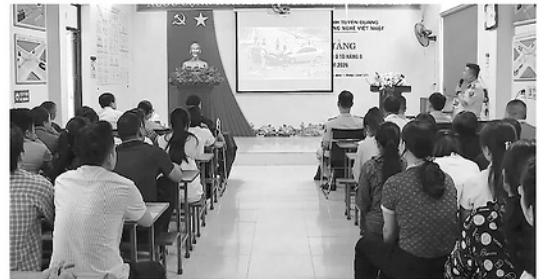
Học viên xem video các tình huống tai nạn thực tế nhằm nâng cao ý thức khi tham gia giao thông.

Bên cạnh đó, việc sử dụng video tình huống thực tế cũng giúp học viên rèn luyện kỹ năng phán đoán và phân xạ khi tham gia giao thông. Khi xem lại các tình huống tai nạn, giáo viên sẽ phân tích nguyên nhân, chỉ ra lỗi sai và hướng dẫn cách xử lý an toàn. Đây được xem là bước