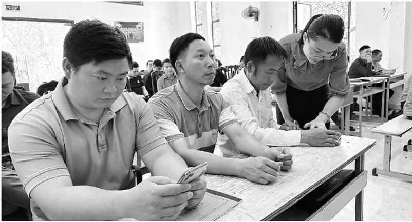
Chuyên viên Trung tâm Khoa học, công nghệ và đổi mới sáng tạo (Sở Khoa học và Công nghệ) hướng dẫn cán bộ thôn tại xã Hồng Thái ứng dụng công nghệ số.

Trong bối cảnh chuyển đổi số diễn ra mạnh mẽ, việc học tập và làm theo tư tưởng, đạo đức, phong cách Hồ Chí Minh không chỉ được đổi mới về hình thức tuyên truyền mà còn thể hiện rõ trong cách mỗi cán bộ, đảng viên và người dân ứng xử, làm việc, cống hiến trên môi trường số.