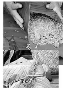
Cốm Hồng Quang.

Ngày nay, muốn giới thiệu với bạn bè khắp nơi về hương vị đặc sản cốm Hồng