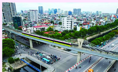
NGUYỄN HẰNG (Theo Báo Nhân Dân)

Đến năm 2065, Hà Nội hướng tới trở thành "thành phố toàn cầu", thu hút nhóm các thủ đô có chất lượng sống và chỉ số hạnh phúc cao trên thế giới.