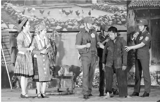
Phân thi Xử lý tình huống là các tiểu phẩm hấp dẫn phản ánh vai trò của lực lượng tham gia bảo vệ ANTT ở cơ sở.

Vòng sơ khảo Hội thi “ Lực lượng tham gia bảo vệ an ninh, trật tự (ANTT) ở cơ sở giỏi ” tỉnh Tuyên Quang lần thứ I năm 2026 đang diễn ra sôi nổi tại các khu vực trên địa bàn tỉnh. Hội thi không chỉ là sân chơi nghiệp vụ bổ ích mà còn là dịp để lực lượng tham gia bảo vệ ANTT ở cơ sở giao lưu, học hỏi kinh nghiệm, nâng cao kiến thức pháp luật và kỹ năng xử lý tình huống thực tiễn trước khi bước vào vòng chung khảo cấp tỉnh.