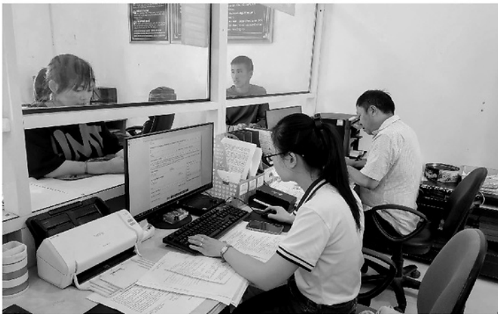
Cán bộ xã Nghĩa Thuận giải quyết TTHC cho người dân (ảnh trái).

Chi bộ thôn nhiều năm qua luôn đưa nội dung học và làm theo Bác vào xây dựng đời sống văn hóa, phát triển gia đình, giữ gìn đoàn kết trong khu dân cư. Mỗi đảng viên đều đăng ký việc làm từ giúp đỡ hộ khó khăn, vận động người dân giữ gìn vệ sinh môi trường đến phát triển kinh tế để làm gương cho bà con.