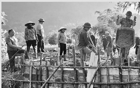
Người dân thôn Làng Chùa chung tay xây dựng cầu Năm Cướm.

C HI bộ thôn Làng Chùa trực thuộc Đảng bộ xã Lâm Bình hiện có 38 đảng viên. Những năm qua, Chi bộ luôn xác định muốn vận động được dân thì cán bộ, đảng