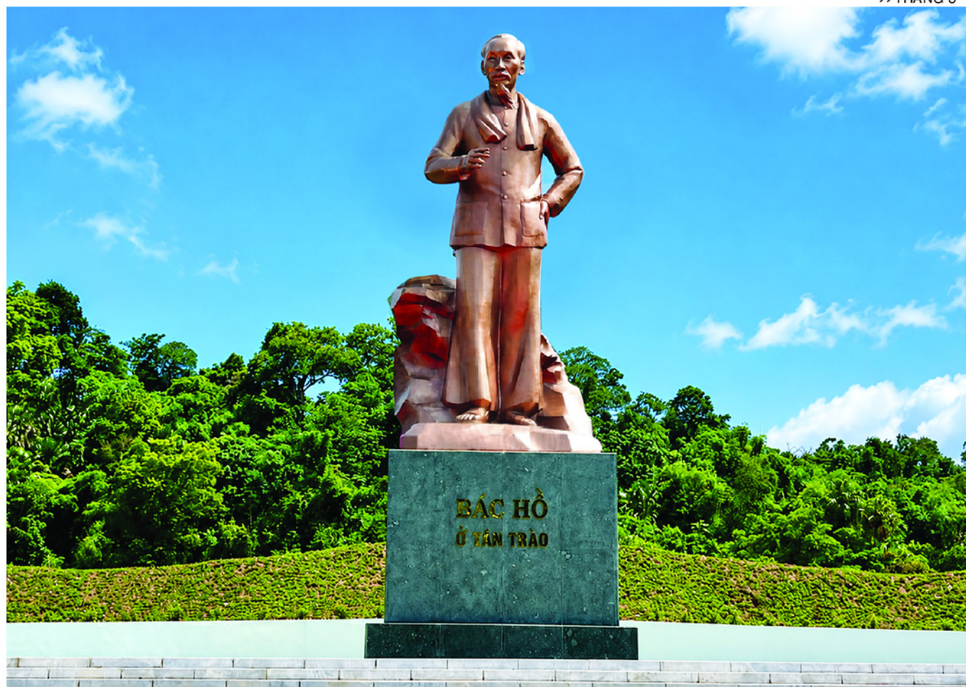
Tượng đài "Bác Hồ ở Tân Trào" là biểu tượng tri ân sâu sắc công lao to lớn của Chủ tịch Hồ Chí Minh và là niềm tự hào của Đảng bộ, chính quyền và nhân dân các dân tộc tỉnh Tuyên Quang.