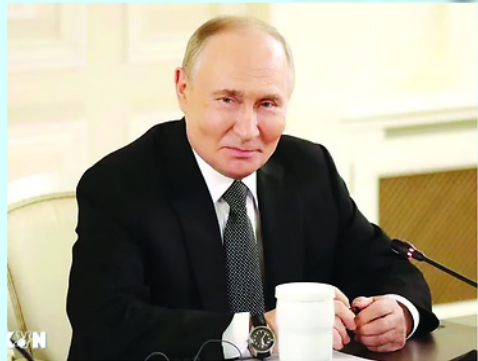
Tổng thống Nga Vladimir Putin.