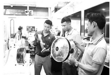
Khách hàng tìm hiểu, mua quạt mát tại Siêu thị điện máy.

Theo các đơn vị kinh doanh, năm nay người tiêu dùng có xu hướng ưu tiên sản phẩm tiết kiệm điện, công nghệ Inverter và các thiết bị có khả năng lọc không khí,