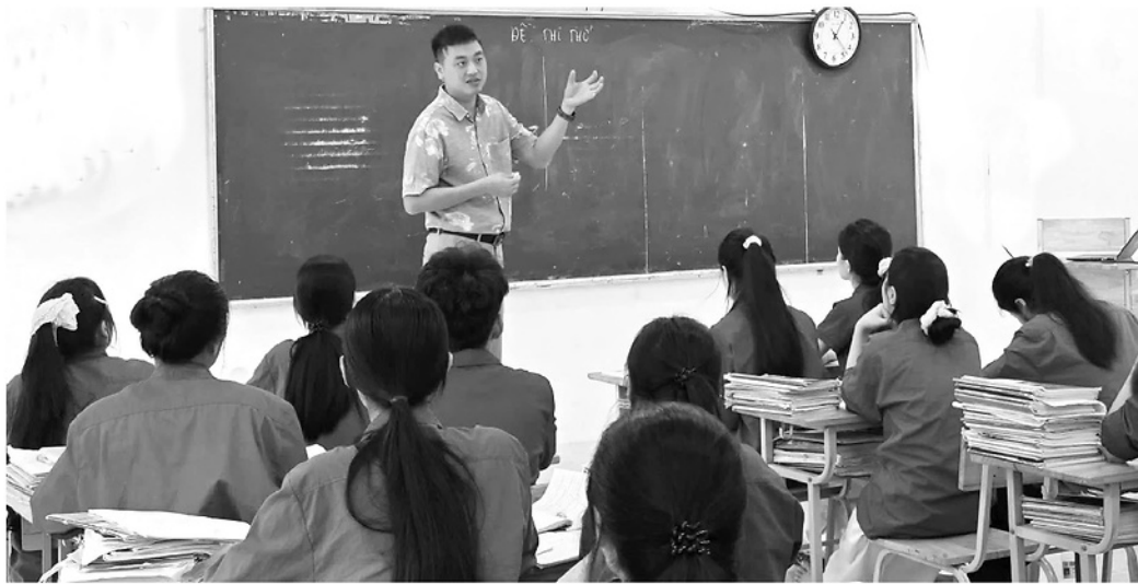
Học sinh lớp 12 Trường Phổ thông Dân tộc Nội trú THCS và THPT Hàm Yên tập trung ôn luyện cho các kỳ thi cuối cấp.