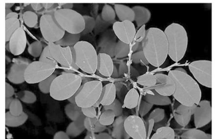
Lá phèn đen có tác dụng trị các chứng ung nhọt, đinh độc...

Hỗ trợ điều trị bệnh trĩ nhẹ: Chuẩn bị lá phèn đen, lá huyết dụ và trái bách diệp, rửa sạch rồi sắc uống trong ngày. Phần bã có thể tận dụng nấu nước xông, ngâm hậu môn khi còn ấm. Bài thuốc dân gian này giúp thanh