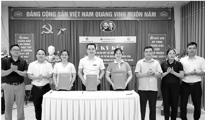
Agribank Hoàng Su Phì ký kết thỏa thuận hợp tác với Hội Nông dân, Hội Liên hiệp Phụ nữ xã đáp ứng nhu cầu sử dụng dịch vụ ngân hàng.

Cùng với đó, chương trình cho vay ưu đãi khách hàng cá nhân "Có vốn trong tay - Kinh doanh vững bền" đang được Chi nhánh triển khai hiệu quả, tạo điều kiện