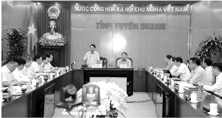
Quang cảnh hội nghị.

N NGÀY 20-5, UBND tỉnh tổ chức Hội nghị về tình hình hoạt động các khu, cụm công nghiệp và tiến độ, kết quả thực hiện các công trình, dự án trọng điểm của tỉnh.