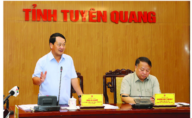
Bí thư Tỉnh ủy Hữu A Lệnh phát biểu tại Hội nghị về tình hình hoạt động các khu, cụm công nghiệp và tiến độ, kết quả thực hiện các công trình, dự án trọng điểm của tỉnh.