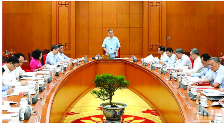
Tổng Bí thư, Chủ tịch nước Tô Lâm chủ trì cuộc làm việc.

Chủ động, linh hoạt đối thoại tạo đồng thuận trong Nhân dân, đồng hành cùng doanh nghiệp