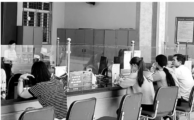
Khách hàng giao dịch tại Agribank Xín Mần.

Điểm nổi bật trong nâng cao chất lượng dịch vụ của Agribank Xín Mần là tinh thần "đưa ngân hàng đến với người dân". Không chờ người dân đến ngân hàng, cán bộ tín dụng chủ động xuống tận cơ sở, bám địa bàn, trực tiếp đến từng xã, thôn để tuyên truyền chính sách tín dụng, hướng dẫn người dân tiếp cận nguồn vốn, kiểm tra hiệu quả sử dụng vốn và đồng hành cùng bà con trong phát triển sản xuất.