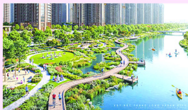
Phối cảnh Khu đô thị đa mục tiêu Bắc Thăng Long Urban City.

không gian Quốc lộ 1A gắn với chỉnh trang và tái thiết đô thị; (6) Dự án đầu tư Khu đô thị đa mục tiêu tại xã Thụ Lâm và Đông Anh; (7) Dự án đầu tư Khu đô thị đa mục tiêu Bắc Thăng Long Urban City trên địa bàn các xã Thiên Lộc, Phúc Thịnh và Mê Linh; (8) Dự án đầu tư, cải tạo phát huy giá trị khu vực Hồ Tây và tuyến đường giao thông