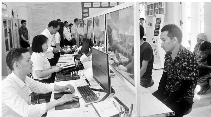
Cán bộ xã Lùng Tám tiếp nhận, xử lý hồ sơ thủ tục hành chính của người dân.