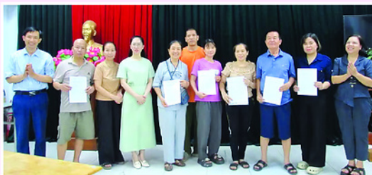
Lãnh đạo Đảng ủy phường Hồng Hà trao quyết định giao đất tái định cư cho các hộ dân thuộc diện giải phóng mặt bằng Dự án cầu Tứ Liên.

Nhiều dự án tồn tại kéo dài nhiều năm đã được hoàn thành giải phóng mặt bằng. Đồng thời, thành phố đang thực hiện giải phóng mặt bằng, đầu tư xây dựng 9 dự