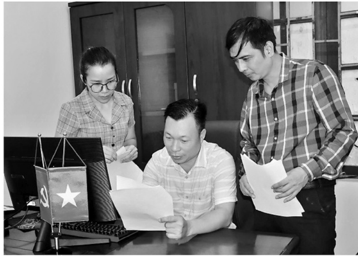
Cán bộ xã Ngọc Đường xem xét hồ sơ thủ tục hành chính của công dân.

Theo kết quả Chỉ số năng lực cạnh tranh cấp tỉnh (PCI) năm 2025 vừa công bố, tỉnh Tuyên Quang đứng thứ 6/34 tỉnh, thành phố. Trong đó nhiều chỉ số thành phần của Tuyên Quang tiếp tục cải thiện, nhất là tính minh bạch, chi phí không chính thức và chính sách hỗ trợ doanh nghiệp... đã khẳng định nỗ lực siết chặt kỷ luật hành chính, đẩy mạnh chuyển đổi số và thực hiện tinh thần “6 rõ” trong cải cách hành chính (CCHC) để phục vụ Nhân dân.