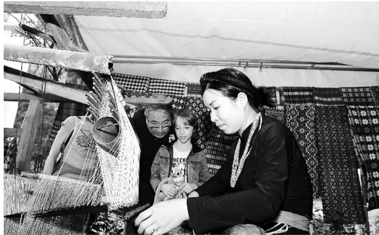
Người dân xã Thượng Lâm bảo tồn nghề dệt thổ cẩm để phát triển du lịch.

Trong dòng chảy hối hả của kỷ nguyên số, văn hóa không còn là câu chuyện của những bảo tàng hay những đêm diễn nghệ thuật hàn lâm. Nó đã trở thành một "mặt trận" sống còn, nơi các giá trị truyền thống đan xen với những trào lưu hiện đại và cũng là nơi những "cỏ rác" độc hại đang nỗ lực len lỏi. Nghị quyết 80-NQ/TW, ngày 7-1-2026, của Bộ Chính trị "Về phát triển văn hóa Việt Nam" ra đời như một kim chỉ nam, không chỉ để phòng thủ mà còn để kiến tạo, dẫn dắt văn hóa Việt Nam vươn tới sự hưng thịnh.