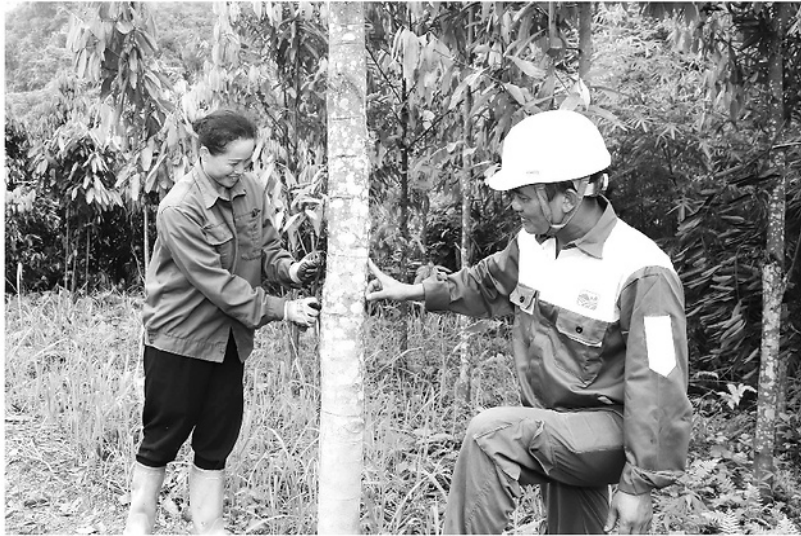
Đại diện HTX Trang Long - Đồng Tâm hướng dẫn người dân Cổng Đá kỹ thuật bóc vỏ quế.

Thực hiện chủ trương chuyển đổi cơ cấu cây trồng, vật nuôi có giá trị kinh tế thấp sang các loại cây trồng, vật nuôi có giá trị kinh tế cao của tỉnh, xã Đồng Tâm đã lựa chọn cây quế là hướng phát triển kinh tế phù hợp với điều kiện thực tế địa phương. Từ những quả đồi từng chủ yếu trồng keo, mỡ với hiệu quả kinh tế thấp, nay những cánh rừng quế xanh tốt đang mở ra kỳ vọng thoát nghèo, làm giàu cho người dân miền núi.