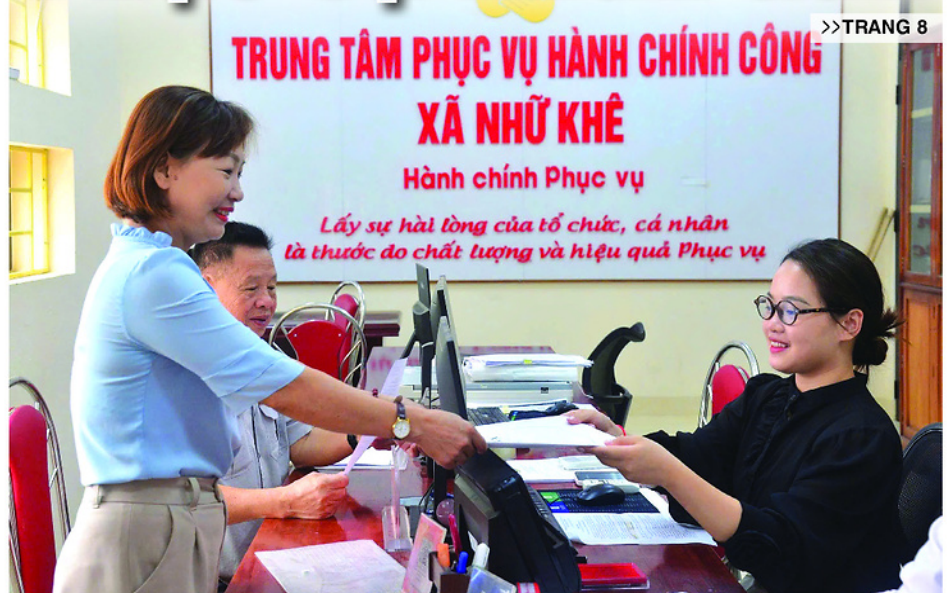
Chuyên viên Trung tâm Phục vụ hành chính công xã Nhữ Khê hỗ trợ người dân giải quyết các thủ tục hành chính.