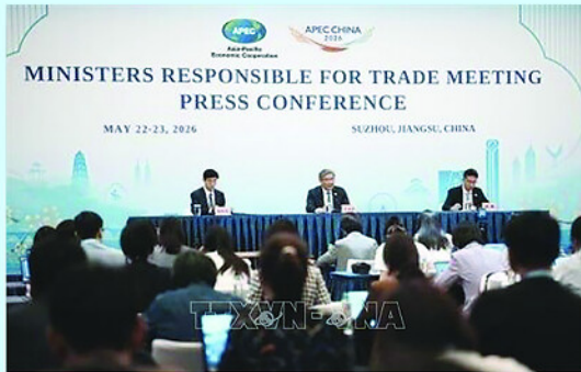
Hội nghị đã trao đổi thẳng thắn, sâu rộng và mang tính xây dựng xoay quanh chủ đề "Xây dựng cộng đồng châu Á Thái Bình Dương, thúc đẩy thịnh vượng chung".

Các nền kinh tế thành viên tái khẳng định ủng hộ