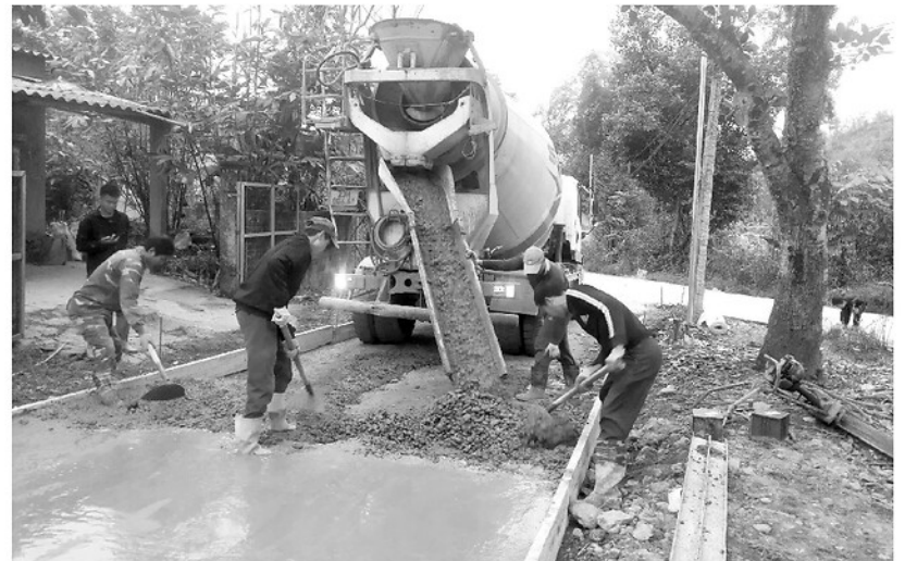
Các tuyến đường trong thôn được đầu tư, nâng cấp.

chính là xóa bỏ hủ tục, xây dựng nếp sống văn minh. Người Mông từ xưa đến nay nổi tiếng với nhiều hủ tục, đặc biệt như tục phọc xác, bôn cơm cho người chết, tảo hôn, thách cưới, mổ nhiều gia súc trong ngày lễ... làm kiệt quệ nền kinh tế, đẩy nhiều gia đình vào cảnh nợ nần, túng quẫn. Người Mông ở Suối Đồng tuy đã về vùng đất mới nhưng tư tưởng cũ cũng theo về.