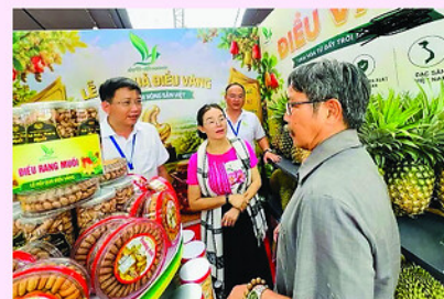
Du khách tham quan các gian hàng tham gia Lễ hội Quả Điều Vàng thành phố Đồng Nai năm 2026.

các hoạt động giao lưu văn hóa, văn nghệ dân gian... Một trong những hoạt động được kỳ vọng thu hút đông du khách là Hội thi ẩm thực với chủ đề "Hương vị ba miền - Cầu chuyện cây điều" và tiệc buffet chiều đãi miễn phí với hơn 1.000 phần ăn được chế biến từ điều. Chuỗi sự kiện trên nhằm khẳng định vai trò của ngành điều trong nền kinh tế nông nghiệp của thành phố, đồng thời tạo diễn đàn cho các doanh nghiệp gặp gỡ, ký kết hợp tác, mở rộng thị trường và tiếp cận công nghệ hiện đại.