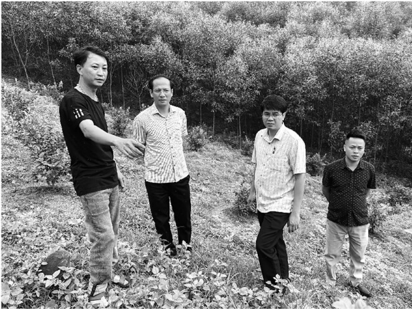
Lãnh đạo xã Tân Trào khảo sát, nắm bắt tình hình phát triển kinh tế của người dân.

SAU KHI TRIỂN KHAI MÔ HÌNH CHÍNH QUYỀN ĐỊA PHƯƠNG HAI CẤP VÀ THỰC HIỆN SẮP XẾP ĐƠN VỊ HÀNH CHÍNH, HỘI ĐỒNG NHÂN DÂN (HĐND) CÁC XÃ TRÊN ĐỊA BÀN TỈNH TUYÊN QUANG ĐÃ NHANH CHÓNG KIẾN TOÀN BỘ MÁY, ĐỔI MỚI PHƯƠNG THỨC HOẠT ĐỘNG ĐỂ ĐÁP ỨNG YÊU CẦU NHIỆM VỤ TRONG TÌNH HÌNH MỚI. VỚI TINH THẦN TRÁCH NHIỆM CAO TRƯỚC CỬ TRI VÀ NHÂN DÂN, CƠ QUAN QUYỀN LỰC NHÀ NƯỚC Ở ĐỊA PHƯƠNG ĐÃ THỂ HIỆN SỰ NANG ĐỘNG, QUYẾT LIỆT TRONG VIỆC QUYẾT ĐỊNH CÁC VẤN ĐỀ QUAN TRỌNG, GÓP PHẦN ỔN ĐỊNH HỆ THỐNG CHÍNH TRỊ VÀ THỨC ĐẨY PHÁT TRIỂN KINH TẾ - XÃ HỘI BỀN VỮNG TẠI CƠ SỞ.