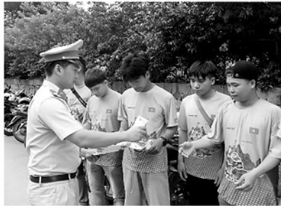
Cán bộ Phòng Cảnh sát Giao thông tỉnh Tuyên Quang tuyên truyền kỹ năng lái xe an toàn tại Công ty lữ hành Jasmine Tours Hà Giang.

KHÔNG phải du khách nào cũng đủ kinh nghiệm và tay lái để chinh phục những cung đường đèo dốc, sương mù dày đặc hay các lối mòn dẫn vào bản sâu. Từ nhu cầu đó, dịch vụ "xe ôm phượt" do người dân bản địa trực tiếp điều khiển ra đời. Lợi thế của các tài xế địa phương là am hiểu địa hình, thông thuộc từng khúc cua, con dốc và thời điểm đẹp nhất để ngắm mây, sương bình minh. Tuy nhiên, thời gian đầu, loại hình này phát triển khá tự phát, bộc lộ nhiều bất cập như giá cả thiếu thống nhất, phương tiện chưa bảo đảm an toàn kỹ thuật, tài xế thiếu kỹ năng bảo hộ và kiến thức du lịch chuyên nghiệp.