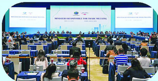
Đại diện 21 nền kinh tế thành viên APEC cùng lãnh đạo các tổ chức quốc tế dự Hội nghị.

Hội nghị cũng phát đi thông điệp chung về thúc đẩy cải cách WTO, nhấn mạnh vai trò của APEC như một "vườn ươm ý tưởng" cho cải cách thương mại đa phương.