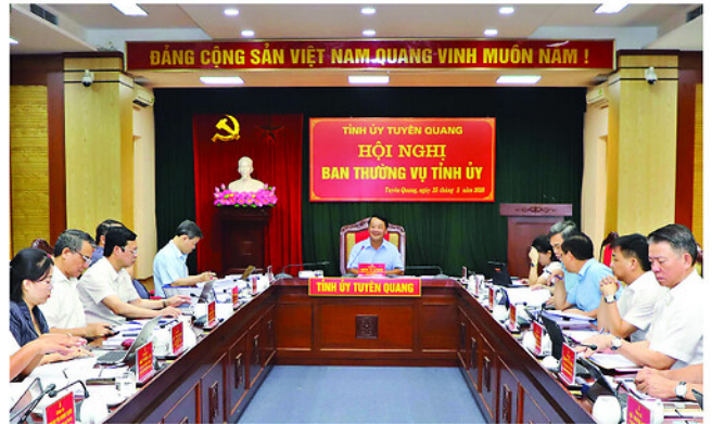
Quang cảnh Hội nghị Ban Thường vụ Tỉnh ủy.