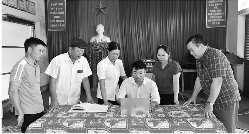
Các đảng viên Chi bộ thôn Khe Thuyền 1 trao đổi trước khi sinh hoạt chi bộ.

Những ngày đầu xây dựng nông thôn mới, Khe Thuyền 1 còn bộn bề khó khăn. Đường nội đồng nhỏ hẹp, nhiều đoạn lầy trơn mỗi mùa mưa xuống. Muốn làm đường phải có tiền, phải có đất, phải có sự đồng thuận của dân.