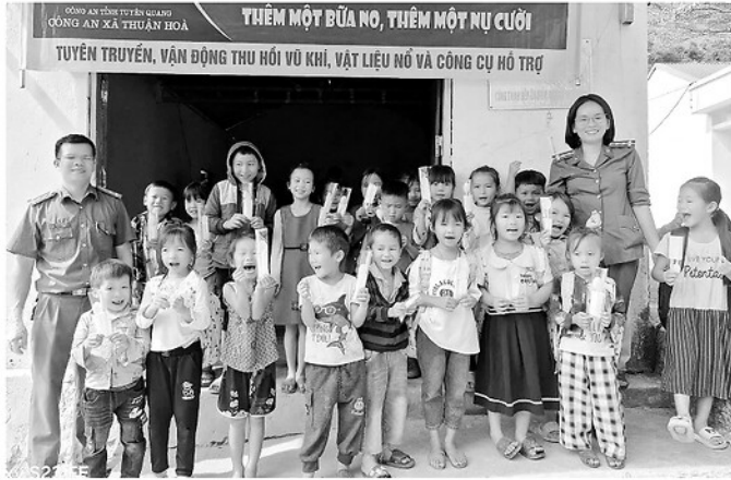
Chương trình "Nấu ăn cho em - thêm một bữa no, thêm một nụ cười" của Công an xã Thuận Hòa.

Một đổi thay đáng chú ý nữa là nhiều Công an xã đã chủ động đổi mới cách tuyên truyền trên mạng xã hội theo hướng gần dân hơn. Nếu trước đây chủ yếu là phổ biến pháp