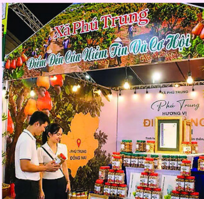
Gian hàng của xã Phú Trung, một địa phương có diện tích cây điều lớn của thành phố Đồng Nai tham gia lễ hội.