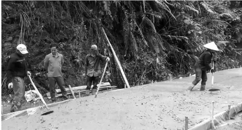
Xã Quang Bình ưu tiên phát triển hệ thống hạ tầng giao thông nông thôn để thúc đẩy giao thương hàng hóa.

Sau thành công của Đại hội Đảng bộ lần thứ nhất, các địa phương trên địa bàn tỉnh đã nhanh chóng cụ thể hóa nghị quyết thành hành động, bắt tay ngay vào thực hiện các nhiệm vụ phát triển kinh tế - xã hội. Trong đó, Chương trình mục tiêu Quốc gia xây dựng nông thôn mới (NTM) được xác định là lõi trung tâm. Bằng cách làm linh hoạt, sáng tạo và không chạy theo thành tích sơ sài, chương trình đang ngày càng đi vào chiều sâu, mang lại những xung lực mới làm thay đổi toàn diện diện mạo những vùng quê nơi đây.