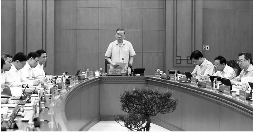
Tổng Bí thư, Chủ tịch nước Tô Lâm chủ trì cuộc làm việc của Thường trực Ban Chỉ đạo Trung ương về phát triển khoa học công nghệ, đổi mới sáng tạo và chuyển đổi số, cho ý kiến về công tác nghiên cứu khoa học cơ bản phục vụ phát triển đất nước trong giai đoạn mới.

Cho rằng, nhận thức về vai trò của nghiên cứu khoa học cơ bản đã có bước chuyển rất quan trọng, tuy nhiên Tổng Bí thư, Chủ tịch nước cũng chỉ rõ, chúng ta vẫn còn nhiều hạn chế, bất cập và chưa tương xứng với yêu cầu phát triển đất nước trong giai đoạn mới. Do đó, Tổng Bí thư, Chủ tịch