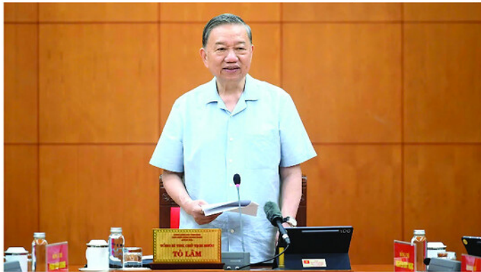
Tổng Bí thư, Chủ tịch nước Tô Lâm chủ trì cuộc làm việc.

Xây dựng cơ chế, chính sách tạo động lực để phát triển