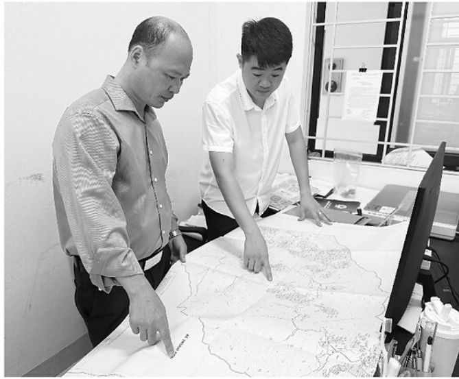
Chưa có dữ liệu trên môi trường số, cán bộ Phòng Kinh tế, UBND xã Tân Long vẫn phải dùng bản đồ giấy để đối soát

Tương tự tại các phường Hà Giang 1, Hà Giang 2 và các xã Bắc Mê, Minh Ngọc, Minh Sơn, Yên Cường, dữ liệu đất đai đã được nhập vào hệ thống thông tin đất đai đa mục tiêu. Thay vì các tệp tin rời rạc, dữ liệu hiện nay được tổ chức theo mô hình tập trung, cho phép tích hợp đa lớp thông tin. Từ tọa độ địa chính, ranh giới thửa đất đến lịch sử biến động pháp lý, giúp các địa phương quản lý chặt chẽ biến động đất đai theo thời gian thực, mà còn tạo ra sự liên thông đồng bộ giữa các cấp, từ xã đến tỉnh.