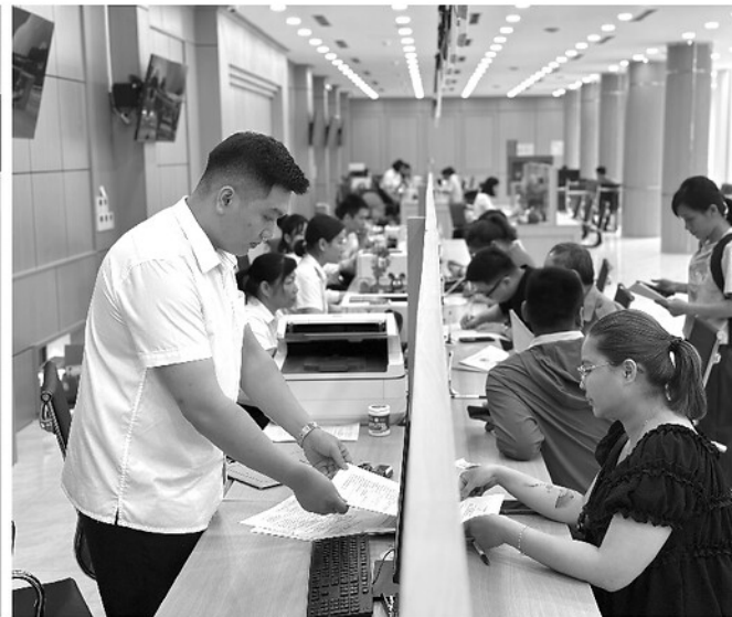
Cán bộ Trung tâm Phục vụ hành chính công tỉnh tận tình hỗ trợ người dân lấy phiếu thứ tự để thực hiện các thủ tục hành chính (Ảnh trái). Trên 2.000 thủ tục hành chính thuộc các lĩnh vực được thực hiện theo cơ chế phi địa giới cho phép người dân giao dịch thuận lợi nhất (Ảnh phải).