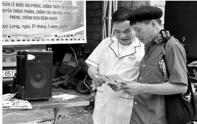
Cán bộ Trung tâm Y tế khu vực Yên Minh tuyên truyền phòng chống tác hại của thuốc lá.

DIỄN RA TỪ NGÀY 25-5 ĐẾN 31-5, TUẦN LỄ QUỐC GIA KHÔNG THUỐC LÁ VÀ NGÀY THẾ GIỚI KHÔNG KHÓI THUỐC 31-5 NĂM 2026 NHẪM CẢNH BÁO VỀ CÁC CHIẾN LƯỢC TIẾP THỊ TINH VI CỦA NGÀNH CÔNG NGHIỆP THUỐC LÁ TRONG VIỆC NGUY TRẠNG CÁC SẢN PHẨM THUỐC LÁ ĐIỆN TỬ, THUỐC LÁ NUNG NÓNG ĐỂ THU HÚT GIỚI TRẺ. TRƯỚC LÀN SÓNG CỦA CÁC LOẠI THUỐC LÁ THẾ HỆ MỚI, VIỆC NÂNG CAO NHẬN THỨC CỘNG ĐỒNG ĐÒI HỎI CÔNG TÁC TRUYỀN THÔNG PHẢI THỰC HIỆN ĐỒNG BỘ, TRỰC QUAN, SINH ĐỘNG, HƯỚNG TỚI XÂY DỰNG MỘT MÔI TRƯỜNG SỐNG LÀNH MẠNH KHÔNG KHÓI THUỐC.