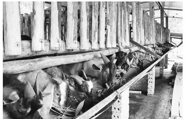
Kiên Đài phát triển chăn nuôi dê theo hướng hàng hóa.