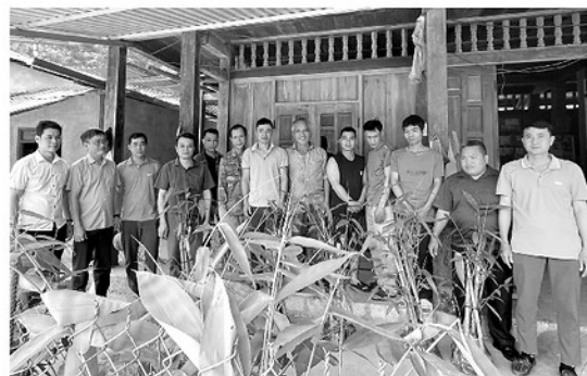
Hội Nông dân xã Kiên Đài tặng cây tre giống cho nông dân thôn Khau Tằm.

CÁC cấp hội trên địa bàn tỉnh đã thực hiện hơn 100 công trình, phần việc chào mừng Đại hội Hội Nông dân Việt Nam, nhiệm kỳ 2026 - 2031. Điểm nổi bật trong các công trình chào mừng Đại hội năm nay là tính thiết thực và hiệu quả. Các cấp hội đều lựa chọn những phần việc phù hợp với nhu cầu thực tế ở địa phương, giải quyết trực tiếp những vấn đề hội viên quan tâm như phát triển sản xuất, cải thiện môi trường sống, hỗ trợ sinh kế và xây dựng đời sống văn hóa ở khu dân cư. Trên những cánh đồng ở xã Đông Thọ, những ngày này, bà con nông dân đang chuẩn bị thu hoạch giống vụ lúa mới với nhiều kỳ vọng. Hội Nông dân tỉnh lựa chọn thực hiện mô hình trồng lúa chất lượng cao ST25 tại địa phương là công trình tiêu biểu cấp tỉnh chào mừng Đại hội, với diện tích 4 ha, hỗ trợ 29 hộ dân tham gia, tổng kinh phí trên 100 triệu đồng. Hội hỗ trợ giống, vật tư, phân bón, đồng thời tổ chức tập huấn kỹ thuật chăm