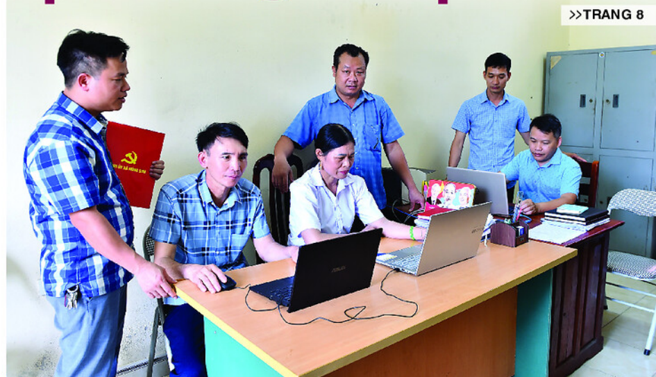
Bí thư Chi bộ các thôn của xã Hồng Sơn trao đổi, thực hành kỹ năng sử dụng máy tính.