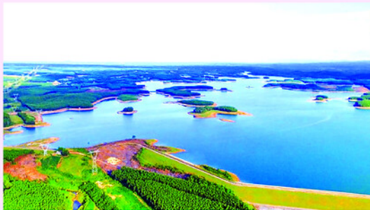
Hồ An Mã-Một hồ chứa nước lớn của Quảng Trị.

CHI cục trưởng Thủy lợi và Tài nguyên nước (Sở Nông nghiệp và Môi trường tỉnh Lâm Đồng) Ngô Minh Trang cho biết: "Hiện nay, trên địa bàn có 966 công trình thủy lợi và hệ thống công trình thủy lợi, trong đó 526 hồ chứa nước với tổng dung tích khoảng 859 triệu m 3 . Mặc dù nhu cầu cấp nước cho sản xuất vụ hè thu năm 2026 rất lớn nhưng đến giữa tháng 5, tổng dung tích tại các hồ chứa mới khoảng 382,4 triệu m 3 , đạt trung bình 44,5% so với dung tích thiết kế, trong đó có 14 hồ cạn kiệt nguồn nước, chín hồ dưới mực nước chết.