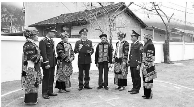
Các đảng viên xã Phố Bàng cùng cán bộ, chiến sỹ Biên phòng vận động Nhân dân xây dựng đời sống văn hóa.

Bằng lòng kiên trung và uy tín tựa núi cao, những đảng viên cao tuổi ở vùng sâu, vùng xa, vùng biên giới đang ngày đêm cống hiến. Họ như những cây đại thụ cắm rễ sâu vào lòng đất, tỏa bóng mát che chở cho bản làng, giữ cho dải đất biên cương luôn bình yên.