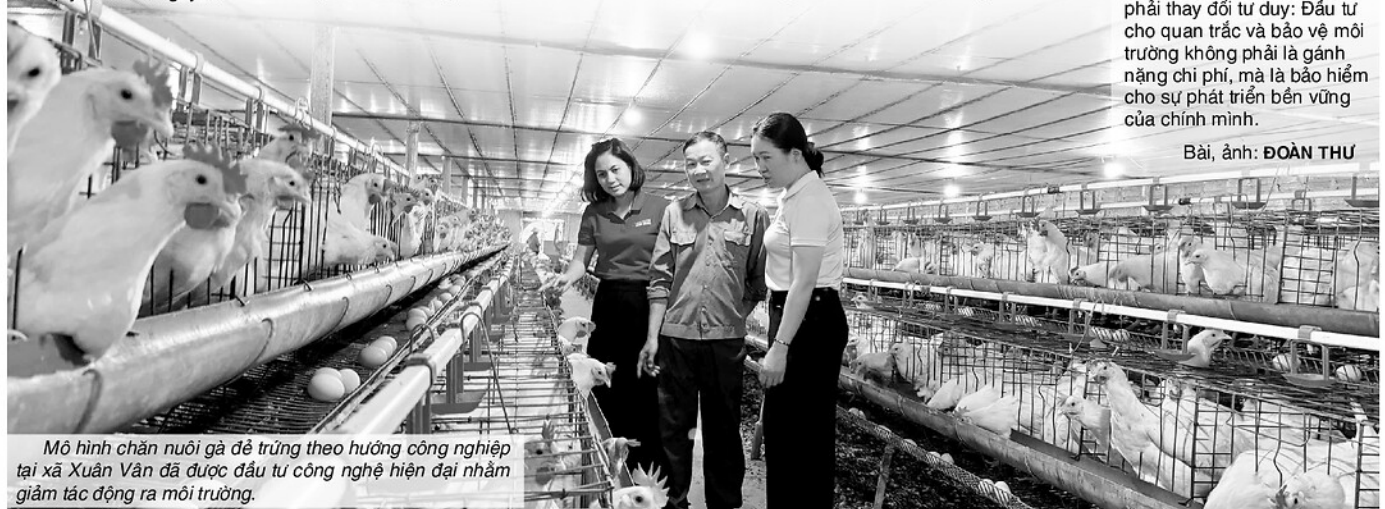
Mô hình chăn nuôi gà đẻ trứng theo hướng công nghiệp tại xã Xuân Vân đã được đầu tư công nghệ hiện đại nhằm giảm tác động ra môi trường.