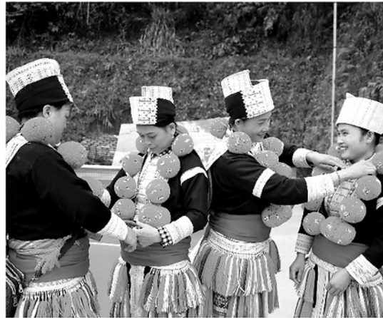
Phụ nữ Dao Đỏ ở thôn Thôm Luông mặc trang phục truyền thống trong những dịp lễ, Tết và ngày hội của bản làng.

Đến nay, nhiều gia đình ở Thôm Luông vẫn duy trì việc truyền nghề cho con cháu. Ngoài giờ học hay những ngày cuối tuần, nhiều em nhỏ từ 7 - 8 tuổi đã được bà, mẹ cầm tay hướng dẫn từng đường kim, mũi chỉ. Những họa tiết trên khăn đội đầu, dây thắt lưng, yếm áo như