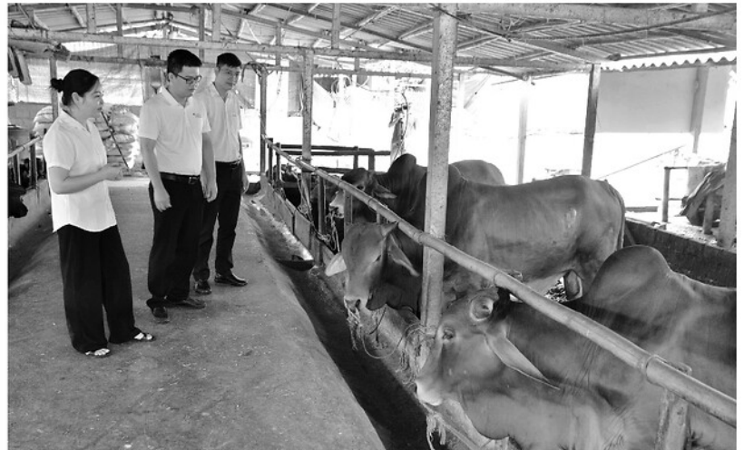
Mô hình chăn nuôi tuần hoàn của Hợp tác xã Hoàng Thức, xã Yên Nguyên bước đầu giảm thiểu tác động đến môi trường.

UBND tỉnh Tuyên Quang đã ban hành kế hoạch quan trắc, cảnh báo và giám sát