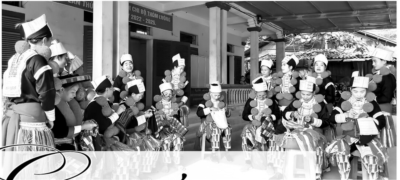
Các thành viên Câu lạc bộ thêu thổ cẩm thôn Thôm Luông cùng nhau thêu, trao đổi kinh nghiệm gìn giữ nghề truyền thống.