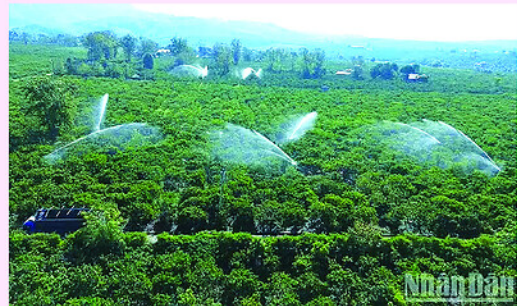
Tưới cà-phê bằng hệ thống béc phun tiết kiệm nước tại xã Đak Hà.

Sở Nông nghiệp và Môi trường tỉnh đề nghị các đơn vị thủy lợi cấp nước một cách khoa học, tiết kiệm để tăng hiệu quả sử dụng; tận dụng hiệu quả nguồn nước để làm đất, gieo sạ và tích trữ trong hồ chứa phục vụ tưới khi hạn hán xảy ra. Đồng thời, lắp đặt các