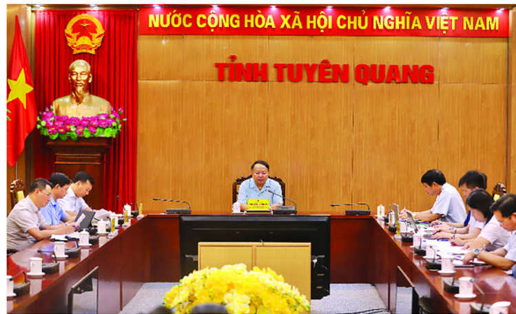
Đồng chí Phó Bí thư Tỉnh ủy, Chủ tịch UBND tỉnh Phan Huy Ngọc chủ trì buổi tiếp công dân tại điểm cầu UBND tỉnh.