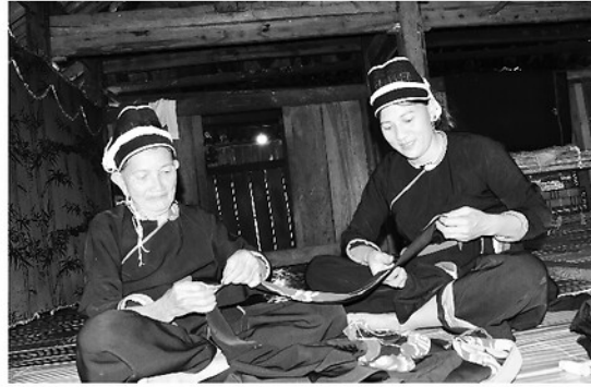
Phụ nữ dân tộc Dao thôn Suối Thầu 2 giữ gìn trang phục truyền thống.

Là một trong những đảng viên gương mẫu của thôn, ông Đặng Văn Péc luôn đi đầu trong các phong trào. Gia đình ông chủ động chỉnh trang nhà cửa, xây dựng công trình phụ