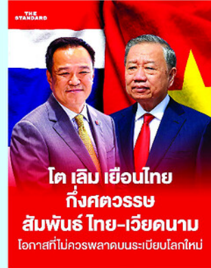
Trang đầu báo về chuyến thăm Thái Lan của Tổng Bí thư, Chủ tịch nước Tô Lâm trên báo The Standard ngày 24/5 (ảnh trái).