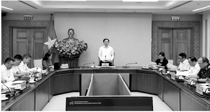
Phó Thủ tướng Hồ Quốc Dũng chủ trì cuộc họp về việc triển khai nhiệm vụ sơ kết thực hiện Nghị quyết số 18-NQ/TW và định hướng sửa đổi Luật Đất đai.

Sau khi nghe ý kiến các bộ, ngành, kết luận cuộc họp, Phó Thủ tướng Hồ Quốc Dũng nhấn mạnh, việc sơ kết Nghị quyết số 18-NQ/TW và sửa đổi Luật Đất đai có ý nghĩa đặc biệt quan trọng, tác động sâu rộng đến mọi mặt đời sống kinh tế - xã hội, được Trung ương, Bộ Chính trị, đặc biệt là Tổng Bí thư, Chủ tịch nước Tô Lâm quan tâm, chỉ đạo sát sao.