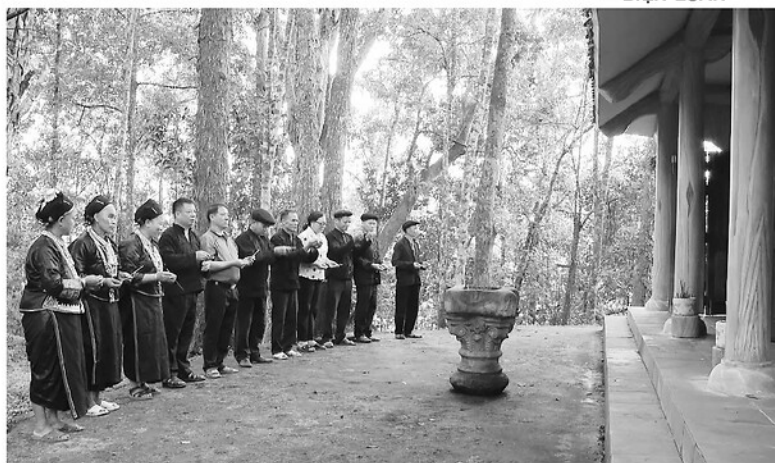
Những người phụ nữ Nùng lần đầu tiên sau hàng trăm năm được cùng nam giới dâng hương tại ngôi miếu thiêng thờ thần rừng.

Nằm sâu trong khu rừng già với những tán cây cổ thụ hàng trăm năm tuổi, ngôi miếu thờ thần rừng Mo Đổng Trư của người Nùng, xã Thành Tín là khu vực rừng thiêng. Hàng trăm năm nay, chỉ có đàn ông được vào làm lễ, cấm phụ nữ đến gần vì quan niệm “không thanh sạch”, sẽ mang họa cho làng. Nhưng với quyết tâm “phá băng” định kiến, phụ nữ Nùng đã mạnh mẽ vươn lên, bình đẳng cùng nam giới bước vào ngôi đền thiêng.