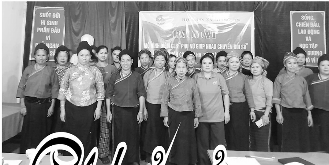
Phụ nữ Nùng xã Thành Tín tham gia câu lạc bộ giúp nhau chuyển đổi số.