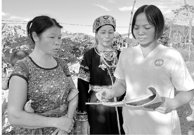
Cán bộ Trạm Y tế xã Yên Sơn tuyên truyền dự phòng lây truyền HIV từ mẹ sang con đến từng hộ dân.