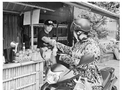
Người tiêu dùng lựa chọn mua đồ uống mát giải nhiệt.