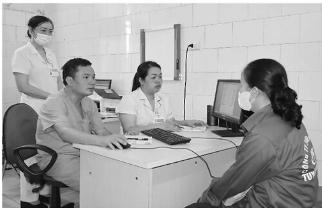
Bác sĩ Bệnh viện Đa khoa tỉnh khám sức khỏe định kỳ cho người dân để phòng chống các bệnh có nguy cơ đột quy.

Mùa hè năm nay đến sớm với những đợt nắng nóng kỷ lục, khiến nguy cơ đột quy, tai biến và suy kiệt do mất nước ở người cao tuổi, người có bệnh lý tăng cao đột biến. Trước nguy cơ gia tăng các ca đột quy, tai biến do sốc nhiệt và mất nước, ngành Y tế khuyến cáo người dân cần chủ động triển khai ngay các biện pháp phòng bệnh để bảo vệ bản thân và gia đình.