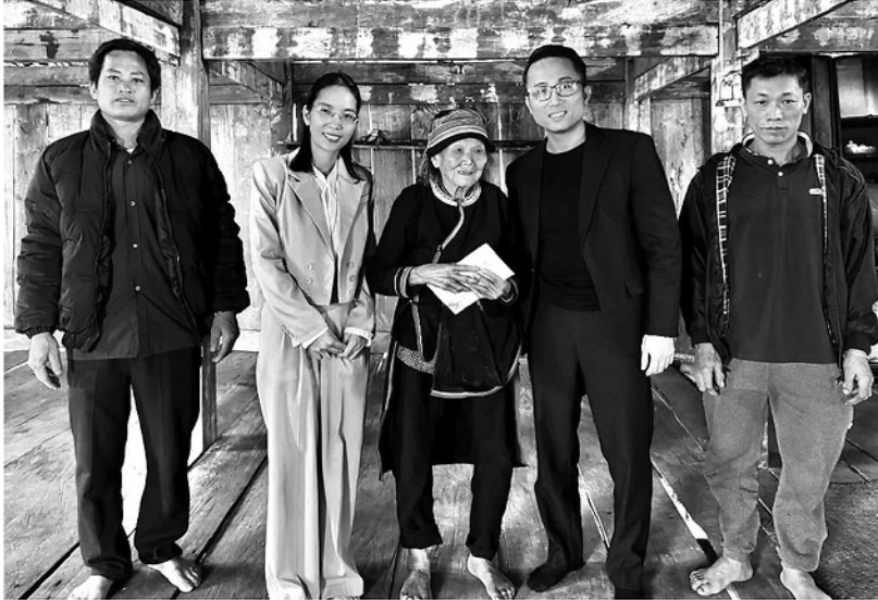
Đảng ủy, Ủy ban MTTQ xã Mậu Duệ tặng quà người cao tuổi trên địa bàn xã.

Từ đầu năm đến nay, Ủy ban MTTQ xã đã phối hợp với các cơ quan, đơn vị, doanh nghiệp và nhà hảo tâm vận động nguồn lực chăm lo cho người nghèo, gia đình chính sách và các hộ có hoàn cảnh khó khăn. Toàn xã đã trao 1.210 suất quà Tết với tổng trị giá trên 726 triệu đồng; cấp phát hơn 8 tấn gạo cho các hộ có nguy cơ thiếu lương thực dịp Tết Nguyên đán Bình Ngọc năm 2026. Đồng thời, tiếp nhận nguồn hỗ trợ 520 triệu đồng từ Ban Vận động cứu trợ tỉnh để hỗ trợ 6 hộ di dời nhà ở khỏi vùng có nguy cơ sạt lở đến nơi an toàn.