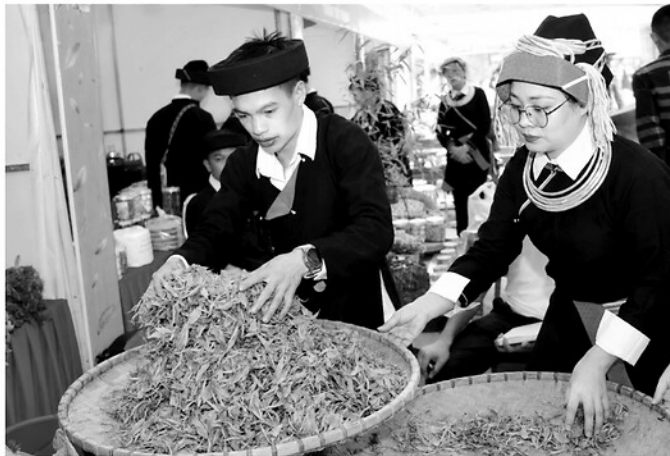
Công đoạn sơ chế chè Shan tuyết của người dân xã Cao Bồ.

Không chỉ mang giá trị kinh tế, chè Shan tuyết còn gắn bó mật thiết với đời sống của đồng bào Dao ở Cao Bồ. Từ bao đời nay, người dân nơi đây đã biết hái chè thủ công, sao chè bằng chảo gang và lưu giữ những bí quyết chế