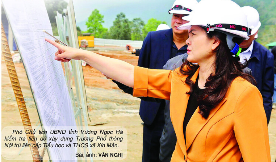
Phó Chủ tịch UBND tỉnh Vương Ngọc Hà kiểm tra tiến độ xây dựng Trường Phổ thông Nội trú liên cấp Tiểu học và THCS xã Xín Mần.