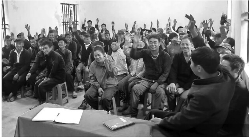
Cán bộ xã Đông Văn họp với Nhân dân các thôn Mã Pi Lềng, Séo Xà Lũng, Sả Lũng và Sáo Sả Lũng để tuyên truyền, thống nhất về phương án sáp nhập thôn.

SẮP XẾP, SÁP NHẬP THÔN, TỔ DÂN PHỐ THEO TINH THẦN CHỈ THỊ SỐ 21/CT-TTg NGÀY 20-5-2026 CỦA THỦ TƯỚNG CHÍNH PHỦ LÀ MỘT CHỦ TRƯỞNG LỚN NHẦM TINH GỌN BỘ MÁY, NÂNG CAO HIỆU LỰC, HIỆU QUẢ QUẢN LÝ VÀ TẬP TRUNG NGUỒN LỰC PHÁT TRIỂN KINH TẾ, XÃ HỘI TỪ GỐC RỄ CƠ SỞ. TUY NHIÊN, VIỆC THAY ĐỔI CÁC ĐỊA DANH GẮN LIỀN VỚI LỊCH SỬ, VĂN HÓA VÀ ĐỜI SỐNG SINH HOẠT LÂU ĐỜI CỦA NGƯỜI DÂN CHƯA BAO GIỜ LÀ VIỆC DỄ DÀNG.