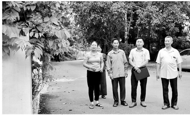
Đảng viên thôn Thác Nóng, xã Sơn Thủy kiểm tra tình hình vệ sinh môi trường ở khu dân cư.

Khắc phục điều này, bằng những cách làm sáng tạo, các địa phương ở Tuyên Quang đã khơi được ngọn lửa trong mỗi đảng viên cao tuổi, để mỗi đảng viên cao tuổi thấm nhuần: Tuổi tác có thể làm bước chân chậm lại, nhưng lý tưởng của người đảng viên thì chưa bao giờ tắt.