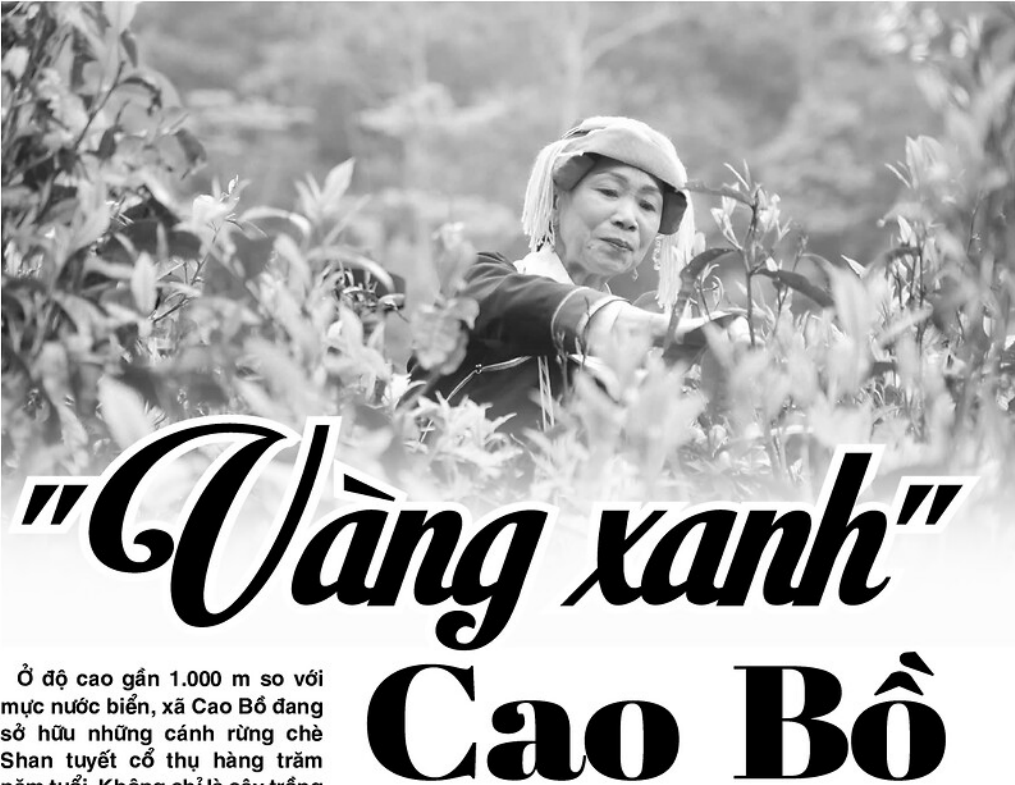
Phụ nữ Dao hái chè trên đỉnh Tây Côn Lĩnh.

xã, được hướng dẫn kỹ thuật chăm sóc, chế biến sạch nên chè bán được giá hơn. Người dân cũng có ý thức giữ rừng, bảo vệ cây chè cổ thụ vì đây là nguồn sinh kế lâu dài".