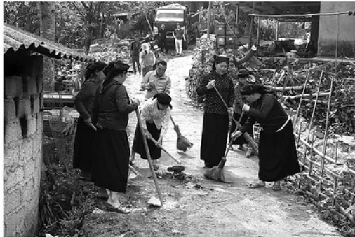
Nhân dân xã Mậu Duệ chung tay vệ sinh đường làng, ngõ xóm.

Phong trào thi đua "Xóa nhà tạm, nhà dột nát" tiếp tục được triển khai hiệu quả, trở thành điểm nhấn trong công