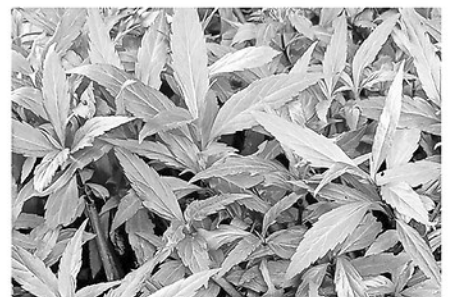
Cây mần tươi có nhiều tác dụng trong y học.