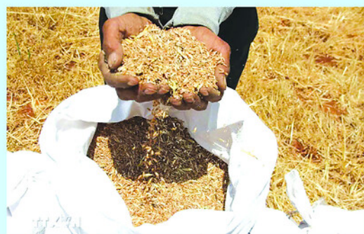
Xung đột Trung Đông có thể đẩy thêm hàng triệu người vào cảnh đói nghèo.

Kết thúc hội nghị, các nhà lãnh đạo đã gửi đi lời kêu gọi hành động khẩn cấp tới các tổ chức tài chính quốc tế để hỗ trợ thanh khoản cho nông dân trước khi chu kỳ nông nghiệp mới bắt đầu.