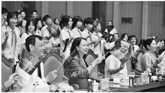
Phó Chủ tịch nước Võ Thị Ánh Xuân và đại biểu Đại hội Đảng Bộ tỉnh Tuyên Quang tại Lễ phát động Tháng hành động vì trẻ em năm 2026.

N ĂM 27/5, tại tỉnh Quảng Ninh, Phó Chủ tịch nước Võ Thị Ánh Xuân, Bí thư Trung ương Đảng, Chủ tịch Hội đồng Bảo trợ Quỹ bảo trợ trẻ em Việt Nam dự và phát biểu chỉ đạo tại Lễ phát động Tháng hành động vì trẻ em năm 2026 với chủ đề "Trẻ em hạnh phúc, an toàn, vững bước trong kỷ nguyên số". Sự kiện do Bộ Y tế phối hợp với Ủy ban nhân dân tỉnh Quảng Ninh tổ chức.