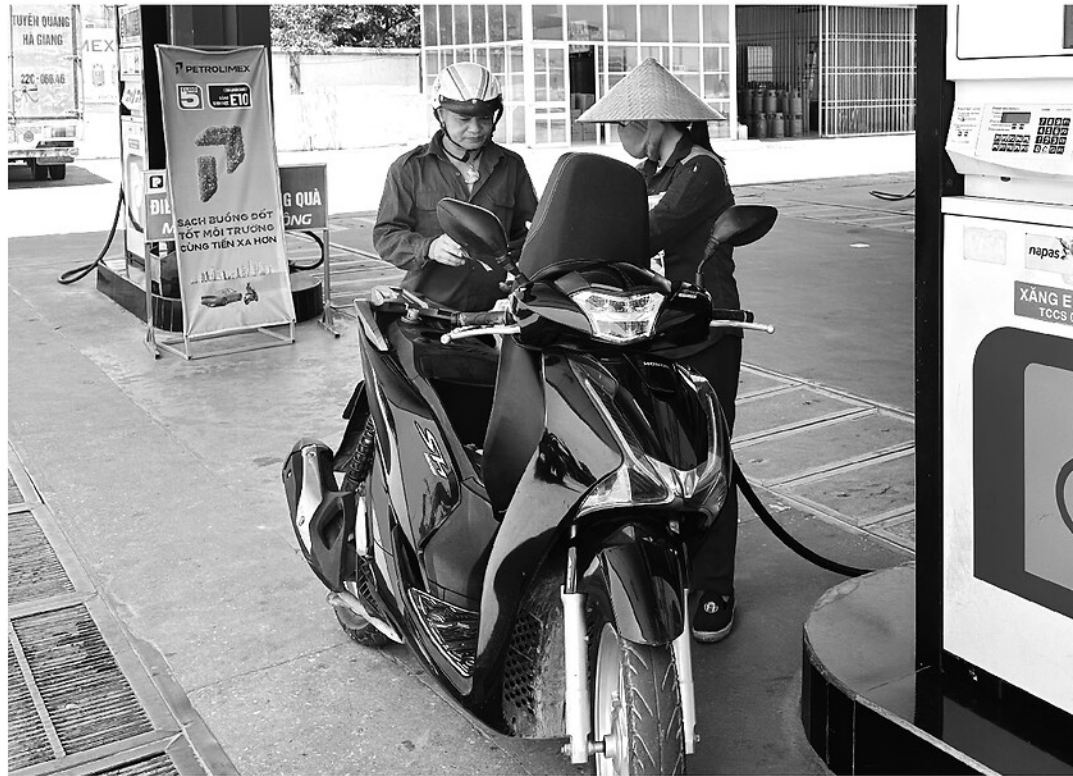
Cửa hàng xăng dầu của Petrolimex Tuyên Quang triển khai bán xăng E10 trên địa bàn tỉnh.