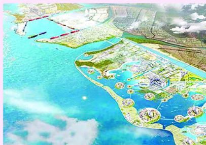
Phối cảnh Khu kinh tế biển Ninh Cơ nhìn từ trên cao.