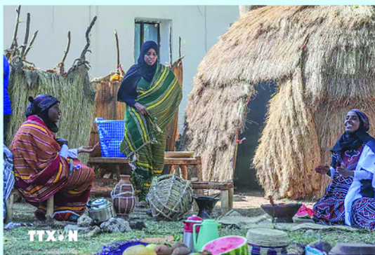
Hiện thế giới có khoảng 300 triệu người bị thiếu ăn nghiêm trọng.

Tại hội nghị, các đại biểu đã đưa ra nhiều cảnh báo về nguy cơ bùng nổ khủng hoảng lương thực toàn cầu do chuỗi cung ứng tại Eo biển Hormuz bị đình trệ.