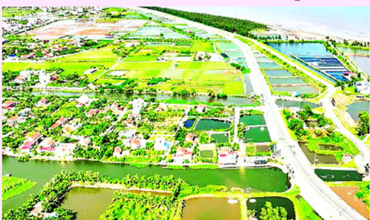
Tuyến đường bộ mới Nam Định - Lạc Quan - đường bộ ven biển đoạn qua xã Hải Quang.

T ỈNH Ninh Bình có đường bờ biển dài khoảng 89,5 km, với 16 xã ven biển, dân số vùng gần 600.000 người. Đây là khu vực có nhiều tiềm năng, lợi thế về kinh tế biển, gồm nuôi, trồng và khai thác thủy hải sản, dịch vụ hậu cần nghề cá, du lịch biển, công nghiệp chế biến,... Nhiều xã có ưu thế về quỹ đất phát triển công nghiệp, cụm công nghiệp, hệ thống giao thông ven biển tạo nên không gian phát triển mới.