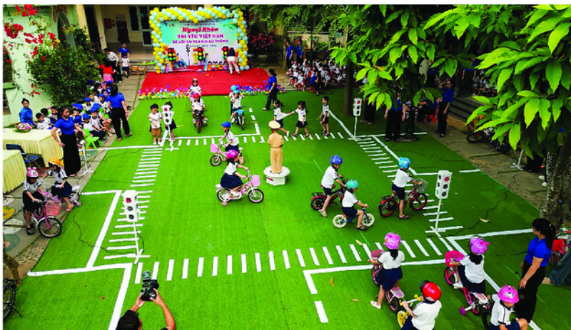
Những giờ ngoại khóa của các em nhỏ Trường Mầm non Nông Tiến, phường Nông Tiến.