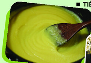
Đỗ xanh đánh nhuyễn (ảnh trái). Cốc chè giải nhiệt (ảnh phải).