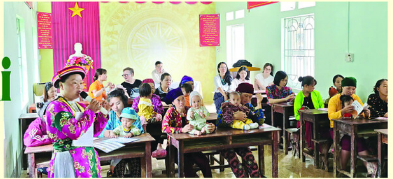
Đoàn chuyên gia Trường Đại học Monash (Úc) trao đổi, đánh giá và thúc đẩy các hoạt động chăm sóc sức khỏe bà mẹ, trẻ em tại vùng đồng bào dân tộc thiểu số tại xã Quán Bạ.

Chăm sóc, giáo dục và bảo vệ trẻ em là nhiệm vụ quan trọng, có tính chiến lược lâu dài, nhất là đối với trẻ em có hoàn cảnh đặc biệt ở vùng sâu, vùng xa. Thời gian qua, cấp ủy, chính quyền tỉnh Tuyên Quang, tổ chức đoàn thể đã triển khai nhiều chương trình, hoạt động thiết thực tạo điều kiện để trẻ em sống trong môi trường an toàn, học tập, giảm bớt thiệt thòi.