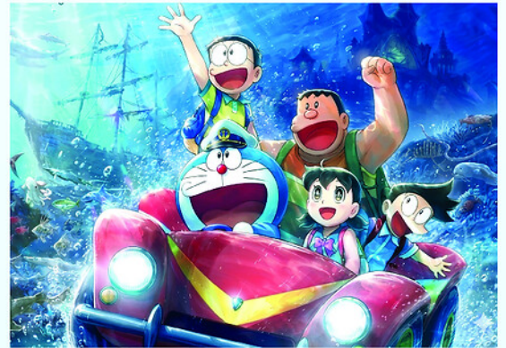
Bộ phim Doraemon: Nobita và lâu đài dưới đáy biển đang chiếm nhiều suất chiếu nhất tại các rạp trên địa bàn tỉnh.

Mùa hè 2026 đã chính thức gõ cửa bằng những tiếng ve ngân vang rộn rã và ánh nắng vàng rực rỡ. Đây là thời điểm mong đợi nhất trong năm khi các bạn nhỏ tạm gác lại sách vở, những bài kiểm tra căng thẳng để bước vào một kỳ nghỉ đầy ắp niềm vui. Đồng điệu với bầu không khí náo nhiệt ấy, phòng vé chính thức trở thành điểm giải trí hấp dẫn, sẵn sàng chào đón thế hệ măng non bằng bữa tiệc điện ảnh đa sắc màu, bùng nổ và vui nhộn.