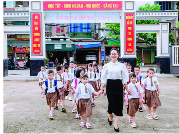
Niềm vui đến trường của học sinh Trường Tiểu học Hưng Thành, phường An Tường.

Không chỉ dừng lại ở việc chăm lo sức khỏe và vật chất, sự an toàn và quyền lợi của trẻ em còn thu hút sự đồng hành mạnh mẽ từ các đoàn thể. Tổ chức Đoàn Thanh niên các cấp