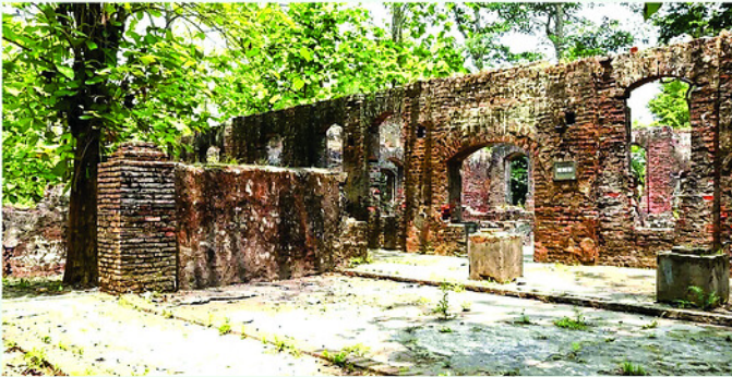
Những dấu tích được lưu giữ lại bên trong Cánh Bắc Mê.