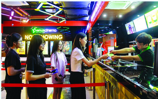
Các em học sinh háo hức mua vé tại rạp phim Venus cinema Hà Giang.