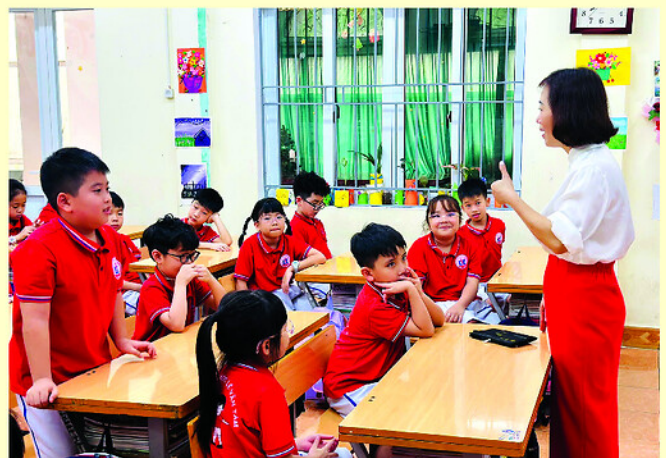
Giờ học trong Dự án cha mẹ cùng thầy cô lên lớp tại Trường Tiểu học Lê Văn Tám, phường Minh Xuân.