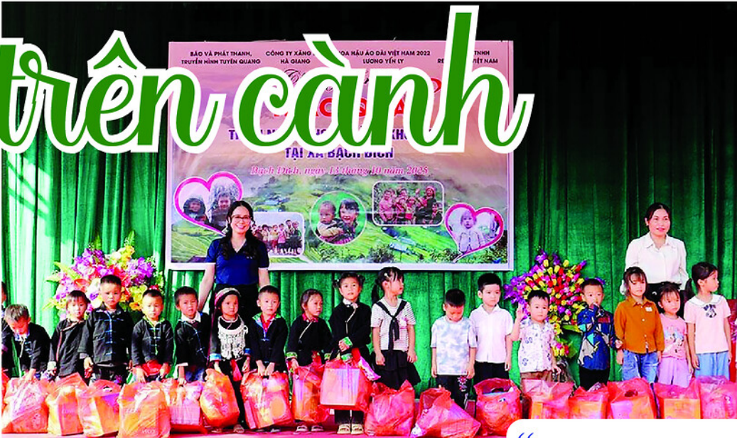
Đại diện lãnh đạo Báo và phát thanh, truyền hình Tuyên Quang tặng quà cho học sinh xã Bạch Đích.

bận rộn, vắng bóng trong những khoảng thời gian cần trò chuyện, chia sẻ cùng con. Thay vì làm bạn và thấu hiểu, không ít gia đình vô tình chuyển hóa tình thương thành áp lực học tập, đặt lên vai trẻ những kỳ vọng thành tích vượt quá sức chịu đựng, khiến các em rơi vào trạng thái căng thẳng, mệt mỏi từ rất sớm. Có những em nhỏ được chăm lo đủ đầy mọi mặt về vật chất nhưng lại trở nên lạc lõng, cô đơn ngay trong chính ngôi nhà của mình”.