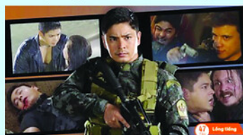
Poster phim Cạm bẫy. CẢNH TRỰC