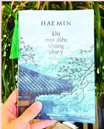
Cuốn sách như một lời thủ thi, một khoảng lặng dành cho những ai đang cảm thấy mỏi mệt giữa nhịp sống hiện đại.

C UỐN sách Khi mọi điều không như ý của Haemin Sunim là một lời thủ thi nhẹ nhàng, một khoảng lặng dành cho những ai đang cảm thấy mỏi mệt giữa nhịp sống hiện đại.