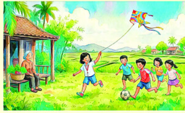
Minh họa: NGỌC AN

Chiều bé về thành phố Bà đến lau lại tường Ông thấy nhà trống vắng Lòng nhớ cháu nhiều hơn!