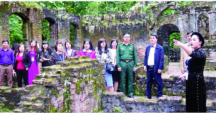
Cánh Bắc Mê là lát cắt lịch sử đáng tự hào trong lịch sử cách mạng của dân tộc.

NĂM BÊN DÒNG GÁM HIỀN HÒA, CẢNG BẮC MÊ HÔM NAY ĐÃ PHỦ RÊU PHONG VÀ VẸ TRẦM MẶC CỦA THỜI GIAN. ÍT AI BIẾT RẰNG, RING SAU NHỮNG BỨC TƯỜNG ĐÁ LẠNH LẼO ẤY TỪNG LÀ NƠI GIAM CẦM, ĐẦY ẦM CÁC CHIẾN SĨ CÁCH MẠNG YÊU NƯỚC. GIỮA ĐÓI RẾT, BỆNH TẬT VÀ XIỀNG XÍCH, HỌ VẮN ẦM THẨM TRUYỀN CHO NHAU LÝ TƯỞNG, NIỀM TIN VÀ KHÁT VỌNG TỰ DO. NHÀ TÙ KHẮC NGHIỆT DO THỰC DÂN PHÁP DỰNG LÊN ĐỂ KHUẤT PHỤC Ý CHÍ CON NGƯỜI, CUỐI CÙNG LẠI TRỞ THÀNH “TRƯỜNG HỌC CÁCH MẠNG” TÔI LUYỆN BẢN LĨNH CỦA NHỮNG NGƯỜI CỘNG SẢN KIÊN TRUNG.