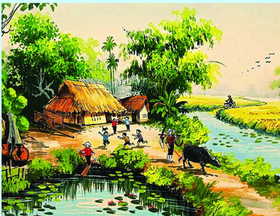
Minh họa: XUÂN ĐỨC