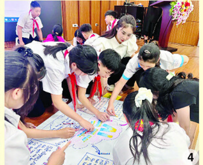
Công an xã Tùng Bá cấp thẻ cảnh sát và tài khoản định danh điện tử mức độ 2 phục vụ việc tạo học bạ số cho trẻ em từ 6 tuổi trở lên (ảnh 1). Hướng dẫn trẻ em kỹ năng phòng chống đuối nước tại Trường Tiểu học và THCS Chiêu Yên, xã Lục Hành (ảnh 2). Học sinh Trường PTDTBT Tiểu học và THCS Ngâm Đăng Vài, xã Hoàng Su Phì thảo luận về kỹ năng phòng chống mua bán người (ảnh 3). Lớp nâng cao năng lực và hướng dẫn thu thập thông tin cho thành viên Hội đồng trẻ em cấp tỉnh năm 2026 (ảnh 4).