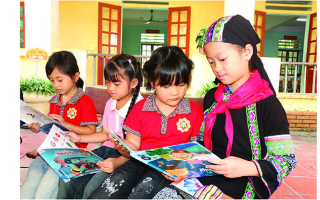
Học sinh Trường Tiểu học Quyết Tiến, xã Quán Bạ say mê đọc những cuốn sách văn học thiếu nhi.

Theo nhận định của nhiều nhà văn, cái khó nhất của văn học thiếu nhi không phải viết cho trẻ em đọc, mà là viết để trẻ em tin. Muốn làm được điều đó, người cầm bút phải giữ cho tâm hồn mình đời trong trẻo để nhìn cuộc đời bằng đôi mắt trẻ thơ, như PGS.TS, nhà văn Văn Giá từng đúc kết: “Lòng không trong veo,