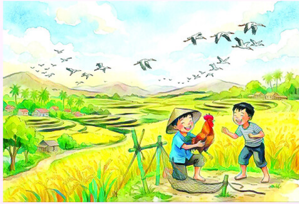
Minh họa: BÍCH NGỌC

Nghĩ sao làm vậy, chiều thứ bảy Páo xin tiền mẹ ra quán bà Béo mua chục chiếc lưỡi câu nhỏ và mấy mét cước. Trên đường về nó rủ thêm thằng Gió cùng làm bẫy. Sáng hôm sau Páo cùng Gió đem rô ra ruộng xúc tép, rồi đi gài bẫy. Gài bẫy xong hai đứa đi chân bò trên ruộng đá. Gần trưa, khi tiếng hú của lũ trẻ chặn bò gọi nhau về, cũng là lúc Páo và Gió đi thăm bẫy. Hai đứa vội vã nhào ra thửa ruộng nơi có những chiếc bẫy gài sẵn. Páo thấy tim