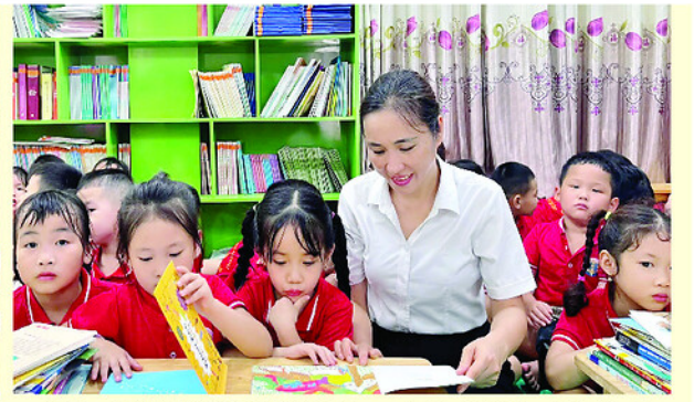
Trường PTDT Nội trú THPT Hà Giang, phường Hà Giang 2 hưởng ứng Ngày Sách và Văn hóa đọc Việt Nam lần thứ 5 năm 2026 (ảnh trái). Xây dựng và phát triển văn hóa đọc cho học sinh tại Trường Mầm non Đại Phú, xã Phú Lương (ảnh phải).