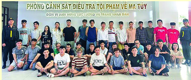
Trong số hàng trăm đối tượng bị Công an TP.HCM bắt giữ mới đây có những người là nghệ sĩ nổi tiếng.

Trong thời đại mạng xã hội, nghệ sĩ không còn chỉ xuất hiện trên sân khấu mà hiện diện hàng ngày trên điện thoại của hàng triệu người. Cách ăn mặc, nói chuyện, tiêu dùng, yêu đương hay tận hưởng cuộc sống của họ đều có thể trở thành xu hướng. Khi một người nổi tiếng sống buông thả, sử dụng ma túy hoặc có sự cố lộ lối sống hưởng thụ mà vẫn được tung hô, điều đó dễ khiến một