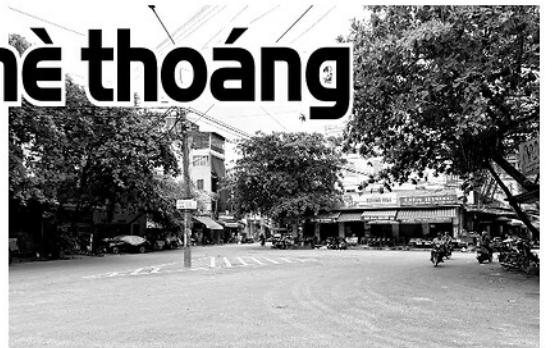
Khu vực trước đây thường xảy ra tình trạng họp chợ, bán hàng rong tại phường Minh Xuân nay đã thông thoáng, không còn tình trạng lấn chiếm lòng đường, vỉa hè sau các đợt ra quân lập lại trật tự đô thị.

Thời gian qua, nhiều địa phương trên địa bàn tỉnh đã tăng cường triển khai các giải pháp lập lại trật tự đô thị, xử lý tình trạng lấn chiếm vỉa hè, lòng đường để kinh doanh, buôn bán. Từ sự vào cuộc quyết liệt của lực lượng chức năng cùng sự đồng thuận của người dân, nhiều tuyến phố, khu chợ đã trở nên thông thoáng, sạch đẹp, góp phần xây dựng diện mạo đô thị văn minh, an toàn.