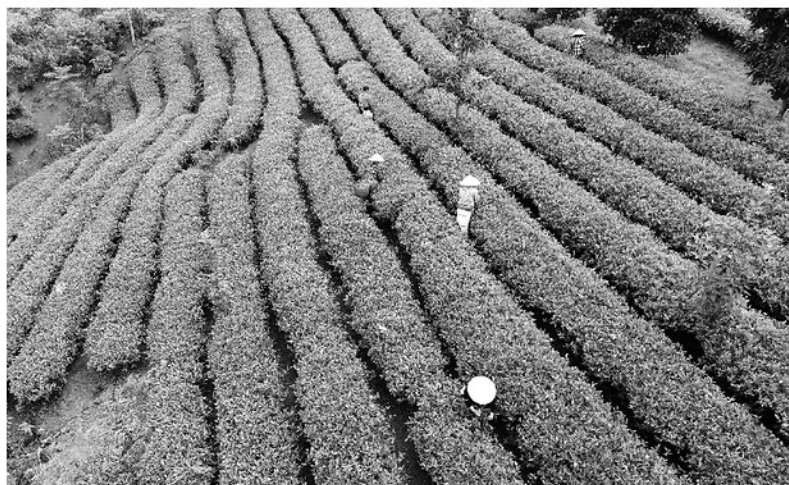
Người dân xã Tân Trào thu hái chè.

Thói quen lạm dụng phân bón hóa học và thuốc BVTV trong thời gian dài đang âm thầm "bức tử" hệ sinh thái đất tại Tuyên Quang. Đây không còn là câu chuyện của một vùng, một địa phương mà là thực trạng phổ biến ở hầu khắp các vùng sản xuất nông nghiệp trong tỉnh, nơi áp lực tăng năng suất, thâm canh đang lấn át ý thức bảo vệ môi trường và sức khỏe cộng đồng.