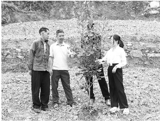
Cây mắc ca phát triển tốt, phù hợp với thổ nhưỡng, khí hậu xã Lũng Cú.

Giữa miền nông dã xám vùng cao, cấp ủy, chính quyền xã Lũng Cú luôn xác định phát triển cây trồng không chỉ là bài toán kinh tế, mà còn là cuộc chiến sinh tồn và thích nghi kỳ diệu của con người. Bằng việc tích cực chuyển đổi cơ cấu cây trồng, đưa các loại cây có giá trị kinh tế cao vào sản xuất, Lũng Cú đang từng bước nâng cao thu nhập, mở ra hướng đi bền vững cho người dân.