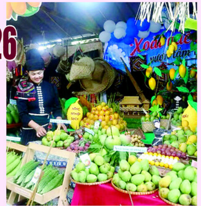
Nhiều gian hàng trưng bày xoài và các nông sản tại Ngày hội xoài Yên Châu.

cùng sự thân thiện, mến khách của người dân địa phương đã để lại nhiều ấn tượng đẹp đối với du khách.