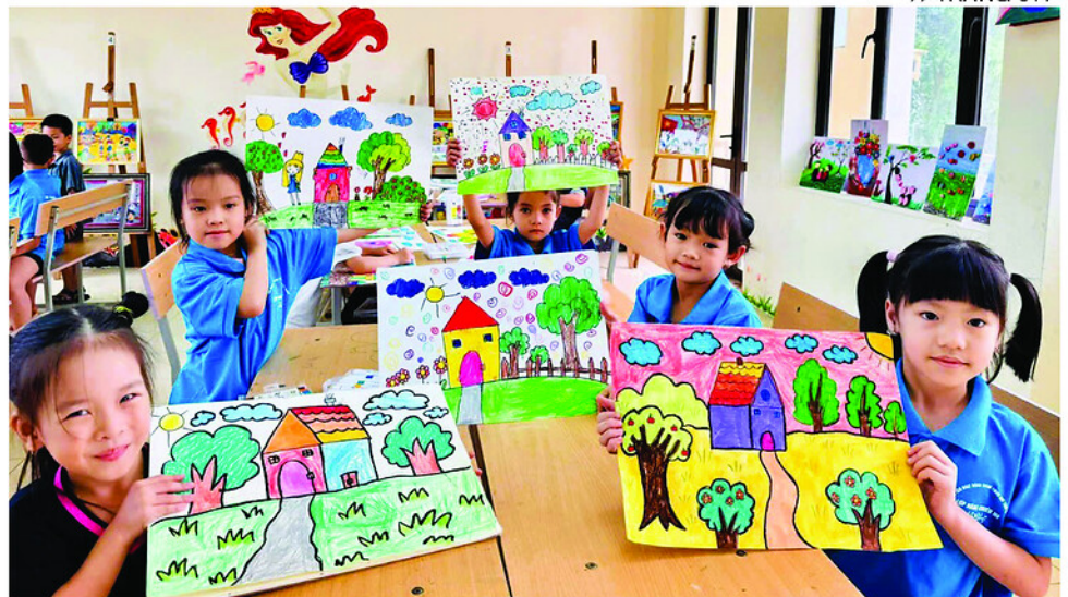
Trẻ em tham gia lớp học năng khiếu Mỹ thuật tại Trung tâm Văn hóa - Thể thao Thanh thiếu nhi tỉnh.