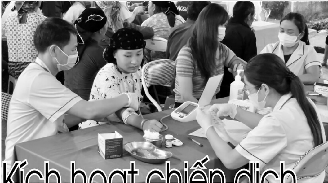
Đoàn y, bác sĩ Bệnh viện Phổi Trung ương và Bệnh viện Phổi Hà Giang khám và cấp thuốc miễn phí cho người dân xã Mậu Duê.