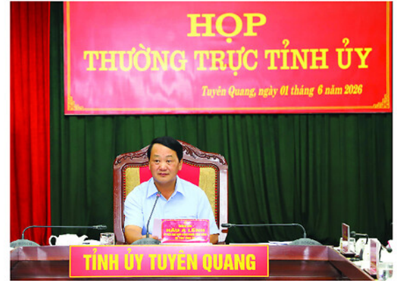
Đồng chí Bí thư Tỉnh ủy Hầu A Lệnh phát biểu tại phiên họp Thường trực Tỉnh ủy.