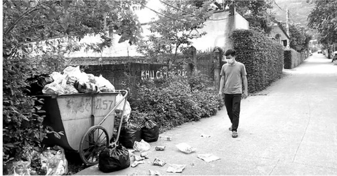
Rác thải sinh hoạt ùn ứ tại một điểm tập kết ngõ 457, đường Nguyễn Văn Linh.

Hơn một tuần kể từ khi 73 tuyến đường, ngõ, ngách trên địa bàn phường Hà Giang 2 tạm dừng thu gom rác, những vướng mắc trong quá trình triển khai phương án vẫn chưa được giải quyết. Thực tế phát sinh đang đặt ra nhiều câu hỏi về công tác khảo sát, xây dựng danh mục và tổ chức thực hiện dịch vụ công ích trên địa bàn.