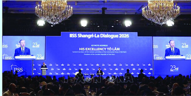
Tổng Bí thư, Chủ tịch nước Tô Lâm phát biểu dẫn đề tại Đối thoại Shangri-La lần thứ 23.

Lâm kêu gọi củng cố luật pháp quốc tế, thúc đẩy các mô hình tăng trưởng bao trùm và bền vững, đồng thời tăng cường đối thoại, minh bạch và hợp tác giữa các quốc gia nhằm ngăn chặn xu hướng bất ổn ngày càng gia tăng.