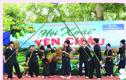
Một tiết mục văn nghệ tái hiện lại hoạt động hái xoài của đồng bào dân tộc Thái các bản của xã Yên Châu.

Trong những ngày diễn ra sự kiện, người dân còn bày bán nhiều loại nông sản đặc trưng dọc các tuyến đường quanh bản Khá, tạo nên không gian chợ quê đậm sắc màu vùng cao. Những sản vật tươi ngon