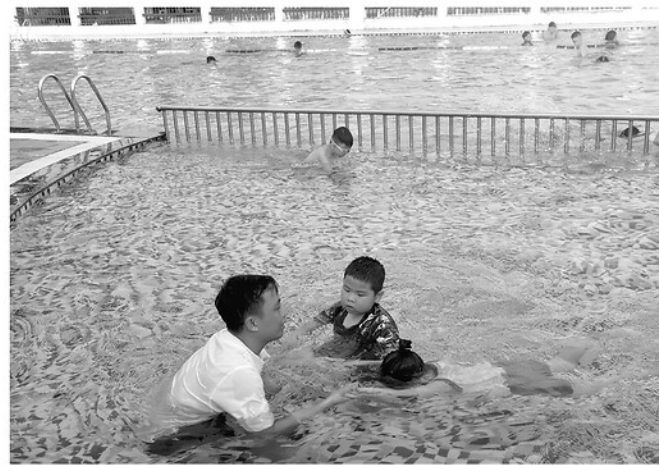
Trẻ em học kỹ năng bơi tại Trung tâm Văn hóa - Thể thao Thanh thiếu nhi

Liên tiếp các vụ đuối nước trẻ em trong thời gian gần đây, Bộ Y tế đã ra Công văn khẩn số 3574/BYT-BMTE gửi UBND các tỉnh, thành phố tăng cường công tác phòng, chống tai nạn, thương tích và