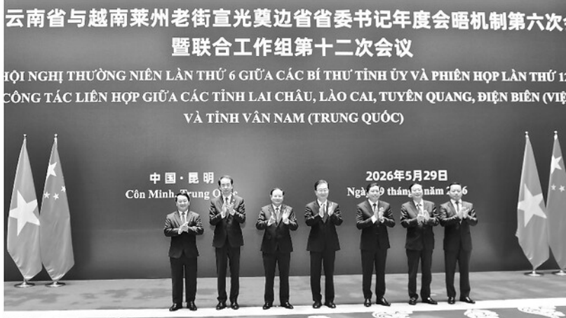
Chuyến công tác của đồng chí Bí thư Tỉnh ủy Hấu A Lệnh mở ra những triển vọng mới trong quan hệ hợp tác giữa tỉnh Tuyên Quang với tỉnh Vân Nam trên nhiều lĩnh vực.

Chuyến công tác của đồng chí Hấu A Lệnh, Ủy viên BCH Trung ương Đảng, Bí thư Tỉnh ủy tại tỉnh Vân Nam (Trung Quốc) từ ngày 28 đến 30-5 đã để lại nhiều dấu ấn quan trọng, góp phần cụ thể hóa nhận thức chung của lãnh đạo cấp cao hai Đảng, hai Nhà nước Việt Nam - Trung Quốc. Đồng thời mở ra những triển vọng mới trong quan hệ hợp tác giữa tỉnh Tuyên Quang với tỉnh Vân Nam trên nhiều lĩnh vực.