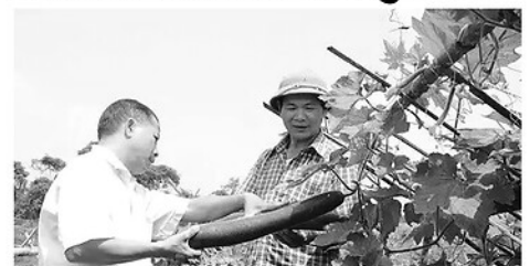
Bí xanh thơm Hồng Thái.

H ỒNG THÁI hiện có hơn 6 ha trồng bí xanh thơm. Với điều kiện khí hậu mát mẻ, sản phẩm bí xanh thơm ở Hồng Thái quả chắc, ruột đặc, thơm và bùi nên rất được khách hàng ưa chuộng. Sản phẩm đã được công nhận đạt OCOP 3 sao từ năm 2023.