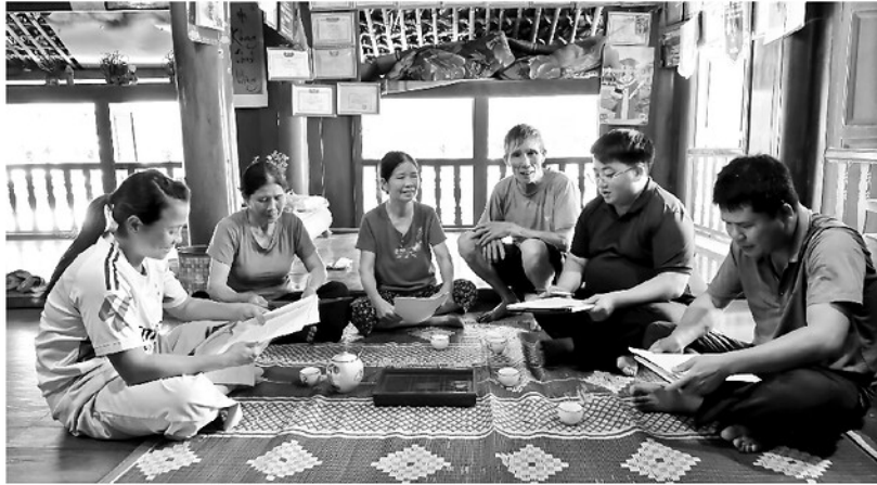
Cán bộ xã Bình An tuyên truyền, lấy ý kiến Nhân dân về phương án sắp xếp, sáp nhập thôn.

Sau sắp xếp, yêu cầu đối với đội ngũ cán bộ thôn sẽ cao hơn, nhất là trong ứng dụng công nghệ thông tin, chuyển đổi số và công tác tuyên truyền, hướng dẫn người dân. Do đó, xã sẽ rà soát, kiện toàn những vị trí còn hạn chế