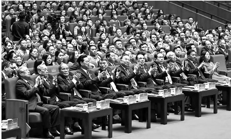
Tổng Bí thư, Chủ tịch nước Tô Lâm cùng các đồng chí lãnh đạo, nguyên lãnh đạo Đảng, Nhà nước và các đại biểu dự Đại hội.