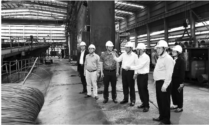
Lãnh đạo Khu Công nghiệp và kinh tế tỉnh kiểm tra môi trường lao động sản xuất của Công ty Gang thép Tuyên Quang.

Trong tiến trình phát triển kinh tế - xã hội, tỉnh Tuyên Quang kiên định quan điểm phát triển phải đi đôi với bảo vệ môi trường, không đánh đổi môi trường lấy tăng trưởng kinh tế. Đây không chỉ là định hướng xuyên suốt trong thu hút đầu tư, phát triển công nghiệp, nông nghiệp mà còn là yêu cầu bắt buộc nhằm hướng tới tăng trưởng xanh, phát triển bền vững.