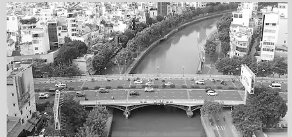
Điện mạo của nhiều tuyến đường trên địa bàn phường Phú Nhuận, Thành phố Hồ Chí Minh, đã thay đổi căn bản.

S AU gần một năm vận hành mô hình chính quyền hai cấp, những con đường thông thoáng, thủ tục hành chính thông suốt là câu trả lời thuyết phục cho hiệu quả của bộ máy hành chính mới ở TP Hồ Chí Minh.