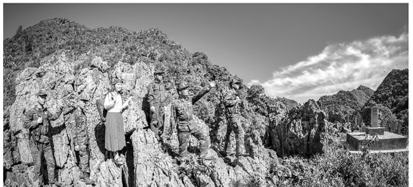
Giờ tuần tra của cán bộ, chiến sỹ và Nhân dân Đồn Biên phòng Đồng Văn tại cột mốc 397, thôn Lao Xa, xã Sà Phìn.