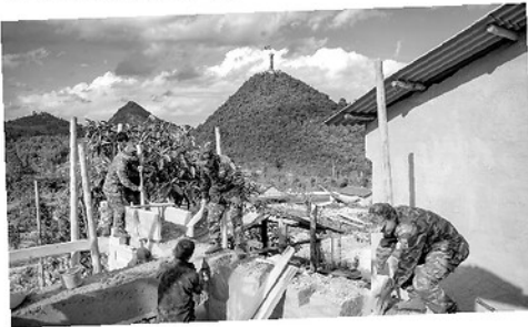
Cán bộ, chiến sỹ Biên phòng Lũng Cú giúp đỡ Nhân dân làm nhà ở (ảnh trái); Mô hình "Con nuôi Đồn Biên phòng" được cán bộ, chiến sỹ đồn Biên phòng Đồng Văn triển khai hiệu quả, thiết thực, ý nghĩa (ảnh phải).