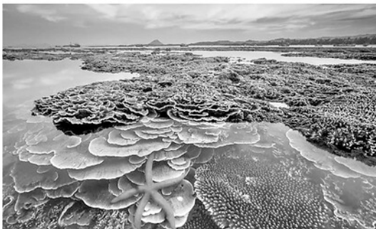
Những thảm san hô đa sắc màu nhô lên khỏi mặt nước như một vườn đá đang nở hoa rực rỡ.