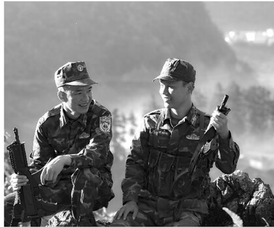
Phút nghỉ ngơi của cán bộ, chiến sỹ Đồn Biên phòng Đồng Văn.

Khi ánh nắng đầu ngày vừa xuyên qua lớp sương mờ dày đặc, những dãy núi đá tai mèo trùng trùng, điệp điệp nơi miền cực Bắc dần hiện lên như một bức tranh trảm mặc mà kiêu hãnh. Dọc theo con đường tuần tra biên giới, những bước chân người lính Biên phòng vẫn âm thầm in dấu, miệt mài bám trụ giữa núi rừng hùng vĩ. Giữa núi rừng biên cương, họ chính là "lá chắn thép" gắn Dân, sát Dân, xây dựng thế trận Biên phòng toàn dân vững chắc nơi địa đầu Tổ quốc.