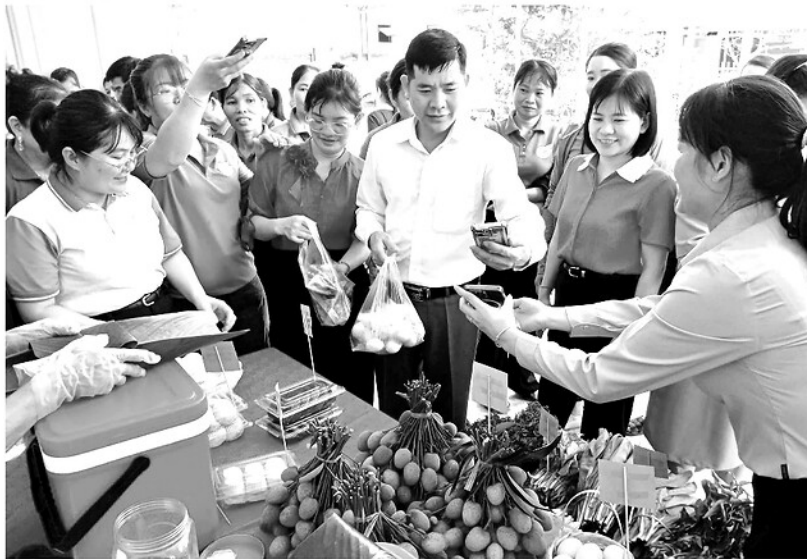
Phụ nữ xã Tân An giới thiệu, quảng bá nông sản địa phương tại mô hình "Chợ số, nông thôn số".

Bằng những cách làm linh hoạt, sáng tạo, các cấp Hội Liên hiệp Phụ nữ trên địa bàn tỉnh đang triển khai nhiều mô hình thiết thực nhằm nâng cao năng lực số cho hội viên. Từ đó giúp phụ nữ mạnh dạn ứng dụng công nghệ vào sản xuất, kinh doanh, góp phần nâng cao thu nhập và thích ứng với xu thế chuyển đổi số.