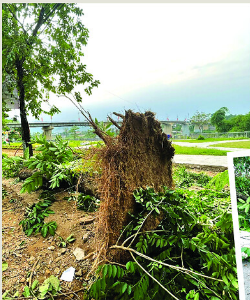
Cây bàng lãng mấy chục năm tuổi bị bật gốc tối 3-6.

Hàng cây dọc đường Chiến thắng Sông Lô, phường Minh Xuân đang trong giai đoạn cải tạo vỉa hè bị bóc gạch lát và đất xung quanh, trơ gốc và rễ gần tháng nay. Trận dông tối 3-6 vừa qua đã có 2 cây bị đổ, may mắn chưa gây thiệt hại về người và tài sản. Những cây còn lại cũng có nguy cơ đổ bất cứ lúc nào, gây nguy hiểm tính mạng người đi đường. Mùa mưa bão đang đến, đề nghị cơ quan chức năng sớm có biện pháp bảo vệ cây và đẩy nhanh tiến độ thi công vỉa hè, đảm bảo trật tự an toàn và mỹ quan đô thị.