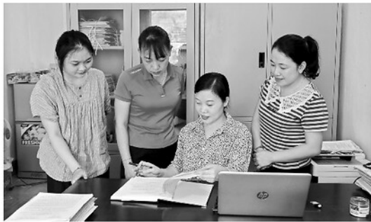
Cán bộ xã Tân Trịnh rà soát, hoàn thiện phương án sắp xếp thôn phù hợp với điều kiện thực tế địa phương.

Theo định hướng của tỉnh, việc sắp xếp thôn, tổ dân phố phải gắn với kiện toàn tổ chức các chi bộ, chi hội, đoàn thể ở cơ sở; đồng thời bố trí đội ngũ cán bộ theo hướng phát huy vai trò của những người có uy tín, kinh nghiệm trong cộng đồng và quan tâm đội ngũ cán bộ trẻ có trình độ công nghệ thông tin, đáp ứng yêu cầu chuyển đổi số trong giai đoạn mới. Những người có uy tín, năng lực, tinh thần trách nhiệm sẽ tiếp tục được xem xét, bố trí