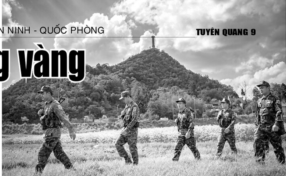
Đồn Biên phòng Lũng Cú, hiện quản lý biên giới dài hơn 30 km, gồm 36 Mốc giới và có 1 lối mở truyền thống. (Trong ảnh: Cán bộ, chiến sỹ Đồn Biên phòng Lũng Cú trong giờ tuần tra).