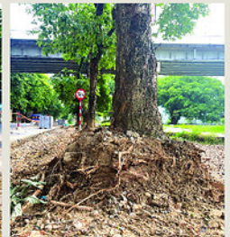
Các cây xanh nhiều chục năm tuổi bị bóc đất, cắt rễ (ảnh trái). Cả hàng cây đều trơ gốc và rễ, mùa mưa bão có thể đổ bất cứ lúc nào (ảnh phải).