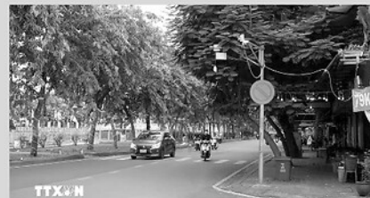
Những tuyến đường từng là điểm nóng về lấn chiếm lòng lề đường và ngập rác thì nay trở nên sạch đẹp, thông thoáng.

Thay vì chỉ phạt dẹt các chủ tài xế quẹo nhấc, chính quyền địa phương đã chọn cách đi từng ngõ, gõ từng nhà, lắng nghe khó khăn của từng hộ kinh doanh để cùng tìm giải pháp vẹn toàn.