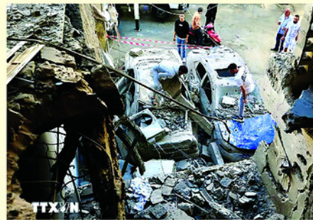
Israel và Liban đã nhất trí thực thi lệnh ngừng bắn.

Bên cạnh đó, hai bên cũng nhất trí sẽ nhóm họp lại để tiếp tục đàm phán về "lộ trình chính trị và an ninh" trong tuần tới, với mục tiêu đạt được "thỏa thuận toàn diện".