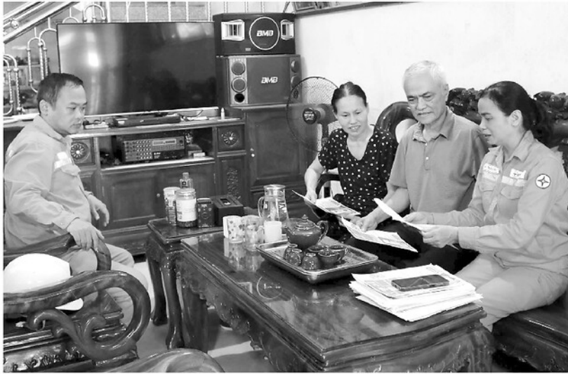
Cán bộ Công ty Điện lực Tuyên Quang tuyên truyền người dân sử dụng điện tiết kiệm.

Từ tháng 6 đến tháng 8 là giai đoạn cao điểm của mùa nắng nóng, kéo theo nhu cầu sử dụng điện phục vụ sinh hoạt, sản xuất, kinh doanh tăng mạnh. Trước nguy cơ quá tải cục bộ và thiếu điện trong những thời điểm cao điểm, các ngành chức năng, ngành Điện cùng chính quyền các địa phương đang tích cực triển khai nhiều giải pháp đồng bộ nhằm bảo đảm cung ứng điện ổn định, phục vụ phát triển kinh tế - xã hội và đời sống Nhân dân.