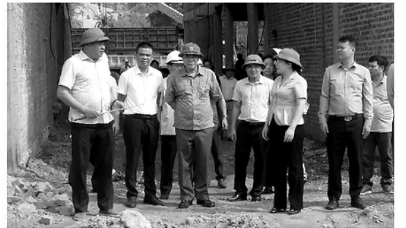
Đồng chí Phó Chủ tịch UBND tỉnh kiểm tra tiến độ thi công Dự án Trường Phổ thông Nội trú liên cấp Tiểu học và THCS Pà Vây Sủ.

Theo báo cáo của Ban Quản lý dự án đầu tư xây dựng công trình tỉnh, hiện nay đơn vị đang làm chủ đầu tư 3 dự án đầu tư công khẩn cấp trên địa bàn xã Pà Vây Sủ. Trong đó, dự án Ổn định dân cư khẩn cấp xã Bàn Ngò, huyện Xin Mần, tỉnh Hà Giang (nay là xã Pà Vây Sủ, tỉnh Tuyên Quang) đạt khoảng 34% khối lượng; dự án Ổn định dân cư khẩn cấp xã Nàn Ma, huyện Xin Mần, tỉnh Hà Giang (nay là xã Pà Vây Sủ, tỉnh Tuyên Quang) đạt khoảng 46%; dự án Xây dựng Trường Phổ thông Nội trú liên cấp Tiểu học và THCS Pà Vây Sủ đạt khoảng 45%. Quá trình triển khai các dự án còn gặp một số khó khăn do địa hình, địa chất phức tạp. Tại dự án Ổn định dân cư khẩn cấp xã Bàn Ngò, một số vị trí thi công và tuyến đường bê tông di xã Bàn Ngò (cũ) xây ra sạt lỏ, ảnh hưởng đến an toàn công trình và việc vận chuyển vật tư, vật liệu. Đối với dự án Ổn định dân cư khẩn cấp xã Nàn Ma, công tác giải phóng mặt bằng còn vướng mắc; một số vị trí trên tuyến đường kết nối xây ra sạt lỏ taluy dương, tiềm ẩn nguy cơ mất an toàn công trình.