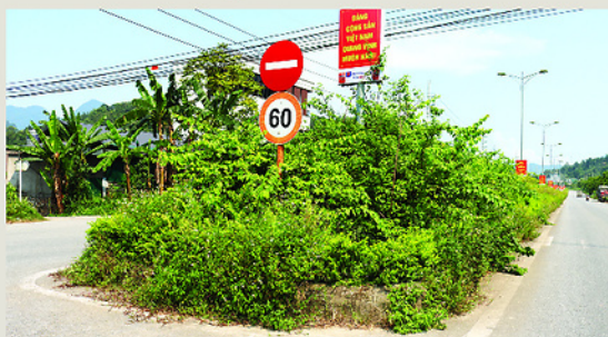
SƠN HÀ Cây cỏ mọc tràn lan ở dải phân cách cứng trên tuyến đường đôi cầu Mè - Công viên nước Hà Phương, phường Hà Giang 1 gây mất mỹ quan. Ảnh chụp ngày 27-5.

Tuyến đường đôi cầu Mè - Công viên nước Hà Phương, thuộc địa bàn phường Hà Giang 1, tại nhiều điểm trên dải phân cách cứng giữa đường, cây xanh, cỏ dại mọc um tùm, che khuất cả biển báo giao thông và làm mất mỹ quan đô thị.