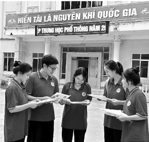
Thí sinh tại điểm thi Trường THPT Tân Trào trao đổi sau khi hoàn thành bài thi môn Ngữ Văn.