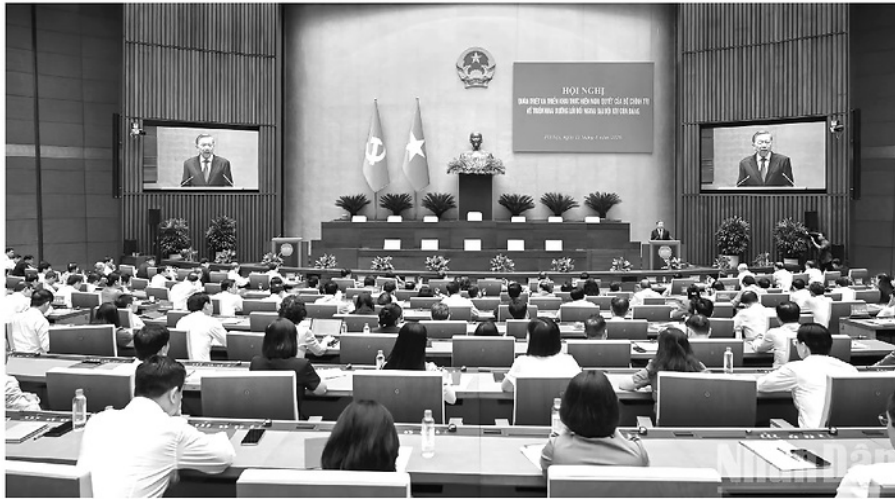
Quang cảnh Hội nghị quán triệt và triển khai thực hiện Nghị quyết của Bộ Chính trị về triển khai đường lối đối ngoại Đại hội XIV của Đảng.

NGÀY 11/6, tại Hà Nội, Bộ Chính trị, Ban Bí thư Trung ương Đảng tổ chức Hội nghị toàn quốc nghiên cứu, học tập, quán triệt và triển khai thực hiện Nghị quyết số 06-NQ/TW ngày 19/5/2026 của Bộ Chính trị về triển khai đường lối đối ngoại Đại hội XIV của Đảng. Tổng Bí thư, Chủ tịch nước Tô Lâm dự và phát biểu chỉ đạo hội nghị.