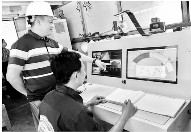
Công nhân Nhà máy Gạch tuynel chất lượng cao Tuyên Quang vận hành dây chuyền sản xuất tại Trung tâm điều hành, góp phần nâng cao năng suất lao động nhờ ứng dụng chuyển đổi số.

Xác định con người là yếu tố quyết định thành công của quá trình chuyển đổi số, thời gian qua, Liên đoàn Lao động (LĐLĐ) tỉnh đã phối hợp với các công đoàn cơ sở và doanh nghiệp triển khai nhiều hoạt động tuyên truyền, tập huấn, hướng dẫn kỹ năng số cho đoàn viên, người lao động, góp phần nâng cao chất lượng nguồn nhân lực đáp ứng yêu cầu phát triển trong giai đoạn mới.