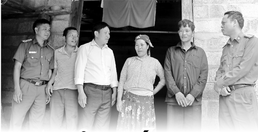
Tổ công tác xã Thăng Mổ đến cụm dân cư tuyên truyền về phương án sắp xếp thôn.