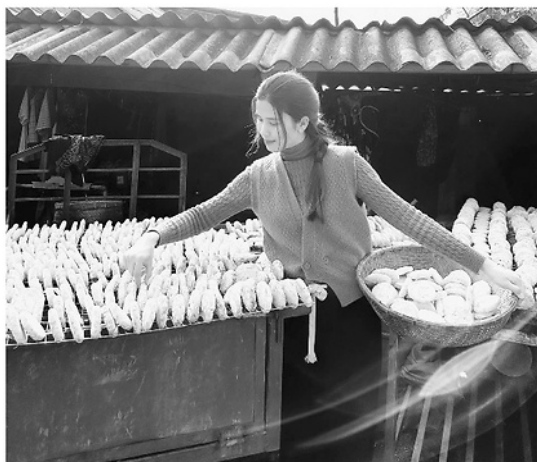
Những bánh men lá được hong khô và chăm sóc cẩn thận, bảo đảm chất lượng sản phẩm.

Năm 2022, Hợp tác xã (HTX) Nông nghiệp du lịch cộng đồng Thanh Vân được thành lập gồm 9 thành viên do chị Nhi làm Giám đốc. Những mẻ men đầu tiên