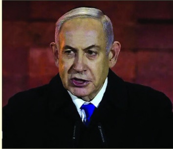
Ngày 8/6, Thủ tướng Israel Benjamin Netanyahu tuyên bố xung đột đã chấm dứt sau khi các cuộc không kích của Israel khiến Iran ngừng tấn công.

THẾ giới đang phân cực hơn nhiều khi nửa thập niên qua chứng kiến nhiều cuộc xung đột lớn diễn ra cùng lúc và nối tiếp nhau; các cuộc xung đột diễn ra liên tiếp với mức độ tàn phá cao trên toàn cầu.