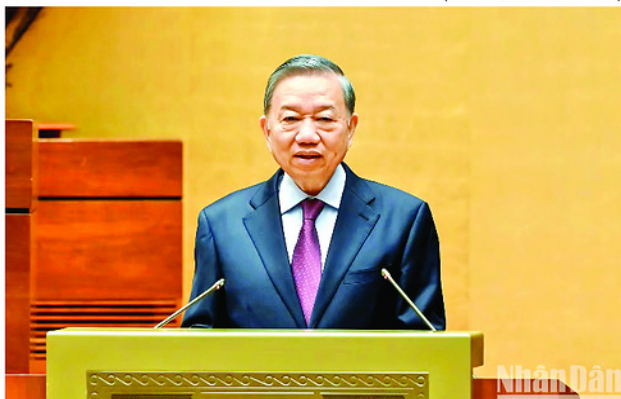
Tổng Bí thư, Chủ tịch nước Tô Lâm phát biểu chỉ đạo tại hội nghị.