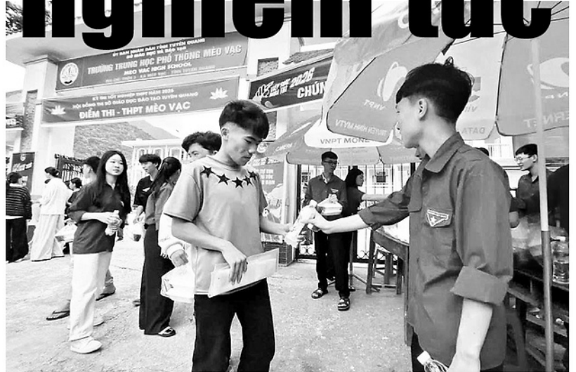
Lực lượng thanh niên tình nguyện tiếp nước cho thí sinh tại điểm thi Trường THPT Mèo Vạc.

Kỳ thi tốt nghiệp THPT năm 2026 đánh dấu nhiều cột mốc đặc biệt đối với ngành Giáo dục và Đào tạo tỉnh Tuyên Quang cũng như các thí sinh. Đây không chỉ là kỳ thi đầu tiên được tổ chức sau khi địa phương thực hiện sắp xếp các đơn vị hành chính, mà còn là năm thứ hai được tổ chức theo Chương trình Giáo dục phổ thông 2018. Ghi nhận trong ngày thi đầu tiên (11-6) cho thấy việc tổ chức kỳ thi diễn ra an toàn, nghiêm túc, thí sinh phấn khởi, tự tin khi được cả xã hội quan tâm, tạo điều kiện thuận lợi nhất.