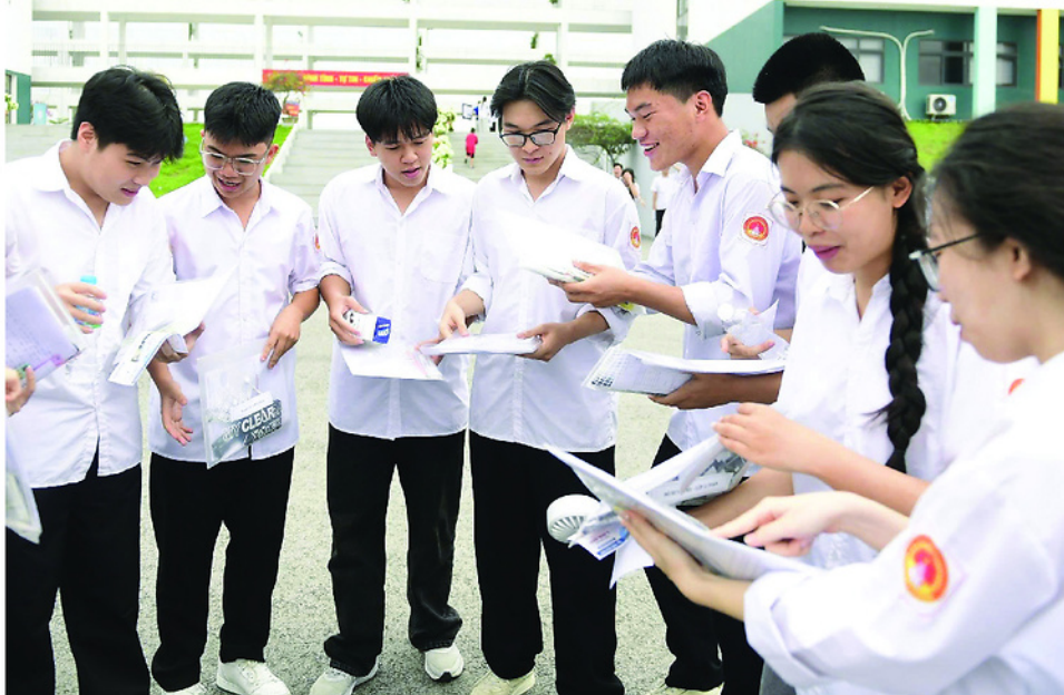
Thí sinh tại điểm thi Trường THPT Chuyên Tuyên Quang trao đổi về đề thi môn Ngữ Văn trong ngày thi thử nhất.