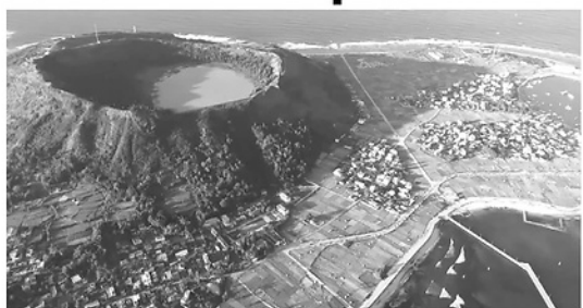
Hình ảnh miệng núi lửa được hình thành hàng triệu năm trên đảo Lý Sơn thu hút đông đảo du khách ghé thăm mỗi năm.

Dù tiềm năng rất lớn nhưng du lịch Quảng Ngãi vẫn đang đối mặt với nhiều rào cản như: Hạ tầng du lịch chưa đồng bộ, chất lượng dịch vụ và nguồn nhân lực chất lượng cao còn thiếu; sản phẩm du lịch hiện tại chủ yếu vẫn dừng lại ở mức độ ngắm cảnh, tắm biển, thiếu các trải nghiệm cao cấp hoặc các tour văn hóa - nghỉ dưỡng được đầu tư bài bản. Bên cạnh