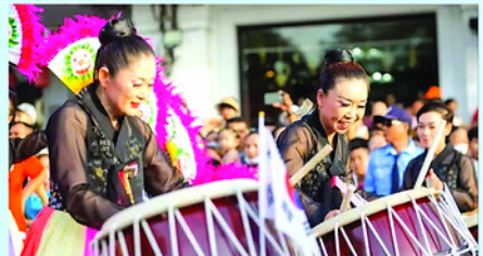
Đoàn nghệ thuật dân gian SaeNyuk (Hàn Quốc) tham gia biểu diễn múa trống tại lễ hội đường phố Festival mùa Hạ tại Huế.

Một trong những nội dung được hai bên đặc biệt quan tâm là phát triển mô hình du lịch chăm sóc sức khỏe (medical tourism) - xu hướng đang phát triển mạnh tại nhiều quốc gia trên thế giới. Huế hiện sở hữu nhiều lợi thế để phát triển loại hình du lịch này. Bởi không chỉ là vùng đất di sản nổi tiếng với hệ thống di tích văn hóa đặc sắc, cảnh quan thiên nhiên phong phú, Huế còn là trung tâm y tế chuyên sâu của khu vực miền Trung với mạng lưới bệnh viện, cơ sở đào tạo y khoa và đội ngũ chuyên gia có trình độ cao.