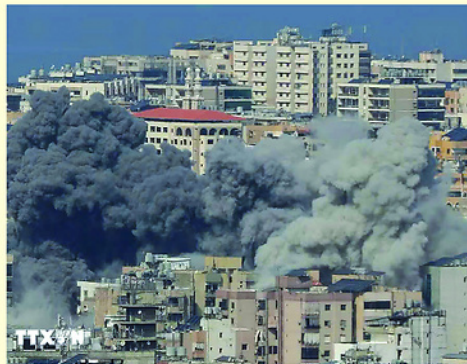
Khói bốc lên từ những tòa nhà sau vụ tấn công vào khu vực Haret Hreik, phía Nam Thủ đô Beirut, Liban.

Châu Phi vẫn là khu vực chịu ảnh hưởng nặng nề nhất của loại hình xung đột có liên quan đến ít nhất một quốc gia, với 29 cuộc xung đột, tiếp theo là châu Á, Trung Đông, châu Mỹ và châu Âu.