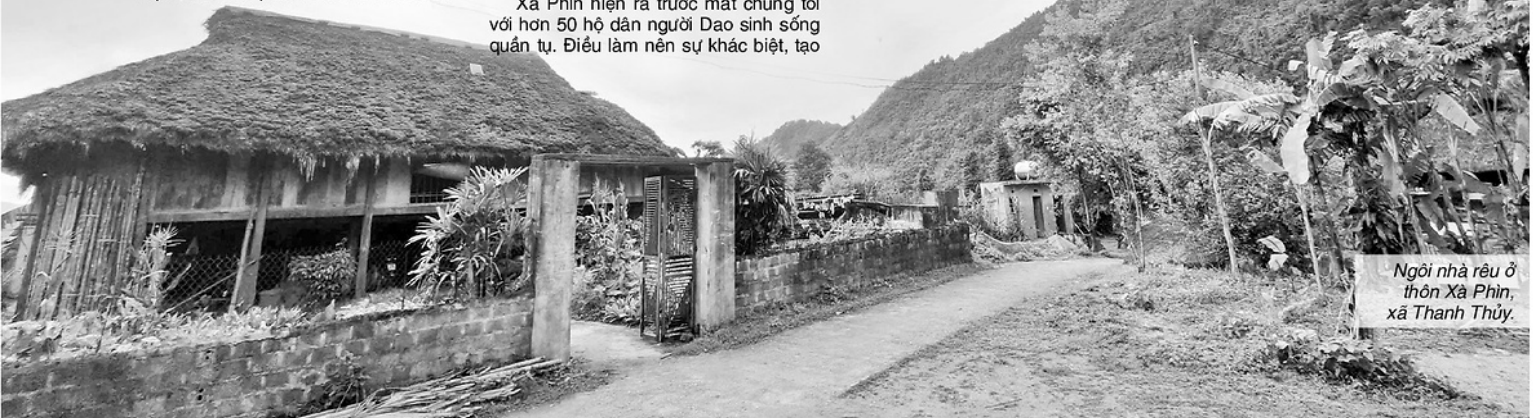
Ngôi nhà rêu ở thôn Xà Phìn, xã Thanh Thủy.

Điều đáng quý nhất là, giữa dòng chảy kinh tế hối hả, thanh âm bản địa vẫn vẹn nguyên trong từng nếp áo chàm thêu chỉ ngũ sắc, trong không khí trang nghiêm của Lễ Cấp sắc trưởng thành, và cả hơi ấm rục rịch từ nghi lễ nhảy lửa huyền bí. Những báu vật tinh thần vô giá ấy vẫn đang được trao truyền qua từng thế hệ, làm bệ đỡ vững chắc cho một Xà Phìn vừa giàu có, vừa đậm đà bản sắc riêng.