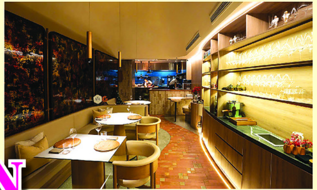
Nhà hàng Upstairs (TP Hồ Chí Minh) mới được trao 1 sao Michelin.

Tại lễ công bố Michelin Guide Hà Nội - TP.HCM - Đà Nẵng ngày 4/6/2026 mới đây, Việt Nam có 11 nhà hàng đạt 1 sao Michelin và 193 cơ sở ăn uống khác được vinh danh. Là biểu tượng của đỉnh cao nghệ thuật ẩm thực, sao Michelin là niềm mơ ước của mỗi nhà hàng để họ có mặt trên bản đồ ẩm thực quốc tế, thu hút thực khách từ khắp nơi trên thế giới.