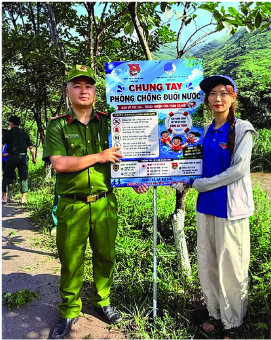
Đoàn Thanh niên xã Du Già phối hợp cùng lực lượng Công an treo biển phòng chống đuối nước.

Với thông điệp “Mùa thi hạnh phúc”, không quản ngại những cơn mưa giông bất chợt hay cái nắng nồm đê lùa của mùa hè, các đội hình tình nguyện viên túc trực tại tất cả các điểm thi để hỗ trợ phương tiện đi lại, cung cấp nước uống, vật dụng cần thiết, đảm bảo an toàn giao thông và hỗ trợ tối đa cho các thí sinh có hoàn cảnh khó khăn. Đặc biệt, việc triển