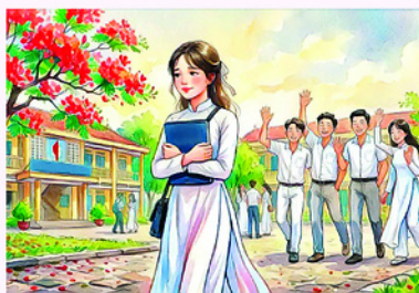
Minh họa: NGỌC AN

Những cơn mưa không tuổi nhớ đông Những cơn ốc vặn mình thành ốc Những bầy cua ngang ngược thành cua Mình bao giờ cũng là ngày xưa. Quảng vào nước những loài hoa buồn héo Vực vào mưa hong hồng nụ cười Hồn nhiên hời, mưa đông không tuổi Cứ đi đi, cô bé lọ lem à. Tôi còn ở lấc lư cô ọt Ướt cánh chuồn kim tí tẹo thôi Này nhé, cô rôm kia đừng cắt Tôi vẫn cùng trâu thả sáo về. Tắm một đồng mưa thoát phồng phao Thoắt bé bỏng trong mắt nhìn cô bé Bay biến hết những bóng bay hồn tui Lịm vào đồng mưa nhớ mưa quên.