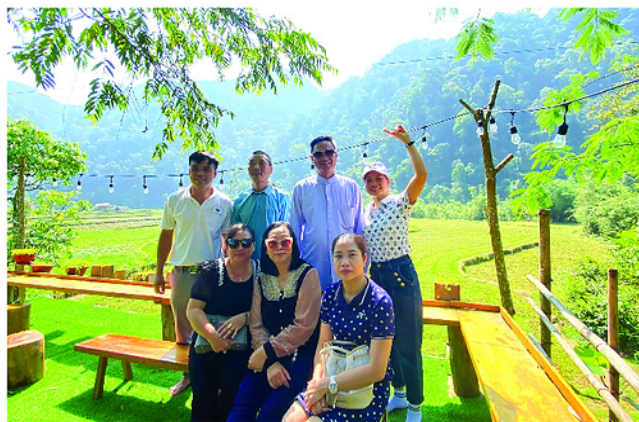
Mỗi dịp cuối tuần, khách du lịch đến Cao Đường ngày một đông hơn.

Nằm lọt thỏm giữa vùng đệm của đại ngàn, Cao Đường mang trong mình nhịp sống nương tựa vào mẹ thiên nhiên. Nơi đây là vùng đất hiếm hoi của xã Bạch Xa không trồng cam, mà những chỗ cho canh trồng lúa rộng hơn 30 ha trải dài quanh co theo các khe núi. Mùa hè lúa xanh mơn mớn, thu sang lại nhuộm màu vàng óng như dải lụa mềm vắt ngang sườn đồi. Không chỉ có cảnh sắc mộng mơ, nơi này còn giấu những kỳ quan bí ẩn như hang Rói, suối ngầm, hay hang Quả Na với những vòm thạch nhũ lung linh, huyền ảo như một thế giới khác xa chốn phàm trần.