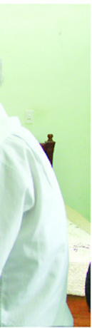
Dù sức khỏe giảm nhiều, nhà văn Nguyễn Trần Bé vẫn miệt mài với các trang viết.

Với tỷ lệ đồng bào dân tộc thiểu số, chiếm 73,5% dân số, Tuyên Quang sở hữu kho tàng văn hóa đặc sắc được gìn giữ qua nhiều thế hệ. Trong mạch nguồn ấy, nhạc cụ dân tộc chính là “bảo tàng ký ức” của cộng đồng, kết tinh bản sắc văn hóa, tâm hồn dân tộc, trở thành sợi dây vô hình kết nối quá khứ với hiện tại, để đi sản hưng lên sức sống trong dòng chảy đương đại.