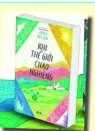
Cuốn sách là một câu chuyện vừa đau đớn vừa đẹp đẽ, giúp đứng dậy sau biến cố, yêu thương sau tổn thương.