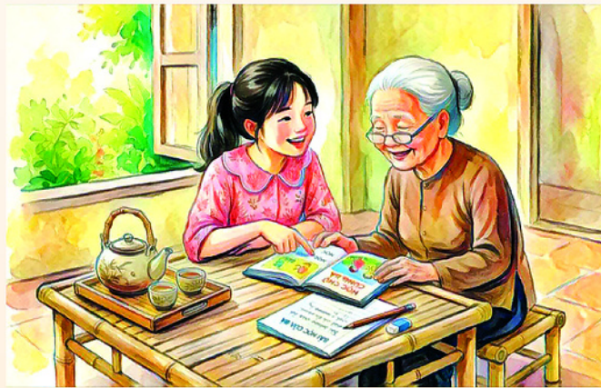
Minh họa: BÍCH NGỌC

Năm tháng chậm rãi trôi đi. Dưới sự bao bọc của bà, hai đứa con lớn lên, học hành đến nơi đến chốn. Người con gái đầu đi làm xa, lấy chồng trên thành phố. Việc làm ăn thuận lợi nên bao giờ về nhà mẹ, cô cũng sắm sửa