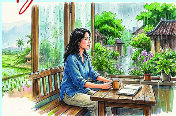
Minh họa: XUÂN ĐỨC