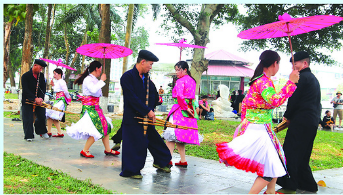
Nghệ thuật khèn - Di sản văn hóa phi vật thể quốc gia, kết tinh bản sắc văn hóa của đồng bào Mông.