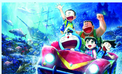
Cuộc phiêu lưu của Nobita đáy biển.