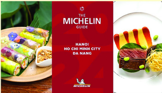
Là biểu tượng của đỉnh cao nghệ thuật ẩm thực, sao Michelin là niềm mơ ước của mỗi nhà hàng.

Điều đáng chú ý là sao Michelin không đánh giá sự xa hoa hay mức độ sang trọng của nhà hàng. Một quán ăn nhỏ, thậm chí quán ăn đường phố, vẫn có thể được trao sao nếu chất lượng món ăn đạt đến trình độ xuất sắc.