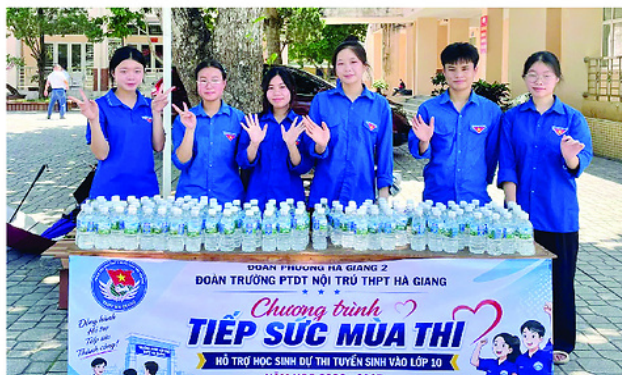
Tiếp sức mùa thi tại Trường PTDT Nội trú THPT Hà Giang.