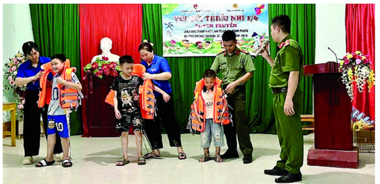
Đoàn Thanh niên xã Tân Long phối hợp cùng Công an xã tuyên truyền chống đuối nước cho trẻ em.