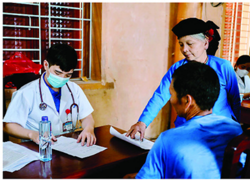
Thầy thuốc trẻ Bệnh viện Phổi Trung ương phối hợp cùng Đoàn Thanh niên xã Bản Máy khám bệnh cho Nhân dân (ảnh trái). Đoàn viên, thanh niên xã Sơn Vi tham gia làm đường bê tông tuyến từ thôn Khai Hoàng 3 đi Tia Kính (ảnh phải).