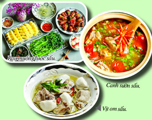
Rau muống luộc sấu.