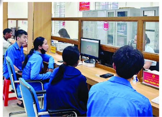
Đoàn Thanh niên xã Vị Xuyên giúp Nhân dân tiếp cận số hóa.

Thước đo tối cao của một chiến dịch tình nguyện thực chất không nằm ở số lượng đại biểu dự lễ phát động, mà phải được đo bằng “sức sống” của các công trình, phần việc sau khi chiến dịch kết thúc. Tình nguyện thực chất là khi người trẻ không làm thay, làm hộ, mà đóng vai trò “mồi lửa” kích hoạt nội lực, khơi dậy ý chí tự lực của cộng đồng bản địa... Mùa hè xanh chỉ thực sự xanh khi gieo được những hạt mầm phát triển lâu dài.