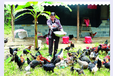
Chăn nuôi gà hàng hóa góp phần tạo việc làm, nâng cao thu nhập cho người dân xã Minh Tân.

TRƯỚC tỷ lệ hộ nghèo, cận nghèo còn ở mức cao, chiếm 55,15% tổng số hộ dân, Đảng ủy xã Minh Tân đã tập trung lãnh đạo triển khai các chương trình hỗ trợ sản xuất, tạo sinh kế và nâng cao thu nhập cho người dân vùng biên.