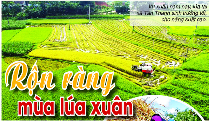
Vụ xuân năm nay, lúa tại xã Tân Thanh sinh trưởng tốt, cho năng suất cao.