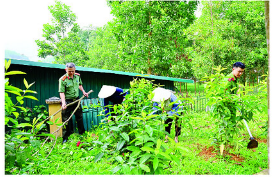
Lực lượng Công an xã hỗ trợ người dân xử lý vườn tạp, dọn dẹp vệ sinh môi trường.

MỞI đây, UBND xã Tân Long phát động phong trào “Toàn dân chung tay bảo vệ môi trường, vì một Việt Nam xanh - sạch - đẹp”.