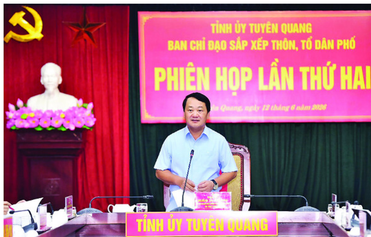
Đồng chí Bí thư Tỉnh ủy Hầu A Lệnh phát biểu tại phiên họp.

SÁNG 12-6, Ban Chỉ đạo sắp xếp thôn, tổ dân phố tổ chức phiên họp lần thứ 2. Đồng chí Hầu A Lệnh, Ủy viên BCH Trung ương Đảng, Bí thư Tỉnh ủy, Trưởng Ban Chỉ đạo chủ trì phiên họp.