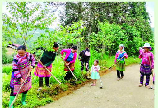
Các hội viên trong thôn Hậu Cấu 1 tham gia vệ sinh các tuyến đường liên thôn.

HƯỜNG ứng phong trào thi đua “Toàn dân chung tay bảo vệ môi trường, vì một Việt Nam xanh - sạch - đẹp”, vừa qua Hội Liên hiệp Phụ nữ xã Xín Mần tổ chức ra quân vệ sinh môi trường tại Chi hội Phụ nữ thôn Hậu Cấu 1 với sự tham gia của đông đảo cán bộ, hội viên phụ nữ trên địa bàn.