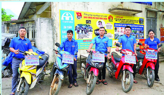
Đội xe tình nguyện tiếp sức mùa thi tại Trường THCS và THPT Linh Hồ, xã Linh Hồ (ảnh trên).