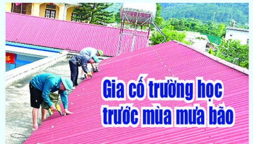
Gia có trường học trước mùa mưa bão

Mái trường học được gia cố, phòng, chống giông lốc.