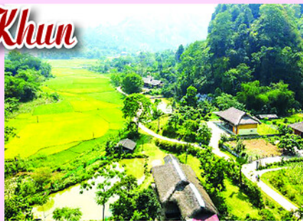
Một góc thôn Khun với những nếp nhà sàn truyền thống.

Phát huy lợi thế về cảnh quan thiên nhiên và bản sắc văn hóa, thôn Khun đã xây dựng Làng Văn hóa du lịch cộng đồng gắn với bảo