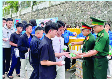
Lực lượng vũ trang hỗ trợ thí sinh tại điểm thi Trường Trung học phổ thông Đồng Văn.