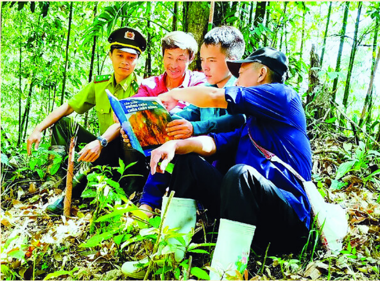
Cán bộ Kiểm lâm cùng Nhân dân tuần rừng ở rừng Nậm Biên, xã Nậm Dịch.