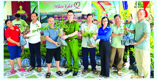
Đoàn Thanh niên xã Thanh Thủy và các đơn vị, nhà hảo tâm trao cây giống giúp người dân phát triển sinh kế.

ĐOÀN Thanh niên xã Thanh Thủy phối hợp với các đơn vị, nhà hảo tâm tổ chức chương trình an sinh xã hội "Màu xanh biên giới".