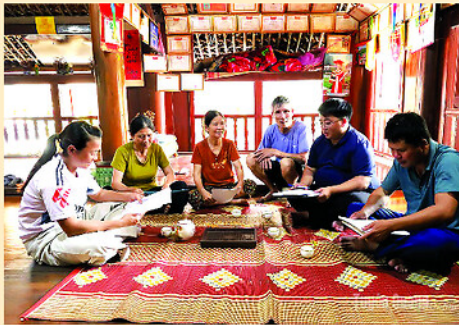
Cán bộ xã Bình An tuyên truyền, lấy ý kiến Nhân dân về phương án sắp xếp thôn.

ĐẾN nay, địa phương đã hoàn thiện phương án sắp xếp thôn, bản. Theo đó, có 2 trong tổng số 17 thôn không thực hiện sáp nhập; sau sắp xếp, toàn xã giảm từ 17 xuống còn 13 thôn. Quá trình triển khai được thực hiện thận trọng, bảo đảm phù hợp với điều kiện thực tế và nguyện vọng của người dân. Cùng với việc rà soát, xây dựng phương án, xã đẩy mạnh tuyên truyền, phổ biến chủ trương, mục đích, ý nghĩa của việc sắp xếp; đồng thời tăng cường đối thoại, lắng nghe tâm tư, nguyện vọng của Nhân dân.