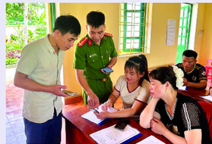
Các thành viên Tổ công nghệ cộng đồng xã Yên Lập hướng dẫn người dân kỹ năng số.

TỪ ngày 2 đến 10-6-2026, UBND xã Yên Lập tổ chức các lớp tập huấn kỹ năng số và phong trào "Bình dân học vụ số" trực tiếp tại 12 nhà văn hóa thôn trên địa bàn.