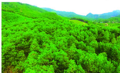
Mức phạt lên đến 80.000.000 đồng đối với các hành vi lấn, chiếm rừng.

CHÍNH phủ ban hành Nghị định số 146/2026/NĐ-CP ngày 06/5/2026 quy định xử phạt vi phạm hành chính trong lĩnh vực lâm nghiệp. Trong đó, đáng chú ý là các quy định xử phạt liên quan đến việc lấn, chiếm và sử dụng môi trường rừng trái quy định.