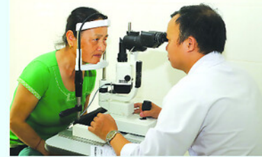
Người dân xã Liên Hiệp được khám sàng lọc các bệnh về mắt.

UBND xã Liên Hiệp vừa phối hợp với Bệnh viện Mắt Trường Phúc (Phủ Thọ) tổ chức khám sức khỏe và lập hồ sơ sức khỏe điện tử cho người dân trên địa bàn.