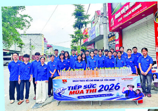
Đoàn Thanh niên xã Yên Minh ra quân tiếp sức mùa thi năm 2026, hỗ trợ nước uống cho thí sinh.