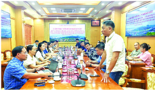
Toàn cảnh buổi làm việc.

đánh giá tài nguyên và khảo sát khả năng kết nối các tour, tuyến du lịch. Xã Nà Hang sở hữu nhiều điều kiện thuận lợi để phát triển các loại hình du lịch sinh thái, du lịch cộng đồng, du lịch trải nghiệm... Các thành viên trong đoàn khảo sát đã trao đổi, đánh giá thực trạng tài nguyên, cơ sở vật chất, các sản phẩm du lịch hiện có cũng như khả năng liên kết, kết nối với các điểm du lịch trong và ngoài tỉnh.