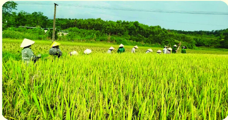
Thu hoạch lúa xuân trên cánh đồng thôn Khun, xã Bằng Lang.

Người dân xã Nhữ Khê sử dụng máy gặt đập liên hợp, đẩy nhanh tiến độ thu hoạch lúa.