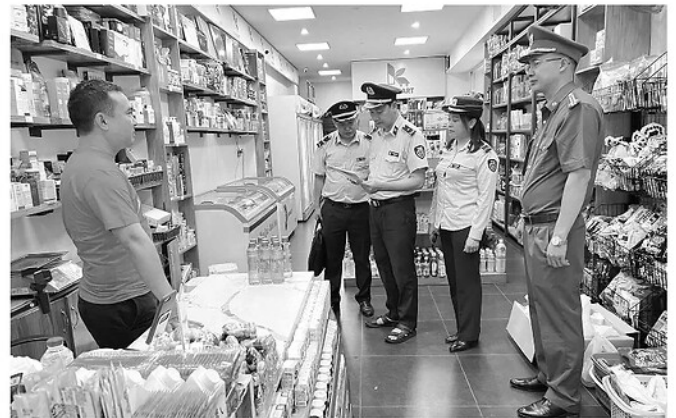
Lực lượng chức năng tiến hành kiểm tra các cơ sở kinh doanh trên địa bàn tỉnh.

Một trong những vụ việc điển hình được phát hiện trong đợt cao điểm trên địa bàn tỉnh Tuyên Quang là vụ án "Buôn bán hàng giả" do Cơ quan Cảnh sát điều tra Công an tỉnh khởi tố. Kết quả điều tra bước