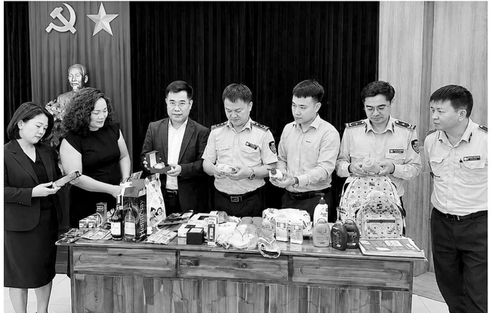
Cán bộ Quản lý thị trường được tập huấn kỹ năng nhận diện hàng thật, hàng giả nhằm nâng cao hiệu quả đấu tranh chống hàng giả, hàng xâm phạm quyền sở hữu trí tuệ.

Thực hiện Công điện số 38/CD-TTg của Thủ tướng Chính phủ về tập trung chỉ đạo thực hiện quyết liệt các giải pháp đấu tranh, ngăn chặn, xử lý hành vi xâm phạm quyền sở hữu trí tuệ, tỉnh Tuyên Quang đã triển khai đồng bộ nhiều giải pháp kiểm tra, kiểm soát thị trường. Sự vào cuộc quyết liệt của các cấp, các ngành góp phần nâng cao hiệu quả bảo vệ quyền sở hữu trí tuệ, tạo môi trường cạnh tranh lành mạnh và thúc đẩy phát triển sản xuất, kinh doanh.