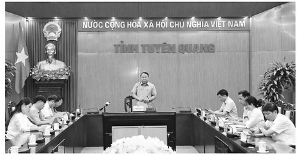
Đồng chí Phan Huy Ngọc, Phó Bí thư Tỉnh ủy, Chủ tịch UBND tỉnh phát biểu tại hội nghị.

SÁNG 16-6, UBND tỉnh tổ chức họp nghe báo cáo tiến độ thực hiện nhiệm vụ sắp xếp thôn, tổ dân phố trên địa bàn tỉnh. Hội nghị được tổ chức bằng hình thức trực tiếp kết hợp trực tuyến từ điểm cầu UBND tỉnh đến điểm cầu UBND các xã, phường.