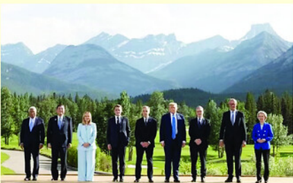
Đại diện các thành viên G7 tại Hội nghị.

Diễn ra từ ngày 15 đến 17-6, hội nghị sẽ thảo luận các biện pháp ứng phó với điều được nước chủ nhà mô tả là môi trường quốc tế ngày càng bất ổn khi xung đột và tình trạng mất cân đối kinh tế gia tăng trong lúc hệ thống quản trị toàn cầu suy yếu. Theo Tân Hoa Xã, Bộ Ngoại giao Pháp cho biết các nội dung ưu tiên của hội nghị là thúc đẩy tăng trưởng kinh tế cân bằng và bền vững, tăng cường hợp tác quốc tế, củng cố chuỗi cung ứng khoáng sản thiết yếu.