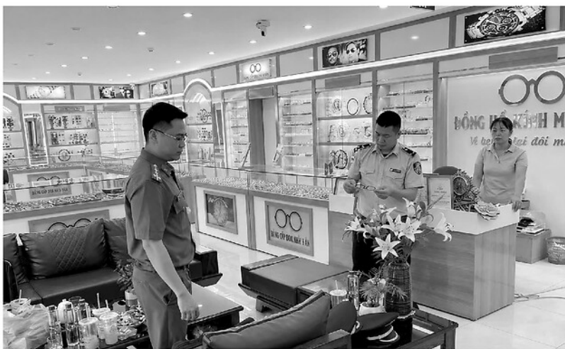
Lực lượng chức năng kiểm tra tại cửa hàng kinh doanh kính mắt trên địa bàn phường Hà Giang 2.

LÀ người tiêu dùng, tôi cho rằng việc minh bạch nguồn gốc hàng hóa là yếu tố vô cùng quan trọng. Khi mua một sản phẩm, chúng tôi không chỉ quan tâm đến giá cả mà còn muốn biết rõ sản phẩm được sản xuất ở đâu, quy trình sản xuất như thế nào và có đảm bảo chất lượng hay không. Sự minh bạch giúp người tiêu dùng yên tâm lựa chọn, tránh mua phải hàng giả, hàng kém chất lượng, ảnh hưởng đến sức khỏe và quyền lợi của mình. Đồng thời, đây cũng là cách để các doanh nghiệp xây dựng uy tín, tạo niềm tin với khách hàng và nâng cao khả năng cạnh tranh trên thị trường. Tôi mong rằng các cơ quan chức năng sẽ tăng cường kiểm tra, giám sát để mọi hàng hóa lưu thông đều có nguồn gốc rõ ràng, minh bạch.