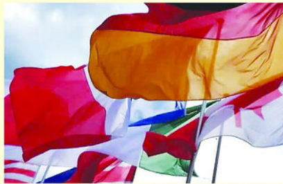
G7 nhóm họp nhằm tìm giải pháp cho các cuộc khủng hoảng địa chính trị và bất ổn kinh tế toàn cầu.

Giới phân tích nhận định Hội nghị Thượng đỉnh G7 là phép thử quan trọng đối với khả năng duy trì sự đoàn kết của nhóm giữa lúc nội bộ đang rạn nứt.