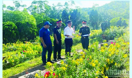
Quá trình thực hiện được triển khai theo quy trình kỹ thuật chặt chẽ.

Tại nghĩa trang liệt sĩ thành phố Huế, lực lượng chuyên môn tiến hành lấy mẫu sinh phẩm từ các mộ liệt sĩ chưa biết tên để phục vụ giám định ADN, hướng tới xây dựng cơ sở dữ liệu xác định danh tính liệt sĩ.