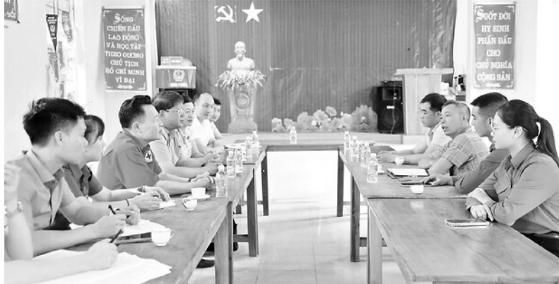
Đoàn công tác của Ủy ban MTTQ tỉnh kiểm tra tình hình thực hiện sắp nhập thôn tại xã Kiên Đài.

Trong quá trình triển khai chủ trương sắp xếp thôn, tổ dân phố cũng như các nhiệm vụ phát triển kinh tế - xã hội ở địa phương, Mặt trận Tổ quốc các cấp trong tỉnh đã phát huy vai trò tập hợp, vận động Nhân dân, tạo sự đồng thuận xã hội. Qua đó, góp phần củng cố khối đại đoàn kết toàn dân tộc và đưa các chủ trương của Đảng, chính sách của Nhà nước vào cuộc sống.