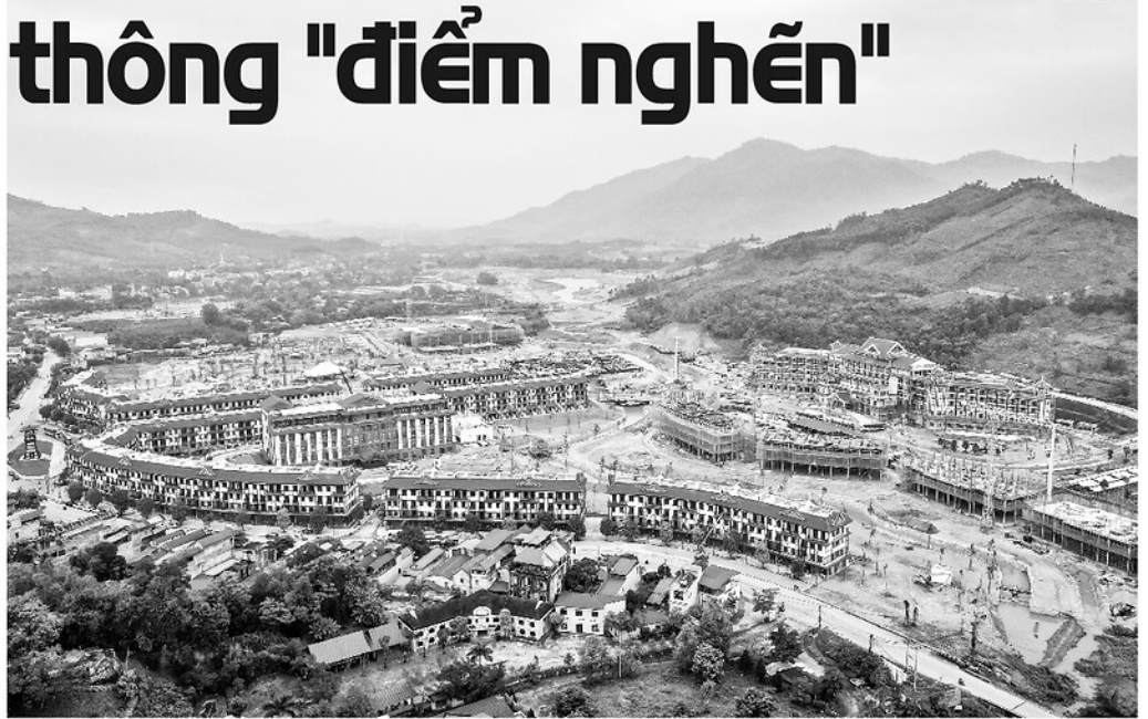
Dự án Khu đô thị nghỉ dưỡng Mỹ Lâm - Tuyên Quang và Dự án Tổ hợp Khu thể dục thể thao & sân golf Mỹ Lâm - Tuyên Quang của Tập đoàn VinGroup đang được triển khai nhanh chóng.

Vì sao một địa phương "nhiều tiềm năng" phát triển du lịch như vậy lại chưa bút phá mạnh mẽ? Câu trả lời nằm ở những "nút thắt cổ chai" cố hữu về hạ tầng, lưu trú và sản phẩm dịch vụ. Nhìn thẳng vào những hạn chế này, Tuyên Quang đang chủ động dùng tư duy đột phá và cơ chế chính sách thông thoáng để khởi thông dòng chảy, sẵn sàng mời gọi các nhà đầu tư hợp tác cùng phát triển.