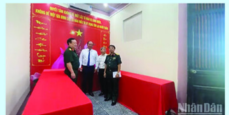
Huế lập cả phòng bảo quản mẫu trước khi chuyển cho đơn vị xác định.

Cùng thời điểm, các lực lượng chức năng tổ chức rà soát một số khu vực nghi có mộ tập thể trên địa bàn, trong đó có khu vực Cửa Chánh Tây (phường Phú Xuân).