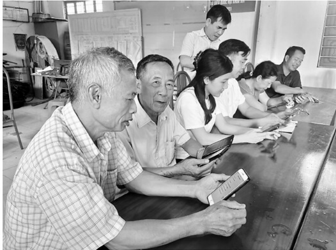
Cán bộ Ban xây dựng Đảng xã Nhữ Khê hướng dẫn đảng viên Chi bộ Liên Bình tra cứu thông tin trên phần mềm Sổ tay đảng viên điện tử.

Trong dòng chảy mạnh mẽ của công cuộc chuyển đổi số, nhiều tổ chức cơ sở đảng trên địa bàn tỉnh Tuyên Quang đang từng bước đổi mới phương thức hoạt động, đưa công nghệ số vào công tác lãnh đạo, điều hành và sinh hoạt chi bộ. Những thay đổi về sử dụng tài liệu điện tử, nhóm trao đổi trực tuyến hay phần mềm quản lý đảng viên đã góp phần nâng cao chất lượng sinh hoạt chi bộ, tạo chuyển biến tích cực trong công tác xây dựng Đảng ở cơ sở.