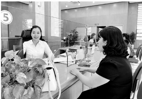
Giao dịch viên Agribank Chi nhánh Tuyên Quang tận tình tư vấn, hỗ trợ khách hàng trong quá trình giao dịch, góp phần đảm bảo an toàn tài sản và phòng ngừa rủi ro.

Trong xu thế chuyển đổi số diễn ra mạnh mẽ trên mọi lĩnh vực, ngành Ngân hàng đang đứng trước nhiều cơ hội phát triển nhưng cũng phải đối mặt với không ít thách thức từ các loại tội phạm công nghệ cao. Bên cạnh việc không ngừng nâng cao chất lượng dịch vụ, hiện đại hóa hoạt động ngân hàng, Agribank Tuyên Quang đang triển khai nhiều giải pháp nhằm bảo vệ quyền lợi khách hàng, góp phần xây dựng môi trường giao dịch tài chính an toàn, tin cậy.