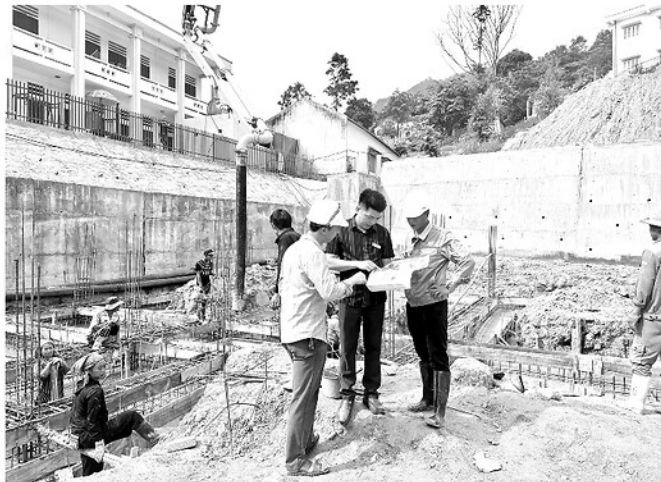
Dự án Nhà lưu trú học sinh của Trường THCS Năm Dấn, xã Năm Dấn đang được đẩy nhanh tiến độ thi công.

chúng, dẫn đến không có khối lượng thanh toán.