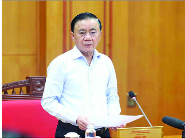
Thường trực Ban Bí thư Trần Cẩm Tú phát biểu chỉ đạo cuộc họp về tình hình triển khai một số dự án, công trình trọng điểm hưởng tới Kỷ niệm 100 năm thành lập Đảng.

Thường trực Tỉnh ủy gặp mặt Đoàn đại biểu dự Đại hội đại biểu toàn quốc Đoàn TNCS Hồ Chí Minh lần thứ XIII