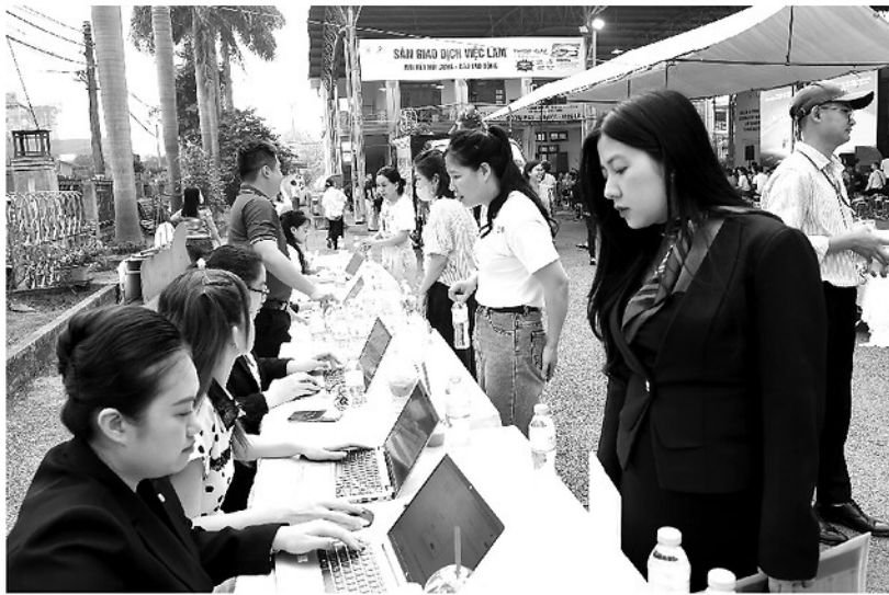
Người lao động tham gia Ngày hội việc làm do Trung tâm Dịch vụ việc làm và Lưu trữ lịch sử tỉnh phối hợp với các đơn vị tổ chức.

Tỉnh Tuyên Quang luôn quan tâm, xác định giải quyết việc làm và nâng cao thu nhập cho người dân là một trong những giải pháp quan trọng để giảm nghèo nhanh và bền vững. Thông qua những chính sách chủ động, linh hoạt và sự vào cuộc quyết liệt của các cấp, các ngành, công tác kết nối cung - cầu lao động trên địa bàn tỉnh đã đạt được những kết quả quan trọng.