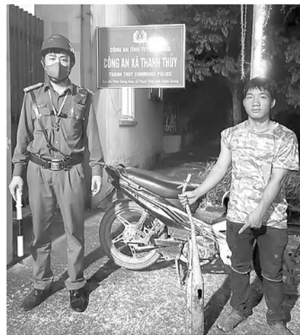
Công an xã Thanh Thủy xử lý thiếu niên tự ý độ chế pô xe máy.