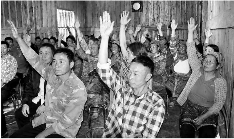
Người dân thôn Chúng Phùng, xã Tân Tiến biểu quyết đồng thuận với chủ trương sáp nhập thôn, tổ dân phố.

Việc sáp nhập thôn không đồng nghĩa với xóa bỏ những không gian văn hóa vốn đã ăn sâu vào đời sống người dân. Ngược lại, đây là cơ hội để tổ chức lại các hoạt động văn hóa theo hướng phong phú