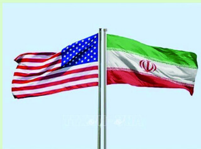
Quốc kỳ Mỹ và Iran.

N GÀY 21/6, ngoại trưởng các nước Ai Cập, Saudi Arabia, Thổ Nhĩ Kỳ và Pakistan đã nhóm họp tại Cairo nhằm trao đổi về các diễn biến mới tại Trung Đông, đặc biệt là tiến trình triển khai Bản ghi nhớ (MoU) giữa Mỹ và Iran cũng như các biện pháp tăng cường phối hợp khu vực trước những thách thức an ninh ngày càng phức tạp. Thông cáo chung sau cuộc họp lần thứ tư của cơ chế tham vấn gồm Ai Cập, Saudi Arabia, Pakistan và Thổ Nhĩ Kỳ cho biết các ngoại trưởng đã thảo luận những diễn biến mới nhất liên quan đến thỏa thuận Mỹ - Iran và các cuộc đàm phán đang diễn ra giữa hai bên tại Thụy Sĩ. Các bên bày tỏ ủng hộ mạnh mẽ đối với tiến trình đối thoại, mong muốn các cuộc thương lượng sớm đạt được kết quả "nhanh chóng và thành công", hướng tới một giải pháp lâu dài, có thể kiểm soát và được các bên chấp nhận.