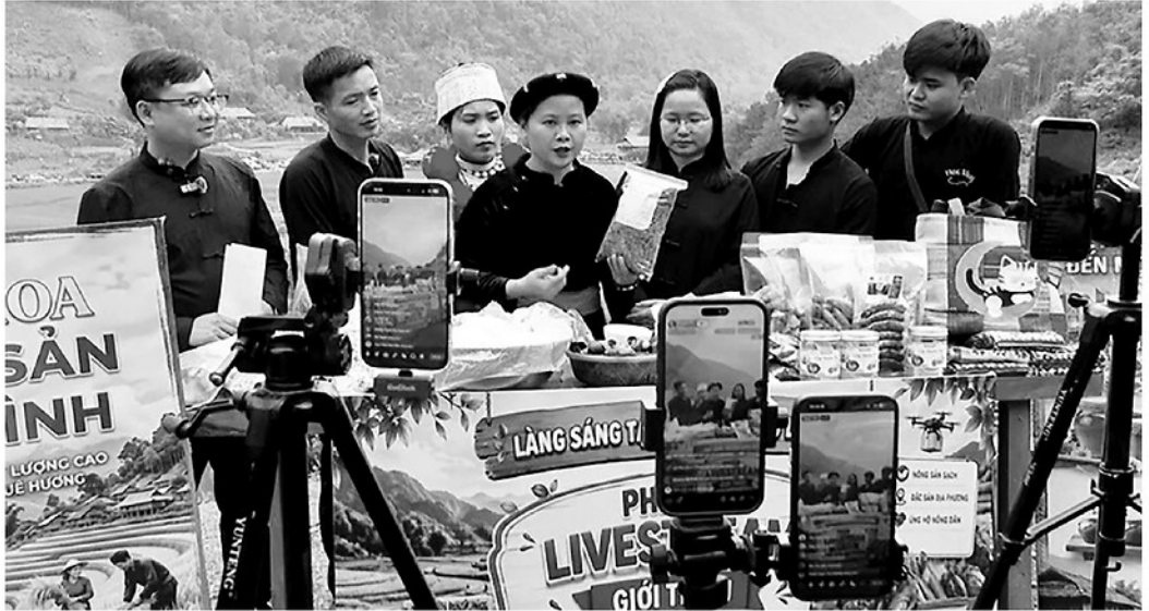
Chủ các kênh TikTok, YouTube thực hiện Phiên chợ số tại xã Lâm Bình bán sản phẩm địa phương.

Nghị quyết số 86/NQ-CP của Chính phủ về Chiến lược quốc gia về khởi nghiệp sáng tạo được xác định là một trong những động lực quan trọng thúc đẩy phát triển kinh tế trong giai đoạn mới. Tại Tuyên Quang, thay vì triển khai theo hướng phong trào, nhiều địa phương đang lựa chọn cách làm sát thực tiễn, tận dụng lợi thế sẵn có để hình thành các mô hình khởi nghiệp phù hợp.