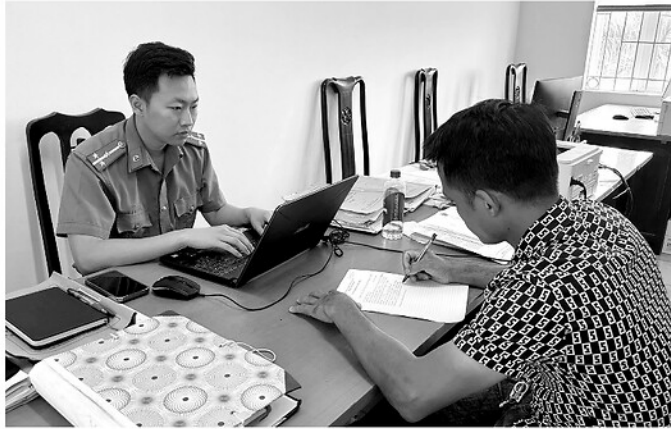
Lực lượng Công an đã kịp thời phát hiện, ngăn chặn trường hợp có ý định bán tài khoản ngân hàng trên mạng xã hội.

Mua bán, cho thuê tài khoản ngân hàng không chỉ tiềm ẩn nguy cơ tiếp tay cho các hoạt động lừa đảo, rửa tiền và tội phạm công nghệ cao mà còn khiến người vi phạm phải đối mặt với những chế tài xử lý nghiêm khắc của pháp luật.