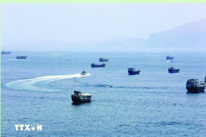
EO BIỂN HORMUZ.

Tuyên bố chung nhấn mạnh bất kỳ thỏa thuận cuối cùng nào giữa Mỹ và Iran đều cần tính đến những quan ngại về an ninh và ổn định của các quốc gia vùng Vịnh, tôn trọng chủ quyền, toàn vẹn lãnh thổ của các nước trong khu vực, bảo đảm tự do hàng hải và giải quyết tranh chấp bằng biện pháp hòa bình.