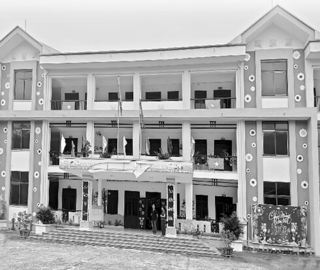
Trường Mầm non xã Tân Long được xây dựng từ nguồn vốn Chương trình QG xây dựng nông thôn mới.