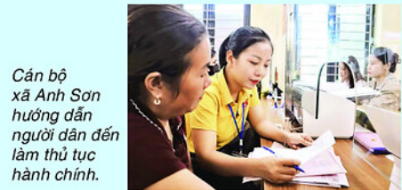
Cán bộ xã Anh Sơn hướng dẫn người dân đến làm thủ tục hành chính.

Từ ngày 1/7/2025, Ủy ban nhân dân tỉnh Nghệ An cho chủ trương thực hiện nhận, điều động, biệt phái 109 trường hợp về khối chính quyền cấp xã; trong đó điều động, biệt phái 64 lượt cán bộ, công chức từ cấp tỉnh (9 trường hợp) và từ các xã đang thừa công chức (55 trường hợp) đến công tác tại các xã còn thiếu cán bộ, công chức; tiếp nhận 45 viên chức đơn vị sự nghiệp công lập có đủ tiêu chuẩn, điều kiện theo quy định để bổ sung cho các xã còn thiếu.