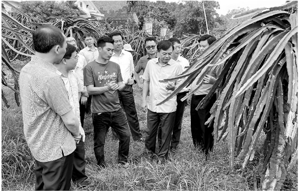
Đoàn công tác của Ban Chỉ đạo Chương trình MTQG kiểm tra tiến độ giải ngân tại Tuyên Quang.

Thực tế từ Năm Dấn hay Tân Long không phải là những câu chuyện cá biệt, trong giai đoạn sắp xếp đơn vị hành chính, vận hành mô hình chính quyền 2 cấp rất nhiều công trình chưa triển khai, hoặc đã triển khai thì phải điều chỉnh quy mô, điều chỉnh mô hình đầu tư khiến cho các địa phương không thể giải ngân nguồn vốn. Chưa kể nhiều công trình, các nhà thầu thi công cảm