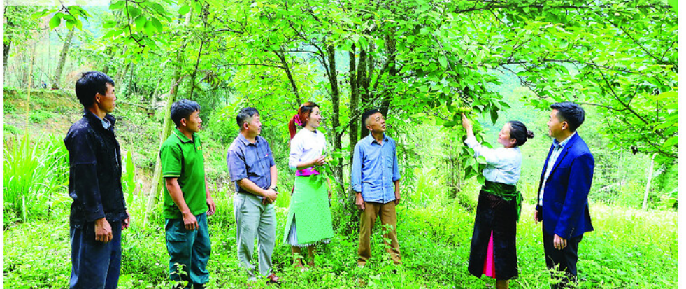
Từ nguồn vốn Chương trình MTQG, người dân xã Lũng Cú phát triển cây ăn quả cải thiện thu nhập.