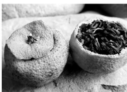
Sản phẩm Trà quýt cổ.

Những cây quýt này thường sinh trưởng tự nhiên trong các khu rừng núi ở độ cao khoảng trên 1.000 mét so với mực nước biển. Đây là môi trường có khí hậu mát, độ ẩm cao và đất rừng giàu dinh dưỡng, những yếu tố ảnh hưởng trực tiếp đến chất