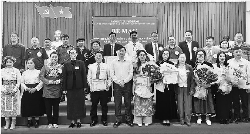
Đảng ủy xã Đồng Văn trao giải, biểu dương các báo cáo viên tham gia Hội thi báo cáo viên giỏi năm 2026.

Trong giai đoạn phát triển mới của đất nước, trước những nguồn thông tin đa chiều, yêu cầu công tác tư tưởng ngày càng cao, đội ngũ báo cáo viên, tuyên truyền viên tiếp tục là lực lượng nòng cốt đưa chủ trương, đường lối của Đảng đến với cán bộ, đảng viên và Nhân dân. Chất lượng đội ngũ báo cáo viên ngày càng được nâng lên, góp phần tạo sự thống nhất trong nhận thức và hành động, khẳng định vai trò, hiệu quả trong công tác tuyên truyền, vận động nhất là ở cơ sở.