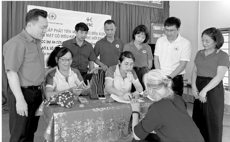
Người dân xã Linh Hồ được nhận tiền hỗ trợ từ Dự án do Hội Chữ thập đỏ và Trăng lưỡi liềm đỏ quốc tế viện trợ không hoàn lại.

Sau những đợt bão lũ liên tiếp trong năm 2025, nhiều hộ dân trên địa bàn tỉnh Tuyên Quang rơi vào hoàn cảnh khó khăn khi nhà cửa hư hỏng, sinh kế bị ảnh hưởng nghiêm trọng. Với tinh thần “Vì mọi người, ở mọi nơi”, Hội Chữ thập đỏ tỉnh đã trở thành cầu nối đưa nguồn viện trợ quốc tế đến đúng những người cần giúp đỡ nhất, giúp người dân không chỉ vượt qua khó khăn trước mắt mà còn có thêm động lực vươn lên ổn định cuộc sống lâu dài.