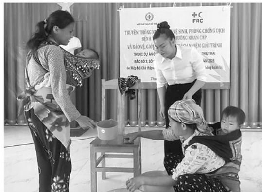
Người dân xã Thuận Hòa được thông tin về nước sạch, vệ sinh và phòng chống dịch bệnh.