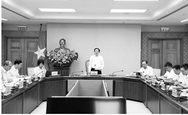
Phó Thủ tướng Hồ Quốc Dũng chủ trì cuộc họp.

SÁNG 23/6, tại Trụ sở Chính phủ, Phó Thủ tướng Hồ Quốc Dũng chủ trì cuộc họp về dự thảo Đề án Phát triển trung tâm nghiên cứu, thử nghiệm và phòng thí nghiệm trọng điểm phục vụ công nghệ chiến lược.