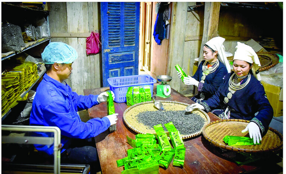
Từ liên kết sản xuất theo chuỗi giá trị, sản phẩm chè Shan tuyết của HTX Sơn Trà, xã Hồng Thái từng bước khẳng định vị thế trên thị trường.