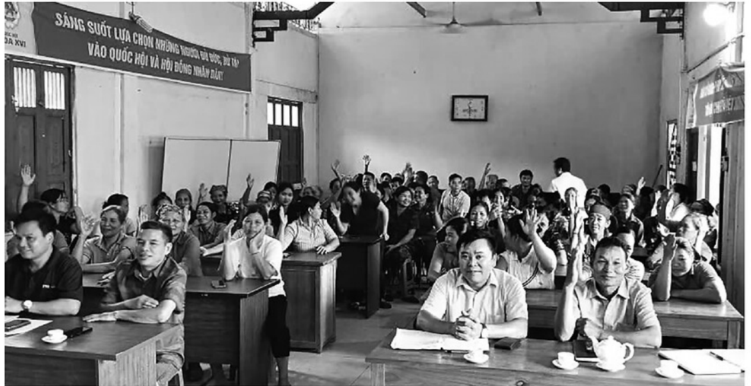
Xã Thượng Lâm tổ chức hội nghị lấy ý kiến của Nhân dân về sáp nhập thôn.

Để đảm bảo sự đồng thuận cao của Nhân dân trong việc sắp xếp, tổ chức lại các thôn, bản, tổ dân phố trên địa bàn tỉnh. Thời gian qua, bên cạnh sự nỗ lực của cả hệ thống chính trị cơ sở, vai trò của đội ngũ người có uy tín trong cộng đồng dân cư đã được phát huy mạnh mẽ lan tỏa chủ trương của Đảng và Nhà nước, là cầu nối giữa cấp ủy, chính quyền với người dân.