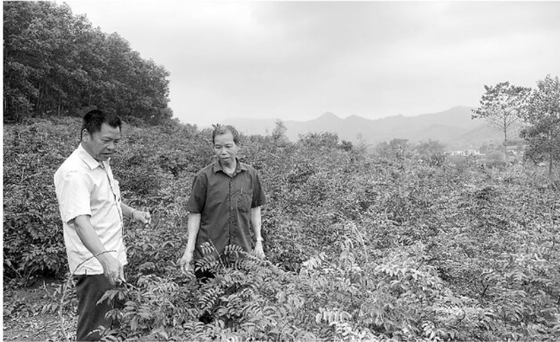
Hợp tác xã Dược liệu Thuận Hằng, xã Thái Sơn liên kết với Viện Y học bản địa Thái Nguyên và Công ty Dược phẩm Bình Minh trồng dược liệu phục vụ chế biến.

Chuyển đổi cơ cấu cây trồng, vật nuôi nhằm tối ưu hóa giá trị trên cùng một đơn vị diện tích đang là bước đi chiến lược của nhiều địa phương. Thực tế, không ít nơi đã tìm thấy “chìa khóa” tăng trưởng khi định hình được nhóm sản phẩm thế mạnh “3 cây, 3 con” để thay thế các mô hình kém hiệu quả. Tuy nhiên, để sự chuyển dịch này không rơi vào kịch bản “được mùa mất giá”, bài toán then chốt hiện nay là phải gắn chặt tư duy sản xuất với chuỗi liên kết giá trị, bảo đảm đầu ra bền vững cho nông sản.