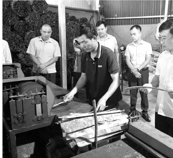
Đoàn công tác của Sở Nông nghiệp và Môi trường thăm mô hình sản xuất quê của HTX Sơn Trà.

Nỗ lực liên kết sản xuất đã mang lại kết quả rõ nét. Ngày 21-4-2026, sản phẩm chè Shan tuyết Hồng Thái (1 tốm, 1 lá) của HTX Sơn Trà chính thức được Bộ Nông nghiệp và Môi trường công nhận đạt OCOP quốc gia 5 sao. Đây là dấu mốc quan trọng, khẳng định chất lượng, thương hiệu và sức cạnh tranh của đặc sản vùng cao