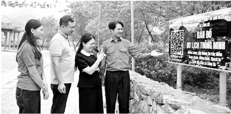
Đoàn thanh niên xã Lũng Cú hướng dẫn du khách quét mã QR để truy cập bản đồ du lịch thông minh.