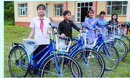
Trẻ em xã Mường Khương nhận xe đạp từ “Phiên chợ 0 đồng”.

Cũng tại Phiên chợ, Ban tổ chức trao hỗ trợ cho trẻ em có hoàn cảnh đặc biệt, khó khăn xã Mường Khương. Các khoản hỗ trợ gồm: 50 suất học bổng, mỗi suất trị giá 1 triệu đồng; trao 50 xe đạp, mỗi xe trị giá 1.750.000 đồng; hỗ trợ 1 điểm vui chơi trị giá 80 triệu đồng; hỗ trợ cài tạo thư viện và trang bị thêm giá sách, đầu sách cho 1 thư viện và 6 điểm trường; hỗ trợ xây dựng 4 công trình nước sạch (50 triệu đồng/công trình).