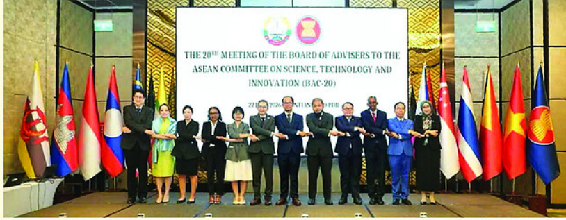
Các đại biểu ASEAN chụp ảnh chung tại Hội nghị BAC-20.