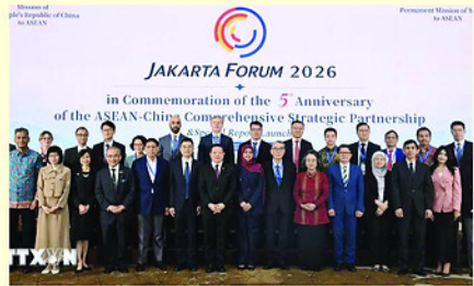
Các đại biểu tham dự Diễn đàn Jakarta 2026 kỷ niệm 5 năm Quan hệ Đối tác Chiến lược Toàn diện ASEAN - Trung Quốc.