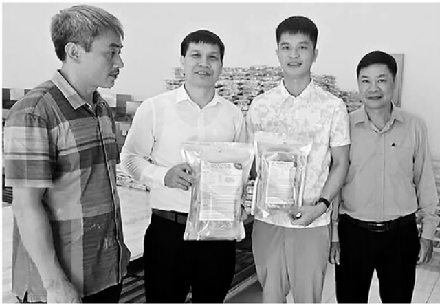
Lãnh đạo Liên minh HTX tỉnh thăm mô hình sản xuất của HTX Dược liệu nam được Mạc Minh, phường Hà Giang 1.

TỪ NÚI RỪNG TÂY CÔN LĨNH HAY NHỮNG BẢN LÀNG VÙNG CAO HỒNG THÁI, TIẾNG MÁY SẠO CHÈ ĐẶC SẢN VANG LÊN GIỮA ĐẠI NGÀN; NHỮNG ĐƠN HÀNG CAM, CHANH, CHÈ ĐƯỢC CHỐT QUA ĐIỆN THOẠI THÔNG MINH; SẢN PHẨM OCOP MANG MÃ QR THEO CHÂN KHÁCH HÀNG ĐẾN NHIỀU TỈNH, THẬM CHÍ VƯƠN RA THỊ TRƯỜNG QUỐC TẾ. NHỮNG HÌNH ẢNH ẤY CHO THẤY DIỆN MẠO MỚI CỦA NÔNG NGHIỆP TUYÊN QUANG. TỪ SẢN XUẤT NHỎ LẺ, MANH MÚN, NHIỀU NÔNG DÂN ĐÃ BƯỚC VÀO HÀNH TRÌNH LIÊN KẾT SẢN XUẤT, XÂY DỰNG THƯƠNG HIỆU VÀ PHÁT TRIỂN THEO CHUỖI GIÁ TRỊ. TRUNG TÂM CỦA SỰ CHUYỂN ĐỔI ẤY LÀ CÁC HỢP TÁC XÃ KIỂU MỚI - NHỮNG “BÀ ĐỒ” ĐANG GÓP PHẦN THAY ĐỔI TƯ DUY LÀM KINH TẾ Ở NÔNG THÔN.