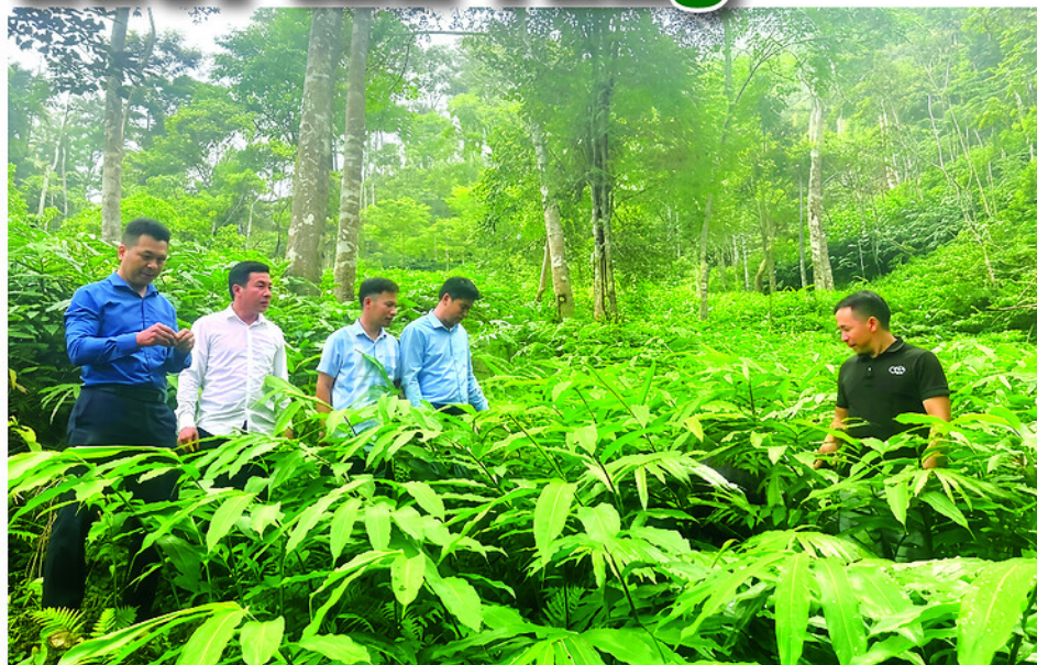
Lãnh đạo xã Côn Lôn thăm mô hình trồng sa nhân tím dưới tán rừng tại thôn Phiêng Ten.