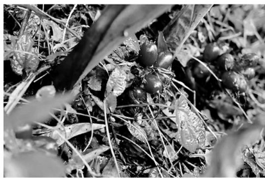
Thảo quả đang vào mùa thu hoạch, mang lại nguồn thu nhập cho người dân.