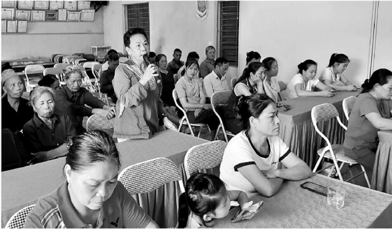
Thôn Bản Pài và thôn Noong Phường, xã Minh Quang tổ chức họp lấy kiến của người dân về việc sáp nhập thôn.