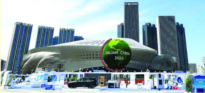
Thành phố Đại Liên - nơi diễn ra Diễn đàn Davos mùa Hè lần thứ 17.