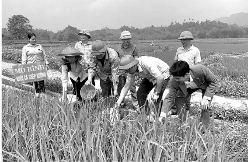
Mô hình gieo cấy lúa xen canh cá, ốc được xác định là chủ lực phát triển kinh tế nông nghiệp xã Bằng Lang.

Ngay từ khi thực hiện Nghị quyết số 25-NQ/ĐU, về việc chuyển đổi cây trồng, vật nuôi giá trị kinh tế cao giai đoạn 2026 - 2030, xã Bằng Lang đã quán triệt phương châm "5 rõ", rõ người, rõ việc, rõ trách nhiệm, rõ thời gian, rõ kết quả để nghị quyết đơm hoa kết trái, trở thành động lực phát triển kinh tế - xã hội ở địa phương.