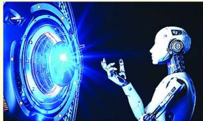
Làn sóng trí tuệ nhân tạo đang chuyển từ màn hình sang hệ thống vật lý hỗ trợ nền kinh tế hiện đại.

Trong số 10 công nghệ mới nổi này, 8 công nghệ có thể ảnh hưởng trực tiếp đến các hệ