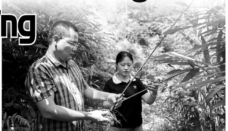
Cán bộ xã Hồ Thủy khảo sát, đánh giá hiệu quả mô hình trồng sa nhân tím dưới tán rừng.

Với hơn 852.789 ha rừng, tỷ lệ che phủ đạt trên 62%, Tuyên Quang có nhiều lợi thế để phát triển kinh tế lâm nghiệp. Những năm gần đây, bên cạnh công tác quản lý, bảo vệ rừng, nhiều địa phương đã khai thác hiệu quả tiềm năng kinh tế dưới tán rừng thông qua phát triển thảo quả, sa nhân tím và các loại cây dược liệu bản địa. Các mô hình này không chỉ mang lại nguồn thu ổn định cho người dân mà còn tạo động lực để người dân gắn bó, bảo vệ và phát triển rừng bền vững.