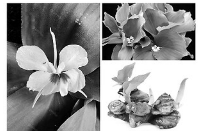
Cây địa liên.

+ Chữa đau nhức răng, tê phù, đau mũi gân cốt, đau lưng, trị tê thấp: Củ cây địa liên phơi khô, thái nhỏ và cho vào bình ngâm chung với rượu