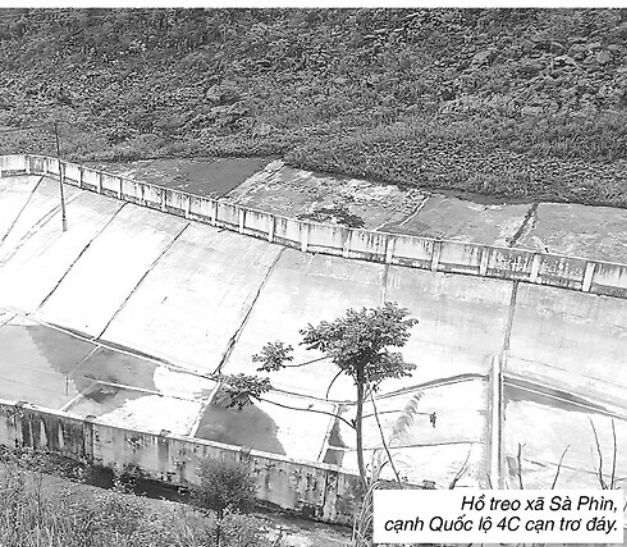
Hồ treo xã Sà Phìn, / cạnh Quốc lộ 4C cận trợ đây.