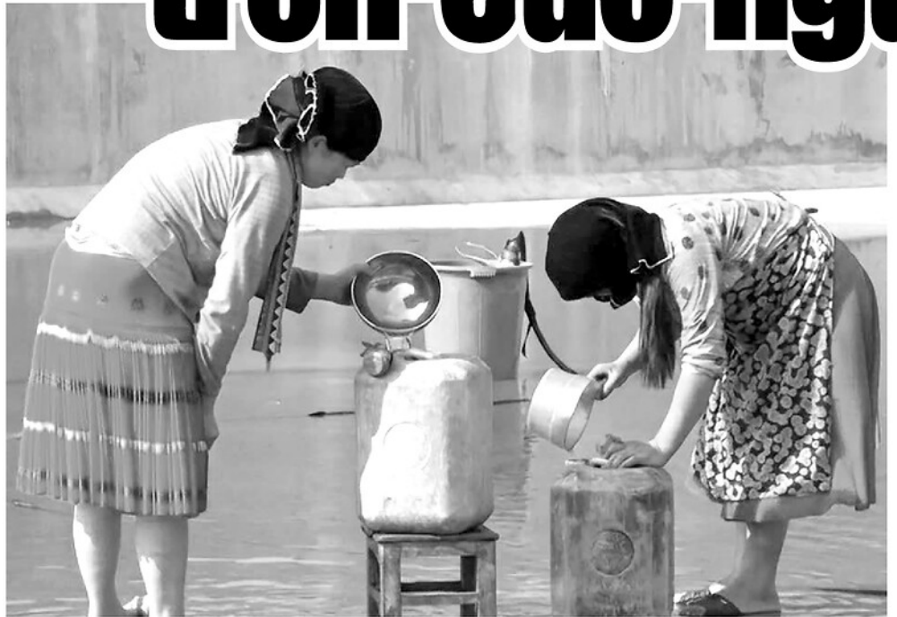
Người dân thôn Tả Phìn, xã Đồng Văn chờ chờ từng can nước khi hồ treo cạn đáy.