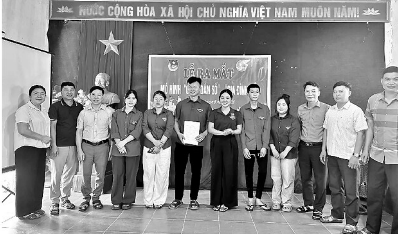
Đoàn Thanh niên xã Hùng An ra mắt mô hình công dân số, gia đình số.

Trong “Luật một tờ” này, mọi thông tin đều được sơ đồ hóa: Khái quát quyền lợi của công dân và thân nhân khi tham gia nghĩa vụ. Các mốc thời gian quan trọng trong quá trình tuyển quân. Tiêu chuẩn tham gia, các trường hợp được miễn hoặc tạm hoãn. Đặc biệt, nêu chi tiết các hành vi bị nghiêm cấm và chế tài xử lý vi phạm để