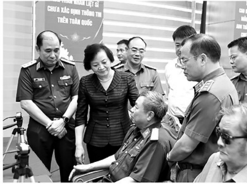
Phó Thủ tướng Phạm Thị Thanh Trà động viên, hỏi thăm thân nhân liệt sĩ.

Đây là một trong những hoạt động nằm trong khuôn khổ Chiến dịch "500 ngày đêm đầy mạnh thực hiện tìm kiếm, quy tập và xác định danh tính hài cốt liệt sĩ", hướng tới kỷ niệm 80 năm Ngày Thương binh - Liệt sĩ (27/7/1947 - 27/7/2027); đồng thời triển khai các kế hoạch của Đảng ủy Công an Trung ương và Bộ Công an.