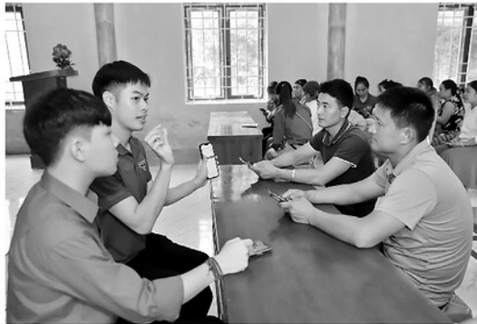
Đoàn Thanh niên xã Yên Minh hỗ trợ người dân kích hoạt tài khoản VNeID.

Về với xã vùng cao Yên Minh, hình ảnh những đoàn viên thanh niên trong sắc áo xanh tình nguyện, tay cầm điện thoại thông minh, máy tính bảng đã trở nên thân thuộc với đồng bào các dân tộc nơi đây. Không còn là những buổi họp hành khô khan, các bạn trẻ trực tiếp