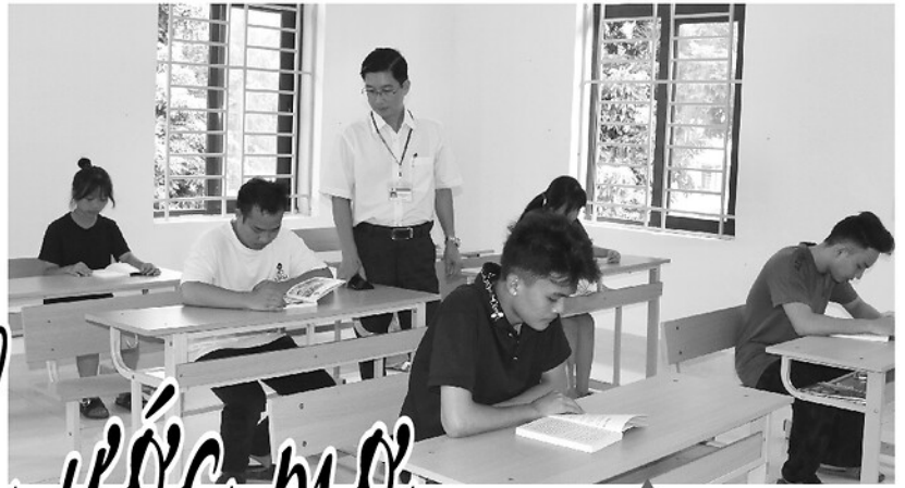
Cán bộ Trung tâm Công tác xã hội Hà Giang đồng hành, động viên các em trong giờ tự học.

Thiếu vắng vòng tay cha mẹ, nhiều trẻ em mồ côi ở vùng cao đã tìm thấy tình yêu thương và điểm tựa mới tại Trung tâm Công tác xã hội Hà Giang. Từ sự quan tâm của những người làm công tác xã hội và sự đồng hành của cộng đồng, những đứa trẻ từng chịu nhiều thiệt thòi đang từng ngày nuôi dưỡng ước mơ, vững tin viết tiếp tương lai của mình.