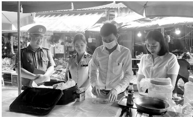
Đoàn kiểm tra liên ngành an toàn vệ sinh thực phẩm tỉnh test nhanh mẫu thực phẩm tại chợ Trung tâm phường Hà Giang 1.

Tại Bệnh viện Đa khoa tỉnh, các bác sĩ chẩn đoán bệnh nhân bị ngộ độc sâu ban miêu. Sau gần 2 ngày điều trị, bệnh nhân rời vào hôn mê và được chuyển tới Bệnh viện Bạch Mai. Tuy nhiên, dù tiếp tục được theo dõi và điều trị tích cực, bệnh nhân đã tử vong sau gần 4 giờ. Nguyên nhân