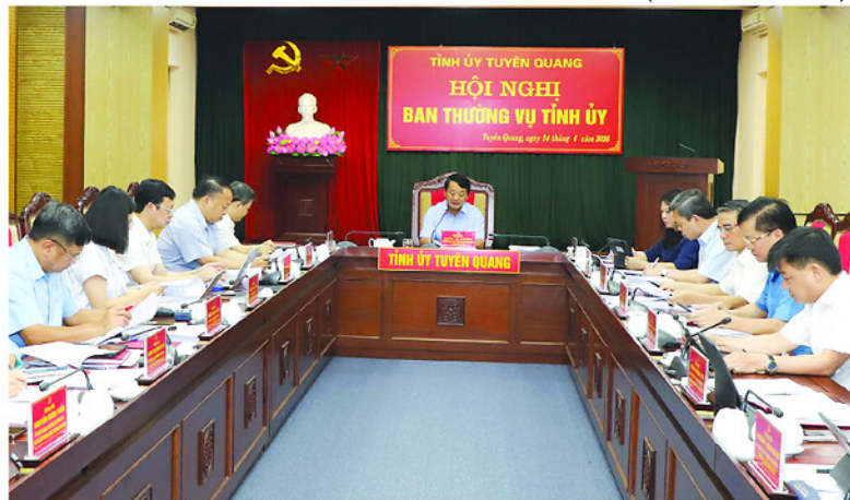
Toàn cảnh hội nghị.