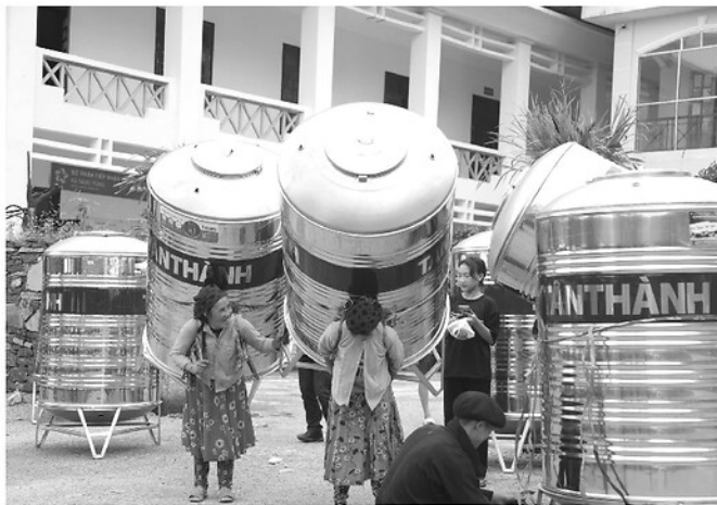
Người dân xã Phố Bàng nhận bốn chứa nước, chủ động tích trữ nước sinh hoạt trong mùa khô.

bảo đảm an ninh nguồn nước và an toàn đập, hồ chứa nước, trong đó xác định ưu tiên đầu tư hồ treo, mục tiêu là xây dựng gần 400 hồ sẽ cơ bản đáp ứng nhu cầu sử dụng nước của người dân. Đồng thời, phối hợp Viện Khoa học Thủy lợi khảo sát, đề xuất phương án xây dựng bể chứa công suất lớn, dung tích từ ba triệu mét khối trở lên.