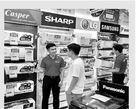
Thị trường điện lạnh năm nay khá đa dạng về mẫu mã với nhiều phân khúc giá khác nhau.

Để kích cầu tiêu dùng, các hệ thống siêu thị điện máy đồng loạt đưa ra nhiều chương trình ưu đãi hấp dẫn. Tại Điện máy Xanh, nhiều dòng điều hòa của các thương hiệu phổ biến được giảm giá mạnh, đi kèm chính sách bảo hành dài hạn, miễn phí lắp đặt và bảo dưỡng định kỳ. Tại MediaMart, bên cạnh điều hòa giảm giá mạnh, nhóm tủ lạnh và máy giặt cũng được áp dụng mức giá cạnh tranh, kèm nhiều ưu đãi nhằm gia tăng quyền lợi cho khách hàng. Nhiều sản phẩm được tặng quà trị giá lên đến 3