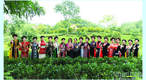
Đôi chè Vô Tranh rộn ràng trong Ngày hội Văn hóa.

Ngày 23/6, tại xã Vô Tranh (Thái Nguyên), khoảng 1.000 người dân và du khách đã cùng tham gia hoạt động tạo hình biểu tượng ẩm trà bằng nón lá giữa đồi chè xanh mướt, tạo điểm nhấn ấn tượng trong chương trình "Trải nghiệm Vô Tranh - Dấu ấn xứ trà, hành trình một năm kiến tạo vườn tằm và phát triển".