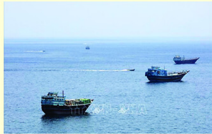
Eo biển Hormuz.

Philippines xác định hoàn tất COC trong năm 2026 là một trong những ưu tiên hàng đầu trong nhiệm kỳ Chủ tịch ASEAN.