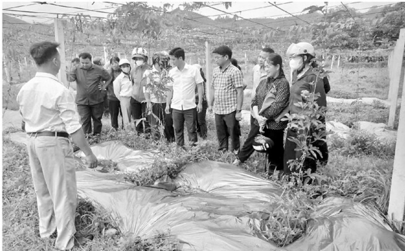
Cán bộ xã Trung Hà triển khai mô hình trồng gác đến người dân.

Tại phường Minh Xuân, cấp ủy, chính quyền địa phương lựa chọn cải cách hành chính, xây dựng đô thị văn minh và nâng cao chất lượng phục vụ Nhân dân là những nhiệm vụ trọng tâm để cụ thể hóa nghị quyết. Phường đẩy mạnh ứng dụng công nghệ thông tin trong giải quyết thủ tục hành chính; tăng cường minh bạch đô thị, giữ gìn vệ sinh môi trường, xây dựng các tuyến phố văn minh. Đồng thời, cán bộ, đảng viên được phân công phụ trách từng địa bàn dân cư nhằm kịp thời nắm bắt tâm tư, nguyện vọng của Nhân dân, giải quyết những vấn đề phát