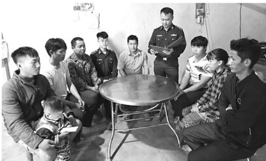
Cán bộ Đồn Biên phòng Mường Mươn, Bộ đội Biên phòng tỉnh Điện Biên tham gia sinh hoạt tại Chi bộ tổ dân cư trên địa bàn biên giới.

chi bộ khu vực biên giới. Đến nay đã có 82 lượt đảng viên tham gia sinh hoạt tại 82 chi bộ.