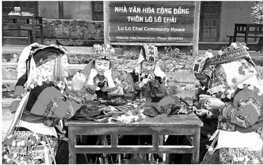
Người dân tộc Lô Lô ở xã Lũng Cú phát huy nghề thủ truyền thống, tạo sản phẩm lưu niệm đặc trưng phục vụ du khách.