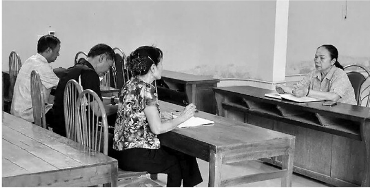
Chi ủy Chi bộ Tổ dân phố 16 Tân Hà, phường Minh Xuân họp bàn về phương pháp lãnh đạo vận động, tạo đồng thuận trong sắp xếp thôn, tổ dân phố.

Thực hiện chủ trương sắp xếp thôn, tổ dân phố theo Nghị định số 185/2026/NĐ-CP của Chính phủ là bước đi quan trọng nhằm tinh gọn bộ máy, nâng cao hiệu quả quản lý ở cơ sở. Trong quá trình sắp xếp đang được các địa phương triển khai với tinh thần thận trọng, dân chủ, tạo sự đồng thuận cao trong Nhân dân.