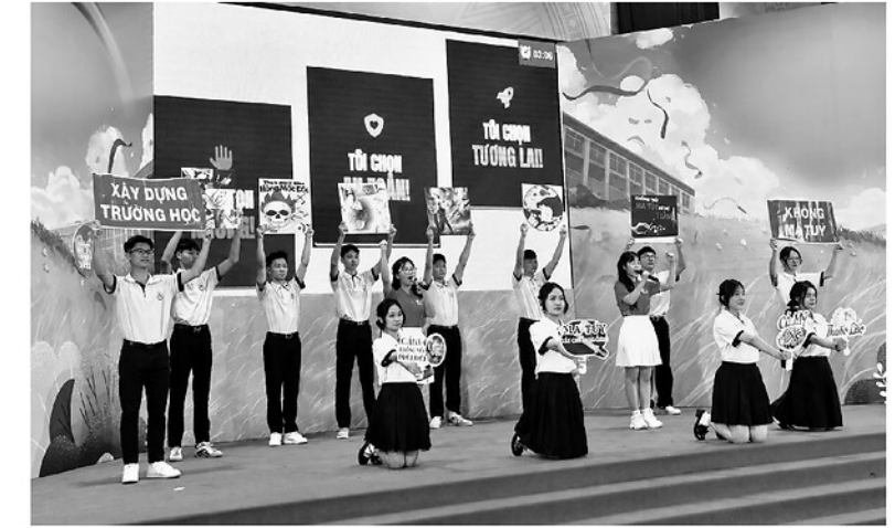
Các em học sinh hào hứng tham gia Cuộc thi “Trường học không ma túy” tổ chức tại Trường Phổ thông Dân tộc nội trú THPT tỉnh, giúp đẩy mạnh tuyên truyền, nâng cao ý thức phòng, chống ma túy trong cộng đồng.

Để tạo chuyển biến mạnh mẽ trong công tác phòng, chống ma túy, Ban Thường vụ Tỉnh ủy đã ban hành Nghị quyết số 62-NQ/TU ngày