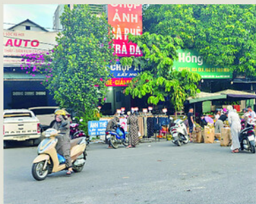
Chợ họp tụ phát trên đường, đoạn đầu cầu Chả, phường An Tường, gây mất mỹ quan đô thị, tiềm ẩn tai nạn giao thông (Ảnh chụp hồi 17h ngày 23-6 -2026).