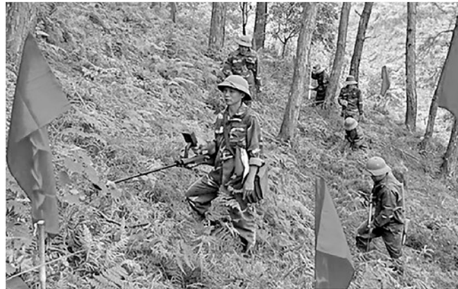
Cán bộ, chiến sĩ Đội rà phá bom mìn thuộc Tổng Công ty Thái Sơn thực hiện nhiệm vụ tại thôn Na Cạn, xã Cán Tỷ.

Đầu tháng Sáu, chúng tôi có mặt tại thôn Na Cạn, xã Cán Tỷ. Giữa các dãy núi đá với đỉnh đứng, tiếng máy dò kim loại đều đặn vang vọng. Trên sườn