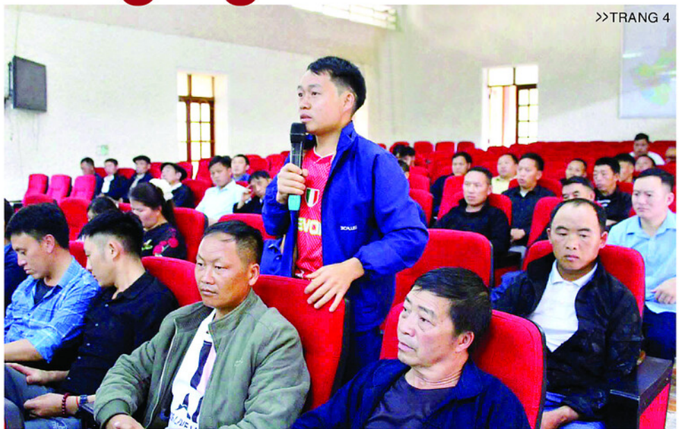
Người dân xã Đồng Văn nêu ý kiến tại cuộc họp về sáp nhập thôn (ngày 20/6/2026).