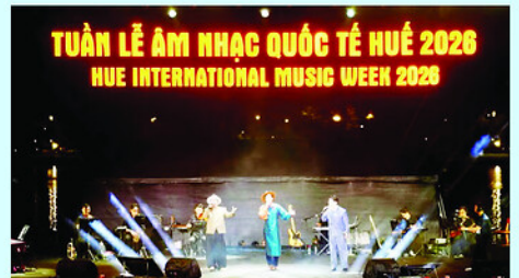
Chương trình Tuần lễ Âm nhạc Quốc tế Huế 2026 thu hút khá đông du khách trong và ngoài nước tham dự.

Bên cạnh dịch vụ, khu vực công nghiệp - xây dựng cũng ghi nhận nhiều tín hiệu khả quan. Chỉ số sản xuất công nghiệp tăng trên 10%; nhiều ngành chế biến, chế tạo giữ được tốc độ tăng trưởng cao. Các sản phẩm công nghiệp chủ lực như ô-tô, xi-măng, gang tay, đồ uống có cồn đều ghi nhận mức tăng trưởng ấn tượng.