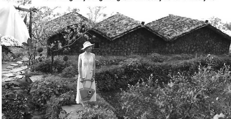
Du khách check-in Homestay Lê và Farm Lê.

Thế nhưng, chặng đường từ một ý tưởng lãng mạn đến