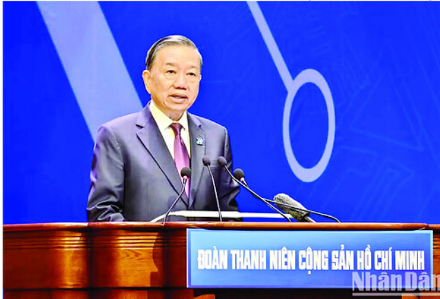
Tổng Bí thư, Chủ tịch nước Tô Lâm phát biểu tại Đại hội.