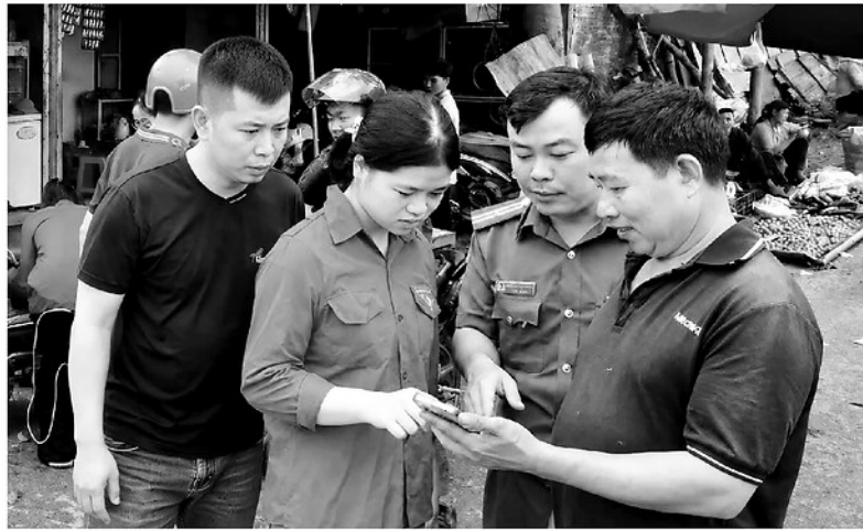
Tổ công nghệ số cộng đồng xã Tát Ngà hướng dẫn người dân đăng ký tài khoản dịch vụ công trực tuyến tại buổi họp chợ phiên Nậm Ban.

Chuyển đổi số được xác định là một trong những động lực quan trọng thúc đẩy phát triển kinh tế - xã hội. Tuy nhiên, để các nền tảng số thực sự đến được với người dân, đặc biệt ở vùng nông thôn, miền núi, vùng đồng bào dân tộc thiểu số cần có lực lượng trực tiếp hướng dẫn, hỗ trợ. Từ yêu cầu thực tiễn đó, các Tổ công nghệ số cộng đồng (CNSCĐ) đã được thành lập và từng bước phát huy vai trò là "Cánh tay nối dài" của chính quyền trong triển khai chuyển đổi số tại cơ sở.