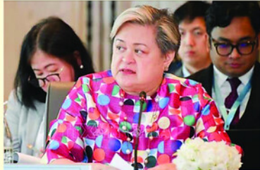
Ngoại trưởng Philippines Maria Theresa Lazaro.

ASEAN và Trung Quốc đã tiến hành đàm phán về COC trong hơn 2 thập niên qua. Văn kiện này được kỳ vọng sẽ thiết lập các quy tắc ứng xử nhằm quản lý bất đồng và giảm nguy cơ xảy ra va chạm trên Biển Đông.