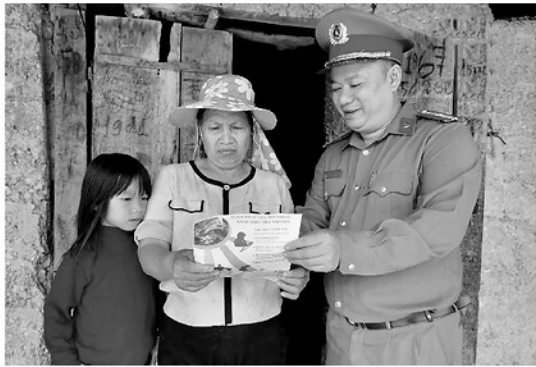
Công an xã Minh Tân tuyên truyền, nâng cao ý thức, trách nhiệm người dân trong công tác phòng, chống ma túy.

Hưởng ứng Tháng hành động phòng, chống ma túy năm 2026 với chủ đề “Chung một quyết tâm xây dựng xã, phường không ma túy”, tỉnh Tuyên Quang đang triển khai đồng bộ nhiều giải pháp nhằm kiểm soát, đẩy lùi tội phạm và tệ nạn ma túy. Với quyết tâm chính trị cao cùng sự vào cuộc của cả hệ thống chính trị và Nhân dân, tỉnh hướng tới mục tiêu xây dựng “Tỉnh không ma túy” vào năm 2030.