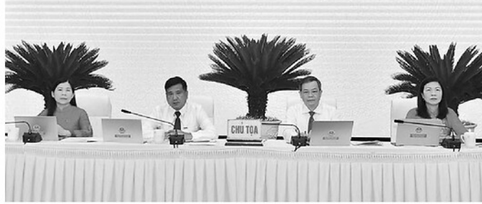
Các đồng chí Thường trực HĐND tỉnh chủ tọa kỳ họp.

SÁNG 25-6, tại Trung tâm Hội nghị tỉnh, HĐND tỉnh khóa XX, nhiệm kỳ 2026-2031 tổ chức khai mạc Kỳ họp thứ tư HĐND tỉnh.