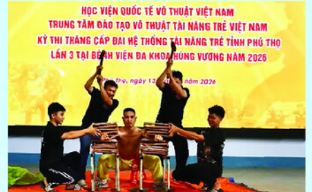
Bài biểu diễn nội công do các võ sư, huấn luyện viên Học viện Quốc tế võ thuật Việt Nam thực hiện.

Trong bối cảnh các cơ sở y tế ngày càng chú trọng hoạt động nâng cao sức khỏe, mô hình câu lạc bộ võ thuật tại Bệnh viện Đa khoa Hùng Vương, tỉnh Phú Thọ, mang đến một cách tiếp cận đáng chú ý trong chăm sóc sức khỏe cộng đồng.