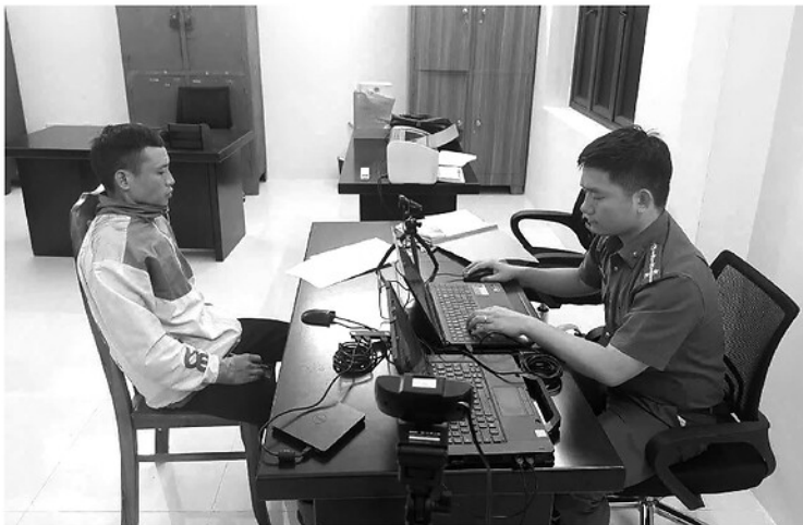
Một trong những đối tượng của đường dây lừa đảo vừa bị Công an tỉnh triệt phá.

Sự tinh vi trong kịch bản này trong phương thức đã biến người cao tuổi thành "mồi ngon" cho kẻ gian. Đây là lừa đảo tài chính quy mô lớn, bộ số tiền khổng lồ, công sức của người cao tuổi chất công, tích góp một đời lao động nhanh chóng sạch vào túi kẻ gian chỉ sau một chạm hoặc những lời đường