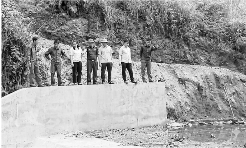
Các lực lượng tại chỗ của xã Minh Sơn chủ động bám năm địa bàn, sẵn sàng chủ động trước mọi tình huống.

Mỗi mùa mưa lũ, Tuyên Quang lại đối mặt với nhiều nguy cơ thiên tai như mưa lớn kéo dài, lũ quét, sạt lở đất. Tuy nhiên, những năm gần đây, thay vì bị động ứng phó, tỉnh đã chuyển mạnh sang tư duy "phòng ngừa là chính". Từ nghị quyết của cấp ủy đến hành động cụ thể của người dân, một "lá chắn" phòng, chống thiên tai đang được xây dựng từ sớm, từ xa.