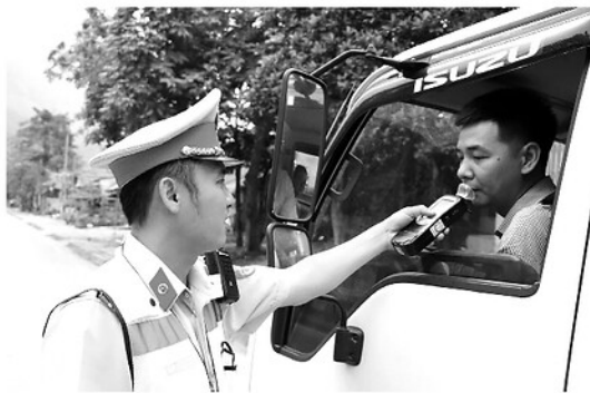
Lực lượng Cảnh sát Giao thông Công an tỉnh kiểm tra nồng độ cồn đối với người tham gia giao thông trên địa bàn.

giấy phép lái xe 222 trường hợp; tạm giữ 6.834 phương tiện; trừ điểm giấy phép lái xe đối với 7.154 trường hợp. Đường thủy đã phát hiện và lập biên bản, xử lý 75 trường hợp, xử phạt hành chính trên 193 trường hợp.