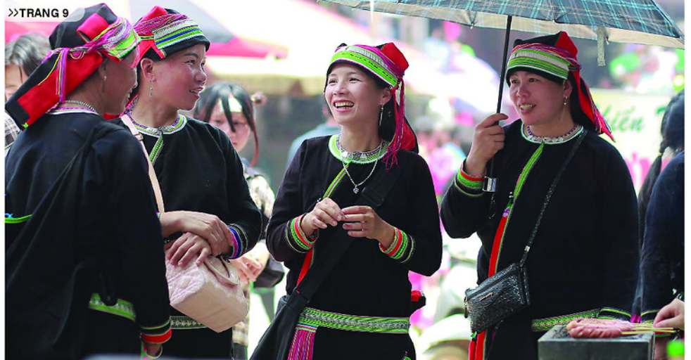
Trang phục truyền thống của dân tộc Dao Áo dài được người dân xã Khâu Vai gìn giữ qua nhiều thế hệ. Bài, ảnh: TRẦN KẾ