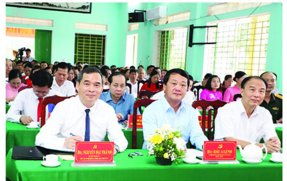
Bí thư Tỉnh ủy Hứa A Lệnh dự Hội nghị công bố nghị quyết, quyết định về sắp xếp thôn, tổ dân phố tại phường Mỹ Lâm.