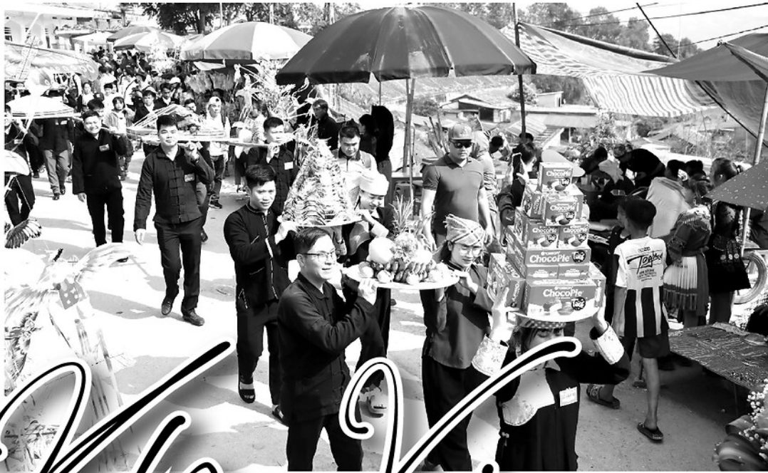
Chợ tình Khâu Vai - nét đẹp văn hóa đặc sắc được xã Khâu Vai quan tâm bảo tồn và phát huy giá trị.