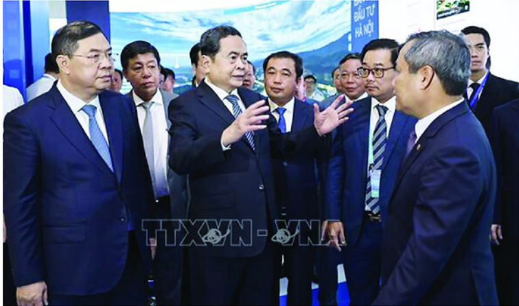
Chủ tịch Quốc hội Trần Thanh Mẫn tham quan không gian trưng bày Khu công nghiệp số, Chính quyền số, Trung tâm đổi mới sáng tạo tại Hội nghị công bố quy hoạch tổng thể Thủ đô Hà Nội tầm nhìn 100 năm và xúc tiến đầu tư năm 2026.