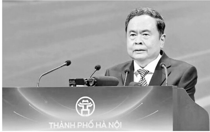
Chủ tịch Quốc hội Trần Thanh Mẫn phát biểu tại Hội nghị.

Cùng với đó là sự chuyển đổi từ tư duy phát triển đơn cực sang mô hình chùm đô thị liên kết vùng, định vị Hà Nội là hạt nhân của vùng Thủ đô, hình thành 9 cực tăng trưởng chiến lược, 9