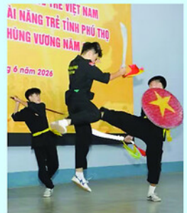
Màn đấu 1 chống 2 có binh khí.

Không chỉ là hoạt động đánh giá kết quả tập luyện của võ sinh, kỳ thi còn cho thấy cách làm sáng tạo trong việc đưa phong trào thể dục thể thao vào môi trường bệnh viện. Qua đó, mô hình góp phần xây dựng môi trường văn hóa lành mạnh, nâng cao sức khỏe thể chất, tinh thần cho cán bộ, nhân viên y tế, đồng thời tạo sân chơi rèn luyện cho thanh thiếu niên.