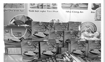
Bột sắn dây Thực Sơn SD.

Sản phẩm đã được đóng gói, có tem truy xuất nguồn gốc và được cấp chứng nhận đủ điều kiện vệ sinh an toàn thực phẩm theo quy định của Bộ Y tế. Với 2