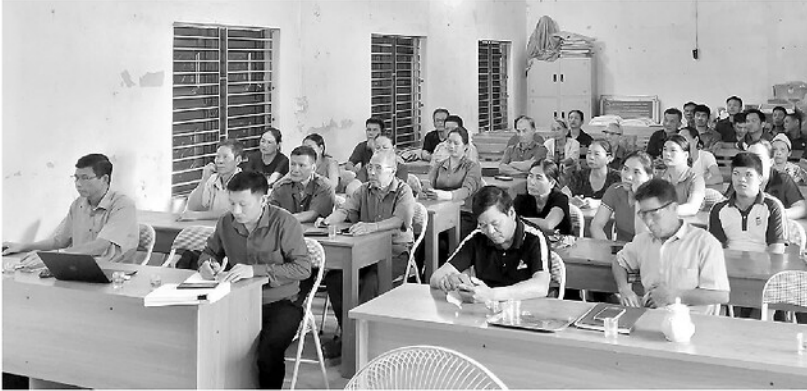
Người dân thôn Vinh Gia, xã Đông Yên được tham gia góp ý phương án sắp xếp, tổ chức lại thôn.