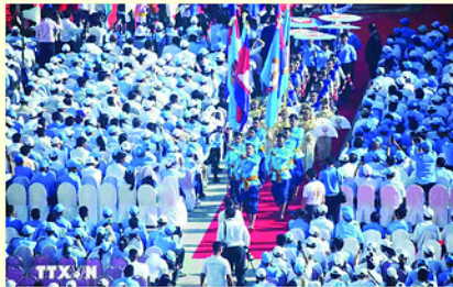
CPP đã lãnh đạo đất nước Campuchia đạt được nhiều thành tựu to lớn.

Ban Chấp hành Trung ương Đảng Cộng sản Việt Nam đã gửi Điện mừng tới Ban Chấp hành Trung ương Đảng Nhân dân Campuchia, toàn thể đảng viên CPP và Nhân dân Campuchia với những lời chúc mừng nồng nhiệt nhất.