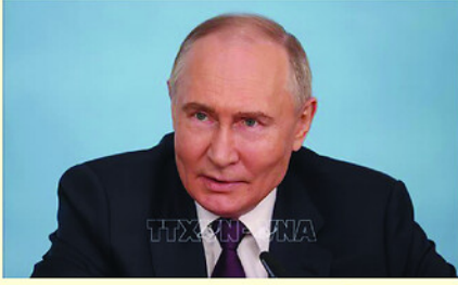
Tổng thống Nga Putin.

T ỔNG thống Nga Vladimir Putin cho biết Moskva đang chờ phái đoàn Mỹ tới làm việc, sẵn sàng tiếp tục đàm phán với Ukraine, đồng thời khẳng định sẽ không để Kiev tạo lợi thế trên bàn thương lượng.