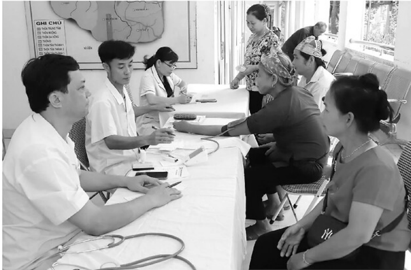
UBND xã Liên Hiệp phối hợp với Bệnh viện mắt Trường Phúc (Phú Thọ) tổ chức khám sức khỏe cho người dân trên địa bàn.

Sinh thời, Chủ tịch Hồ Chí Minh luôn dành sự quan tâm đặc biệt đến sức khỏe của Nhân dân. Trong bài viết “Vệ sinh yêu nước” đăng ngày 2-7-1958 trên báo Nhân Dân, Người đã nhắc nhở: “Mọi người từ già đến trẻ, trai gái đã là người yêu nước đều phải quan tâm đến vấn đề vệ sinh, giữ gìn sức khỏe”. Thấm nhuần lời dạy đó, ngày 2-7 hằng năm đã được chọn là “Ngày Vệ sinh yêu nước nâng cao sức khỏe Nhân dân”.