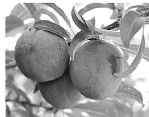
Cây mận nói chung và quả mận nói riêng là những vị thuốc độc đáo.

rửa sạch, giã nát rồi đắp lên vết thương.