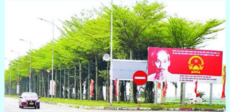
Điện mao xã Tam Hưng (Hà Nội) từng bước văn minh, hiện đại hơn.

S AU một năm triển khai thực hiện mô hình chính quyền địa phương 2 cấp, hoạt động của xã Tam Hưng (Hà Nội) đã đi vào nền nếp, phát huy hiệu quả. Nhiều nhiệm vụ như giải phóng mặt bằng, phát triển hạ tầng, bảo đảm an sinh xã hội đã đạt những kết quả quan trọng.