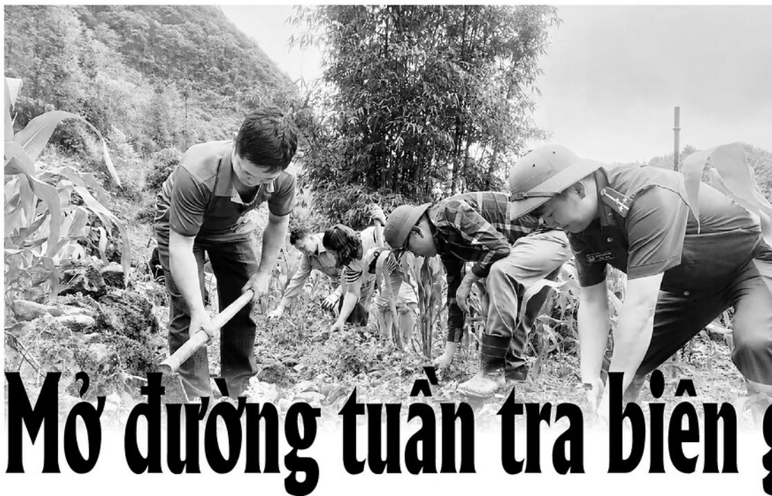
Cán bộ, chiến sĩ lực lượng vũ trang và Nhân dân xã Tùng Vài tham gia mở tuyến đường tuần tra biên giới.