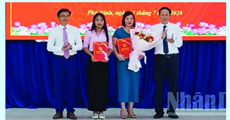
Lãnh đạo xã Phú Ninh (Đà Nẵng) trao quyết định bổ nhiệm nhân sự trạm y tế xã.

S ÁNG 1/7, Đảng ủy - Hội đồng nhân dân - Ủy ban nhân dân - Ủy ban Mặt trận Tổ quốc Việt Nam các xã: Sơn Cẩm Hà, Tiên Phước, Chiên Đàn và Phú Ninh, thành phố Đà Nẵng tổ chức Hội nghị công bố quyết định thành lập trạm y tế và bắt đầu đưa vào hoạt động từ ngày 1/7/2026.