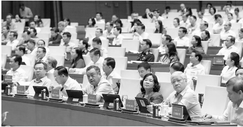
Các đồng chí lãnh đạo Đảng, Nhà nước và đại biểu dự hội nghị.

Trình bày báo cáo tại hội nghị, đồng chí Nguyễn Duy Ngọc, Ủy viên Bộ Chính trị, Bí thư Trung ương Đảng, Trưởng ban Tổ chức Trung ương, Trưởng Ban Chỉ đạo sơ kết cho biết: Qua một năm vận hành, dưới sự lãnh đạo trực tiếp, toàn diện, quyết liệt của Ban Chấp