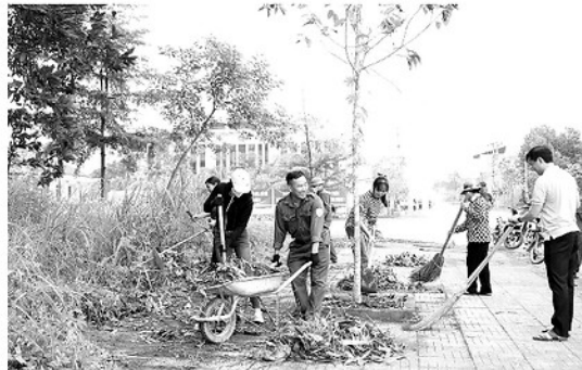
Cán bộ, Nhân dân xã Yên Sơn ra quân dọn dẹp vệ sinh môi trường.

Ngày Vệ sinh yêu nước nâng cao sức khỏe Nhân dân 2026 diễn ra trong bối cảnh ngành Y tế đang thúc đẩy mạnh mẽ việc nâng cấp năng lực tuyến y tế cơ sở theo tinh thần Nghị quyết số 72-NQ/TW của Bộ Chính trị, hướng tới tăng cường bảo vệ, chăm sóc và nâng cao sức khỏe Nhân dân. Theo Bác