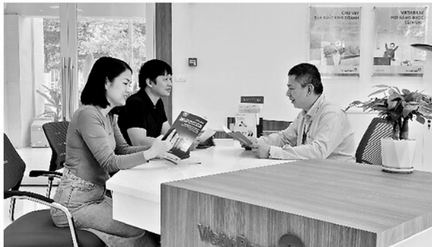
VietinBank Tuyên Quang chủ động tiếp cận khách hàng, tìm kiếm các dự án, phương án sản xuất, kinh doanh khả thi nhằm thúc đẩy tăng trưởng tín dụng.

Mặc dù nguồn vốn huy động trên địa bàn tỉnh tiếp tục tăng trưởng ổn định, mặt bằng lãi suất cơ bản được duy trì ở mức hợp lý, song tăng trưởng tín dụng những tháng đầu năm 2026 vẫn ở mức thấp. Thực tế này cho thấy khả năng hấp thụ vốn của nền kinh tế còn hạn chế, đòi hỏi sự vào cuộc đồng bộ của ngành Ngân hàng, doanh nghiệp và các cấp, ngành nhằm khơi thông dòng vốn phục vụ phát triển sản xuất, kinh doanh.