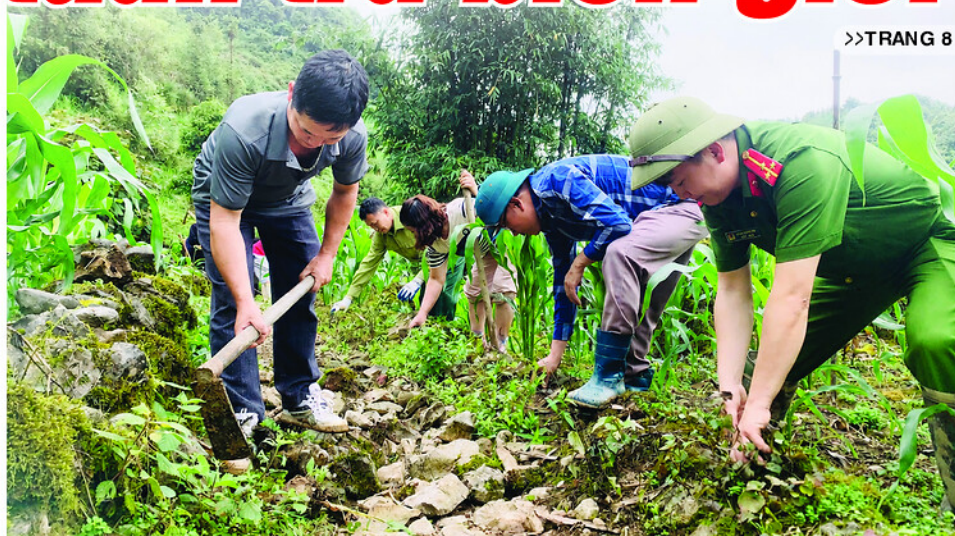
Cán bộ, chiến sĩ lực lượng vũ trang và Nhân dân xã Tùng Vài tham gia mở tuyến đường tuần tra biên giới.