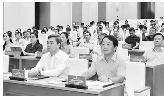
Bí thư Tỉnh ủy Hầu A Lênh và các đại biểu dự hội nghị tại điểm cầu tỉnh.

Tỉnh đã triển khai Hệ thống thông tin điều hành tác nghiệp đến 136 cơ quan, đạt 100%, với hơn 6.949 tài khoản người dùng; 100% đảng ủy xã, phường đã gửi, nhận và đọc được văn bản