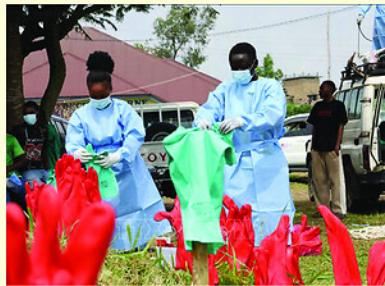
Nhân viên y tế khử trùng gắng tay sau khi điều trị cho bệnh nhân Ebola ở tỉnh Ituri, CHDC Congo.

Trung tâm Kiểm soát và Phòng ngừa dịch bệnh (CDC) châu Phi, Tổ chức Y tế Thế giới (WHO) và Chính phủ Uganda vừa chính thức ra mắt Nhóm Hồ sơ quản lý sự cố cấp châu lục (IMST) nhằm tăng cường năng lực ứng phó với đợt bùng phát dịch Ebola hiện nay, đồng thời nâng cao khả năng sẵn sàng trước các tình huống y tế khẩn cấp trong tương lai. Liên hợp quốc cảnh báo rằng đợt bùng phát dịch Ebola hiện nay có thể khiến châu Phi thiệt hại tới 3,6 tỷ USD và làm mất hàng trăm nghìn việc làm, đồng thời có nguy cơ dẫn đến một cuộc khủng hoảng phát triển trên toàn khu vực.