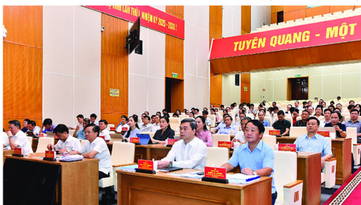
Đồng chí Hầu A Lênh, Ủy viên BCH Trung ương Đảng, Bí thư Tỉnh ủy và các đại biểu dự hội nghị tại điểm cầu tỉnh.