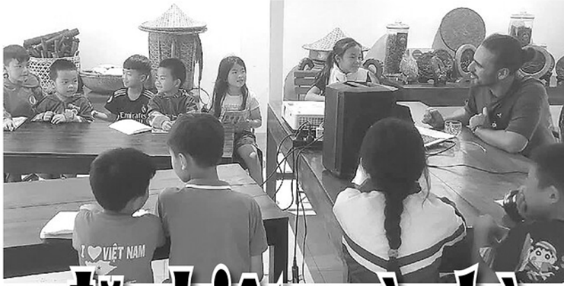
Lớp học tiếng Anh miễn phí tại thôn Thèn Pá giúp học sinh và người dân vùng cao tự tin hơn trong giao tiếp.

Trong kỳ nghỉ hè, khi nhiều người nghĩ đến những ngày nghỉ dài thì một số thôn bản vùng cao lại diễn ra những lớp học đặc biệt. Mỗi lớp học mang một mục đích riêng, nhưng đều lặng lẽ gieo những hạt mầm tri thức và giữ gìn bản sắc cho cộng đồng.