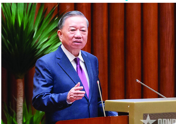
Tổng Bí thư, Chủ tịch nước Tô Lâm phát biểu chỉ đạo tại Hội nghị toàn quốc sơ kết 1 năm vận hành mô hình tổ chức tổng thể của hệ thống chính trị và mô hình chính quyền 3 cấp.