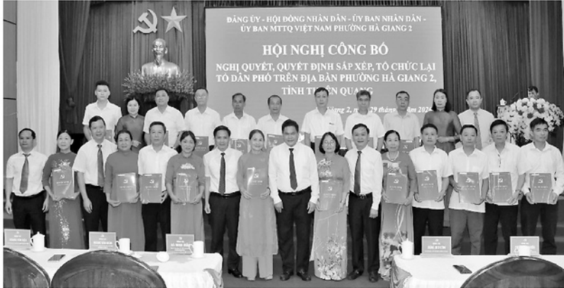
Lãnh đạo phường Hà Giang 2 trao Quyết định chỉ định Bí thư chi bộ các tổ dân phố trên địa bàn.

Cùng với công tác nhân sự, Ban Thường vụ Đảng ủy phân công các đồng chí cấp ủy viên trực tiếp phụ trách, hướng dẫn các Chi bộ về quy trình tổ chức sinh hoạt, xây dựng chương trình công tác và triển khai các nhiệm vụ chính trị. Sự chỉ đạo sát sao của cấp ủy cấp trên đã giúp các Chi bộ nhanh chóng ổn định tổ chức, bảo đảm hoạt động liên tục, không để gián đoạn công tác lãnh đạo ở cơ sở. Điểm nổi bật sau khi thành lập là các Chi bộ đều tổ chức Hội nghị Ban Chấp hành để thống nhất quy chế làm việc, phân công nhiệm vụ cho từng cấp ủy viên, xây dựng chương trình công tác toàn khóa và ban hành nghị quyết lãnh đạo thực hiện nhiệm vụ trong giai đoạn