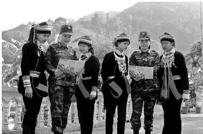
Cán bộ, chiến sĩ Bộ đội Biên phòng tuyên truyền pháp luật cho học sinh dân tộc thiểu số trên địa bàn xã Lao Chải.

Những cuộc điện thoại báo tin, những lá đơn tố giác, những dấu hiệu bất thường được người dân kịp thời phản ánh đã trở thành những mắt xích quan