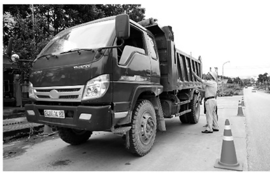
Lực lượng Cảnh sát Giao thông, Công an tỉnh kiểm tra tải trọng, coi nơi thành thủng đối với phương tiện xe tải.

QUỐC lộ 2, Quốc lộ 2C, Quốc lộ 37 và Quốc lộ 4C là các tuyến đường huyết mạch quan trọng, phục vụ nhu cầu đi lại và vận chuyển lưu thông vận tải hàng hóa giữa Tuyên Quang và các tỉnh lân cận. Thực hiện chỉ đạo của UBND tỉnh, Giám đốc Công an tỉnh, ngay từ đầu năm, Phòng Cảnh sát giao thông đã tham mưu xây dựng các kế hoạch tăng cường kiểm tra, kiểm soát và xử lý hành vi chở hàng quá tải trọng của phương tiện giao