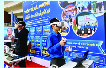
Tuổi trẻ Hải Phòng tiên phong kiến tạo thành phố số.

CHÍNH quyền thành phố Hải Phòng vừa quyết định thành lập Tổ công tác thu hút đầu tư công nghệ cao, đổi mới sáng tạo nhằm cải thiện môi trường kinh doanh và thúc đẩy phát triển kinh tế bền vững.