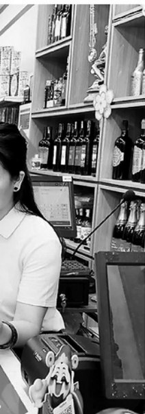
tránh nợ mới phát sinh.

ĐẦU TƯ PHÁT THUẾ ĐƯỢC XÁC ĐỊNH. TUY NHIÊN, KINH DOANH THỰC HÓA MỤC