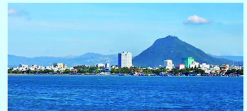
Đắk Lắk có nhiều tiềm năng phát triển kinh tế biển, logistics, cảng biển, dịch vụ và du lịch biển.

THEO đánh giá của Ủy ban nhân dân tỉnh Đắk Lắk, trong 6 tháng đầu năm 2026, mặc dù còn nhiều khó khăn, thách thức, tình hình kinh tế - xã hội của tỉnh tiếp tục giữ ổn định và đạt nhiều kết quả tích cực trên các lĩnh vực. Tốc độ tăng trưởng kinh tế 6 tháng đầu năm của tỉnh ước đạt 8,01%. Cơ cấu tổng sản phẩm (GRDP) theo giá hiện hành tiếp tục chuyển dịch tích cực, phù hợp định hướng phát triển của tỉnh. Tổng vốn đầu tư toàn xã hội ước đạt 23.355 tỷ đồng, bằng 87,94% so với cùng kỳ, đạt 29,1% kế hoạch. Tổng kim ngạch xuất khẩu ước đạt hơn 1,5 tỷ USD, tăng 3,8% so với cùng kỳ năm 2025, đạt 54% kế hoạch.