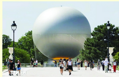
Trời nắng nóng gay gắt tại Paris, Pháp.

Nhiều quốc gia châu Âu đang đối mặt với đợt nắng nóng cực đoan mới, kéo theo cháy rừng lan rộng, hạn hán nghiêm trọng và nguy cơ quá tải hạ tầng, buộc chính quyền các nước phải triển khai hàng loạt biện pháp ứng phó khẩn cấp. Các nhà khoa học nhận định biến đổi khí hậu do con người gây ra là nguyên nhân khiến các đợt nắng nóng cực đoan ngày càng xuất hiện thường xuyên hơn, kéo dài hơn và có cường độ mạnh hơn trên khắp châu Âu.