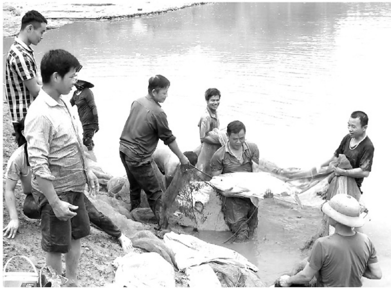
Người dân thôn Kiềm, xã Bắc Quang khai thác lợi thế từ nguồn nước nuôi thủy sản.

Cùng với phát triển các ngành hàng chủ lực như chè, cam, gỗ rừng trồng, chăn nuôi đại gia súc, lĩnh vực thủy sản ở Tuyên Quang đã có bước chuyển mình mạnh mẽ. Từ chỗ chủ yếu khai thác tự nhiên và nuôi nhỏ lẻ, manh mún, ngành Thủy sản đang từng bước hình thành các vùng sản xuất tập trung, ứng dụng khoa học kỹ thuật, liên kết tiêu thụ sản phẩm, góp phần nâng cao giá trị sản xuất nông nghiệp.