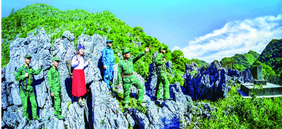
Giờ tuần tra của cán bộ, chiến sĩ và Nhân dân đồn Biên phòng Đồng Văn tại cột mốc 397, thôn Lao Xa, xã Sà Phìn.