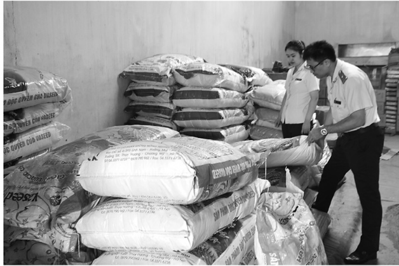
Lực lượng Thanh tra kiểm tra sản phẩm phân bón tại cửa hàng vật tư xã Yên Sơn.

Quy định nổi lộng kiểm tra phân bón nhập khẩu tại cửa khẩu từ ngày 1-7 là bước đi đúng hướng nhằm đồng hành và tháo gỡ khó khăn cho doanh nghiệp. Tuy nhiên, khi dòng chảy tiền kiểm được khơi thông, công tác hậu kiểm càng phải siết chặt, nếu không, nguy cơ phân bón kém chất lượng tràn vào thị trường sẽ đe dọa trực tiếp đến sản xuất nông nghiệp.