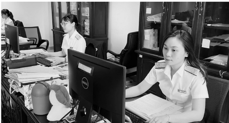
Thuế tỉnh Tuyên Quang tăng cường ứng dụng công nghệ thông tin trong quản lý, rà soát, phân loại nợ thuế, nâng cao hiệu quả công tác thu hồi nợ đọng trên địa bàn.

Nếu như trước đây, việc thu hồi nợ chủ yếu do cơ quan thuế thực hiện thì hiện nay, việc khai thì thực tiễn cho thấy, nhiều khoản nợ đã vượt ra ngoài phạm vi của một ngành. Những vướng mắc về đất đai, khoáng sản, pháp lý hành án, tài sản của doanh nghiệp người nộp thuế và kinh doanh đều cần