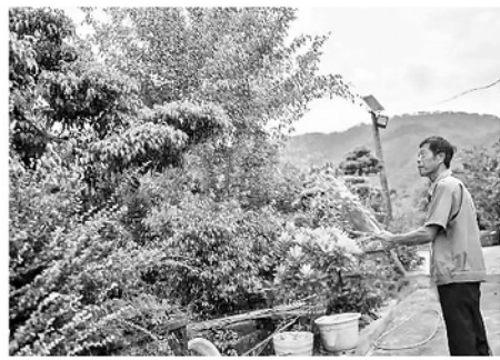
Người dân Mỹ Tân chăm sóc hoa cây cảnh.

Hiện Mỹ Tân có 20 ha trồng khoảng 70.000 cây, trong đó 15 ha là rừng la hán, một lượng, phần còn lại chủ yếu là đào cảnh. Kết quả rõ rệt: trong 73 hộ, đã có 20 hộ đạt thu nhập trên 60 triệu đồng/người/năm, đời sống cải thiện rõ rệt.