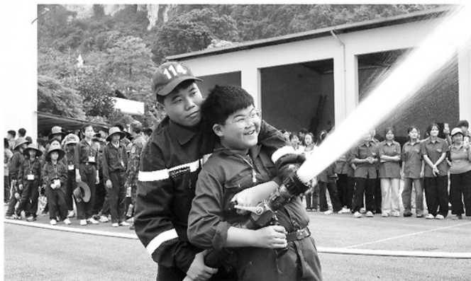
Học sinh được trải nghiệm thực hành chữa cháy dưới sự hướng dẫn của cán bộ Cảnh sát PCCC và CNCH.

Hiện toàn tỉnh có 7.676 cơ sở thuộc diện quản lý về PCCC, trong đó Công an tỉnh trực tiếp quản lý 2.803 cơ sở, UBND cấp xã quản lý 4.873 cơ sở. Song song với công tác kiểm tra, hướng dẫn, lực lượng chức năng thường xuyên tổ chức tuyên truyền, tập huấn và đẩy mạnh các mô hình truyền quan, sinh động nhằm giúp người dân dễ tiếp cận kiến thức, rèn luyện kỹ năng xử lý tình huống thực tế. Nổi bật, Công an tỉnh đã đưa vào hoạt động Trung tâm giáo dục cộng đồng về PCCC và CNCH với 14 khu vực chức năng, tái hiện các tình huống cháy, nổ