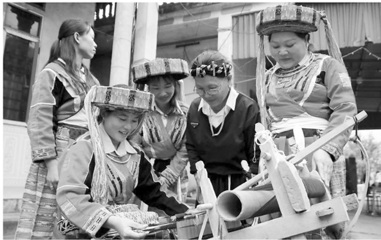
Đồng bào dân tộc Pà Thẻn xã Tân Quang giữ gìn nghề dệt truyền thống.

Sáp nhập thôn, tổ dân phố là chủ trương đúng đắn để tinh gọn đầu mối, mở ra không gian mới cho sự phát triển toàn diện tại cơ sở. Vượt qua những trở ngại ban đầu về không gian sinh hoạt, sự đồng thuận của người dân đã nhanh chóng định hình nên những khu dân cư văn minh, hòa hợp.