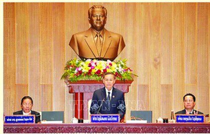
Chủ tịch Quốc hội Lào Xaysomphone Phomvihane phát biểu khai mạc Kỳ họp.

QUỐC hội Lào khóa X đã chính thức khai mạc Kỳ họp bất thường lần thứ nhất, thảo luận và thông qua Báo cáo của Chính phủ về việc tổ chức thực hiện Kế hoạch phát triển kinh tế - xã hội quốc gia, kế hoạch ngân sách nhà nước, kế hoạch tiến tệ 6 tháng đầu năm 2026 và phương hướng kế hoạch 6 tháng cuối năm 2026; thảo luận và thông qua Chương trình nghị sự quốc gia về phát triển nông thôn và xóa nghèo khó cho người dân; thảo luận và thông qua việc xây dựng và sửa đổi 2 luật là Luật Kho bạc Nhà nước (xây mới) và Luật Ngân sách Nhà nước (sửa đổi); và thảo luận thông qua một số vấn đề quan trọng, cần kíp gắn với Chương trình nghị sự quốc gia về phát triển nông thôn và xóa nghèo cho người dân.