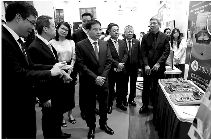
Phó Thủ tướng Nguyễn Văn Thắng tham quan không gian triển lãm các sản phẩm công nghệ, sản phẩm đổi mới sáng tạo trước thềm lễ khai mạc.

Phát biểu khai mạc Tuần lễ Kinh tế - Tài chính - Công nghệ Đà Nẵng năm 2026, Phó Thủ tướng Nguyễn Văn Thắng cho rằng, đây là sự kiện có ý nghĩa quan trọng, được tổ chức trong bối cảnh Việt Nam đang bước vào giai đoạn phát triển mới với yêu cầu cao hơn về tăng trưởng, hội nhập và phát triển bền vững.