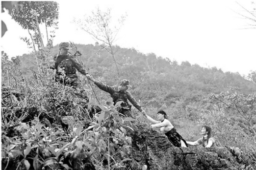
Những cung đường tuần tra vất vả, gian nan trên tuyến biên giới xã Phố Bàng.

trong từng lời nhắc của người dân với tình cảm sâu nặng.