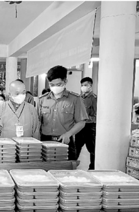
những suất ăn tại Chương trình

Trị sự Phật giáo Việt Nam tỉnh phát huy tốt vai trò tập hợp tăng ni, Phật tử, kết nối các cơ sở tự viện, huy động hiệu quả các nguồn lực xã hội, tiếp tục đồng hành cùng cấp ủy, chính quyền chăm lo đời sống Nhân dân và xây dựng quê hương ngày càng phát triển.