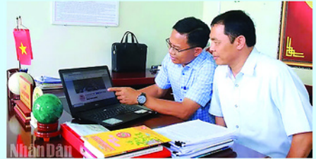
Lãnh đạo xã Ia Hiao giới thiệu trang Facebook "Ia Hiao ngày mới".

Đ ẢNG ủy và chính quyền xã Ia Hiao, tỉnh Gia Lai đã khéo léo vận dụng nền tảng số, biến lượt xem trên Facebook thành Quỹ Khuyến học, tạo nên mô hình an sinh độc đáo giữa thời cuộc chuyển đổi mạnh mẽ của cách mạng công nghệ 4.0.