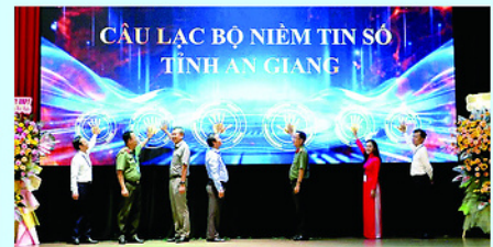
Các đại biểu thực hiện nghi thức ra mắt Cầu lạc bộ "Niềm tin số tỉnh An Giang".

C ÔNG an tỉnh An Giang vừa tổ chức Hội nghị "Gặp mặt, kết nối người có ảnh hưởng (KOL), quản trị viên trang (QTV), hội, nhóm trên không gian mạng" và chính thức ra mắt Cầu lạc bộ (CLB) "Niềm tin số tỉnh An Giang". Đây là bước đi chiến lược nhằm xây dựng thể trận an ninh nhân dân vững chắc trên môi trường số.