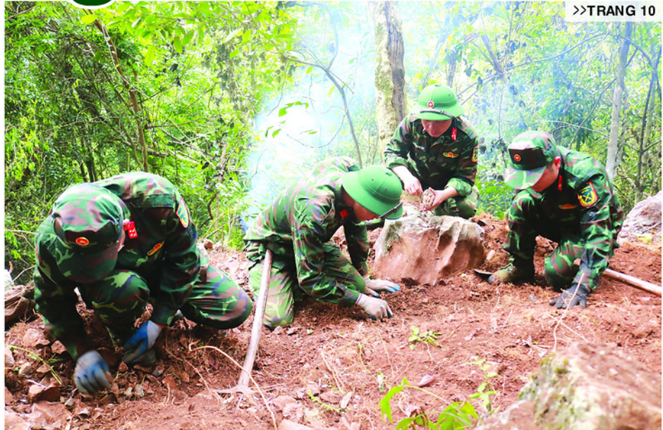
Cán bộ, chiến sĩ Đội tìm kiếm, quy tập hài cốt liệt sĩ, Bộ CHQS tỉnh thực hiện nhiệm vụ tại Điểm cao 685, thôn Giang Nam, xã Thanh Thủy.