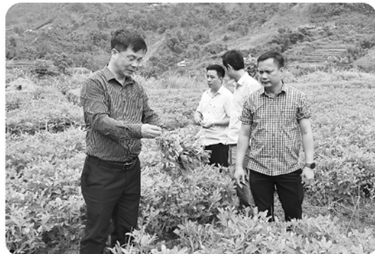
Lãnh đạo xã Khuôn Lùng trao đổi với đơn vị liên kết về mô hình trồng lạc đỏ.

Xác định xây dựng cây trồng chủ lực là một trong những giải pháp quan trọng để phát triển kinh tế nông nghiệp, nâng cao thu nhập cho người dân, xã Khuôn Lùng đang tập trung phát huy hiệu quả những cây trồng có lợi thế, đồng thời đưa các cây trồng mới vào sản xuất theo hướng liên kết, từng bước nâng cao giá trị trên diện tích canh tác.