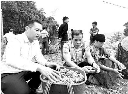
Cây gừng đang mang lại hiệu quả và giá trị kinh tế cao tại xã Lũng Cú.

hình, kết nối tiêu thụ sản phẩm và tháo gỡ khó khăn ngay từ đầu. "Khi người dân thấy chủ trương đúng, cán bộ nói đi đôi với làm và có hướng phát triển bền vững, họ sẽ chủ động tham gia. Một chi bộ mạnh không chỉ ban hành được nghị quyết, mà phải biến nghị quyết thành sinh kế, thành thu nhập và niềm tin của Nhân dân", đồng chí nhấn mạnh.