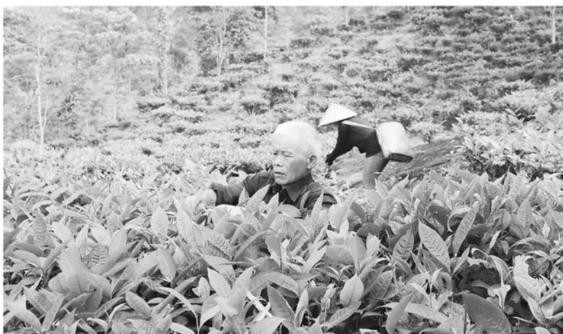
Cây chè mang lại giá trị kinh tế cao cho người dân xã Khuôn Lùng.

Từ một cây trồng gắn bó nhiều năm với người dân, chè đang từng bước được nâng tầm giá trị. Đến nay, xã Khuôn Lùng có 2 sản phẩm chè đạt OCOP 3 sao, góp phần khẳng định chất lượng nông sản địa phương, từng bước nâng cao giá trị và sức cạnh tranh của sản phẩm chè, tạo nền tảng để địa phương tiếp tục phát huy lợi thế cây chè trong phát triển kinh tế nông nghiệp.