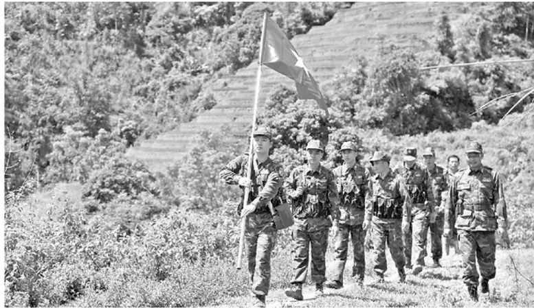
Đường tuần tra của cán bộ, chiến sĩ Đồn Biên phòng Cửa khẩu Quốc tế Thanh Thủy và Tổ tự quản bảo vệ đường biên, cột mốc trên tuyến biên giới thôn Giang Nam.

Giữa trùng điệp núi đá nơi cực Bắc, những cột mốc chủ quyền hiện ngang đứng giữa nắng mưa, đánh dấu từng tấc đất thiêng liêng của Tổ quốc. Phía sau có những con người bình dị đang ngày ngày góp sức canh giữ biên cương bằng trách nhiệm, tình yêu quê hương và niềm tin son sắt. Dù không mang quân hàm, họ đã trở thành những "cột mốc sống" bền bỉ, góp phần tạo nên thế trận lòng Dân vững chắc nơi phen dậu của đất nước.