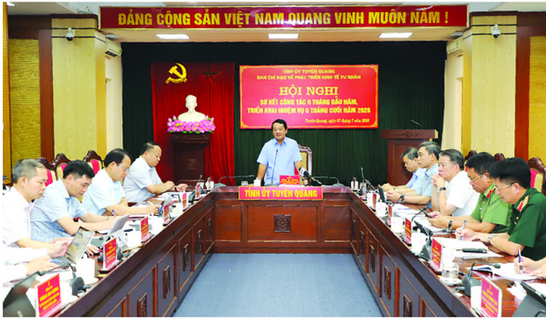
Bí thư Tỉnh ủy Hầu A Lênh phát biểu kết luận tại hội nghị.