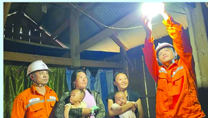
Điện về bản Huổi Linh xã Mường Mò, đây là bản cuối cùng của tỉnh Lai Châu có điện lưới quốc gia.

CÔNG ty Điện lực Lai Châu vừa tổ chức lễ đóng điện công trình cấp điện cho các thôn, bản chưa có điện trên địa bàn xã Mường Mò, gồm hai bản Huổi Đạo và Huổi Linh.