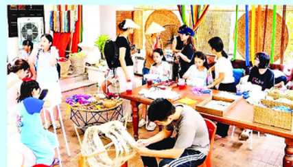
Các bạn trẻ hào hứng trải nghiệm nghề tơ tằm, dệt lụa, góp phần lan tỏa giá trị văn hóa làng nghề.

Tại làng Hạ Trạo, nay là tổ dân phố Hành Cung (phường Nam Hoa Lư, tỉnh Ninh Bình), nghề trồng dâu, nuôi tằm, ươm tơ, dệt lụa đang được khởi phục theo hướng sản xuất khép kín gắn với phát triển du lịch trải nghiệm.