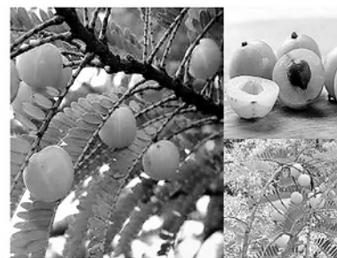
Hầu hết các bộ phận của cây me rừng đều có thể dùng để chữa bệnh.