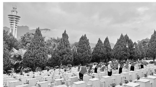
Tuổi trẻ xã Vị Xuyên tham gia dọn dẹp, vệ sinh Nghĩa trang Liệt sĩ.