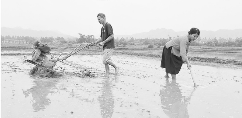
Người dân phường Hà Giang 1 làm đất, bảo đảm tiến độ gieo cấy vụ Hè - Thu theo kế hoạch.

Hiện nay, tại các địa phương trong tỉnh, tận dụng được nguồn nước tự nhiên, sau khi thu hoạch lúa xuân, bà con nông dân toàn tỉnh đã nhanh chóng cày ải, làm đất, sẵn sàng gieo cấy vụ mùa.