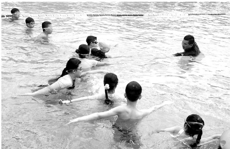
Các em thiếu nhi được rèn luyện kỹ năng bơi và phòng, chống đuối nước tại Trung tâm Văn hóa - Thể thao Thanh thiếu nhi tỉnh.

KHI NĂM HỌC KHÉP LẠI CŨNG LÀ THỜI ĐIỂM CÁC HOẠT ĐỘNG HÈ DÀNH CHO THANH THIẾU NHI TRÊN ĐỊA BÀN TỈNH TRỞ NÊN SÔI ĐỘNG. TỪ CÁC LỚP HỌC NĂNG KHIẾU, CẦU LẠC BỘ THỂ THAO ĐẾN NHỮNG GIẢI ĐẤU PHONG TRÀO ĐƯỢC TỔ CHỨC Ở CƠ SỞ ĐÃ TẠO MÔI TRƯỜNG ĐỂ CÁC EM RÈN LUYỆN THỂ CHẤT, PHÁT TRIỂN NĂNG KHIẾU, KỸ NĂNG SỐNG VÀ CÓ MỘT KỶ NGHỈ HÈ BỔ ÍCH, AN TOÀN.