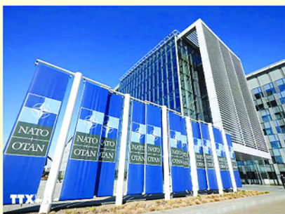
Trụ sở NATO tại Brussels, Bỉ.

Hội nghị Thượng đỉnh Tổ chức Hiệp ước Bắc Đại Tây Dương (NATO) đã khai mạc tại Ankara (Thổ Nhĩ Kỳ) bằng Diễn đàn Công nghiệp Quốc phòng, nơi liên minh công bố hàng loạt chương trình hợp tác và mua sắm vũ khí mới trị giá hàng chục tỷ USD nhằm tăng cường năng lực quân sự và thúc đẩy sản xuất quốc phòng. NATO kỳ vọng việc công bố các dự án quốc phòng quy mô lớn sẽ chứng minh với Washington rằng các đồng minh đang tăng cường đầu tư quốc phòng, trong khi Mỹ chuyển trọng tâm chiến lược sang khu vực Ấn Độ Dương - Thái Bình Dương.