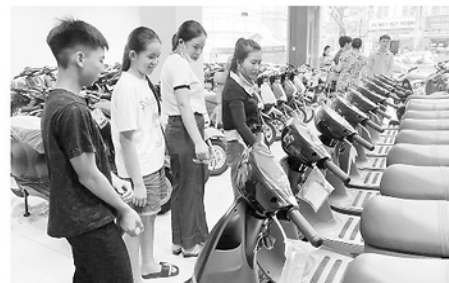
Phụ huynh và học sinh lựa chọn xe điện trước thềm năm học mới.

Theo các đơn vị kinh doanh, bên cạnh mẫu mã và giá bán, khách hàng hiện quan tâm nhiều đến chất lượng pin hoặc ắc quy, độ bền, khả năng vận hành, chế độ bảo hành và chi phí sử dụng lâu dài. Xu hướng lựa chọn xe điện cũng phản ánh sự quan tâm ngày càng lớn của người tiêu dùng đối với những phương tiện tiết kiệm, thân thiện với môi trường và phù hợp với nhu cầu đi lại hằng ngày.