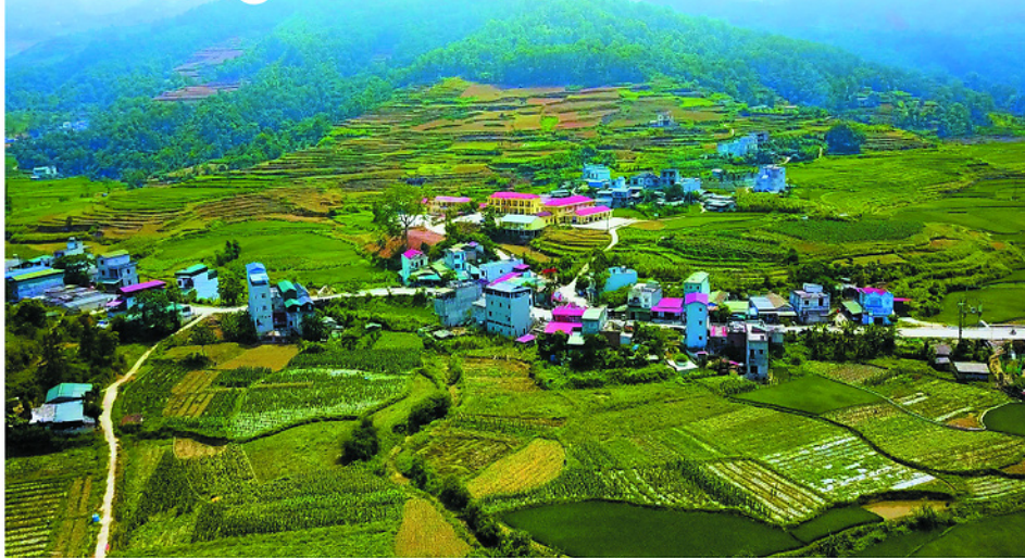
Diện mạo nông thôn xã biên giới Bạch Đích ngày càng khởi sắc nhờ các chủ trương, chính sách phát triển kinh tế - xã hội được triển khai hiệu quả. Bài, ảnh: QUỲNH CHÂU