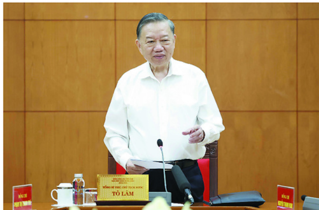
Tổng Bí thư, Chủ tịch nước Tô Lâm chủ trì làm việc với ngành Nội vụ về chất lượng nguồn lao động Việt Nam.

Phát triển khoa học, công nghệ, đổi mới sáng tạo và chuyển đổi số phải có kết quả cụ thể