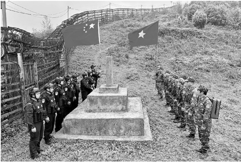
Đồn Biên phòng Sơn Vĩ và các lực lượng chức năng nước láng giềng Trung Quốc tuần tra, kiểm soát liên hợp, thực thi pháp luật trên tuyến biên giới.

Bình yên nơi biên giới được tạo nên từ nhiều lớp "lá chắn". Đó là thể trận lòng Dân bền chặt, là sự đồng lòng của đồng bào các dân tộc nơi phen giậu Tổ quốc và đặc biệt, là hiệu quả của công tác đối ngoại biên phòng được duy trì thường xuyên, thực chất. Từ những cái bắt tay bên cột mốc, các cuộc tuần tra liên hợp đến giao lưu hữu nghị giữa lực lượng quản lý biên giới hai nước đã góp phần củng cố lòng tin, tăng cường hợp tác, cùng xây dựng đường biên giới hòa bình, hữu nghị, ổn định và phát triển.