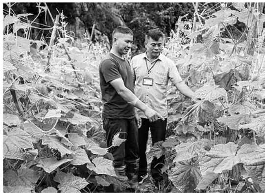
Mô hình trồng dưa chuột liên kết tại thôn Na Sàng, xã Bạch Đích.

Buổi sáng ở Bạch Đích bắt đầu với tiếng động cơ máy cày,