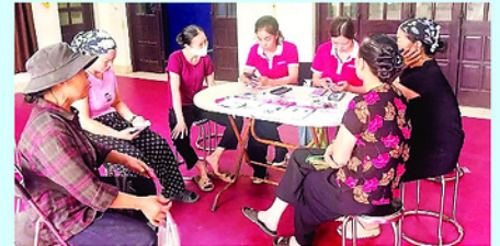
Tổ xác thực thuê bao di động Viettel Bắc Ninh làm việc tại Nhà văn hóa Phù Khê Thượng, phường Phù Khê.

NHỮNG ngày qua, Viettel Bắc Ninh đã huy động toàn lực, phối hợp chặt chẽ với chính quyền cơ sở, ngày đêm hỗ trợ hàng trăm nghìn công nhân và người dân hoàn thành việc xác thực thông tin thuê bao. Tỉnh Bắc Ninh hiện có gần một trăm khu công nghiệp và cụm công nghiệp đang hoạt động, là nơi làm việc và sinh sống của hàng trăm nghìn công nhân từ mọi miền đất nước.