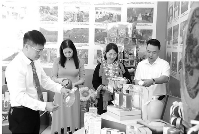
Các sản phẩm OCOP của tỉnh được trưng bày tại Lễ kỷ niệm 80 năm Ngày thành lập ngành Nông nghiệp và Môi trường do Sở Nông nghiệp và Môi trường tổ chức.

Khác với những năm đầu phải tập trung hoàn thiện từng tiêu chí cơ bản, giai đoạn mới hướng nhiều hơn đến chất lượng, tính bền vững và khả năng thích ứng với yêu cầu phát triển nông thôn hiện đại. Ngay những tháng đầu năm 2026, tỉnh đã chủ động chuẩn bị các điều kiện cần thiết cho một chương mới trong tiến trình xây dựng NTM. Hiện tỉnh đã lựa chọn phân nhóm các xã, xác định rõ lộ trình xây dựng