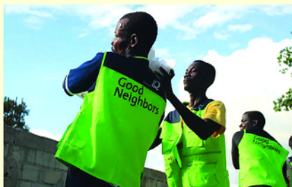
GNI không chỉ hỗ trợ nguồn lực mà còn hướng dẫn phát triển cộng đồng một cách bài bản và bền vững.

GNI không chỉ hỗ trợ nguồn lực mà còn hướng dẫn phát triển cộng đồng một cách bài bản và bền vững. Thay vì hỗ trợ đơn lẻ, các dự án được thiết kế theo chuỗi liên kết giữa giáo dục, sinh kế, bảo vệ trẻ em, bình đẳng giới, nước sạch và vệ sinh môi trường, qua đó giúp người dân từng bước nâng cao năng lực tự vươn lên.