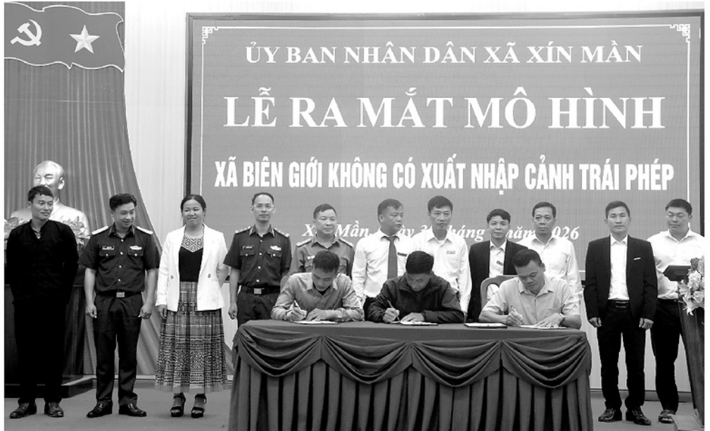
Các thôn ở xã Xín Mản ký cam kết thực hiện mô hình “Xã biên giới không có xuất nhập cảnh trái phép”.

Địa hình chủ yếu là núi cao, chia cắt mạnh, nhiều đường mòn, lối mở xuyên rừng; dân cư phân tán, phần lớn là đồng bào dân tộc thiểu số; đời sống ở một số địa bàn còn nhiều khó khăn; quan hệ thân tộc, hôn nhân xuyên biên giới được hình thành từ nhiều thế hệ là những yếu tố khách quan khiến công tác quản lý biên giới luôn đứng trước không ít thách thức. Chỉ cần một người dân thiếu hiểu biết pháp luật, một đối tượng vi lợi ích trước mắt tiếp tay cho các đường dây mại giới, hay một kẻ hở trong công tác quản lý cũng có thể dẫn đến các hành vi xuất, nhập cảnh trái phép, tội phạm xuyên quốc gia phát sinh.