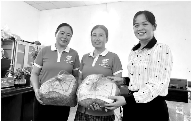
Trứng gà của người dân xã Tân An được tập hợp về Ban quản trị mô hình Chợ số - Nông thôn số để vận chuyển đến tay khách hàng.