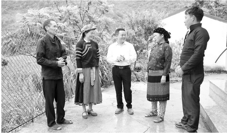
Bí thư Chi bộ thôn Sùng Thái, xã Thắng Mổ Cháng Mí Lúa (thứ 3 từ phải qua trái) nói chuyện với các đảng viên về kỹ năng vận động Nhân dân thực hiện Nghị quyết của Đảng.

Một điểm mới trong đợt kiện toàn lần này là nhiều địa phương mạnh dạn trẻ hóa đội ngũ cấp ủy. Những đảng viên