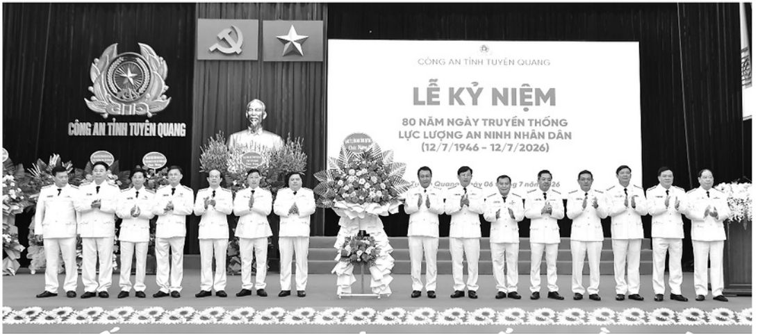
Lãnh đạo Công an tỉnh tặng hoa chúc mừng các đơn vị nghiệp vụ an ninh nhân dịp kỷ niệm 80 năm Ngày truyền thống lực lượng An ninh Nhân dân (12/7/1946 - 12/7/2026).

Trải qua 80 năm, các thế hệ cán bộ, chiến sĩ lực lượng An ninh Công an tỉnh Tuyên Quang luôn âm thầm cống hiến, mưu trí, dũng cảm trên mặt trận bảo vệ an ninh quốc gia. Dù trong chiến tranh hay thời bình, giữa núi rừng kháng chiến hay trên không gian mạng hôm nay, những cán bộ, chiến sĩ an ninh luôn chủ động phòng ngừa, phát hiện, đấu tranh làm thất bại mọi âm mưu, hoạt động xâm phạm an ninh quốc gia ngay từ sớm, từ xa, góp phần giữ vững môi trường hòa bình, ổn định để quê hương phát triển bền vững.