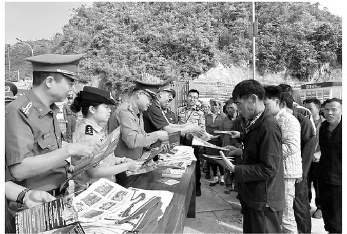
Phòng Quản lý xuất nhập cảnh phối hợp với Công an xã Sơn Vi, Đồn Biên phòng Cửa khẩu Sầm Pun và lực lượng chức năng nước láng giềng tuyên truyền pháp luật cho Nhân dân hai nước Việt Nam - Trung Quốc.

Giữa những dãy núi nối tiếp nhau của vùng biên Xín Mản, những cột