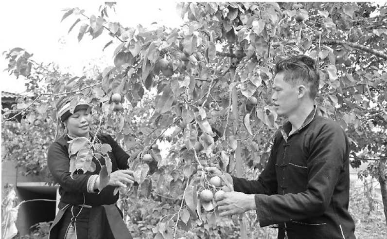
Từ các chính sách dân tộc, nhiều hộ dân ở xã Quân Bạ đầu tư phát triển cây lê đặc sản.

Những năm qua, từ các chương trình, chính sách dân tộc của Đảng và Nhà nước, diện mạo vùng đồng bào dân tộc thiểu số (DTTS) Tuyên Quang đã có nhiều đổi thay rõ nét. Trên nền tảng đó, công tác dân tộc đang tiếp tục đổi mới theo hướng khơi dậy nội lực, phát huy tiềm năng, tạo động lực cho vùng cao phát triển bền vững và giàu bản sắc.