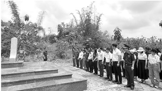
Cán bộ Đồn Biên phòng Cửa khẩu Lộc Thịnh giới thiệu ý nghĩa mốc quốc giới cho cán bộ, công chức đoàn công tác Ủy ban Mặt trận Tổ quốc Việt Nam các xã, phường.

đồng thời tạo điều kiện để Bộ đội Biên phòng nâng cao hiệu quả công tác vận động quần chúng.