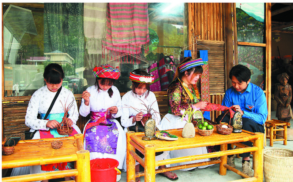
Chính sách dân tộc tạo động lực để đồng bào dân tộc Mông thôn Thèn Pả, xã Lũng Cú gìn giữ nghề thủ, đan lát truyền thống.