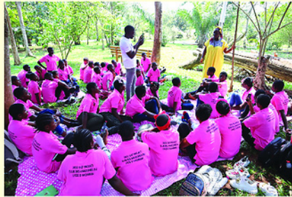
Với phương châm lấy người dân làm trung tâm, GNI đặc biệt quan tâm hỗ trợ phát triển sinh kế, đầu tư cho giáo dục và các hoạt động an sinh xã hội.

TRONG bối cảnh Việt Nam ngày càng mở rộng hợp tác quốc tế vì mục tiêu phát triển bền vững, các tổ chức nước ngoài đã và đang trở thành những đối tác quan trọng, góp phần cải thiện đời sống người dân, đặc biệt ở những vùng còn nhiều khó khăn. Trong đó có tổ chức Good Neighbors International (GNI) của Hàn Quốc, hiện hoạt động tại hơn 50 quốc gia với sứ mệnh xây dựng một thế giới không để ai bị bỏ lại phía sau, mọi người được sống trong môi trường an toàn và phát triển bền vững.