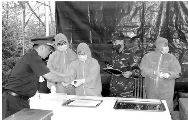
Lực lượng chức năng lấy mẫu hài cốt liệt sĩ tại Nghĩa trang Liệt sĩ Quân Bạ.

Cũng theo bác sĩ Tân, các khâu từ xác định vị trí phần mộ, khai quật, thu nhận mẫu, cho đến niêm phong và lập hồ sơ đều cần phải được thực hiện chặt chẽ, bảo đảm đúng quy định. Tại những nghĩa trang có nhiều mộ liệt sĩ như Nghĩa trang Liệt sĩ Sơn Dương, Nghĩa trang Liệt sĩ tỉnh Tuyên Quang,